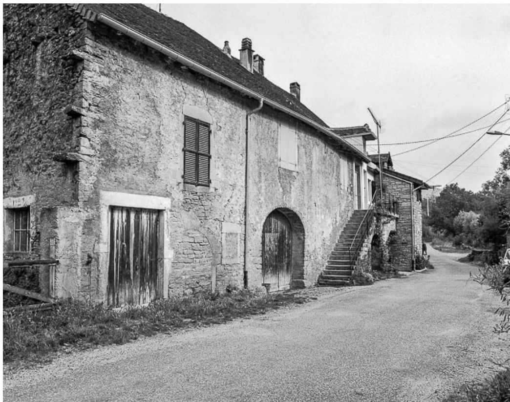
Façade antérieure vue de trois quarts gauche.

39, Macornay rue de l' Huilerie, lieudit : Vaux-sous-Bornay