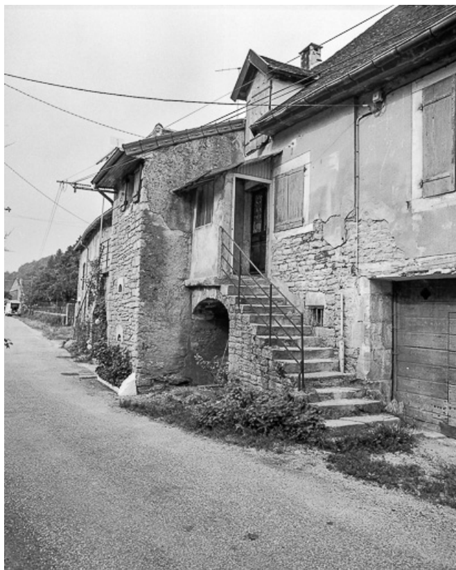
Façade antérieure : escalier à droite de l'avancée.

39, Macornay rue de l' Huilerie, lieudit : Vaux-sous-Bornay