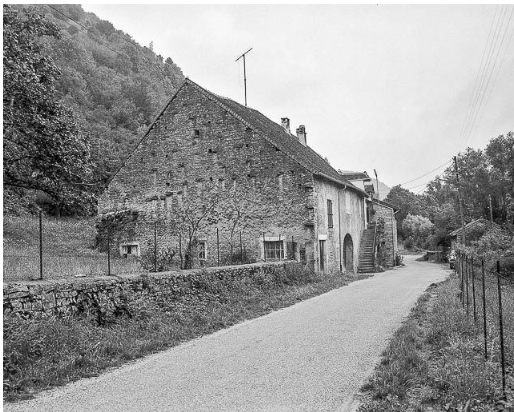
Vue d'ensemble de trois quarts gauche.