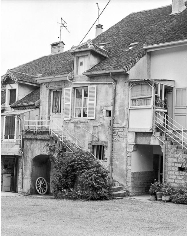
Façade antérieure vue de trois quarts droit.