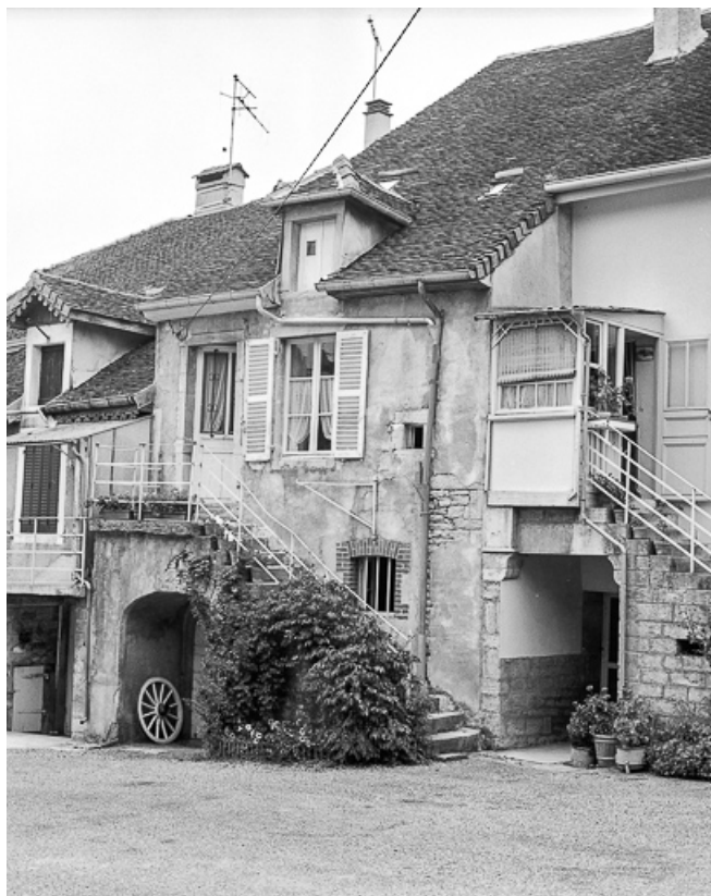
Façade antérieure vue de trois quarts droit.