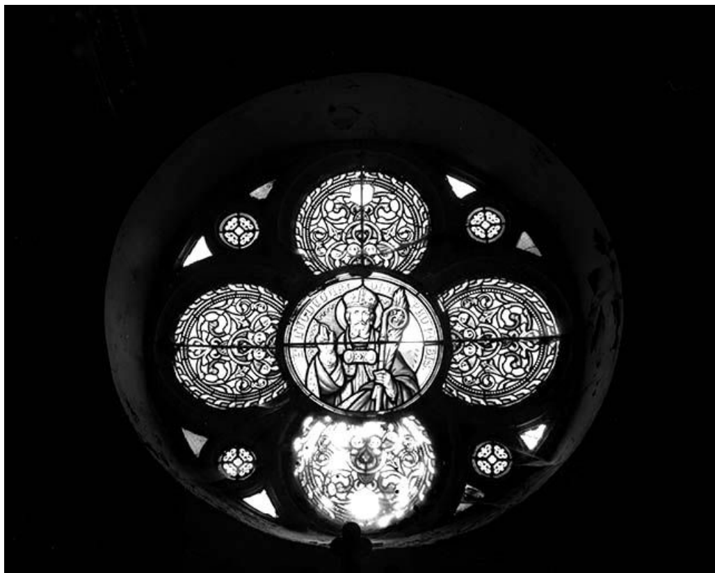
Verrière du chœur : saint Léger.