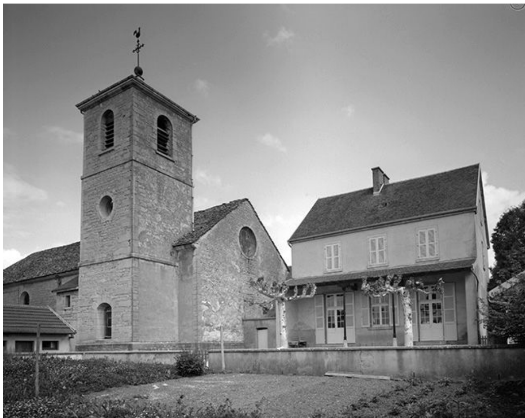
Face droite et chevet.