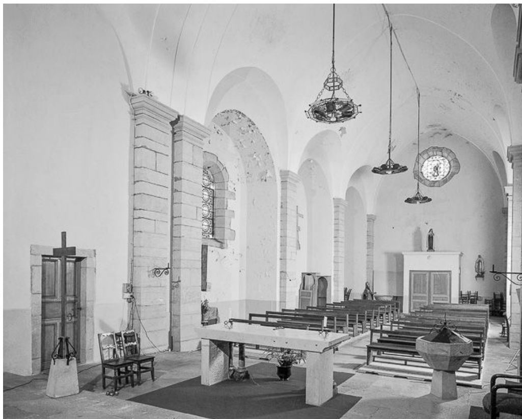
Intérieur : nef, élévation droite vue depuis le chœur.