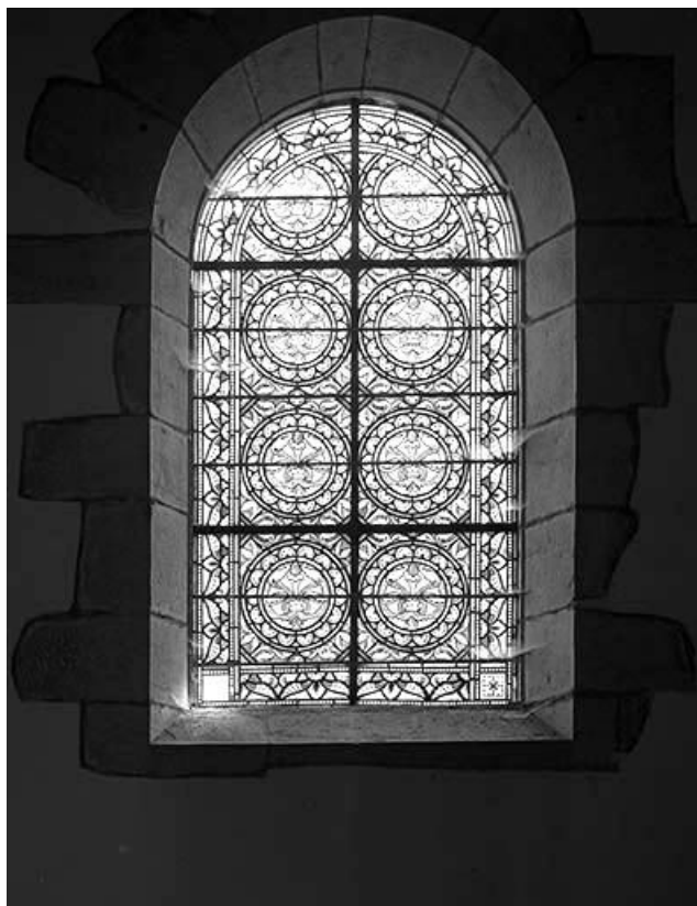
Verrière décorative de la nef.