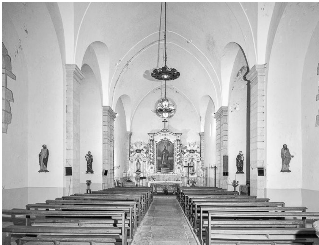
Nef et chœur vus depuis l'entrée.