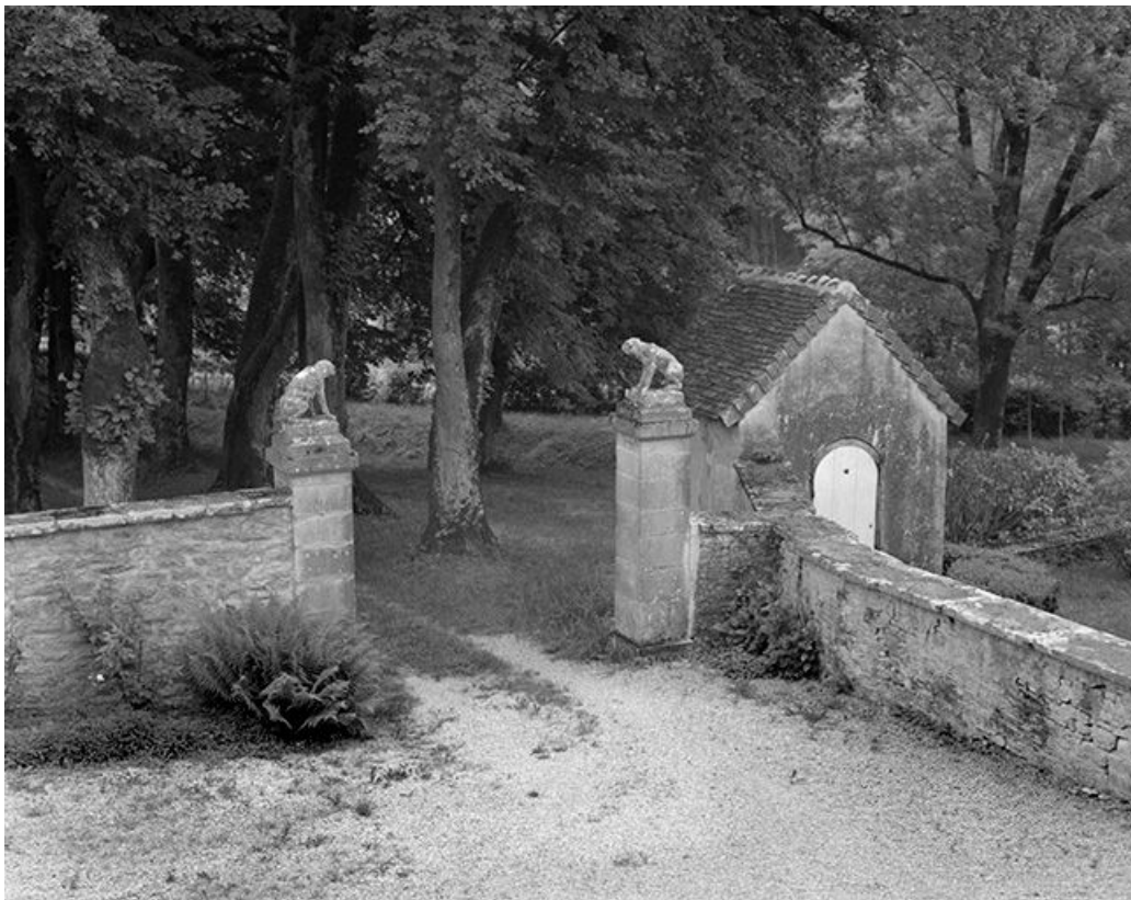
Portail d'entrée de la cour.