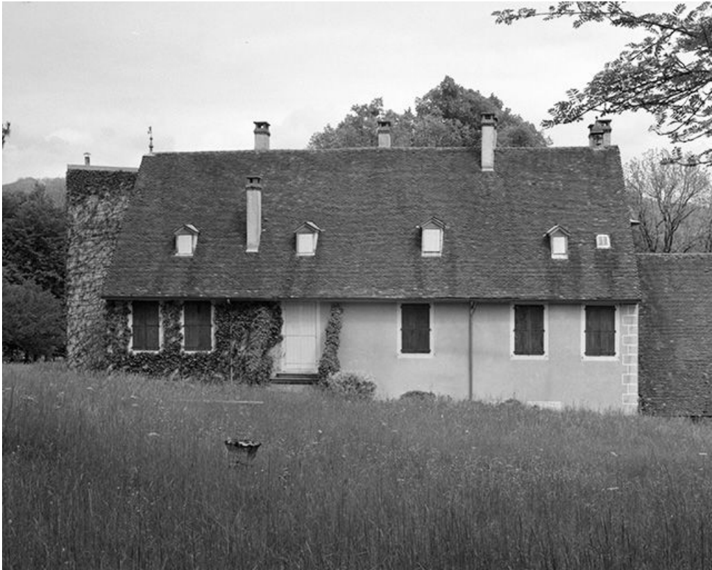
Face postérieure du logis.