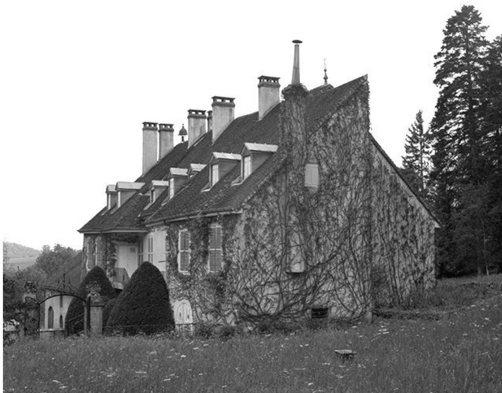
Façade antérieure et face gauche du logis.