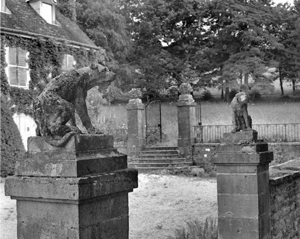
Portail d'entrée : partie supérieure.