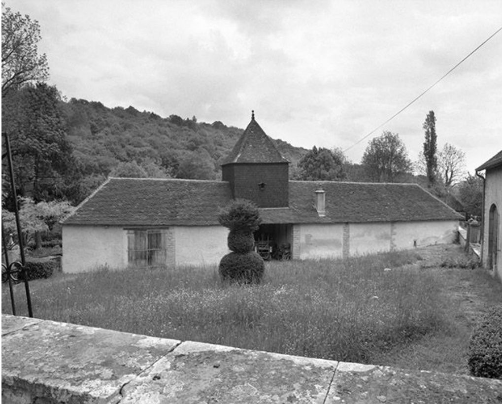
Les communs : façade postérieure.