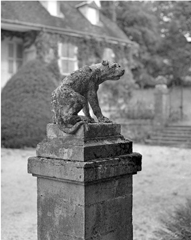
Détail d'un pilier du portail d'entrée de la cour.