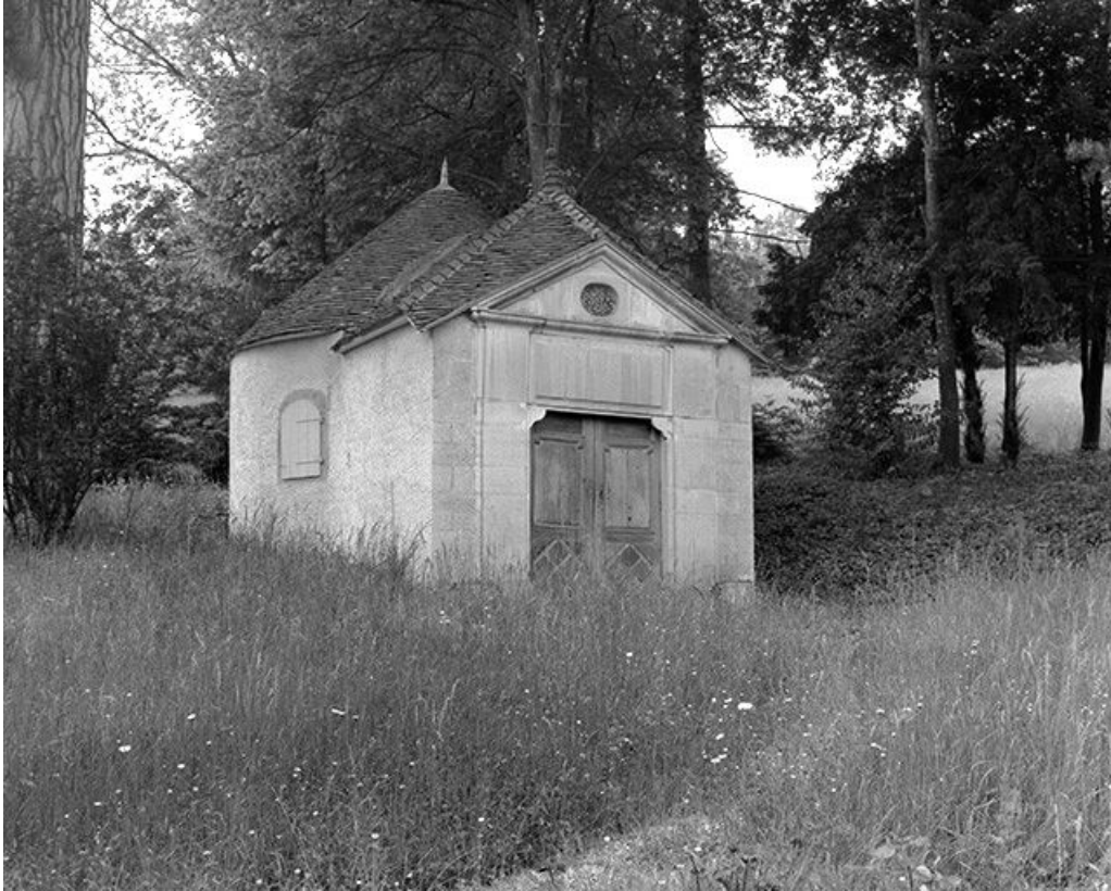
Chapelle dans le parc : vue d'ensemble.