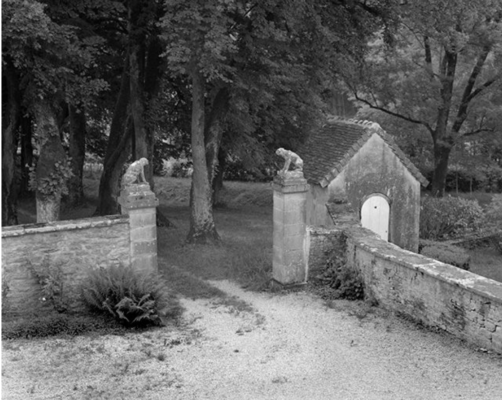
Portail d'entrée de la cour.