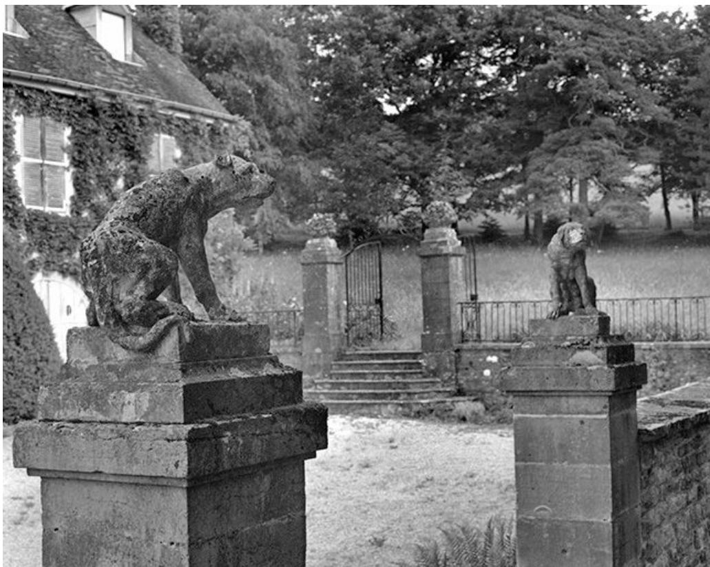
Portail d'entrée : partie supérieure.