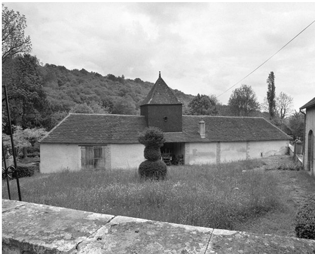
Les communs : façade postérieure.