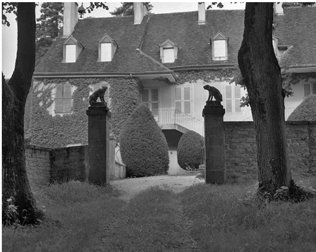
Portail d'entrée de la cour.