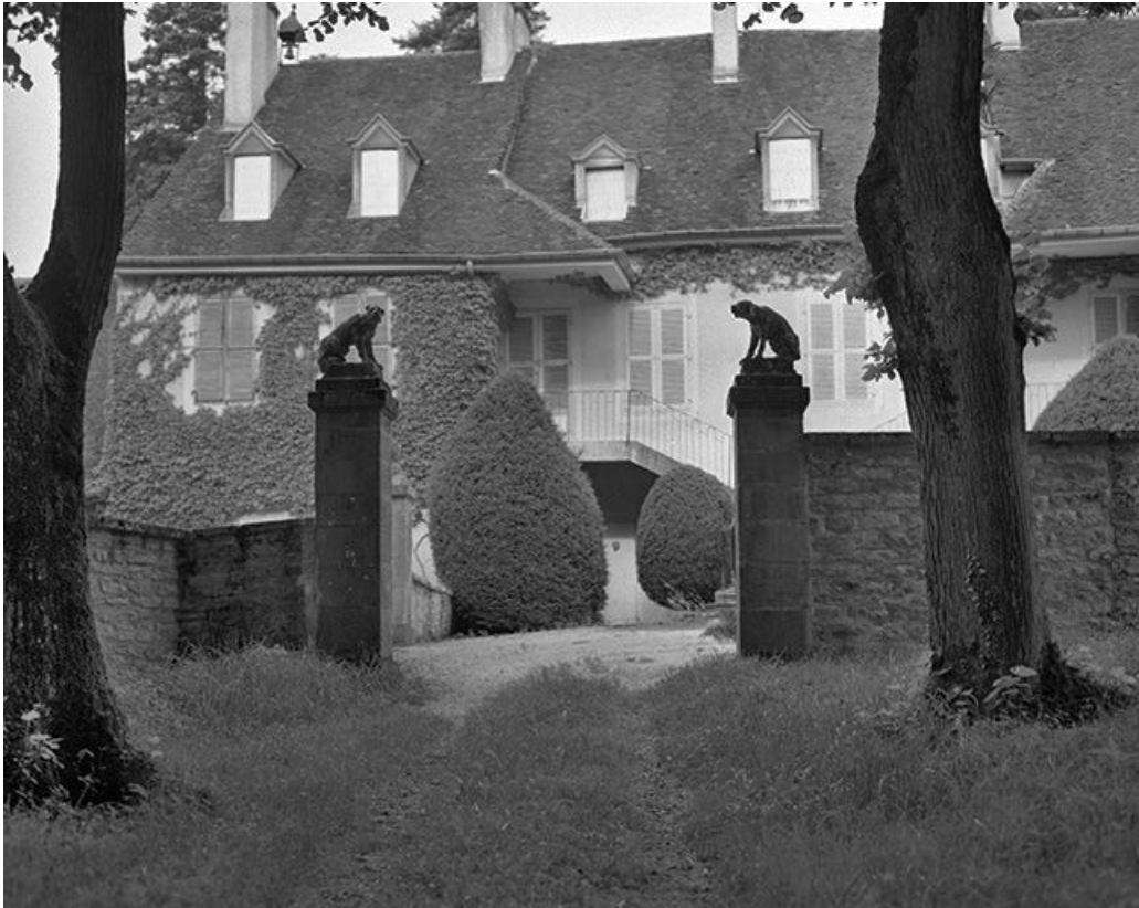
Portail d'entrée de la cour.