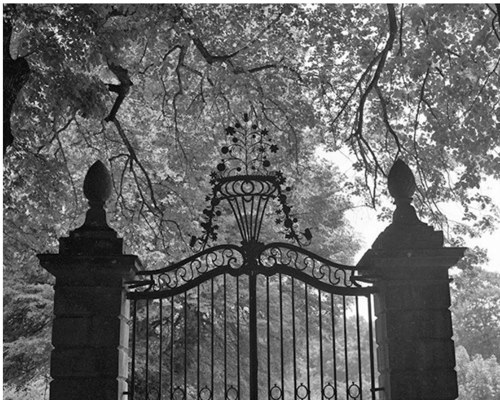
Partie supérieure du portail.