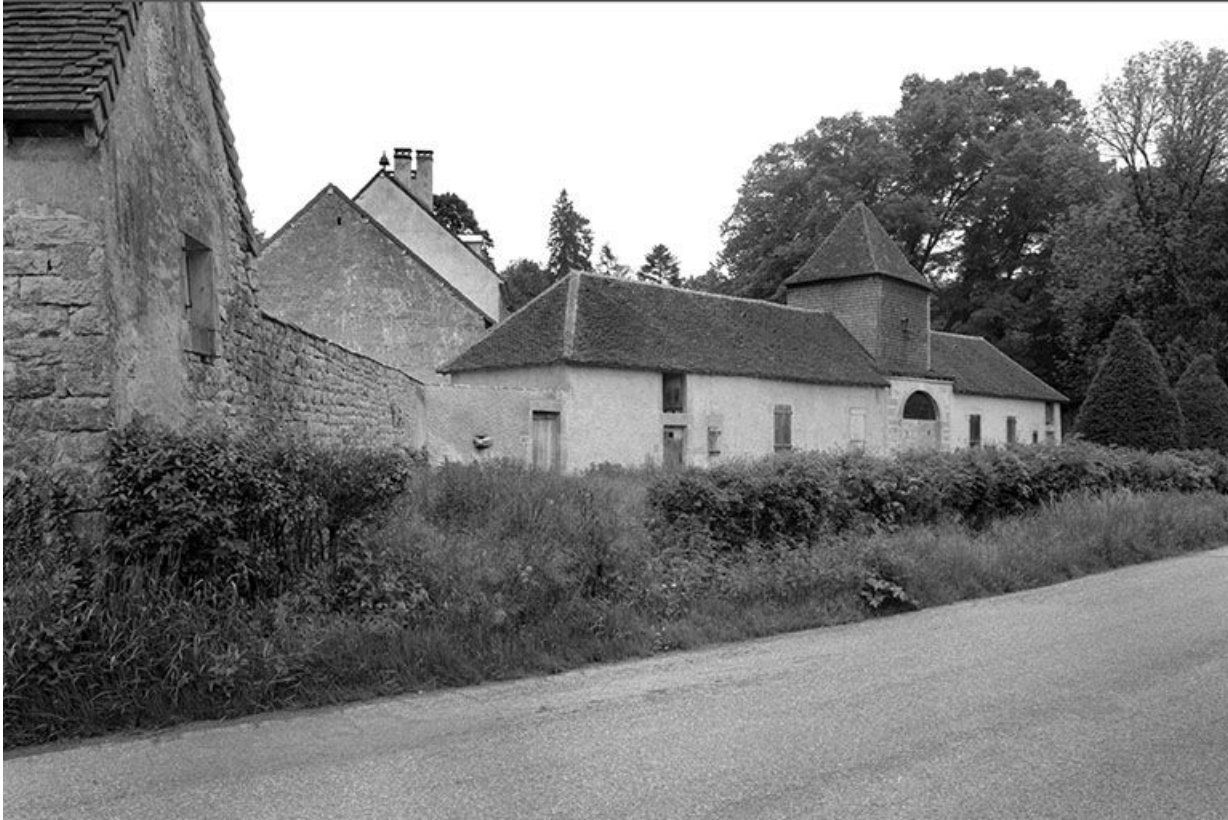
Les communs vus depuis la route.