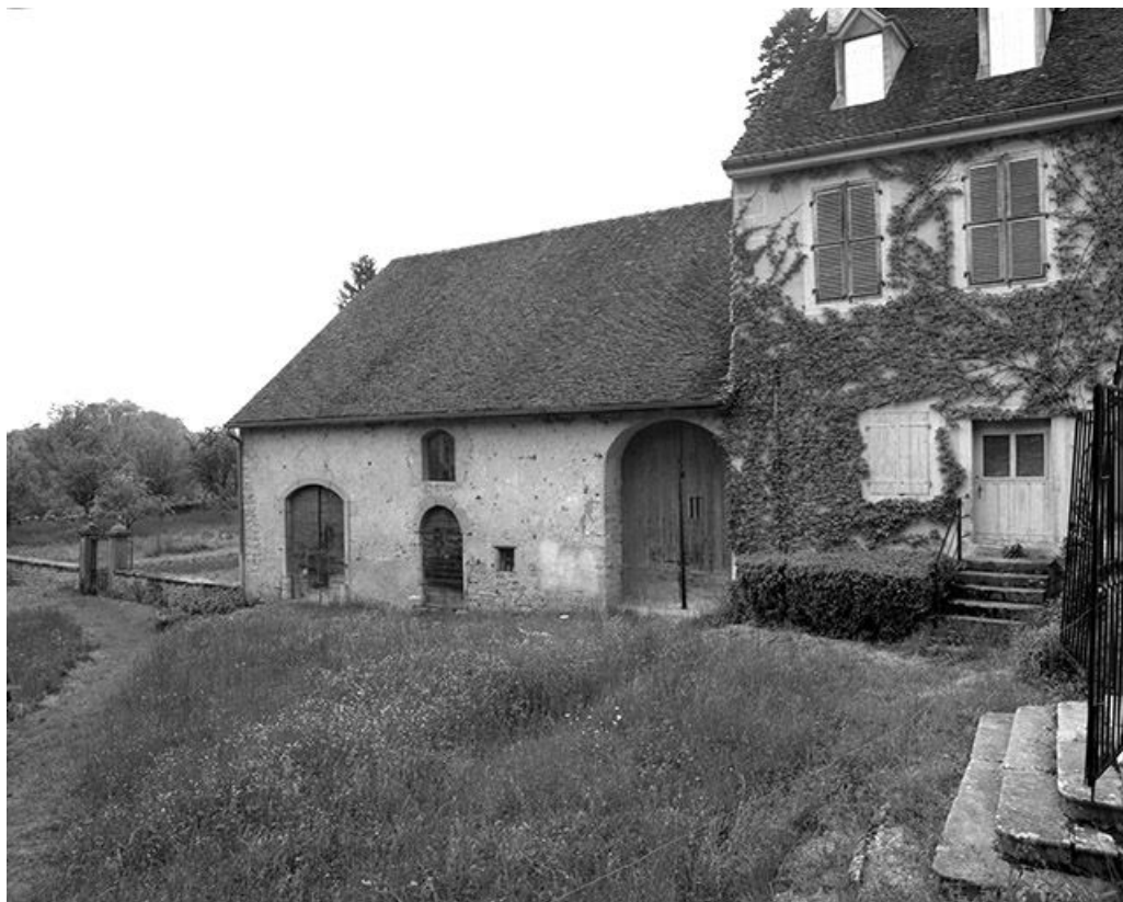
Façade antérieure du logis : partie gauche.