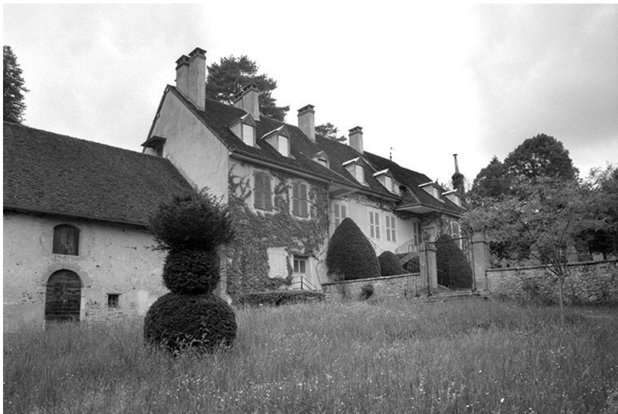
Façade antérieure du logis, vue de trois quarts.