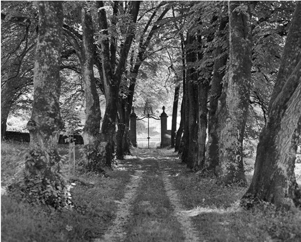
L'allée menant à la demeure.