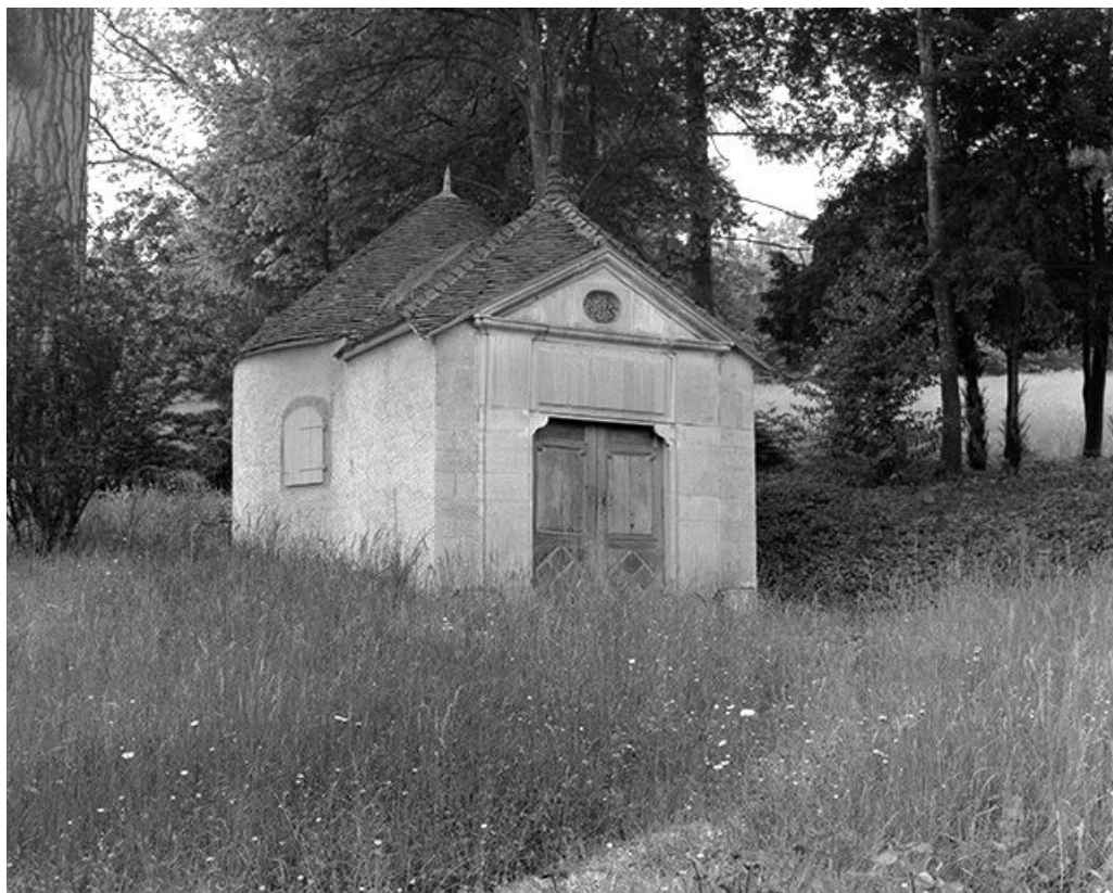
Chapelle dans le parc : vue d'ensemble.