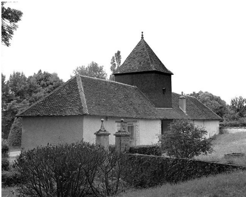
Les communs : façade postérieure vue de trois-quarts.