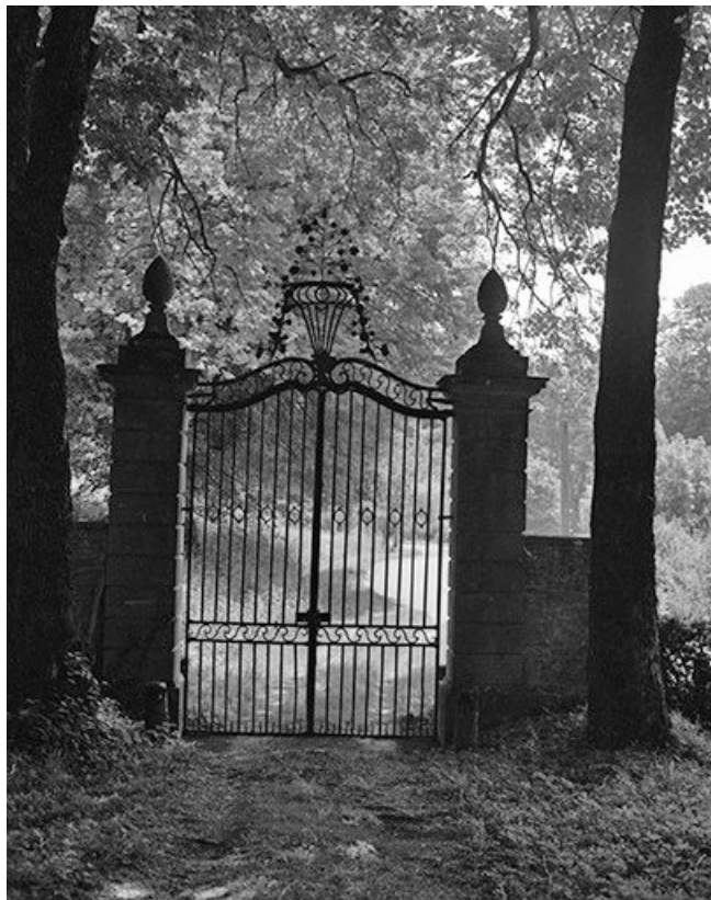
Le portail d'entrée.