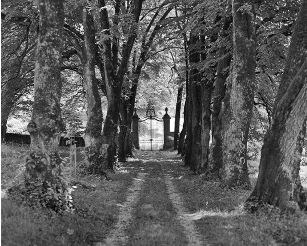
L'allée menant à la demeure.