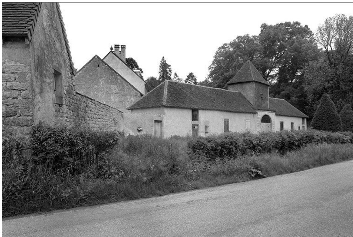
Les communs vus depuis la route.