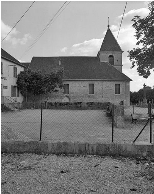
Extérieur : face gauche.