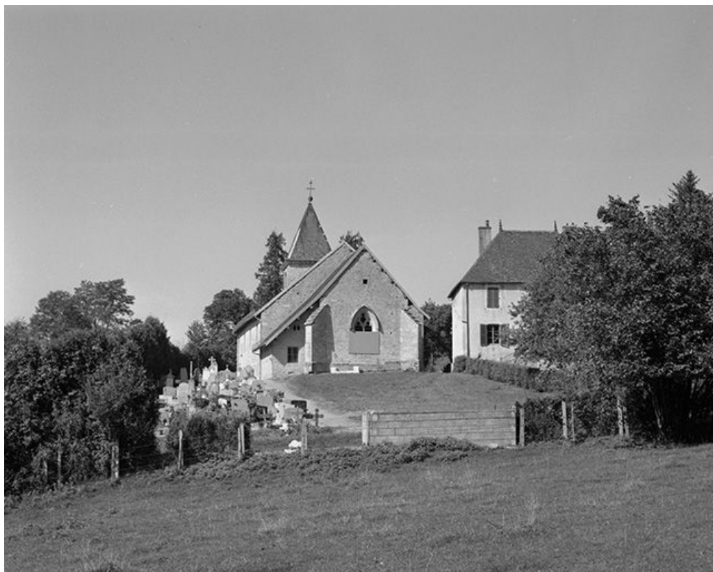
Extérieur : chevet.