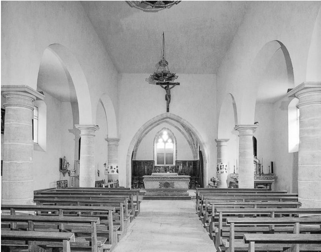
Intérieur : nef et chœur vus depuis l'entrée.