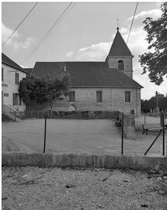
Extérieur : face gauche.