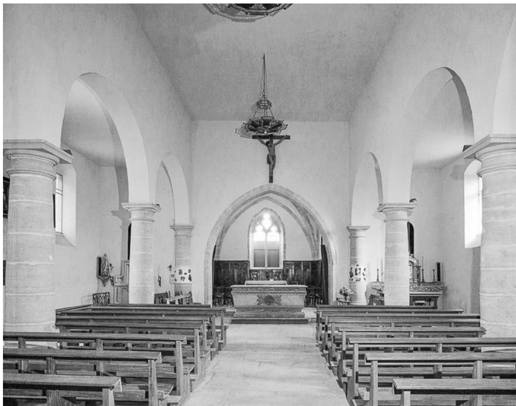
Intérieur : nef et chœur vus depuis l'entrée.