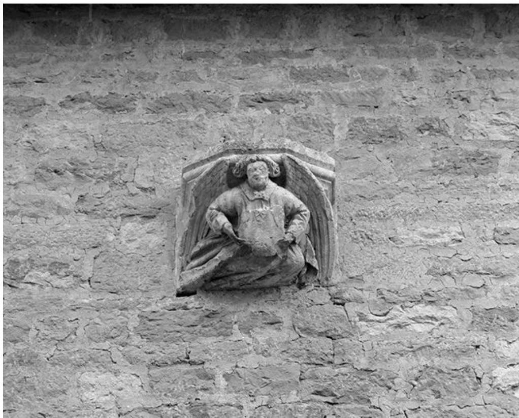
Façade antérieure : console gauche.