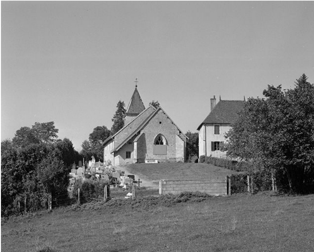
Extérieur : chevet.