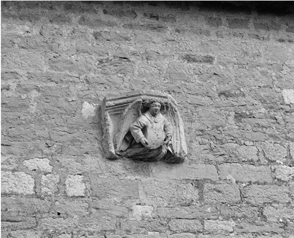
Façade antérieure : console droite.