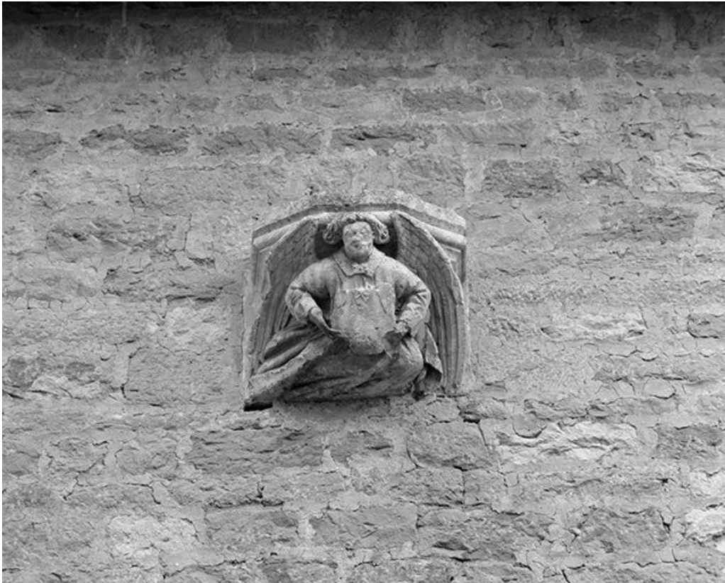
Façade antérieure : console gauche.