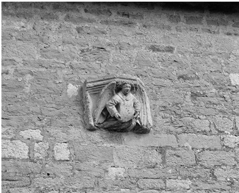
Façade antérieure : console droite.