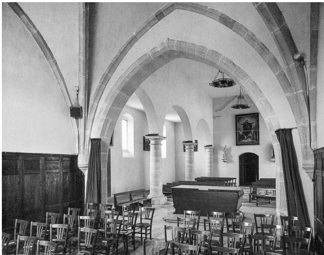
Intérieur : élévation droite de la nef.