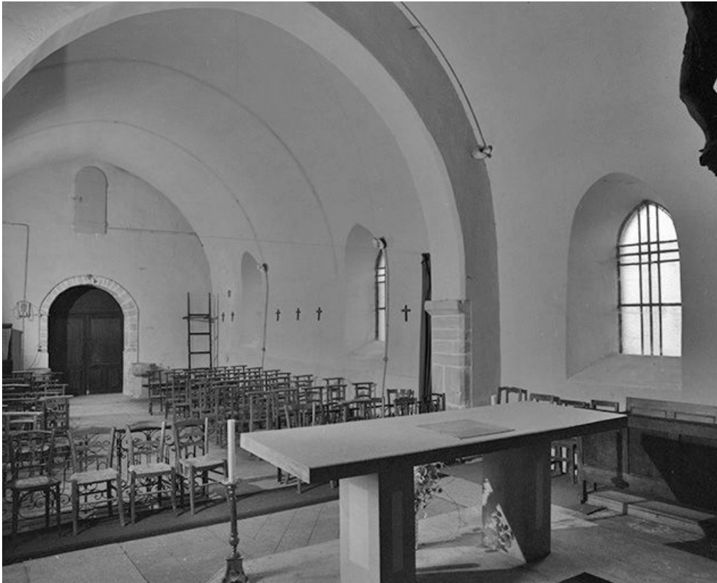
Intérieur : élévation gauche.

39, Courlans route de Chilly-le-Vignoble