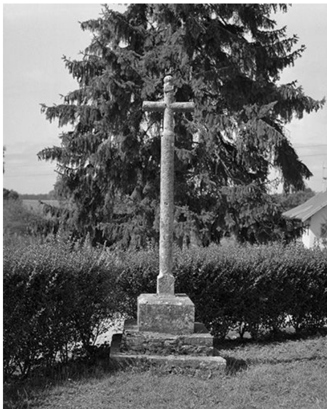
Croix de cimetière : vue générale.

39, Courlans route de Chilly-le-Vignoble