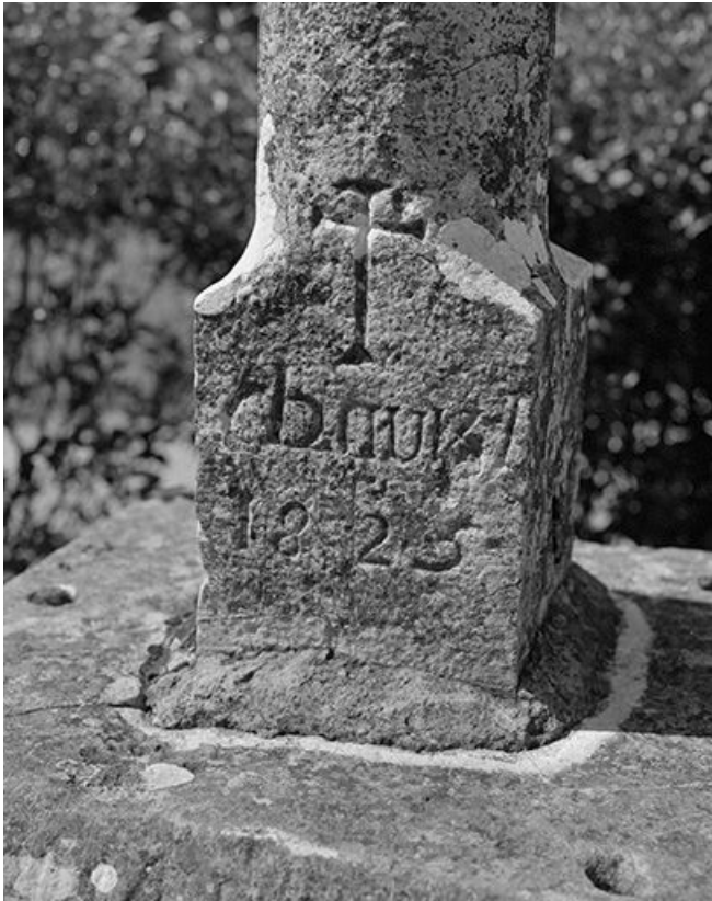
Croix de cimetière : socle.

39, Courlans route de Chilly-le-Vignoble