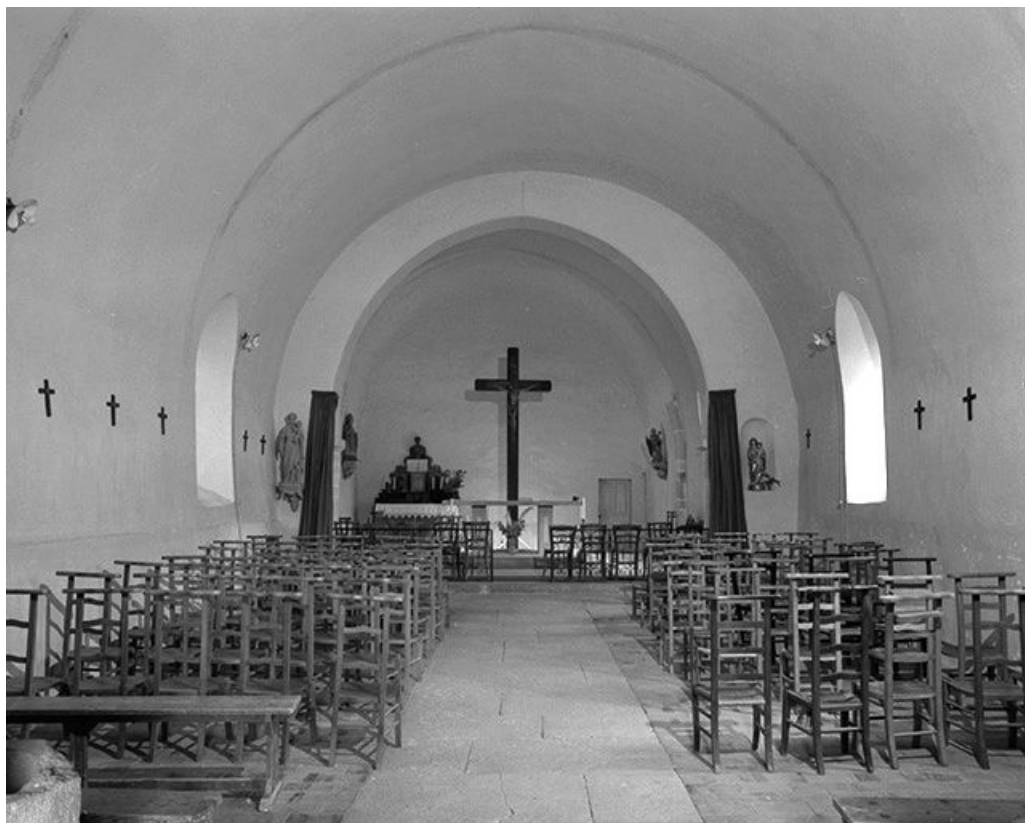
Intérieur : nef et chœur vus depuis l'entrée.

39, Courlans route de Chilly-le-Vignoble