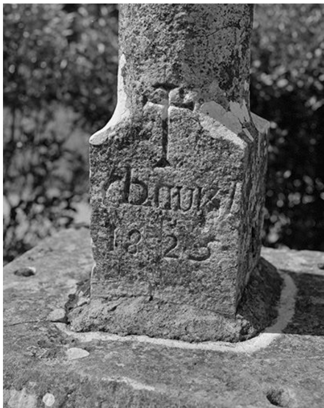
Croix de cimetière : socle.

39, Courlans route de Chilly-le-Vignoble