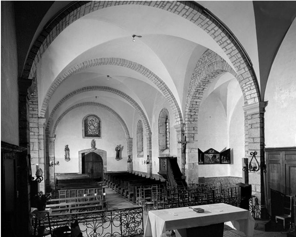
Elévation gauche vue depuis le chœur.