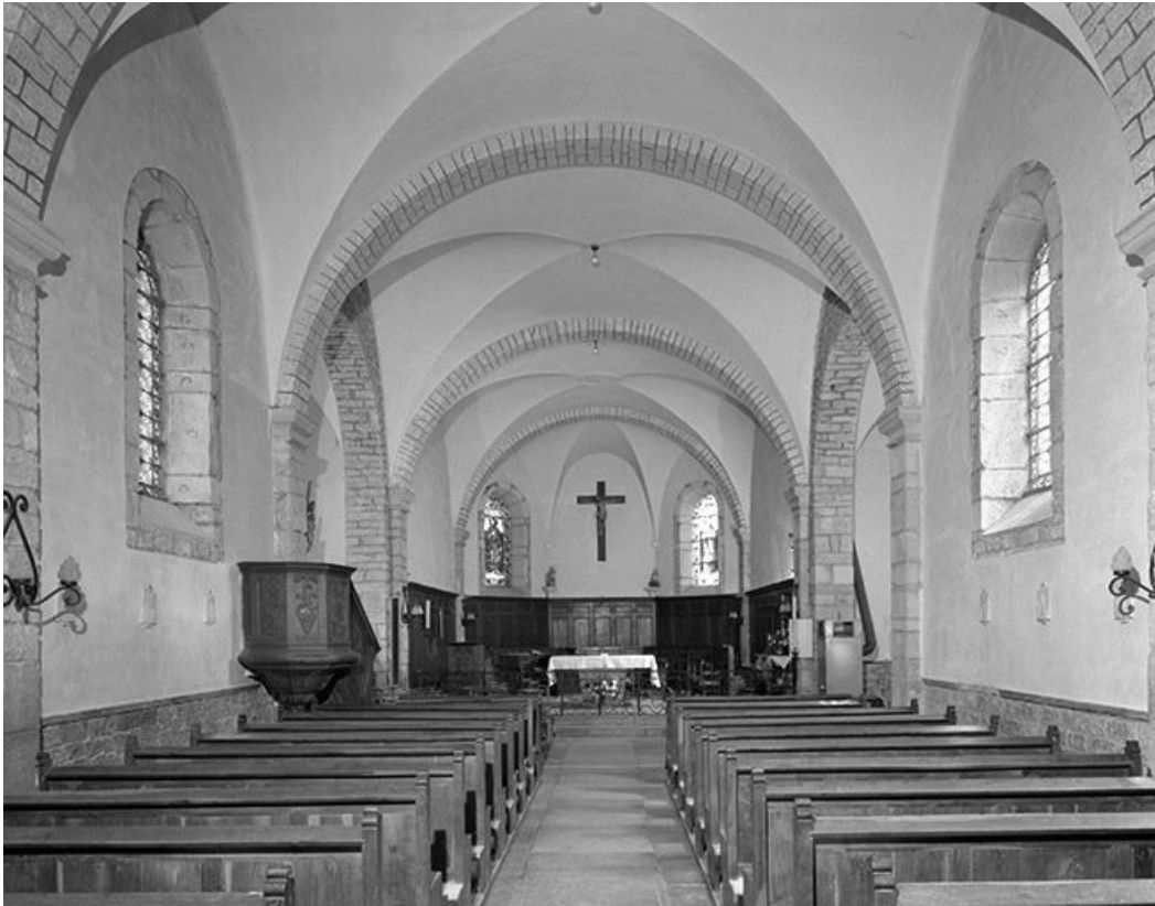
Nef vue depuis l'entrée.