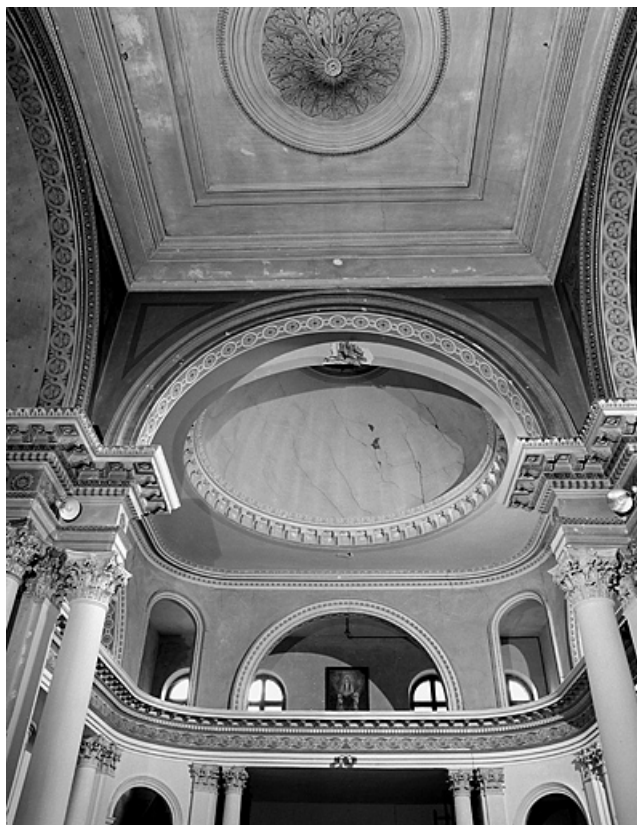
Chapelle II, vue de la tribune depuis le chœur.

39, Lons-le-Saunier, lieudit : Côte de Montciel