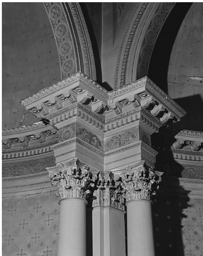
Chapelle II, détail de l'entablement du chœur.

39, Lons-le-Saunier, lieudit : Côte de Montciel