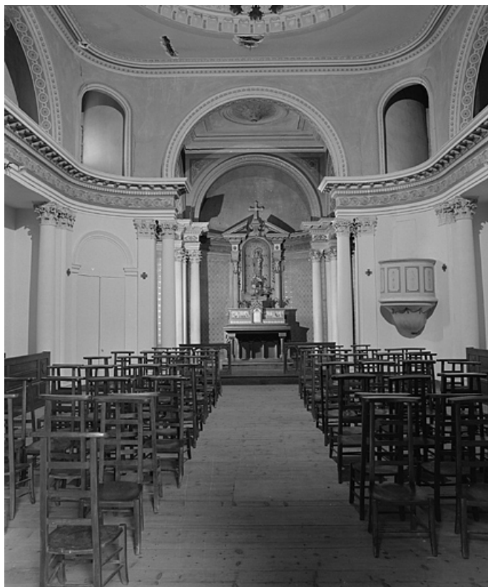
Chapelle II, vaisseau vu depuis l'entrée.

39, Lons-le-Saunier, lieudit : Côte de Montciel