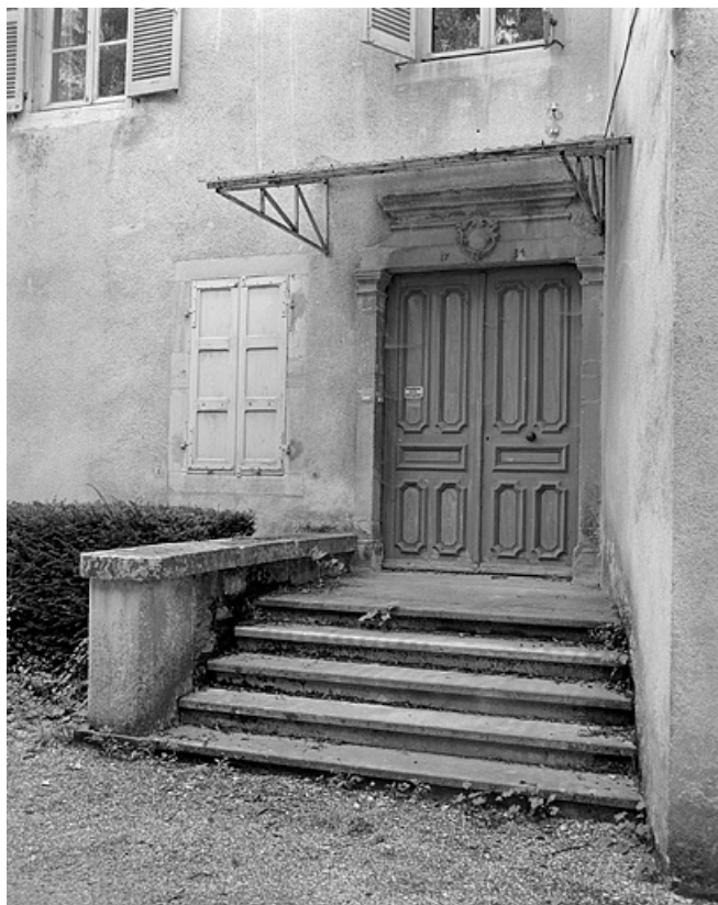
Façade latérale du bâtiment A, porte d'entrée datée 1734.

39, Lons-le-Saunier, lieudit : Côte de Montciel