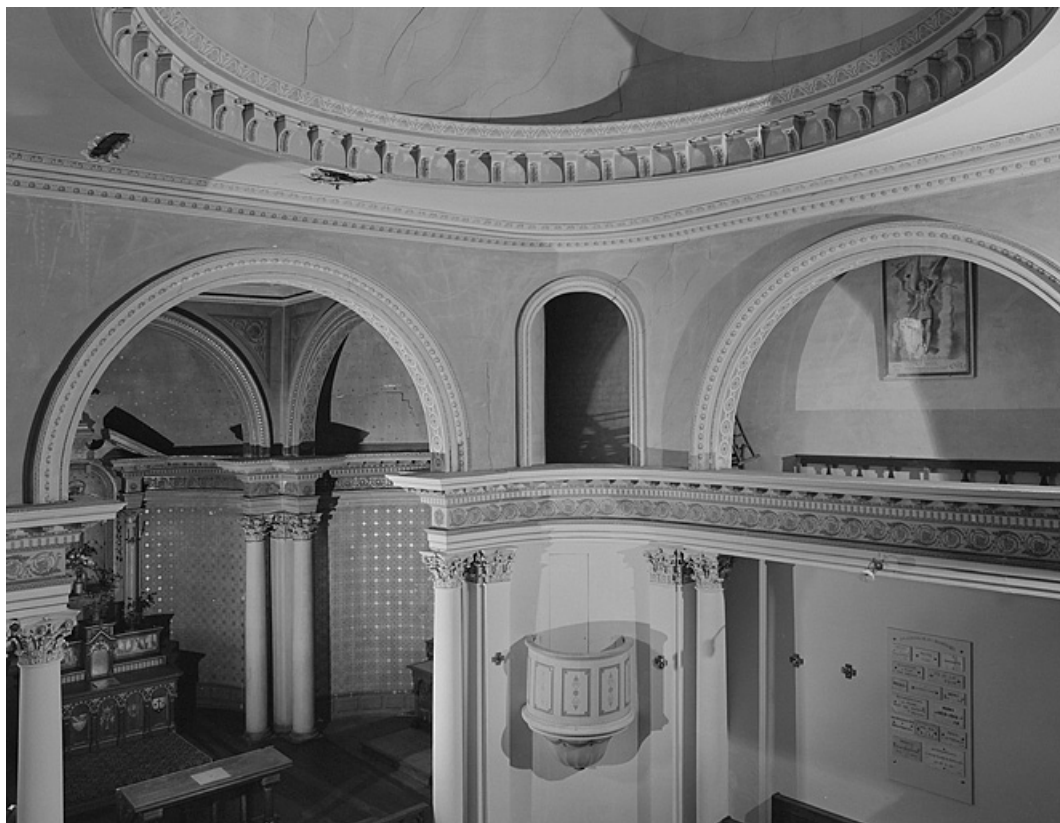
Chapelle II, partie droite du vaisseau vue depuis la tribune.

39, Lons-le-Saunier, lieudit : Côte de Montciel