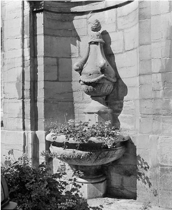
Détail de la vasque et de la borne.