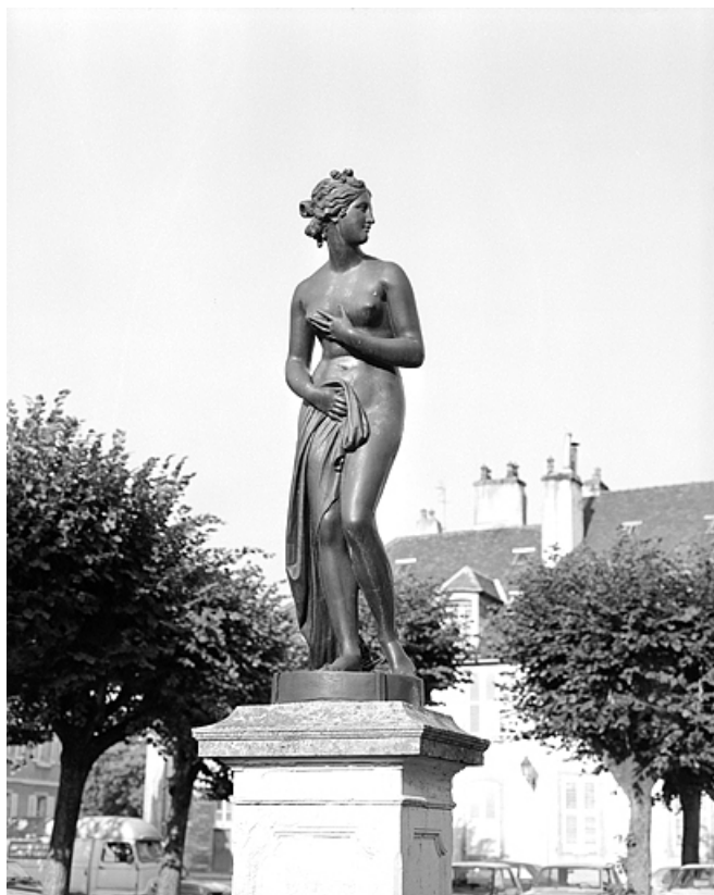
Statue déplacée, ornant autrefois la fontaine.