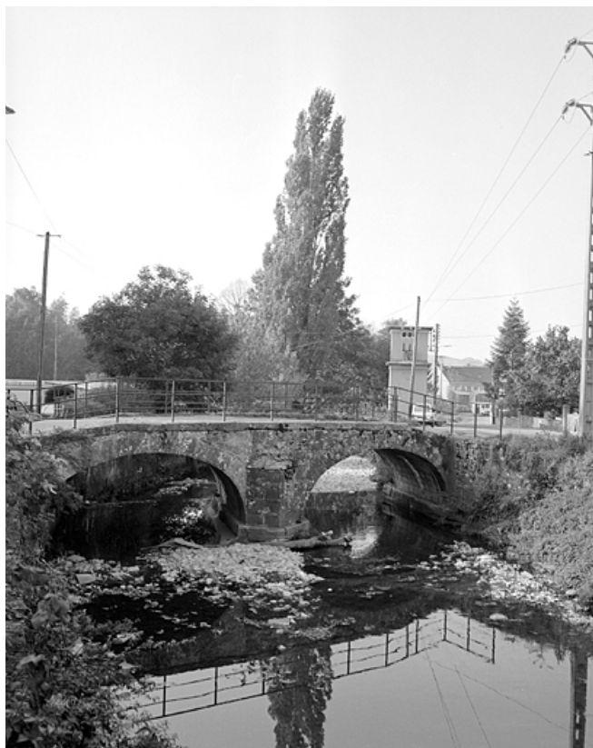
Vue du pont en amont.