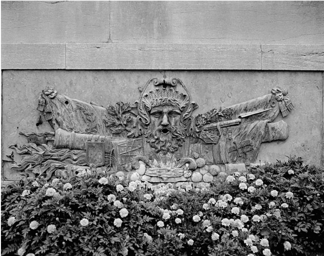
Ornement des bassins de la fontaine portant la date 1828 en bas à droite.