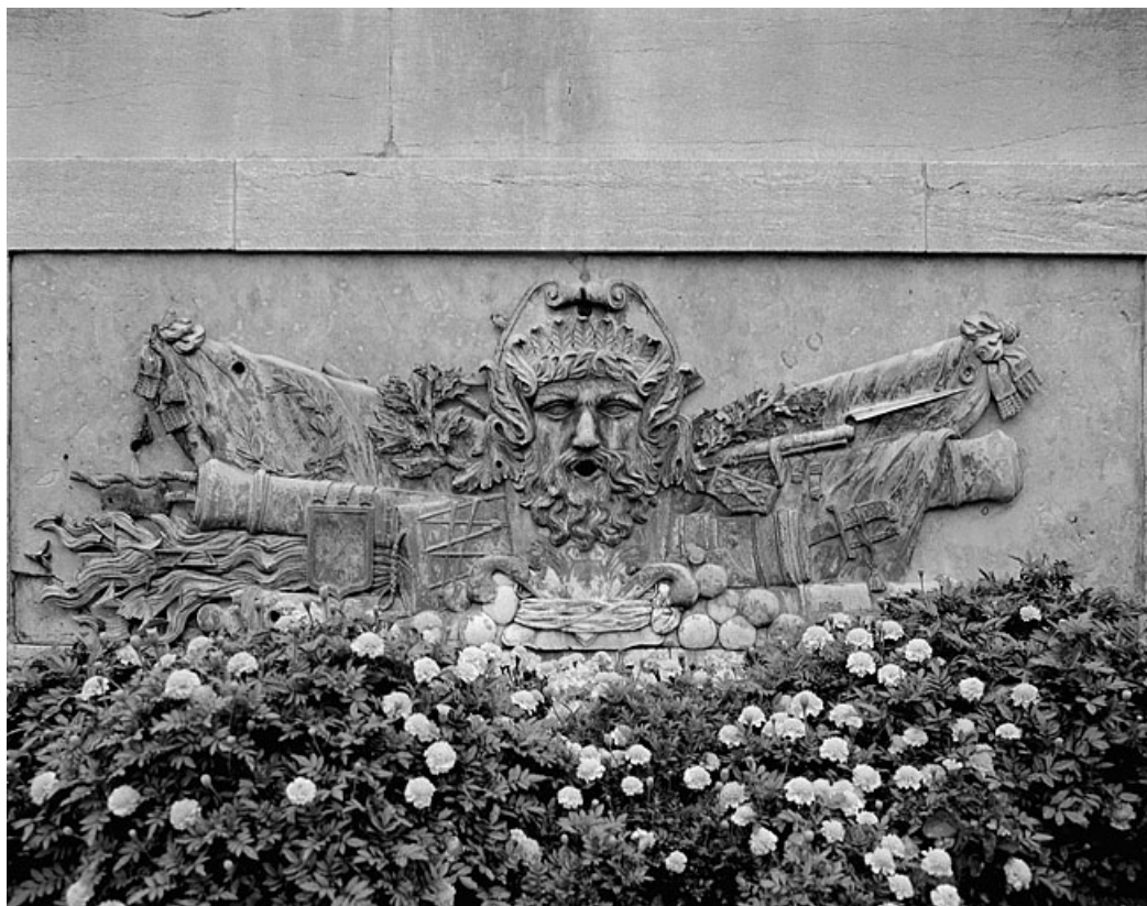
Ornement des bassins de la fontaine portant la date 1828 en bas à droite.