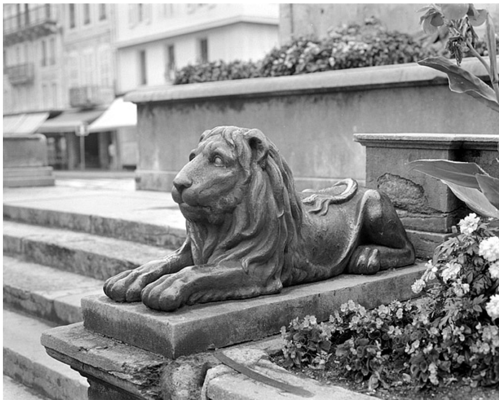
Lion couché encadrant les escaliers d'accès à la fontaine.