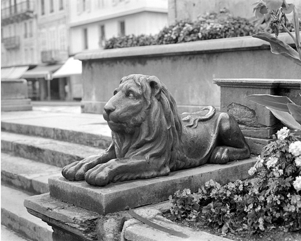
Lion couché encadrant les escaliers d'accès à la fontaine.