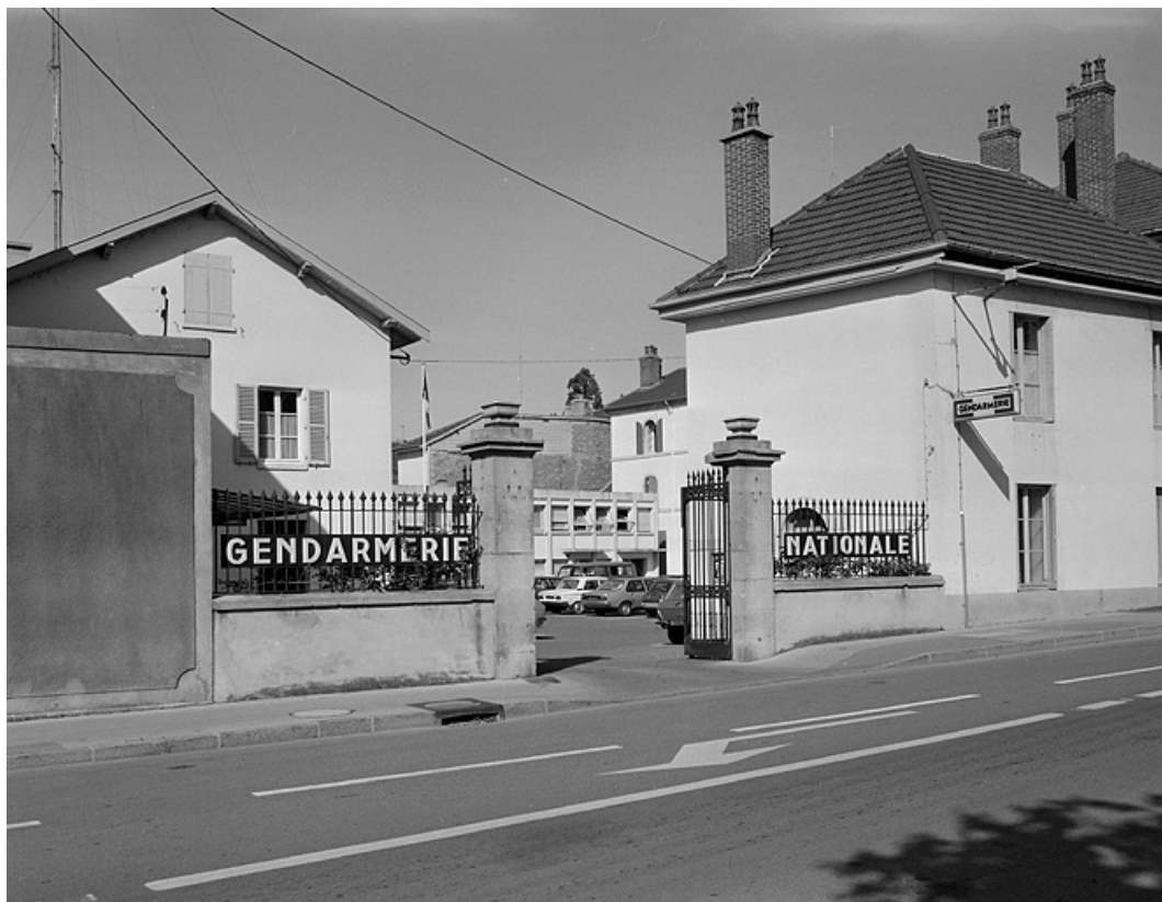
Portail d'accès à la cour donnant rue de la Chevalerie.

39, Lons-le-Saunier place de l' Ancien Collège