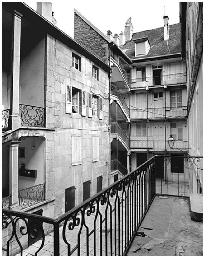
Vue de la cour et de la façade postérieure avec son escalier.