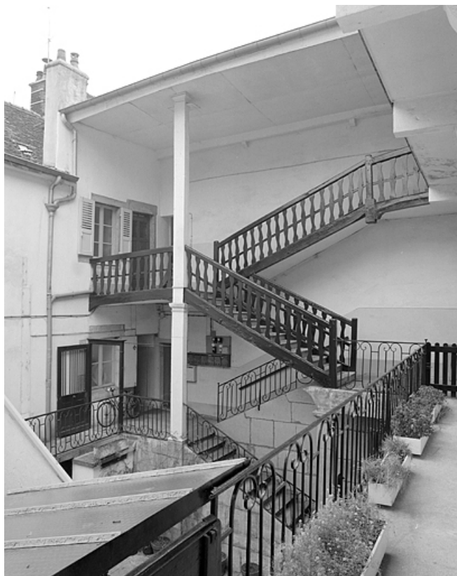
Escalier dans la cour.