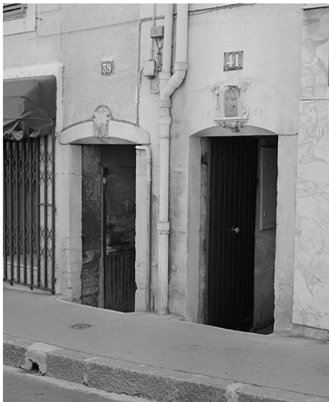
Façade antérieure, porte d'entrée portant la date 1753, comme la porte voisine. 39, Lons-le-Saunier, 39 rue Saint-Désiré