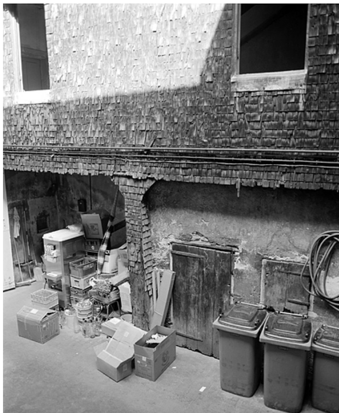
Escalier dans la cour, partie inférieure.

39, Lons-le-Saunier, 15 rue Saint-Désiré