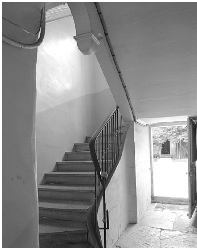
Escalier vu depuis le couloir.