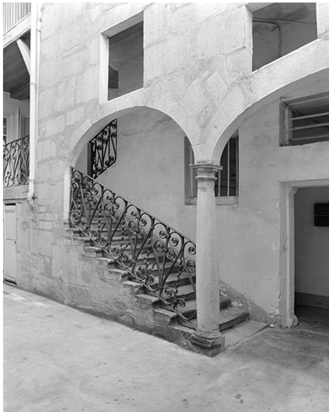
Départ de l'escalier s'ouvrant sur la cour.