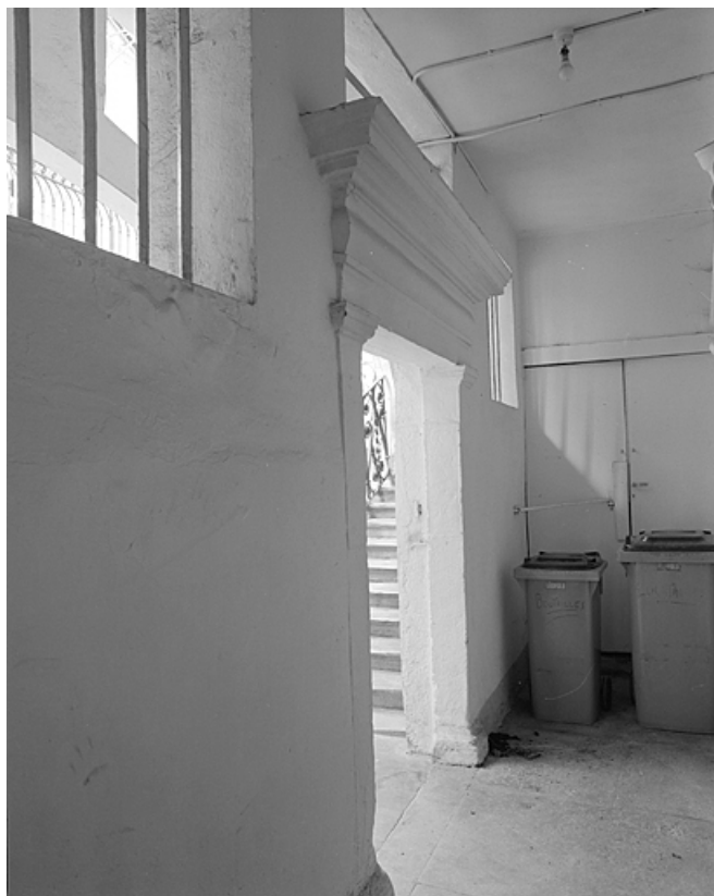
Porte de communication entre le couloir et la cour.