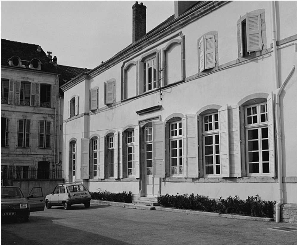
Façade postérieure, détail.

39, Lons-le-Saunier, 7 rue des Cordeliers