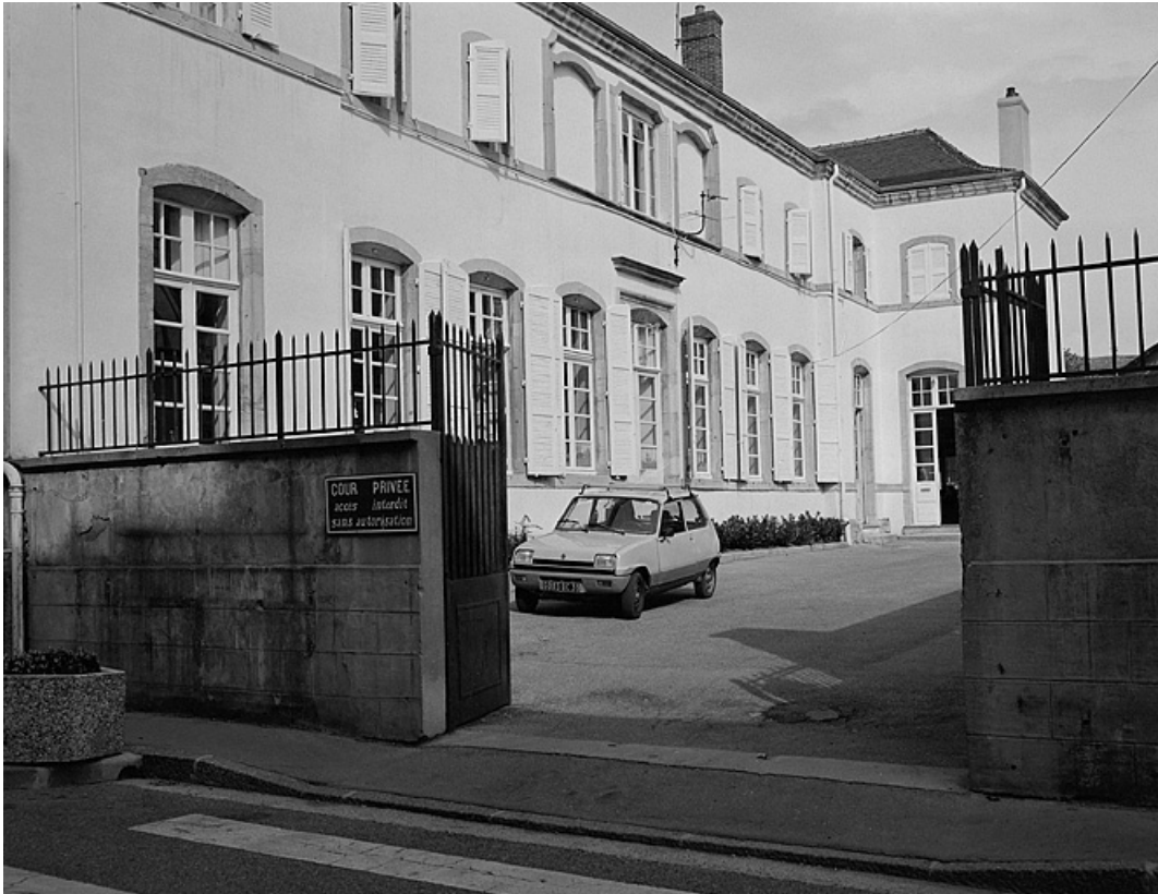
Façade postérieure, vue générale.

39, Lons-le-Saunier, 7 rue des Cordeliers