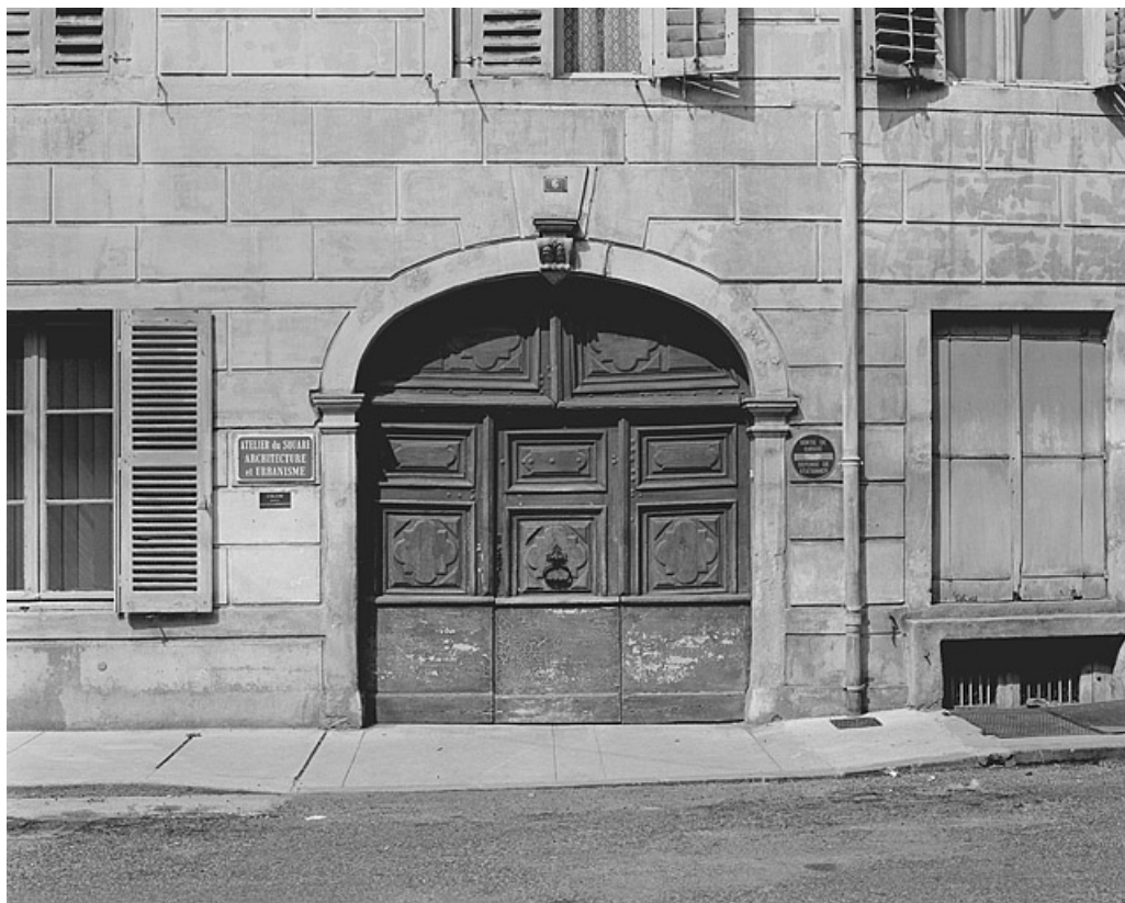
Portail de la façade antérieure.