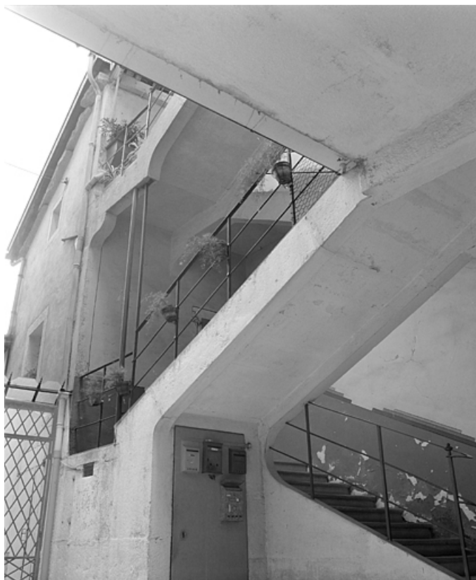
L'escalier ouvrant sur la cour.