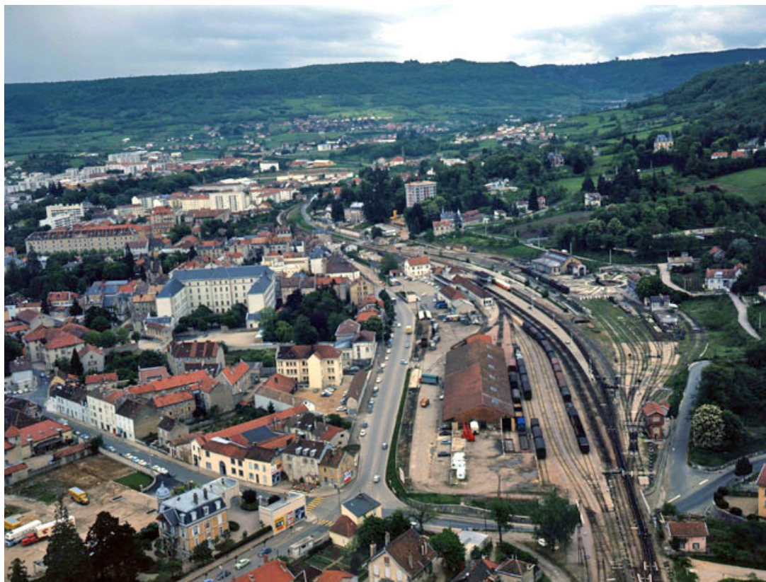
Vue aérienne en 1967 (la gare et le boulevard Gambetta. 39, Lons-le-Saunier