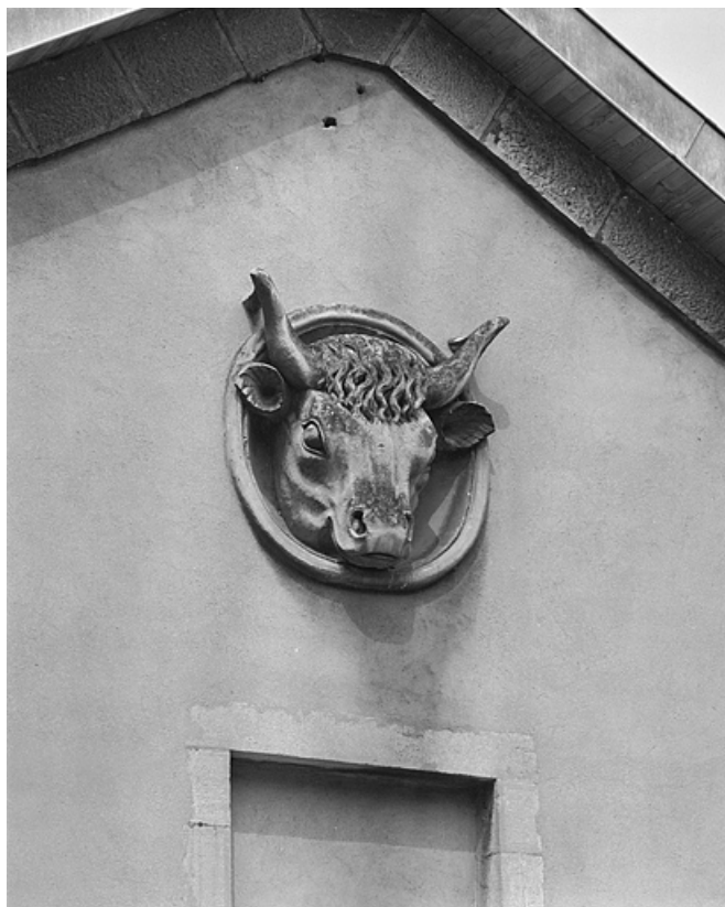
Médaille ornant la façade antérieure de la halle.

39, Lons-le-Saunier rue du Capitaine Dumas