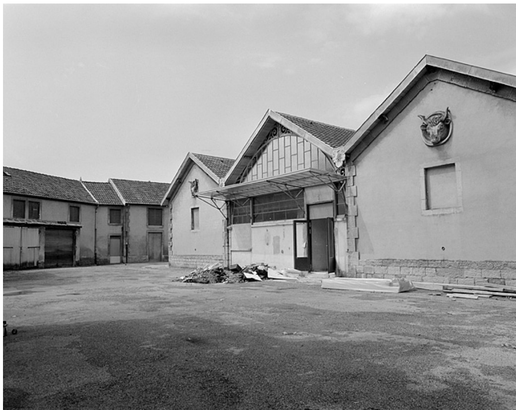
Vue de la cour devant la halle.

39, Lons-le-Saunier rue du Capitaine Dumas