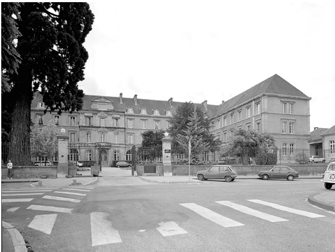
Vue du corps de bâtiment central et de l'aile en retour droite.