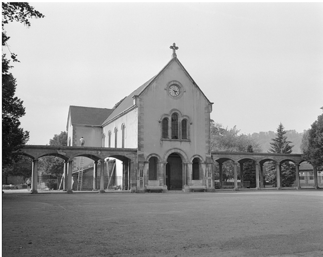
Façade antérieure de la chapelle et portique.