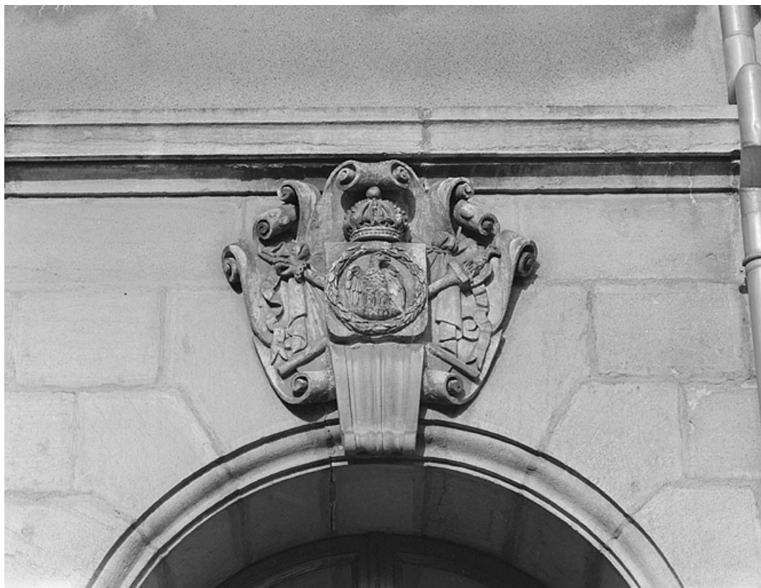
Aigle impériale ornant le rez-de-chaussée de la façade antérieure.