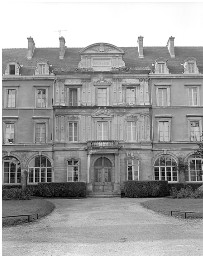
Façade antérieure, avant-corps central.