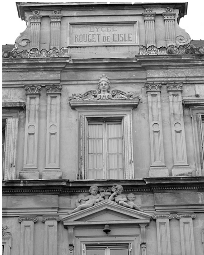
Façade antérieure, détail de l'avant-corps central.