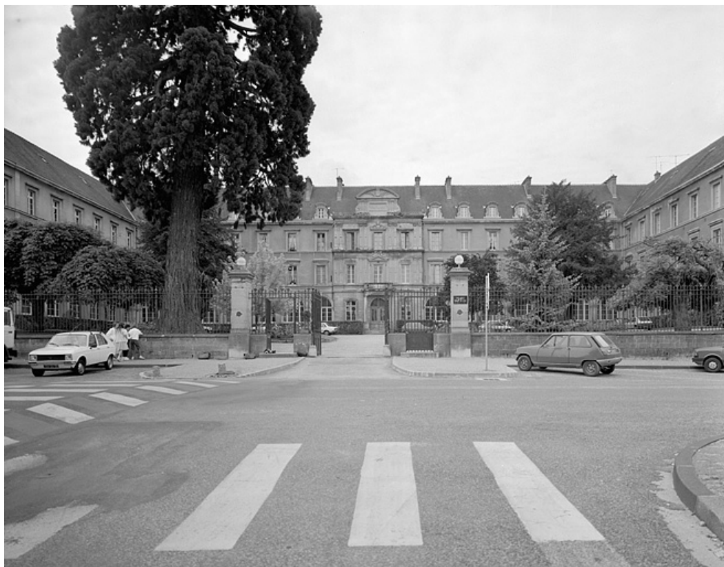
Vue d'ensemble sur la cour d'entrée.