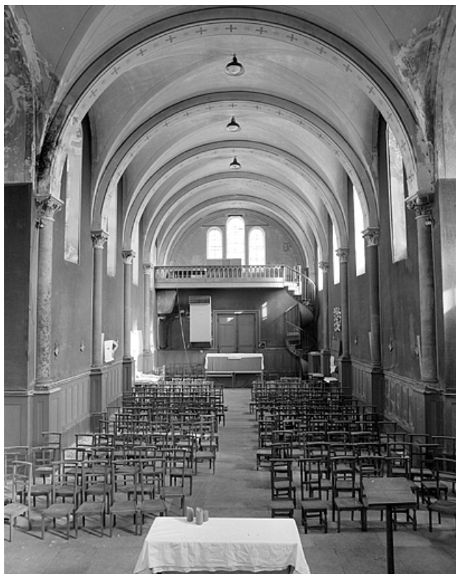
Vue intérieure de la chapelle.