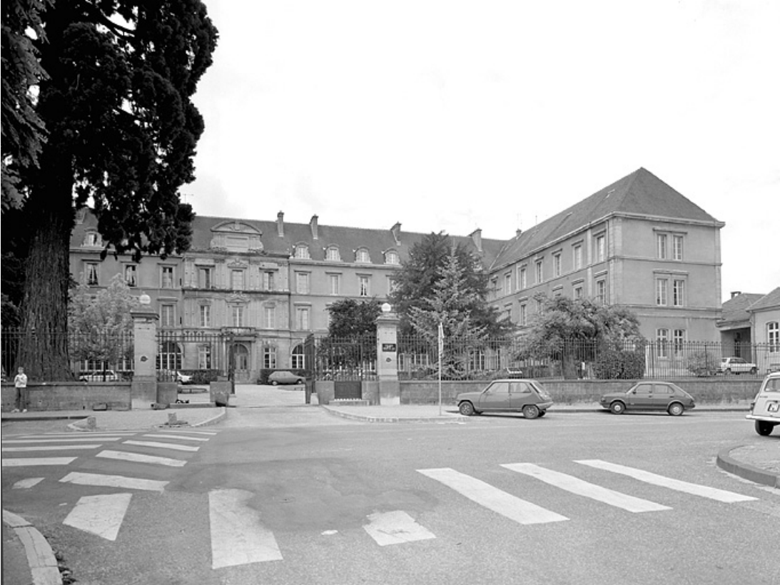
Vue du corps de bâtiment central et de l'aile en retour droite.