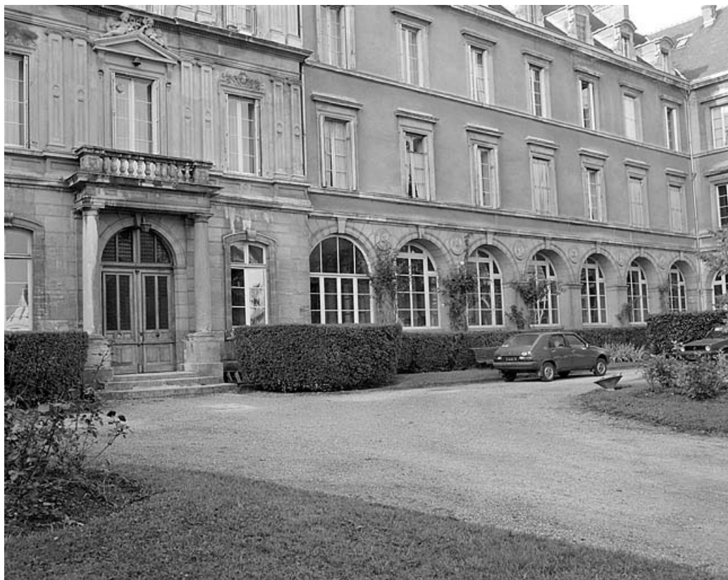
Façade antérieure, partie droite.