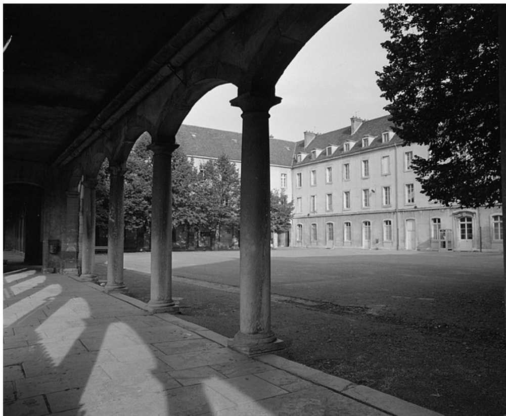
Vue de la cour depuis le portique encadrant la façade antérieure de la chapelle.