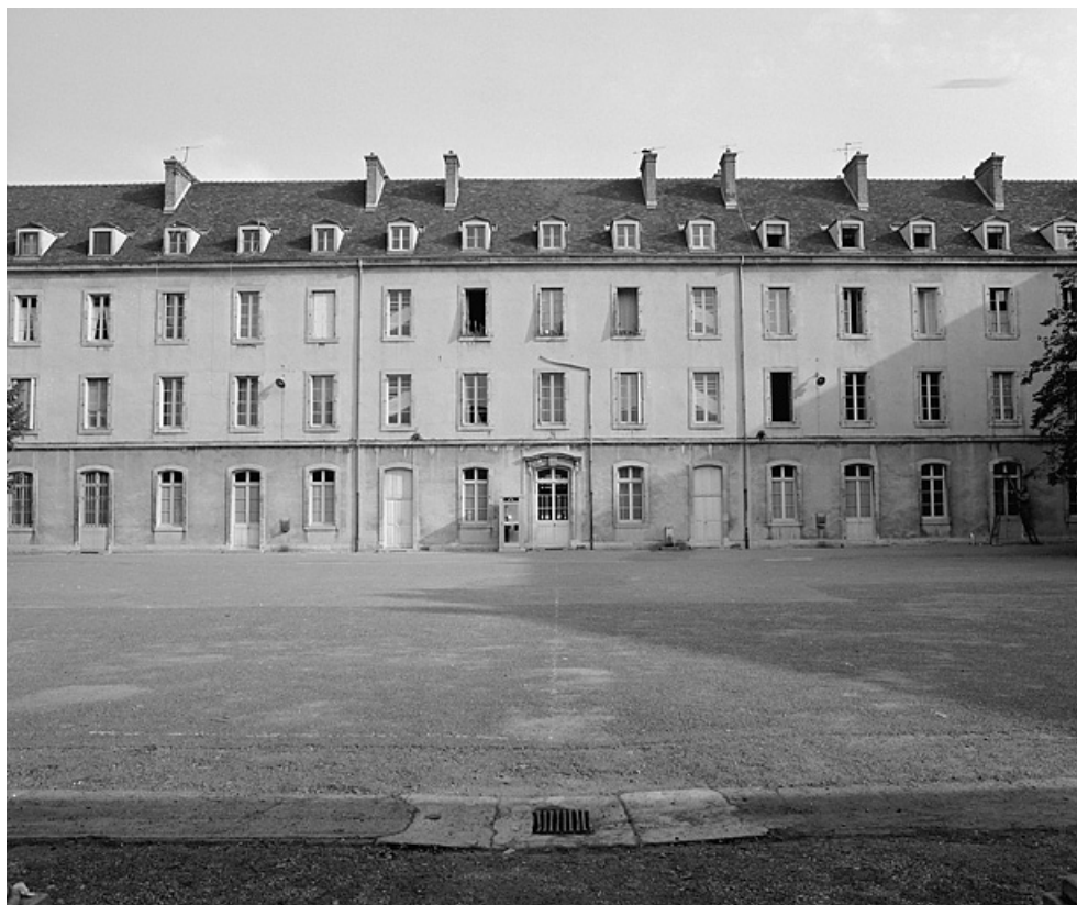
Façade postérieure sur la cour.