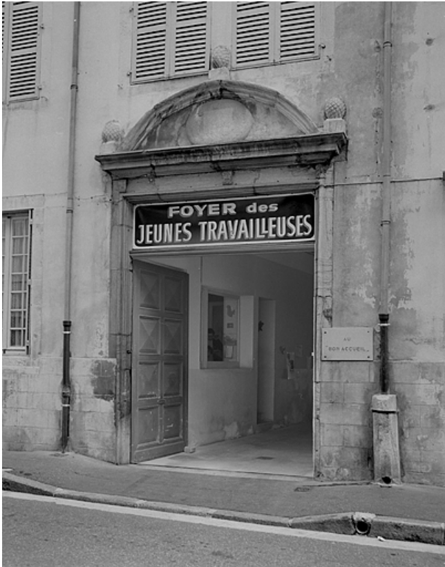
Façade sur la rue Sébile, portail droit.