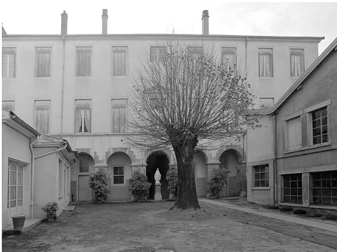
Bâtiment annexe, façade sur la cour.