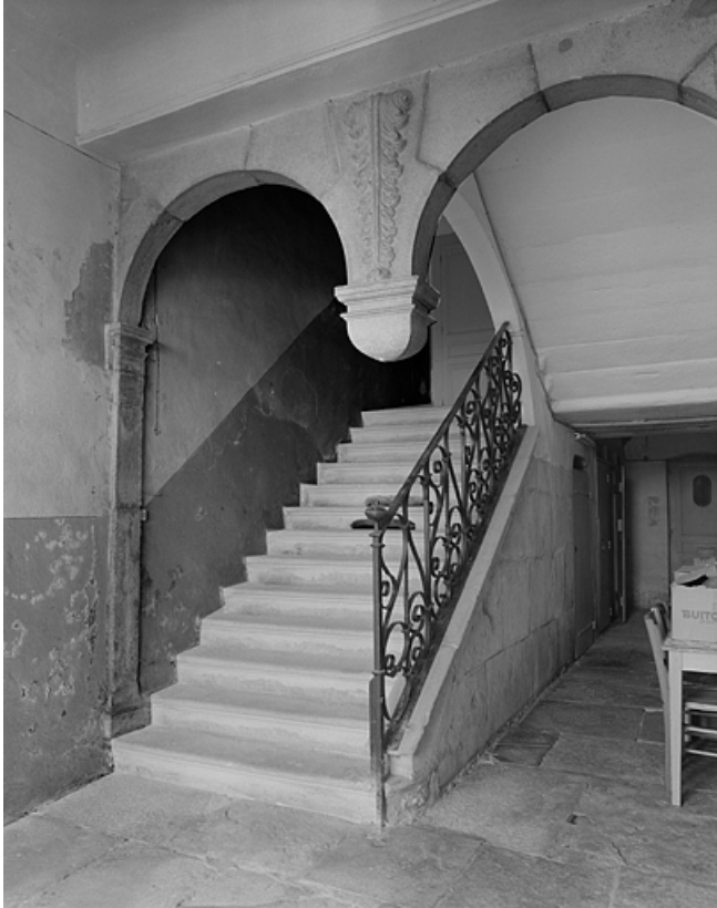
Détail de l'escalier intérieur dans le corps de bâtiment sur rue. 39, Lons-le-Saunier, 1 rue Sébile