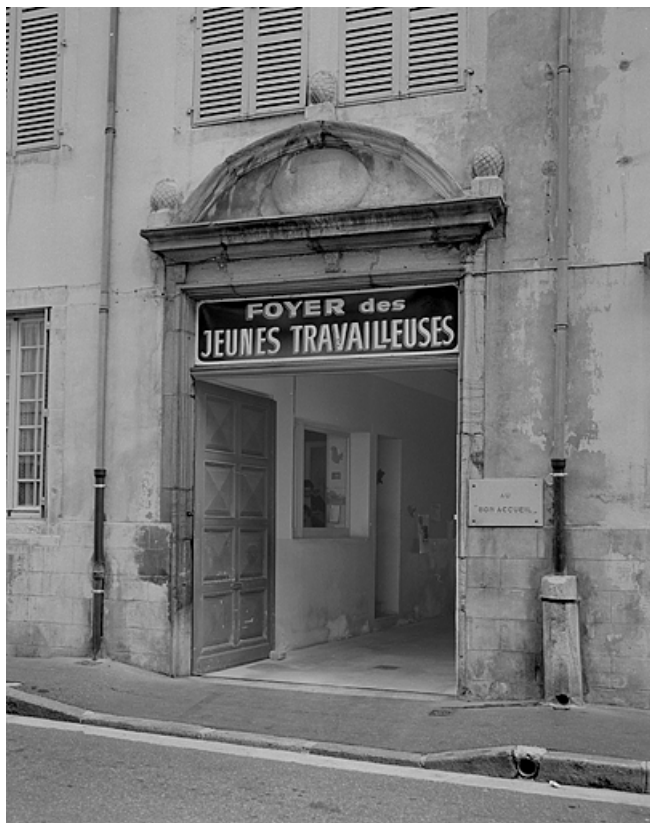
Façade sur la rue Sébile, portail droit.