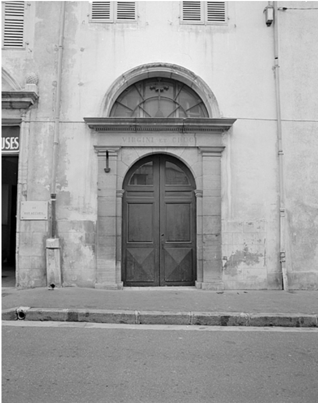
Façade sur rue Sébile, portail de la chapelle.