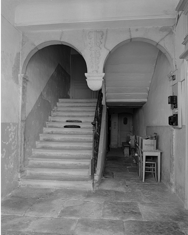
Escalier intérieur dans le corps de bâtiment sur rue, vue générale.