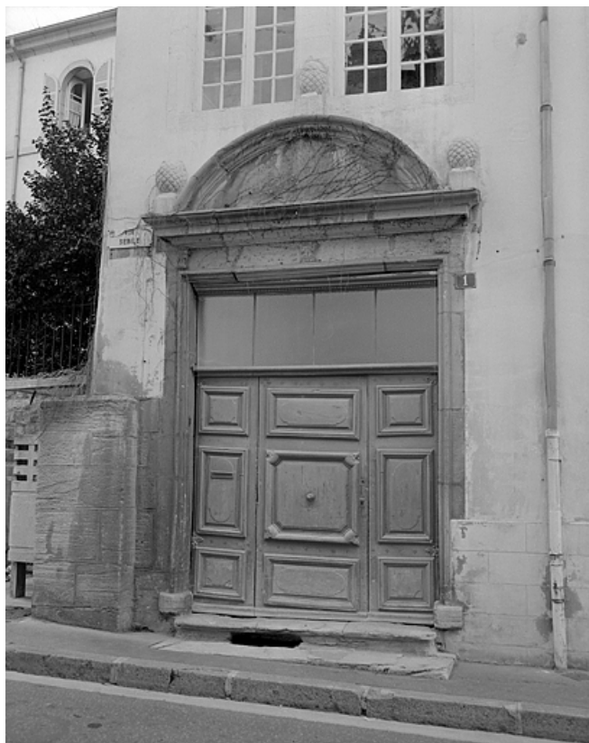
Façade sur la rue Sébile, portail gauche.