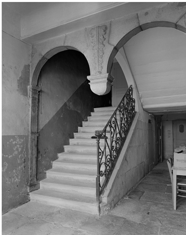
Détail de l'escalier intérieur dans le corps de bâtiment sur rue. 39, Lons-le-Saunier, 1 rue Sébile