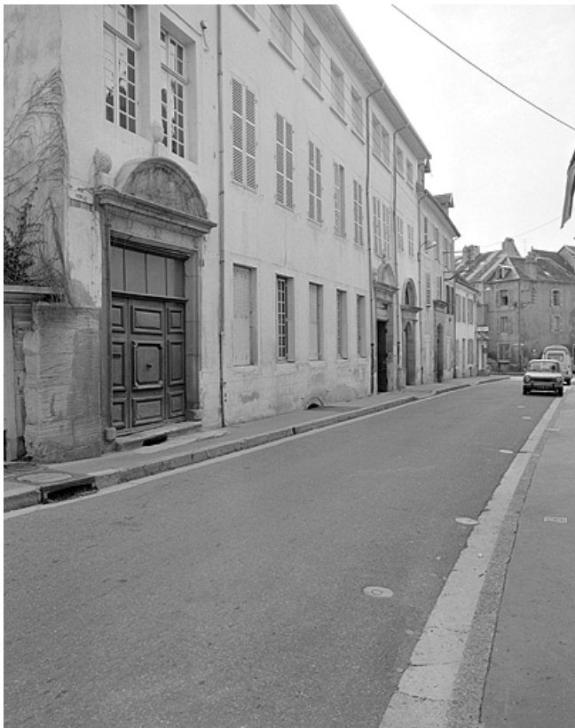
Façade sur la rue Sébile.