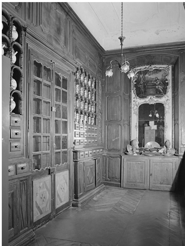
Pharmacie, deuxième salle, vue générale.

39, Lons-le-Saunier place de l' Hôtel de Ville