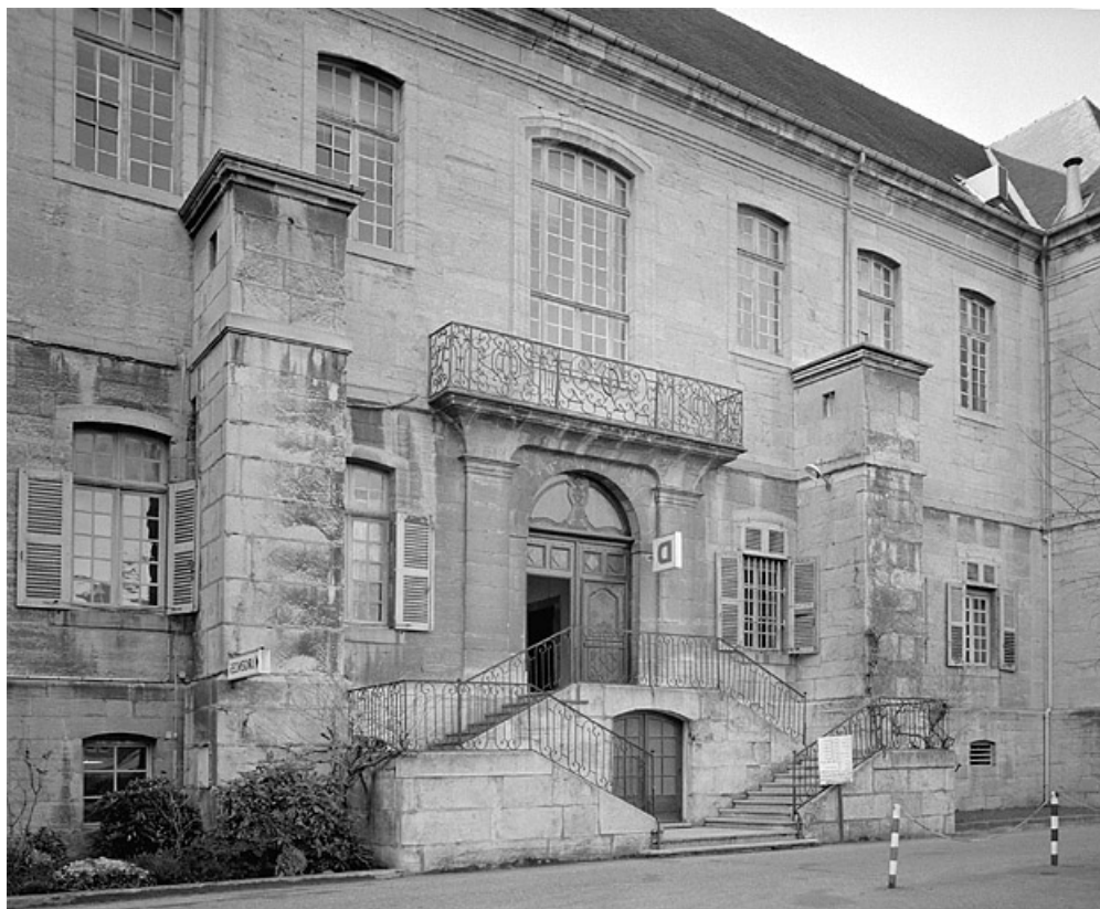
Façade postérieure, escalier extérieur.

39, Lons-le-Saunier place de l' Hôtel de Ville