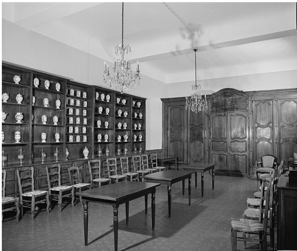
Réfectoire des soeurs, vue générale.

39, Lons-le-Saunier place de l' Hôtel de Ville