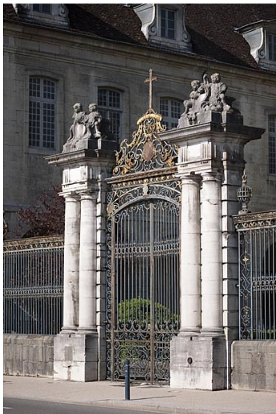
Le portail d'entrée de la cour.

39, Lons-le-Saunier place de l' Hôtel de Ville