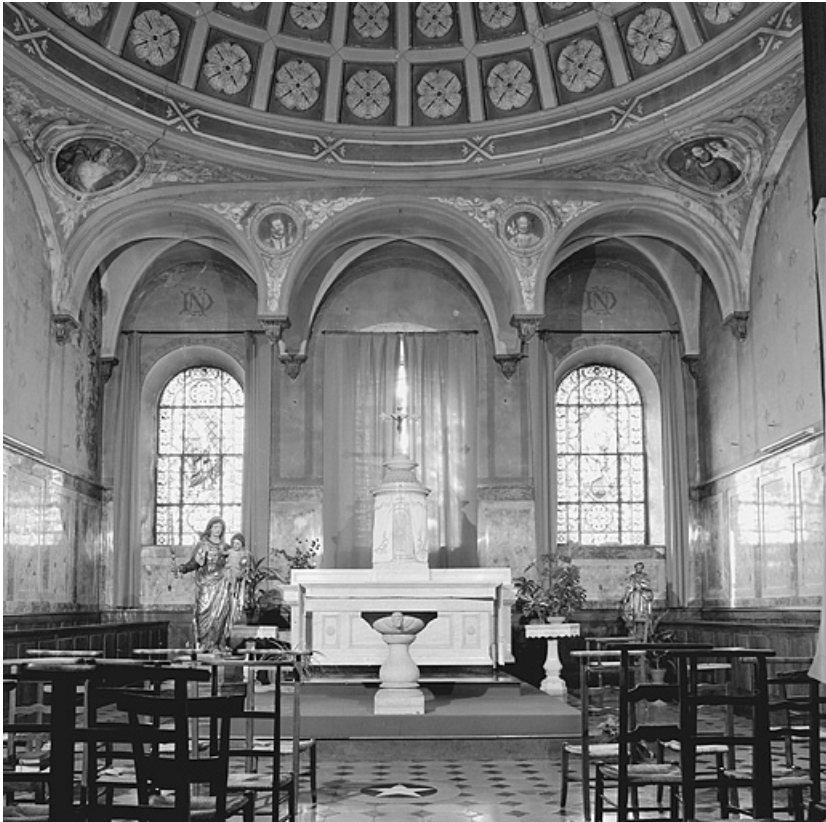
Chapelle, vue du chœur liturgique.

39, Lons-le-Saunier place de l' Hôtel de Ville