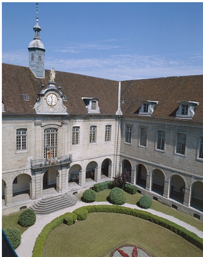
Détail de la façade antérieure.

39, Lons-le-Saunier place de l' Hôtel de Ville