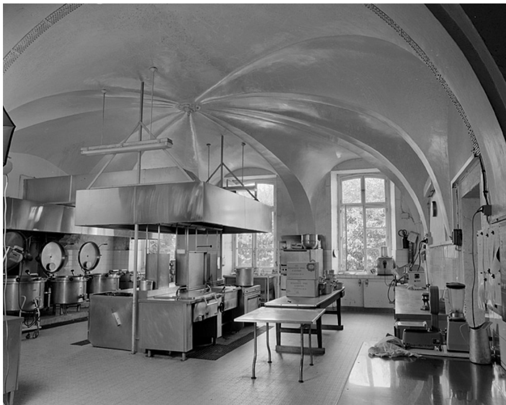
Cuisines : vue d'ensemble.

39, Lons-le-Saunier place de l' Hôtel de Ville