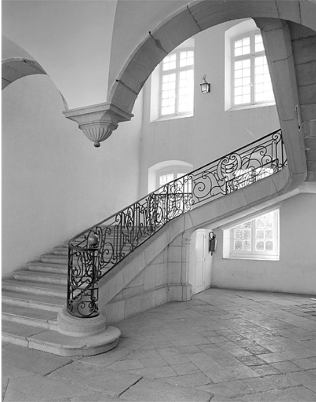
Vue du grand escalier depuis la galerie bordant la cour.

39, Lons-le-Saunier place de l' Hôtel de Ville