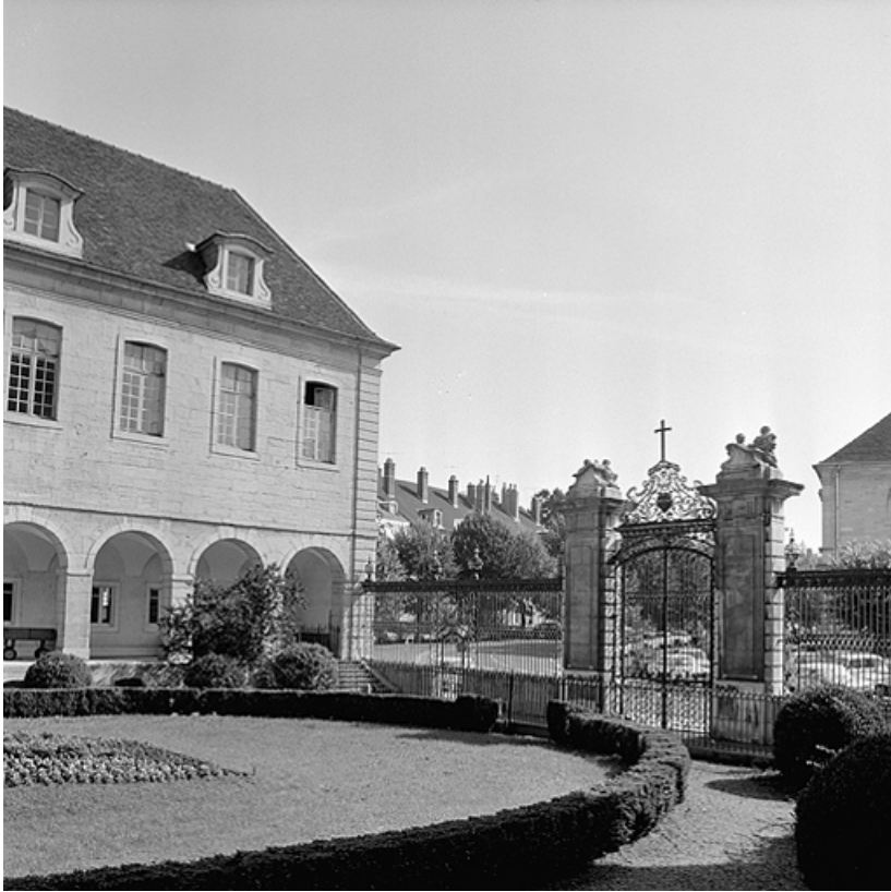
Vue postérieure de la grille fermant la cour.

39, Lons-le-Saunier place de l' Hôtel de Ville