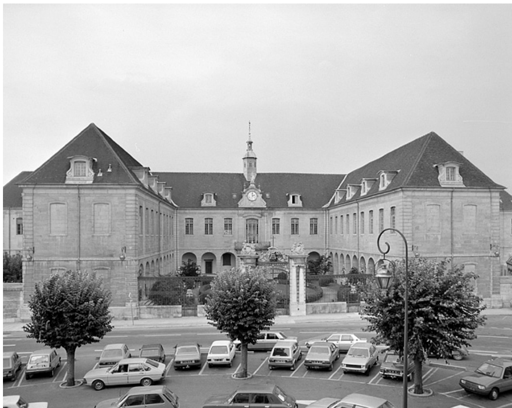
Vue de la partie centrale de l'édifice avec sa cour ouverte.

39, Lons-le-Saunier place de l' Hôtel de Ville