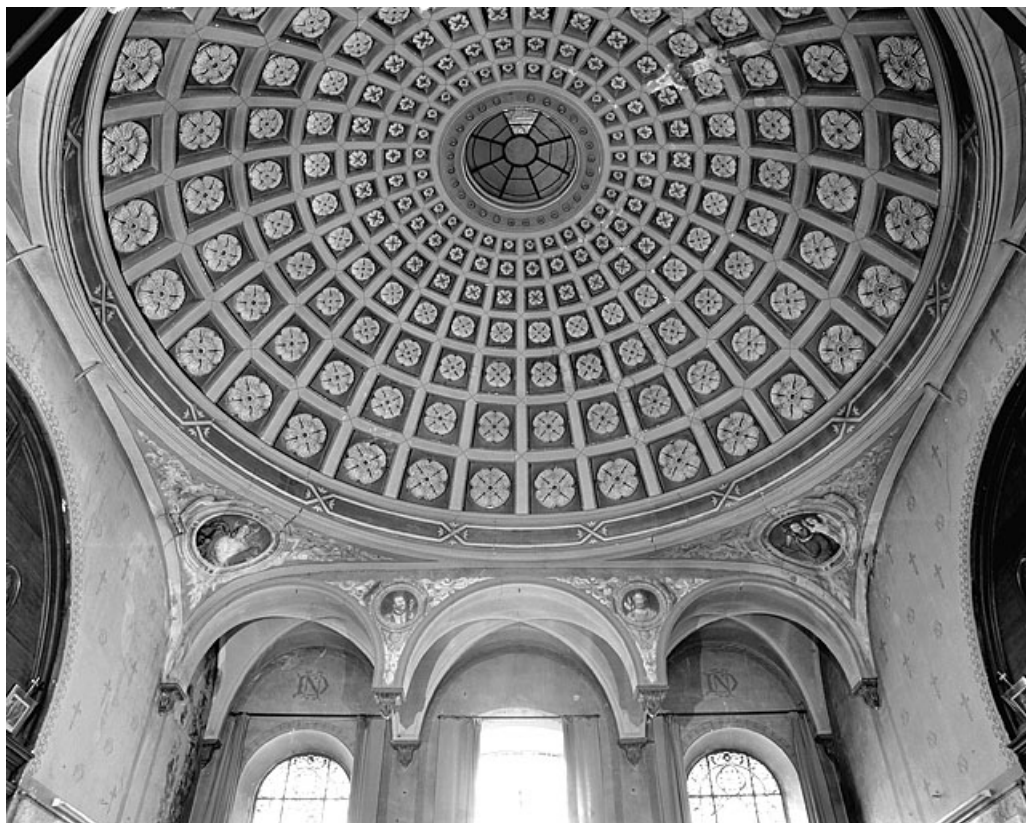
Chapelle, coupole et pendentifs.

39, Lons-le-Saunier place de l' Hôtel de Ville