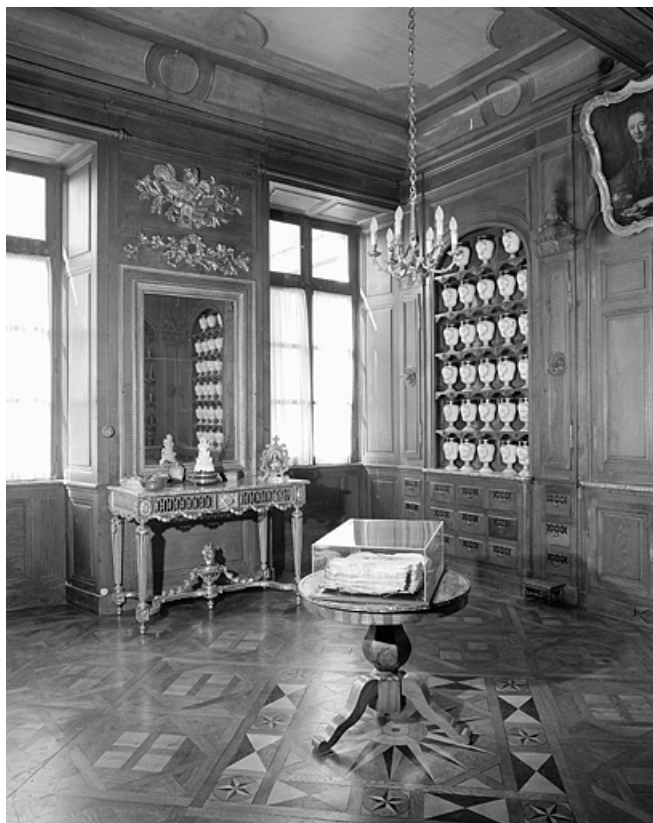
Pharmacie, troisième salle, détail.

39, Lons-le-Saunier place de l' Hôtel de Ville