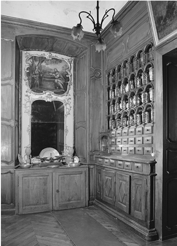
Pharmacie, deuxième salle, détail.

39, Lons-le-Saunier place de l' Hôtel de Ville