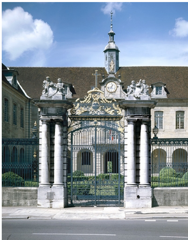
Le portail d'entrée de la cour.

39, Lons-le-Saunier place de l' Hôtel de Ville