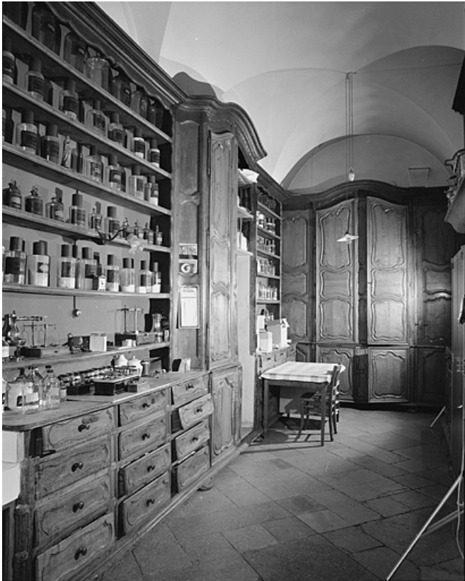
Pharmacie, première salle, vue générale. 39, Lons-le-Saunier place de l' Hôtel de Ville