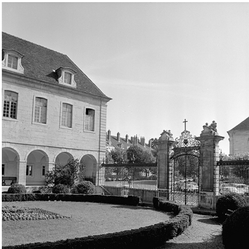
Vue postérieure de la grille fermant la cour.

39, Lons-le-Saunier place de l' Hôtel de Ville