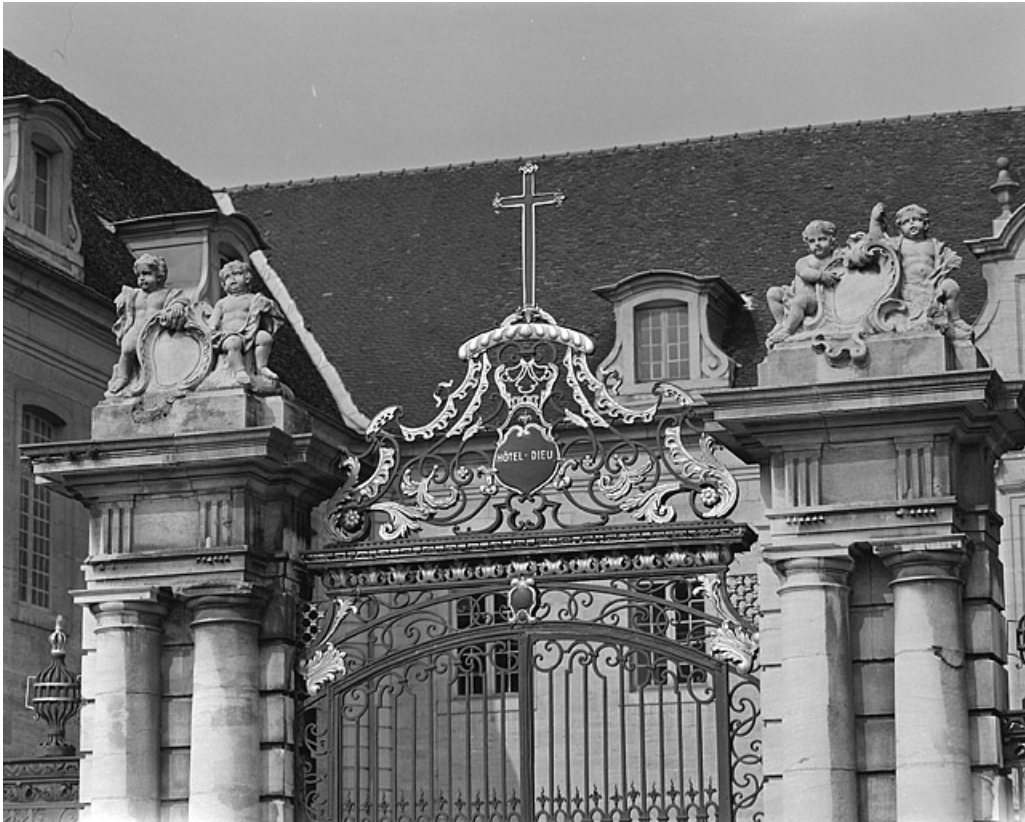
Grille de clôture de la cour, détail.

39, Lons-le-Saunier place de l' Hôtel de Ville