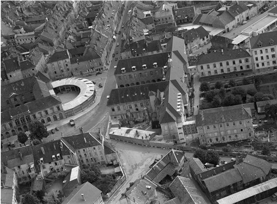
Vue aérienne en 1956.

39, Lons-le-Saunier place de l' Hôtel de Ville