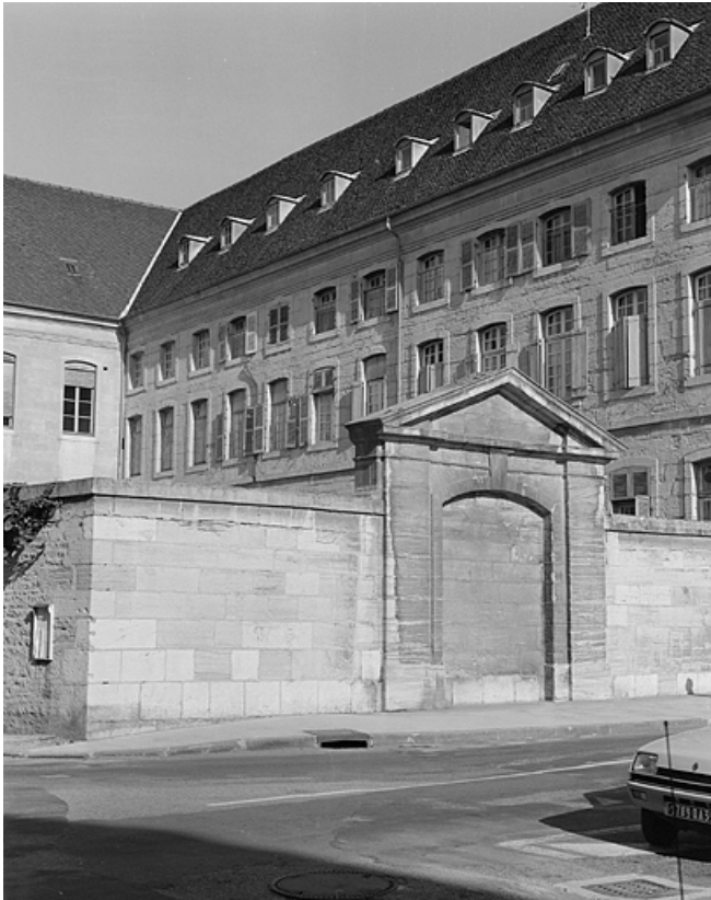
Façade latérale de l'aile gauche en retour et faux portail.

39, Lons-le-Saunier place de l' Hôtel de Ville