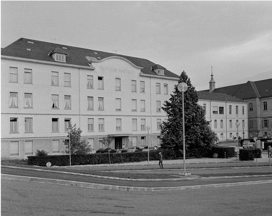
Pavillon sud, Pavillon Pasteur (19e siècle).

39, Lons-le-Saunier place de l' Hôtel de Ville