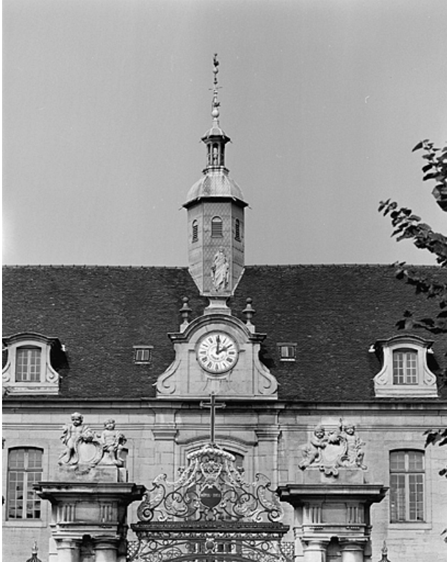
Façade principale sur la cour, détail de la partie centrale.

39, Lons-le-Saunier place de l' Hôtel de Ville