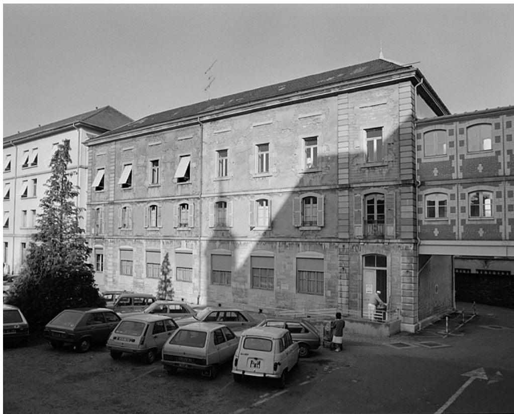
Bâtiment annexe (Pavillon nord) depuis la cour.

39, Lons-le-Saunier place de l' Hôtel de Ville