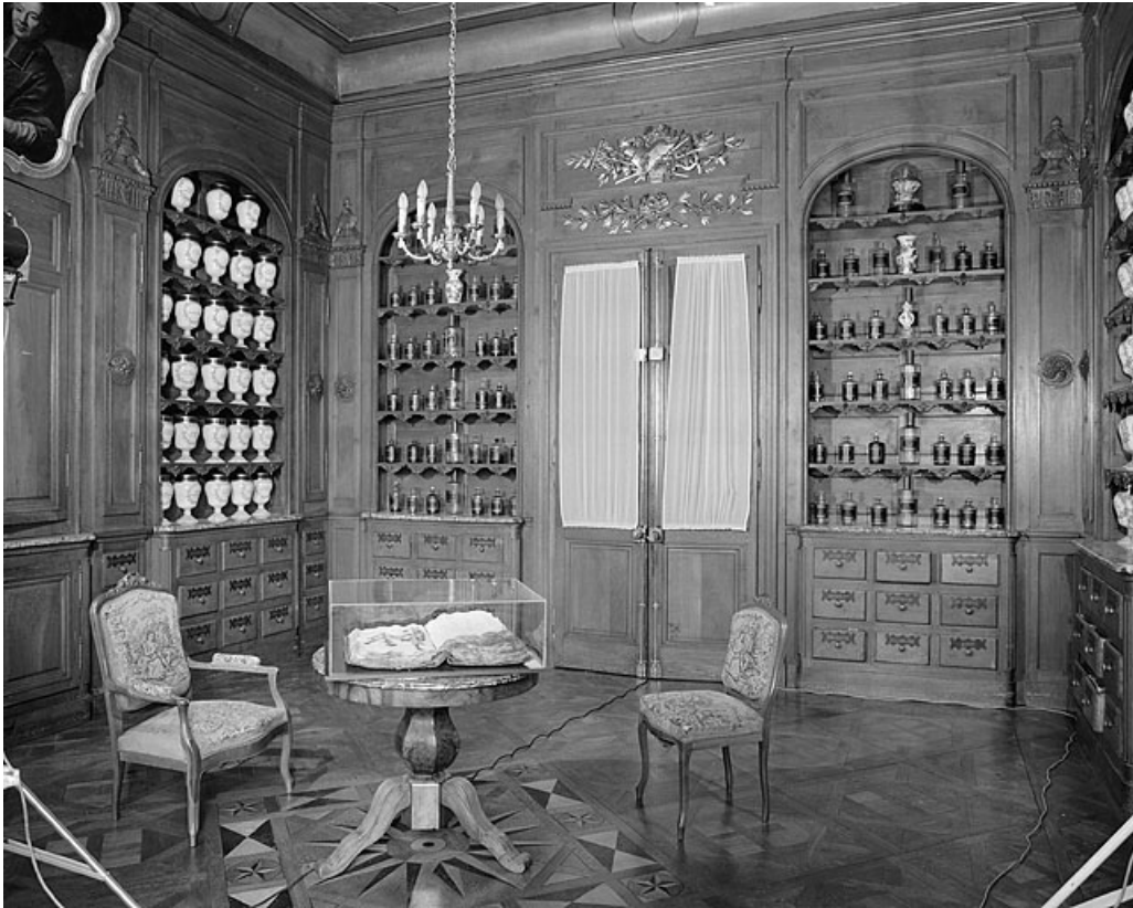
Pharmacie, troisième salle.

39, Lons-le-Saunier place de l' Hôtel de Ville