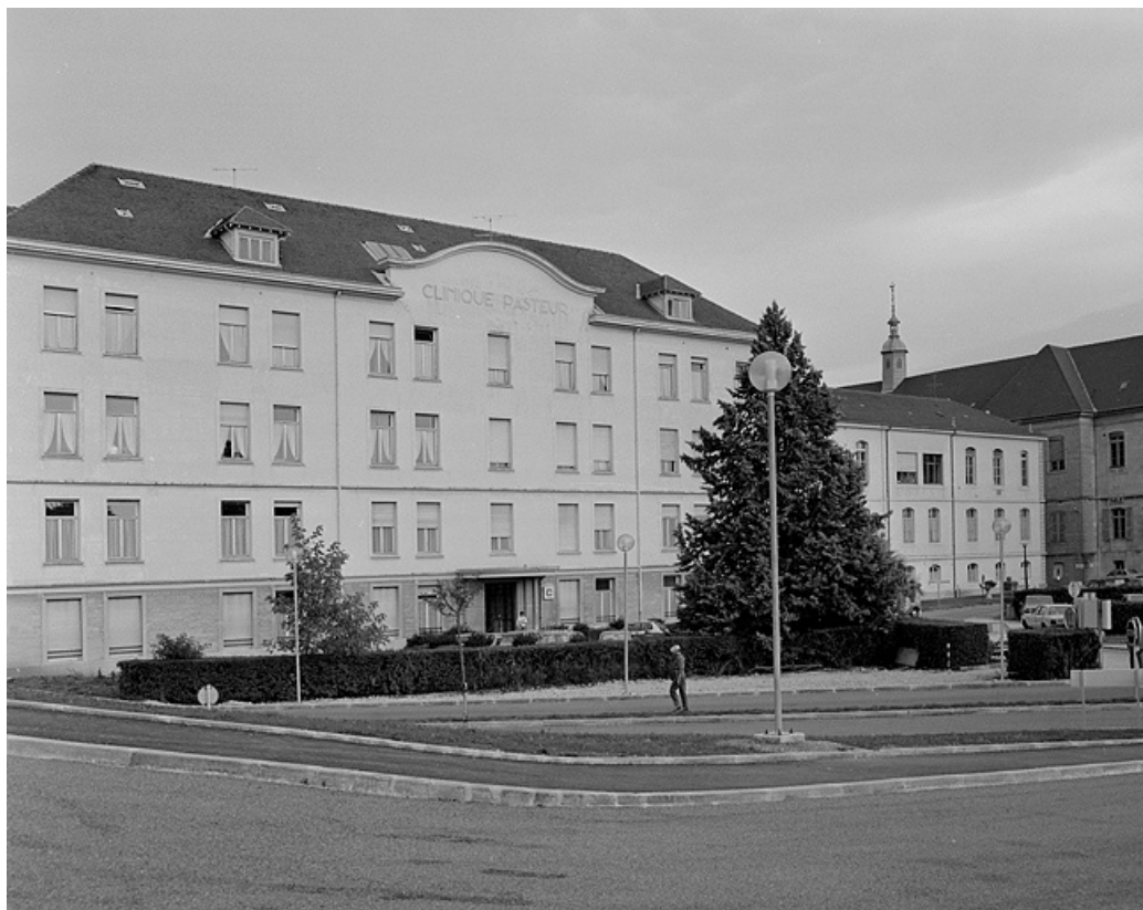
Pavillon sud, Pavillon Pasteur (19e siècle). 39, Lons-le-Saunier place de l' Hôtel de Ville