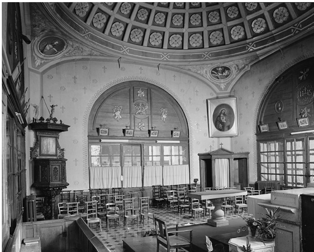
Chapelle, vue générale.

39, Lons-le-Saunier place de l' Hôtel de Ville