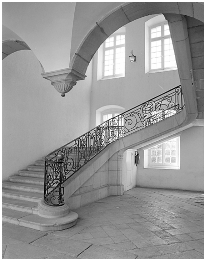
Vue du grand escalier depuis la galerie bordant la cour.

39, Lons-le-Saunier place de l' Hôtel de Ville