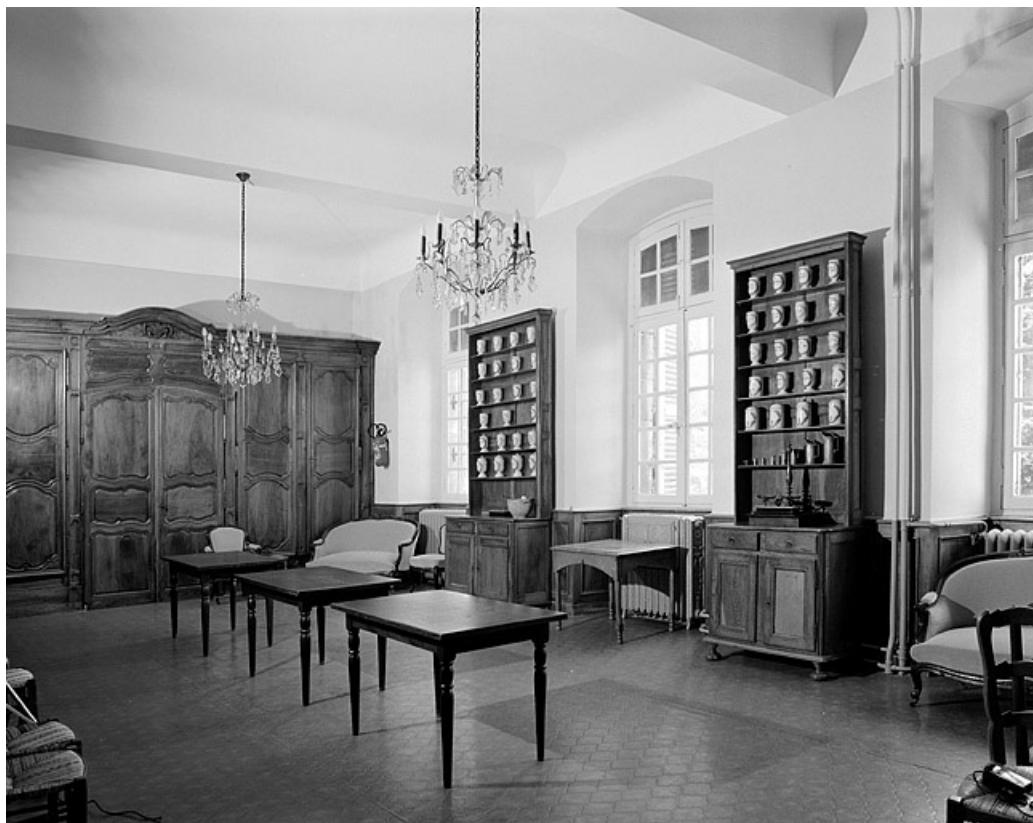
Réfectoire des soeurs, vue générale.

39, Lons-le-Saunier place de l' Hôtel de Ville