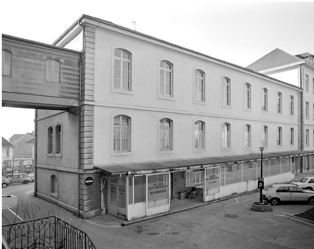
Bâtiment annexe (Pavillon sud) depuis la cour.

39, Lons-le-Saunier place de l' Hôtel de Ville