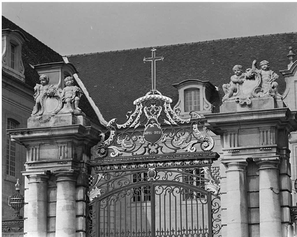
Grille de clôture de la cour, détail.

39, Lons-le-Saunier place de l' Hôtel de Ville