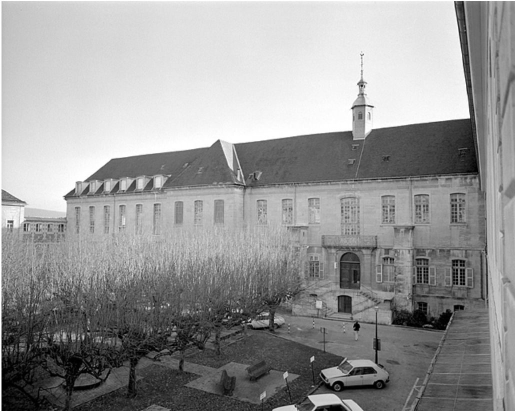
Façade postérieure, vue partielle.

39, Lons-le-Saunier place de l' Hôtel de Ville