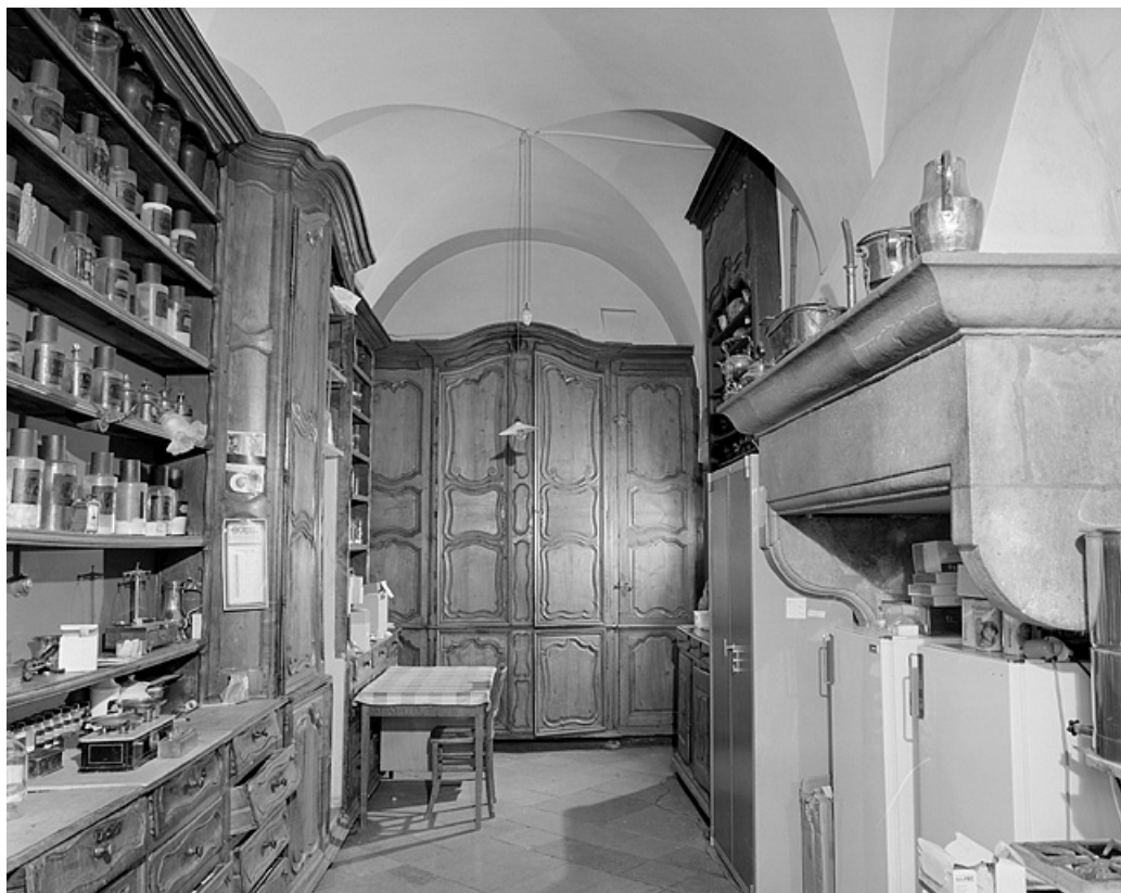
Pharmacie, première salle, détail.

39, Lons-le-Saunier place de l' Hôtel de Ville