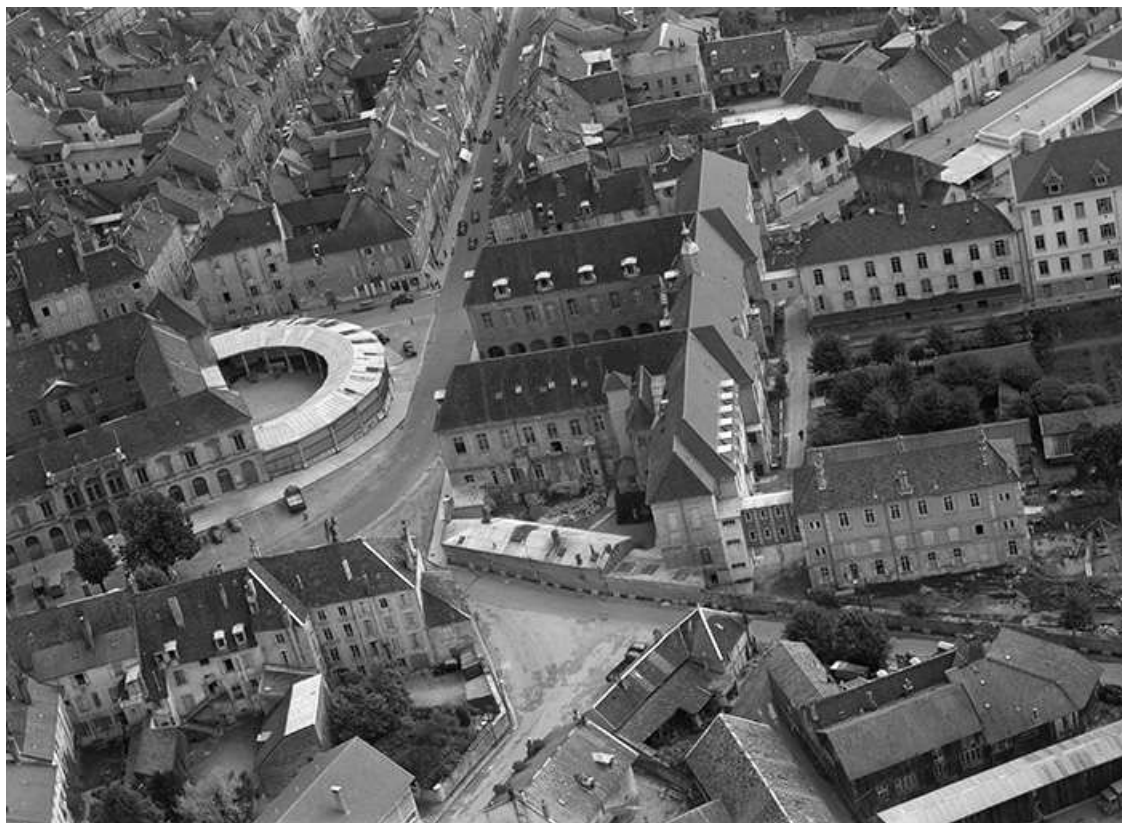
Vue aérienne en 1956.

39, Lons-le-Saunier place de l' Hôtel de Ville