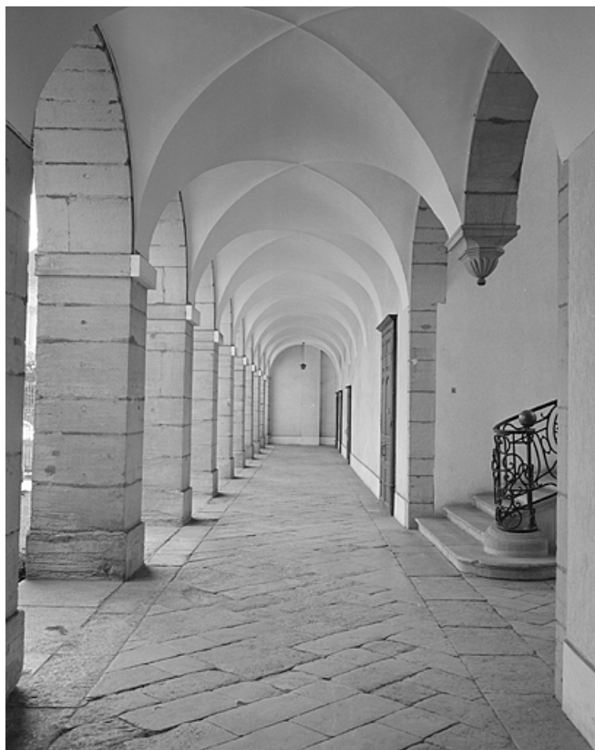
Galerie bordant la cour en rez-de-chaussée de l'aile gauche, avec départ du grand escalier.

39, Lons-le-Saunier place de l' Hôtel de Ville