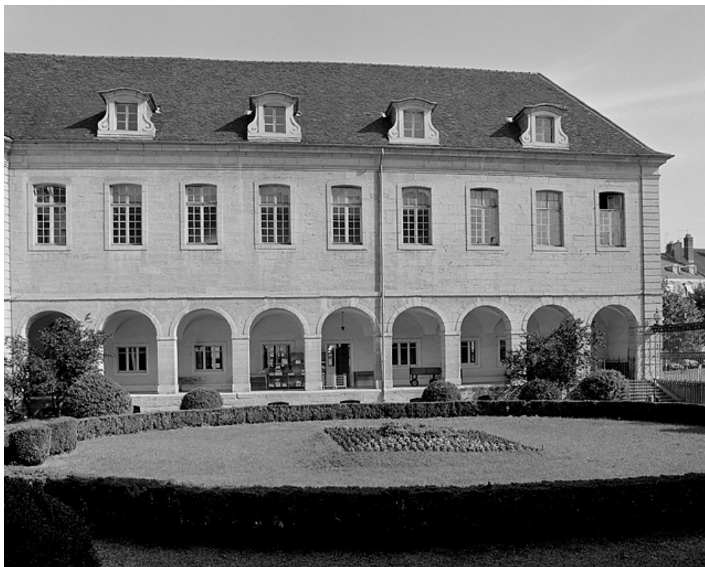
Façade latérale de l'aile droite en retour donnant sur la cour ouverte.

39, Lons-le-Saunier place de l' Hôtel de Ville