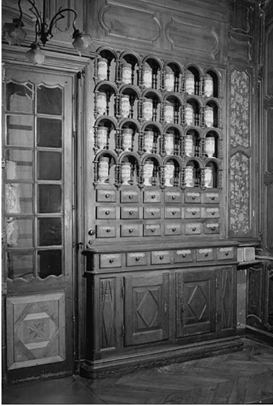
Pharmacie, deuxième salle, détail meuble de lambris.

39, Lons-le-Saunier place de l' Hôtel de Ville