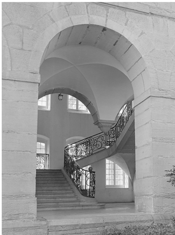
Départ du grand escalier vu à travers une arcade de la galerie bordant la cour.

39, Lons-le-Saunier place de l' Hôtel de Ville