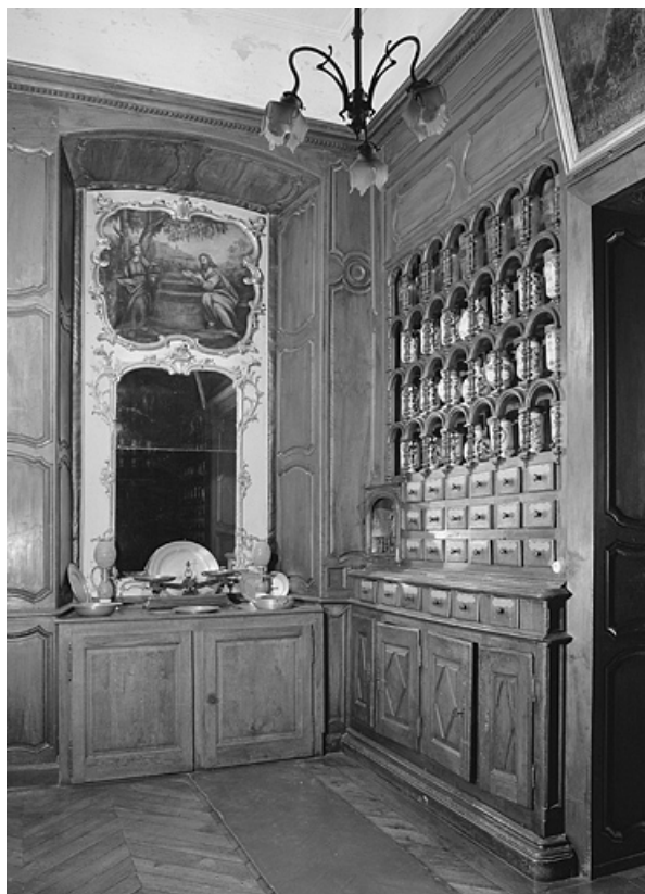
Pharmacie, deuxième salle, détail.

39, Lons-le-Saunier place de l' Hôtel de Ville