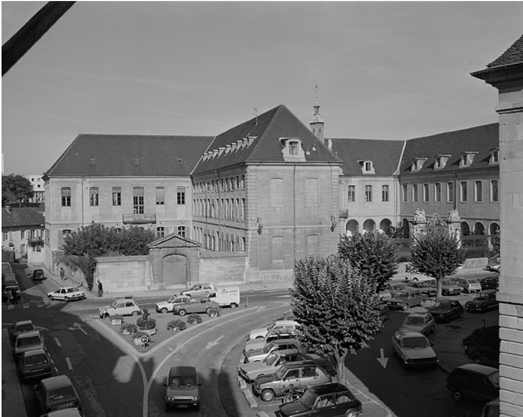
Vue de la partie gauche de l'édifice.

39, Lons-le-Saunier place de l' Hôtel de Ville