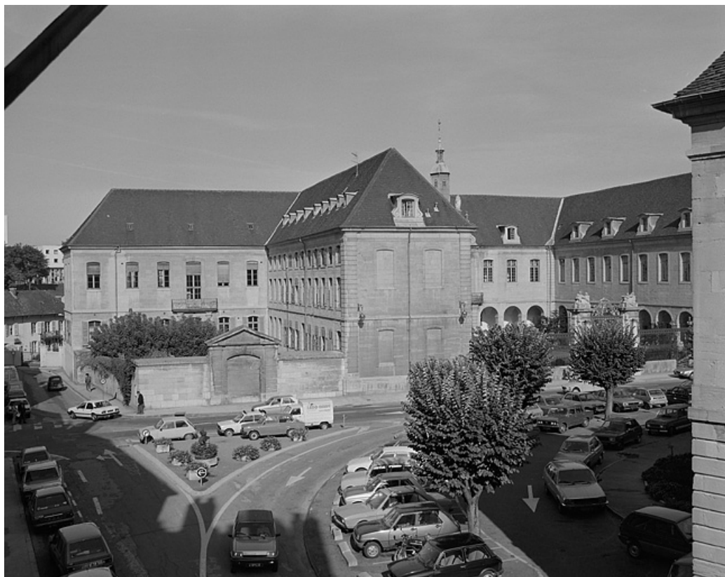
Vue de la partie gauche de l'édifice.

39, Lons-le-Saunier place de l' Hôtel de Ville