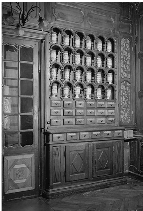
Pharmacie, deuxième salle, détail meuble de lambris.

39, Lons-le-Saunier place de l' Hôtel de Ville