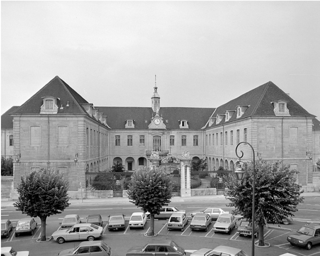
Vue de la partie centrale de l'édifice avec sa cour ouverte.

39, Lons-le-Saunier place de l' Hôtel de Ville