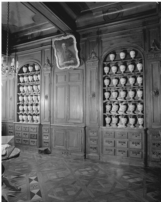
Pharmacie, troisième salle, détail.

39, Lons-le-Saunier place de l' Hôtel de Ville