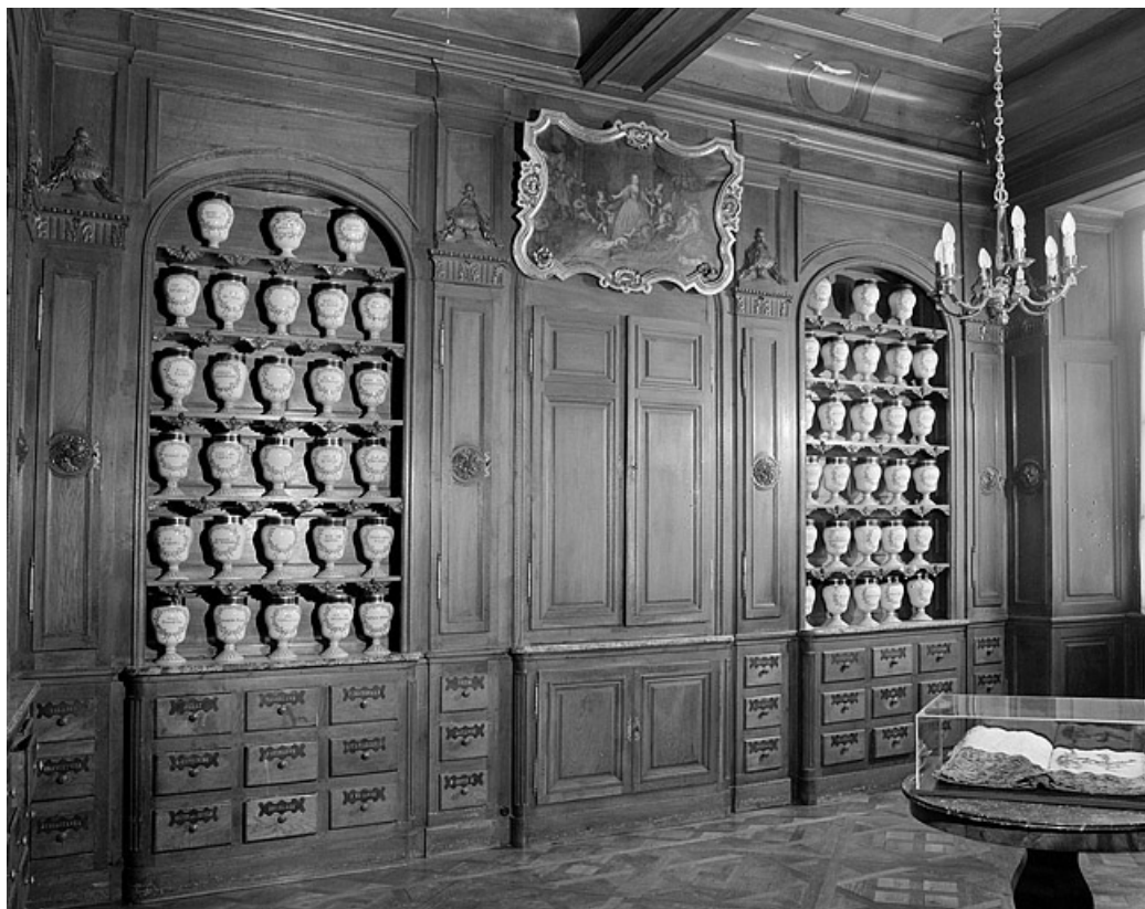
Pharmacie, troisième salle, détail.

39, Lons-le-Saunier place de l' Hôtel de Ville