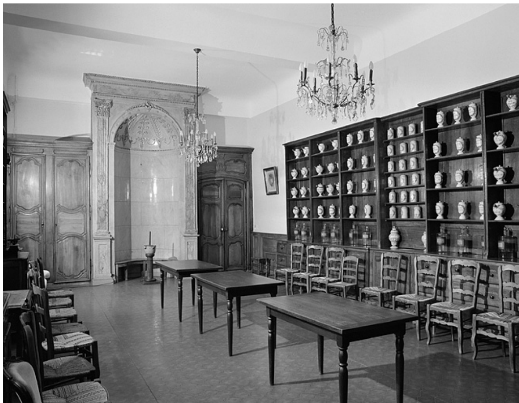
Réfectoire des soeurs, vue générale.

39, Lons-le-Saunier place de l' Hôtel de Ville