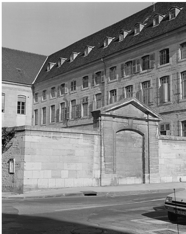
Façade latérale de l'aile gauche en retour et faux portail.

39, Lons-le-Saunier place de l' Hôtel de Ville