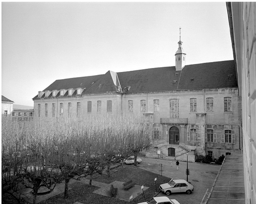
Façade postérieure, vue partielle.

39, Lons-le-Saunier place de l' Hôtel de Ville