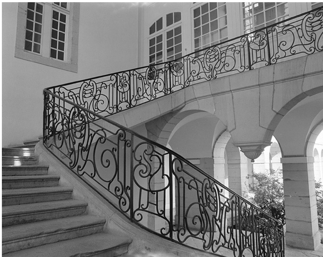
Vue d'ensemble du grand escalier et de la galerie bordant la cour.

39, Lons-le-Saunier place de l' Hôtel de Ville