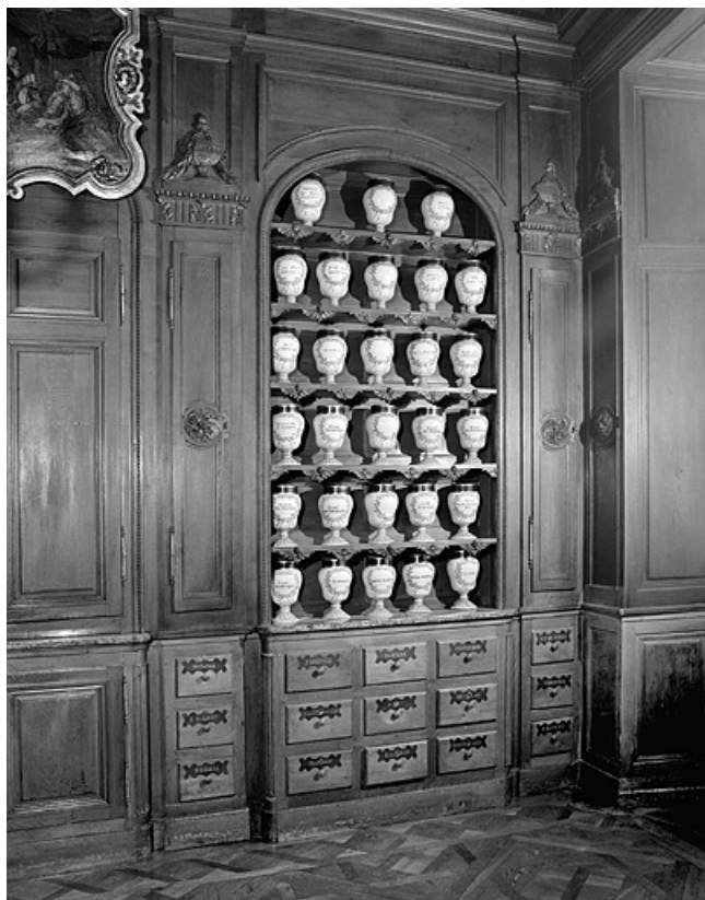
Pharmacie, troisième salle, détail meuble de lambris.

39, Lons-le-Saunier place de l' Hôtel de Ville