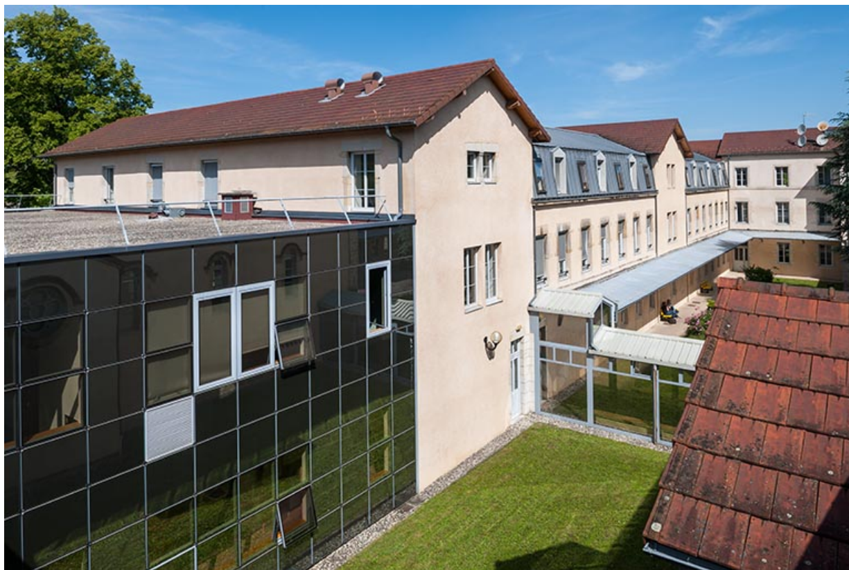
Façades Ouest sur cours : cafétéria, externat et administration

39, Lons-le-Saunier, 1 avenue de Montciel