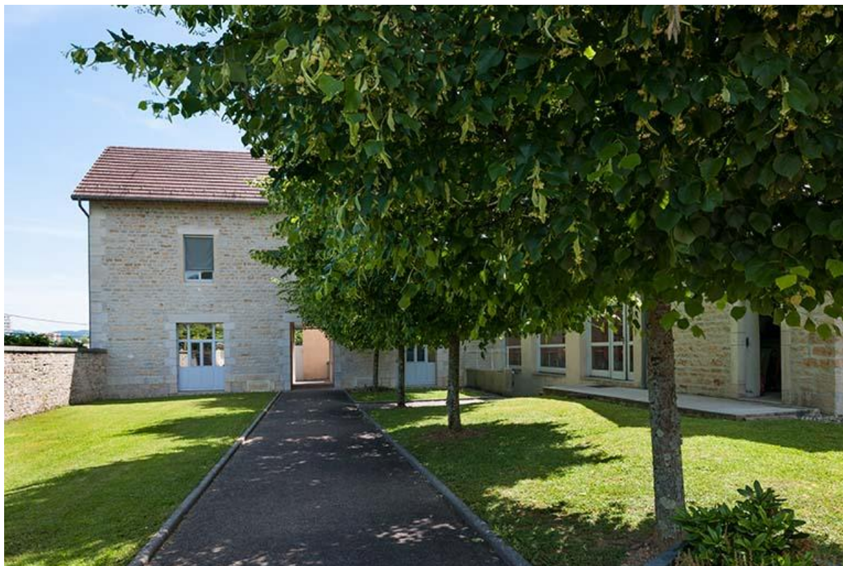
Façade antérieure de l'aile gauche occupée par l'atelier des agents

39, Lons-le-Saunier, 1 avenue de Montciel