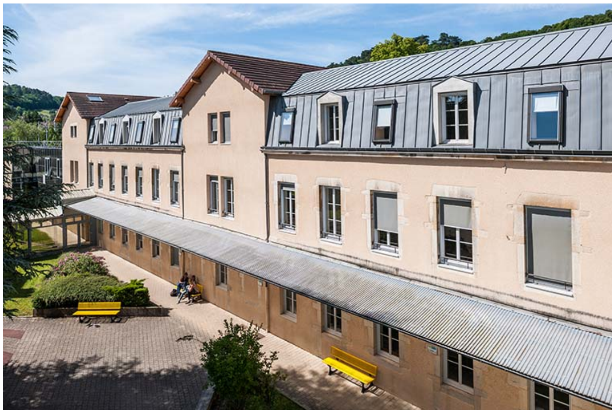
Façade Ouest sur cour de l'externat

39, Lons-le-Saunier, 1 avenue de Montciel