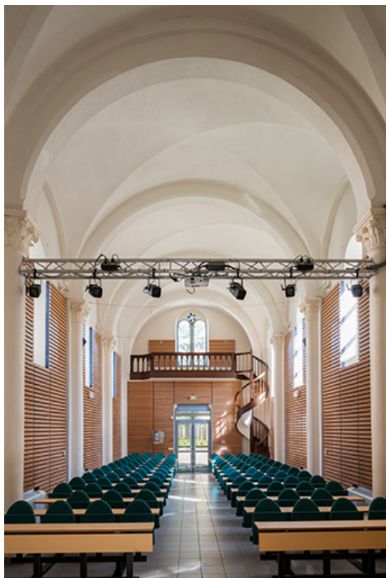
Vue intérieure de la chapelle depuis le chevet : entrée et tribune, aménagement de la salle de conférence 39, Lons-le-Saunier, 1 avenue de Montciel