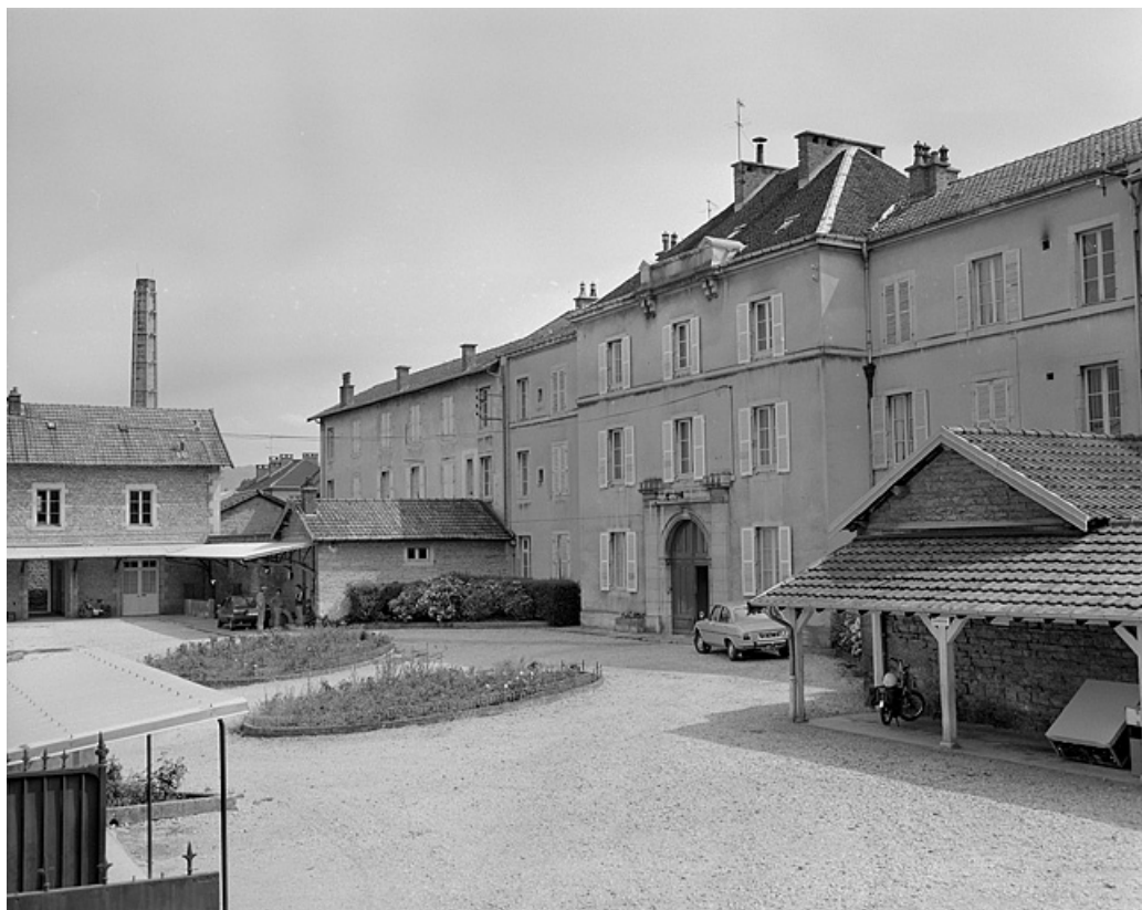
Façade principale sur l'avenue de Montciel.

39, Lons-le-Saunier, 1 avenue de Montciel