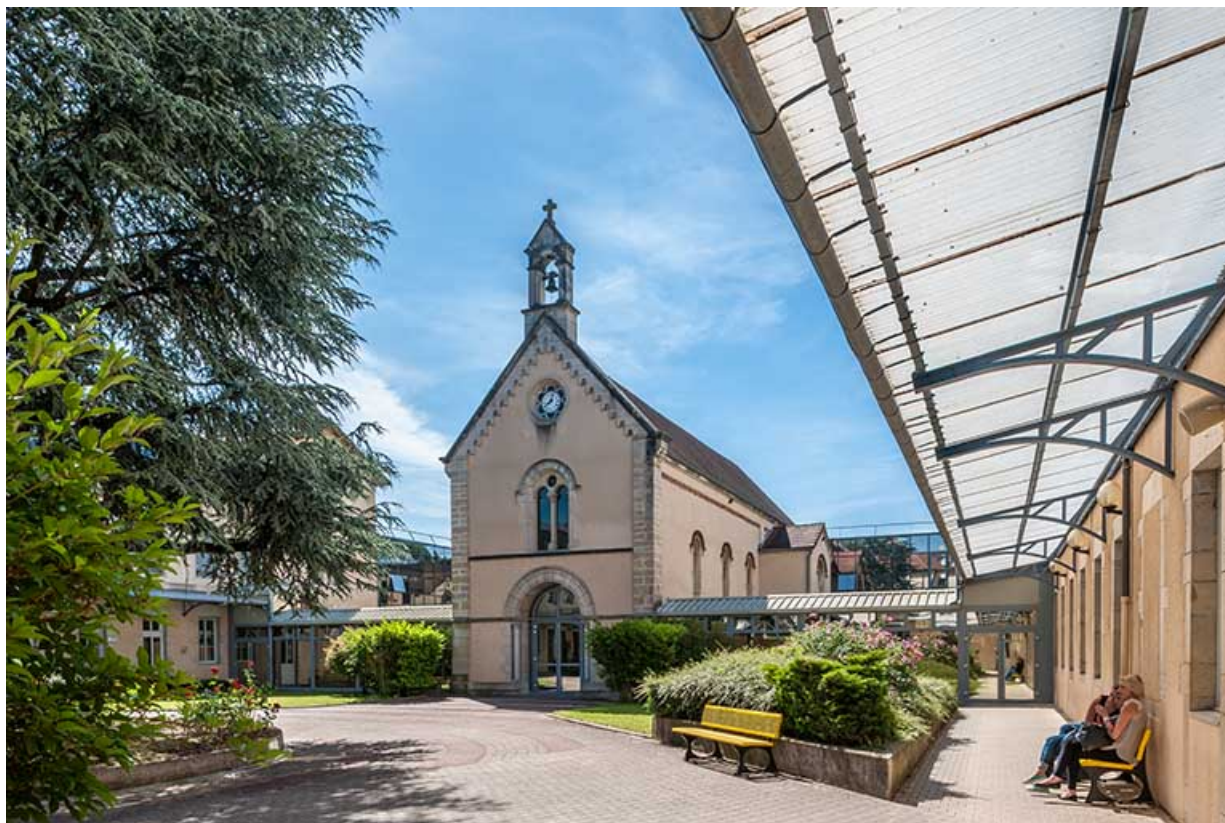
La cour intérieure et la chapelle : vue ouest

39, Lons-le-Saunier, 1 avenue de Montciel