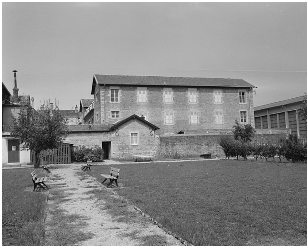
Façade latérale d'un des pavillons.

39, Lons-le-Saunier, 1 avenue de Montciel