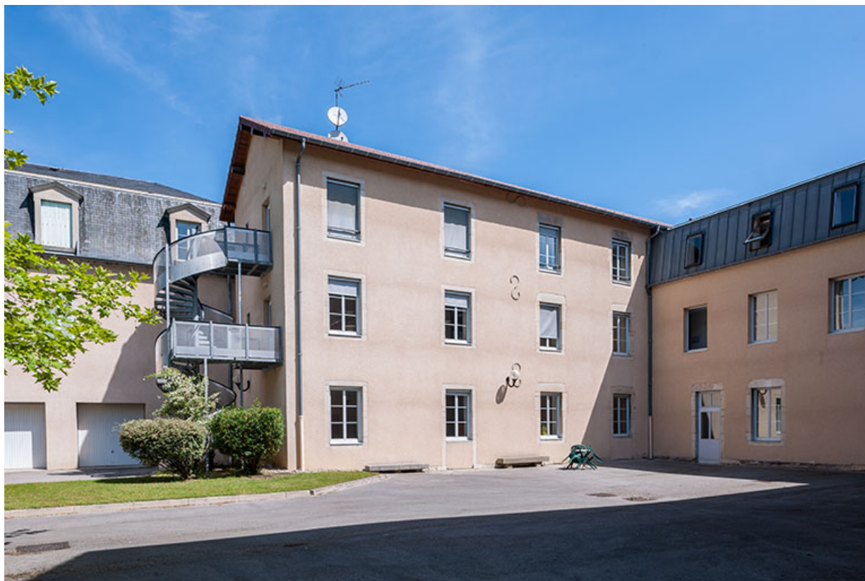
Façades postérieures des bâtiments administration.

39, Lons-le-Saunier, 1 avenue de Montciel