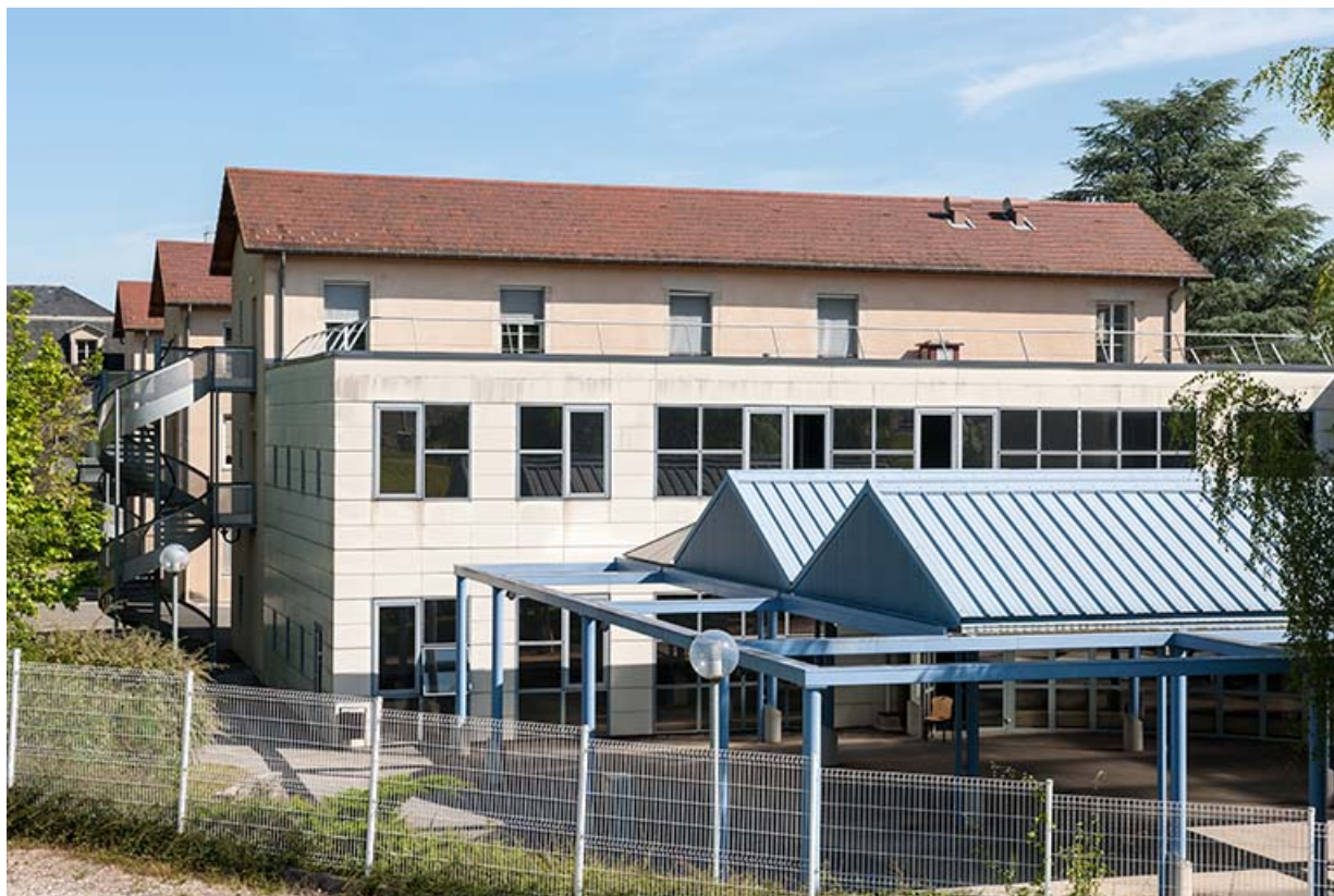
Extension Sud ouest : ancien bâtiment d'externat et cafétéria, préau 39, Lons-le-Saunier, 1 avenue de Montciel