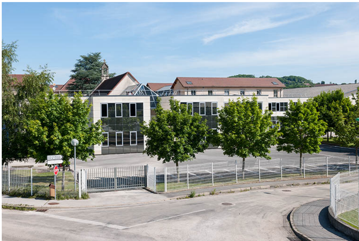
Extension Sud : bâtiments, passage et chevet de la chapelle, parking.

39, Lons-le-Saunier, 1 avenue de Montciel