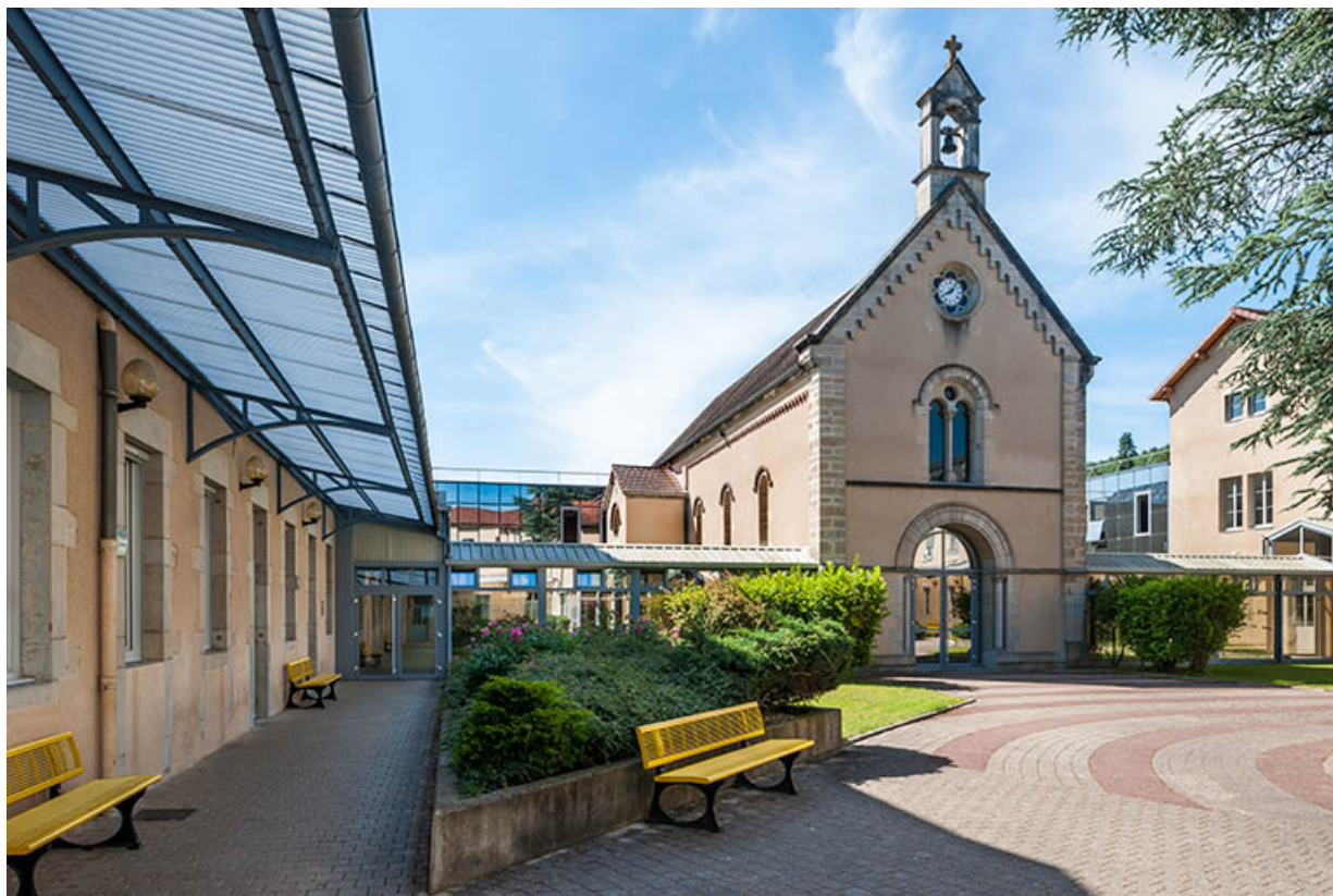
La cour intérieure et la chapelle : vue Est 39, Lons-le-Saunier, 1 avenue de Montciel