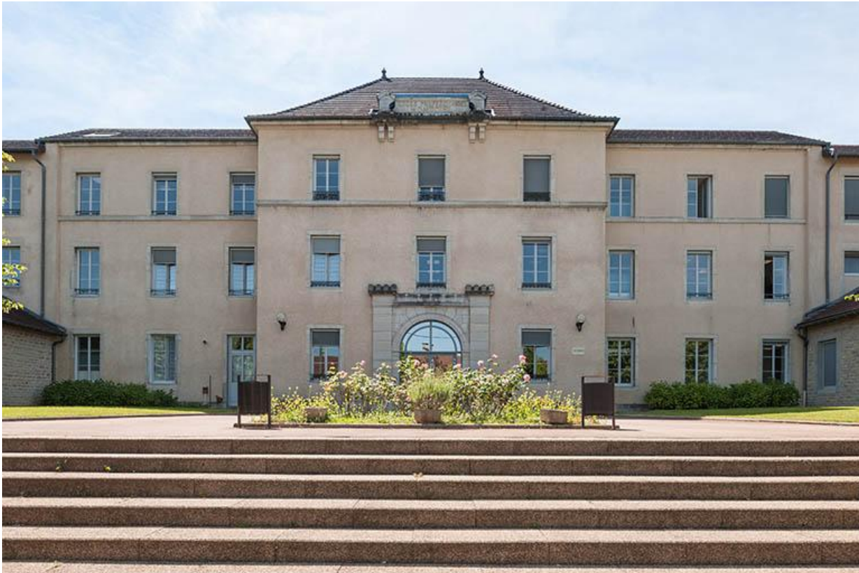
Façade du lycée depuis l'avenue Montciel

39, Lons-le-Saunier, 1 avenue de Montciel