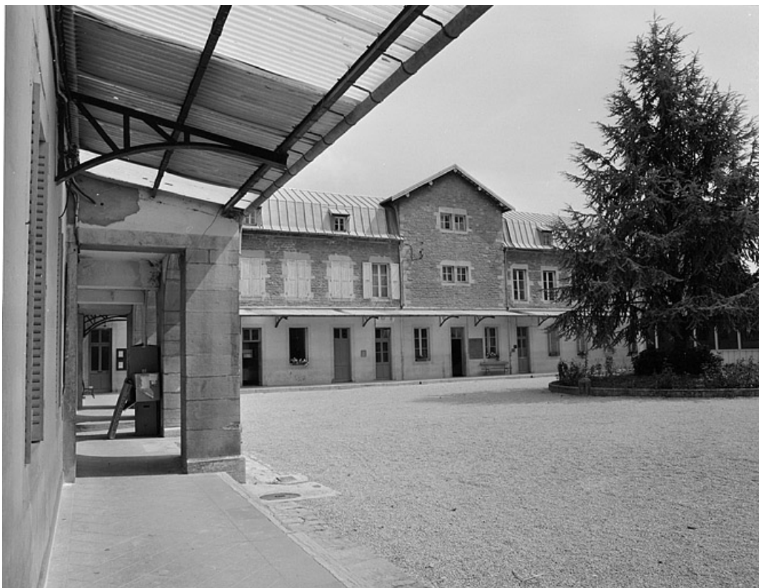
Cour intérieure, vue depuis le pavillon d'entrée.

39, Lons-le-Saunier, 1 avenue de Montciel