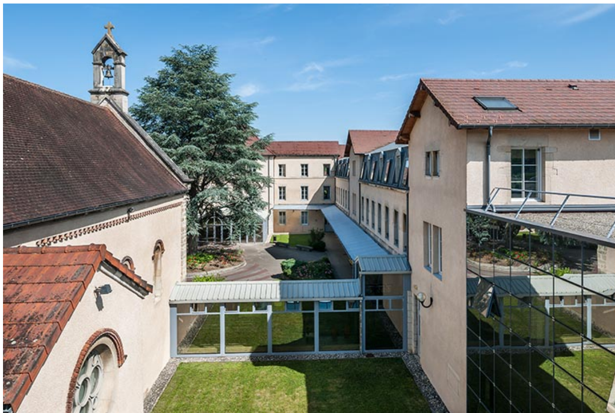
Façades Est sur cour : externat, chapelle.

39, Lons-le-Saunier, 1 avenue de Montciel