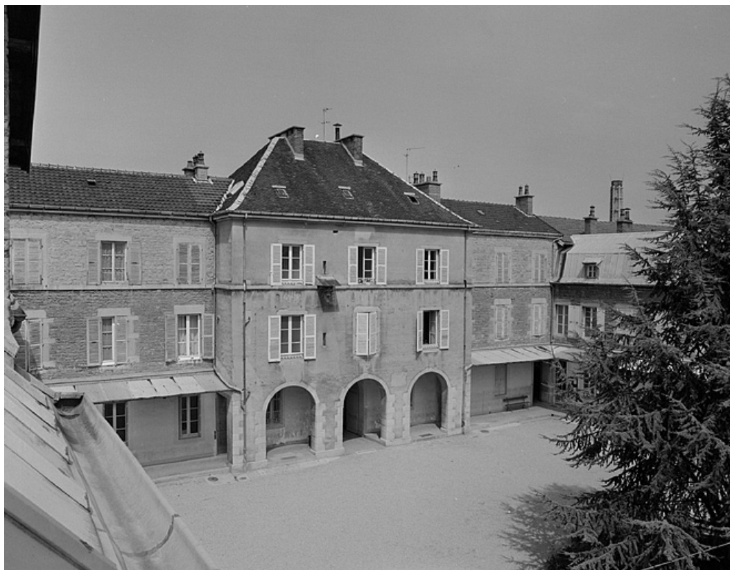
Pavillon d'entrée, vue de la cour intérieure.

39, Lons-le-Saunier, 1 avenue de Montciel