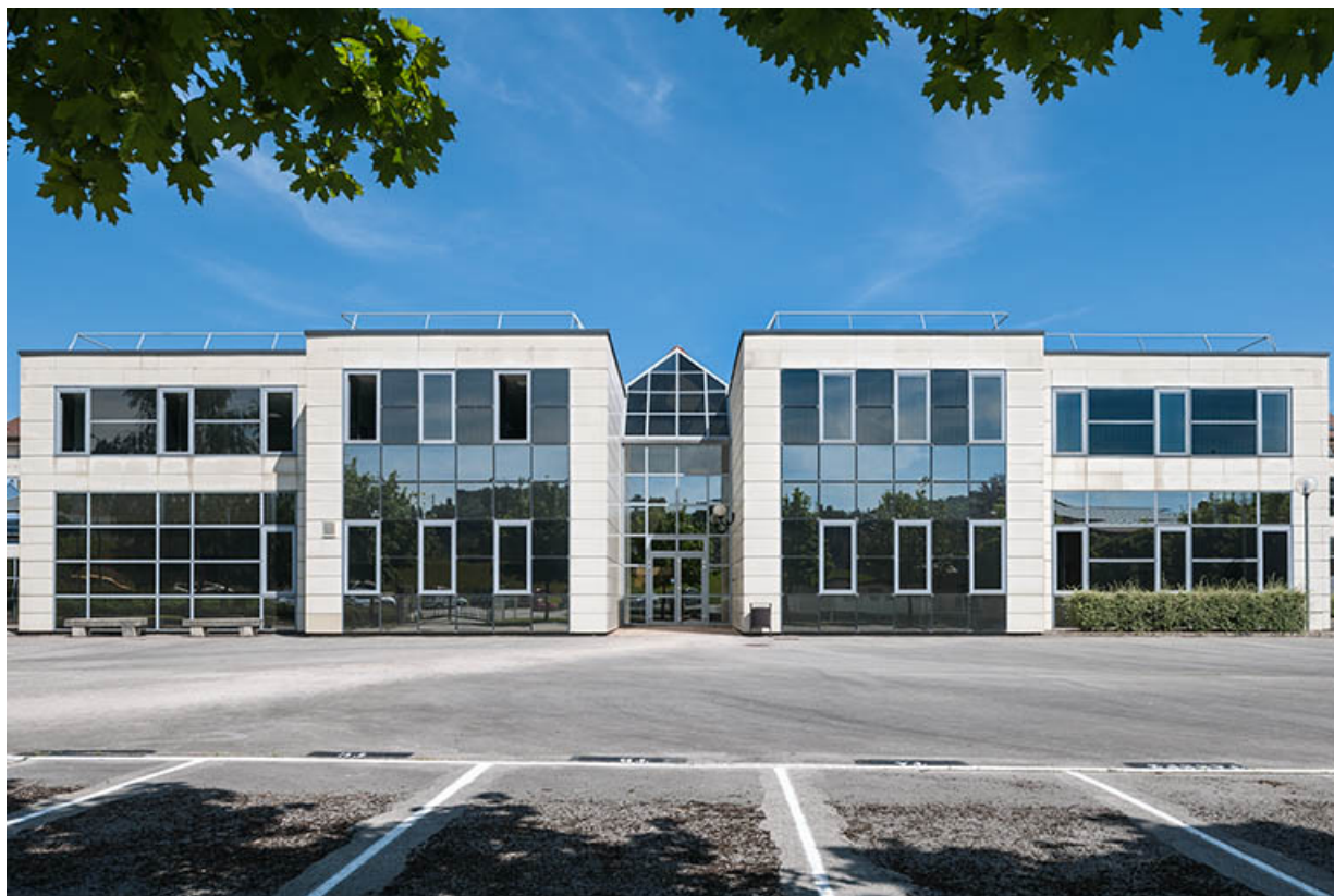
Lons-le-Saunier, lycée professionnel Montciel : façades de l'externat.