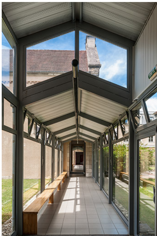
Passage latéral Est en fond de cour reliant la chapelle aux ailes d'externat.

39, Lons-le-Saunier, 1 avenue de Montciel