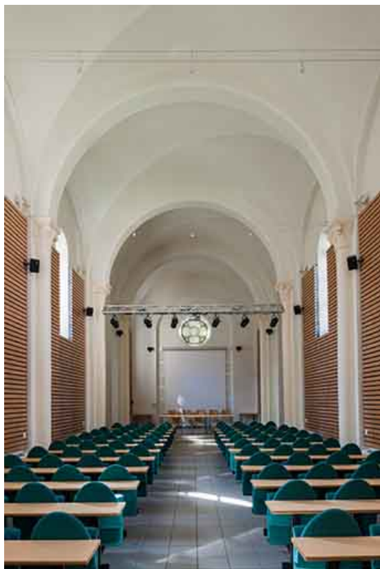
Vue intérieure de la chapelle depuis le porche d'entrée.

39, Lons-le-Saunier, 1 avenue de Montciel