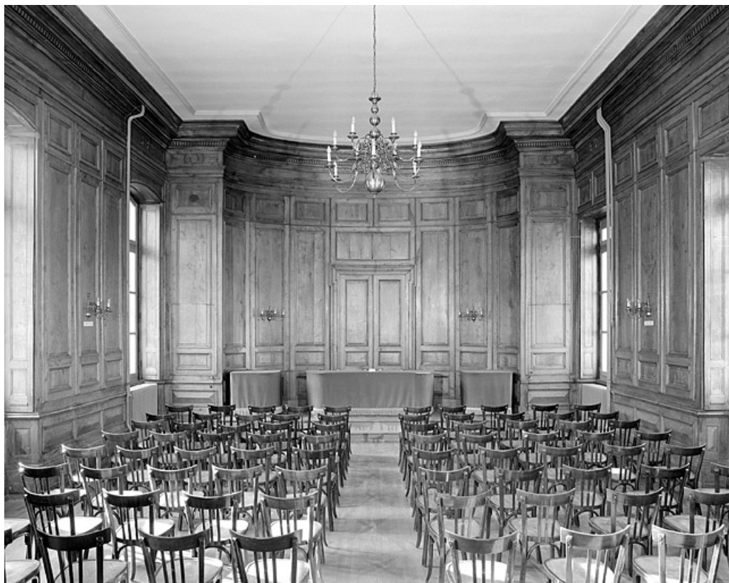
Ancienne salle du Tribunal, vue depuis l'entrée.

39, Lons-le-Saunier place de l' Hôtel de ville