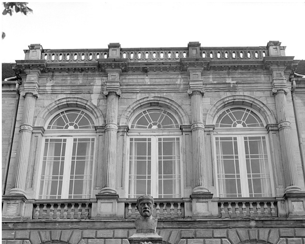
Façade nord. Détail : partie supérieure de l'avant-corps central.

39, Lons-le-Saunier place de l' Hôtel de ville