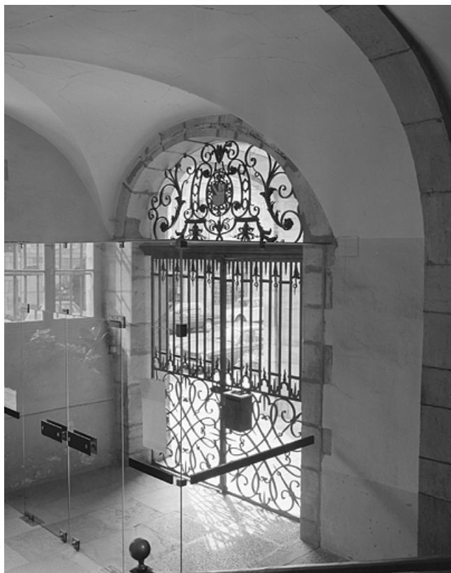
Vestibule : grille du pavillon du Jeu de l'Arquebuse.

39, Lons-le-Saunier place de l' Hôtel de ville