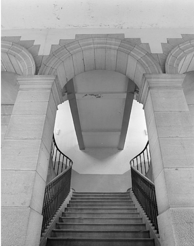
Escalier conduisant au Tribunal et à la Bibliothèque.

39, Lons-le-Saunier place de l' Hôtel de ville