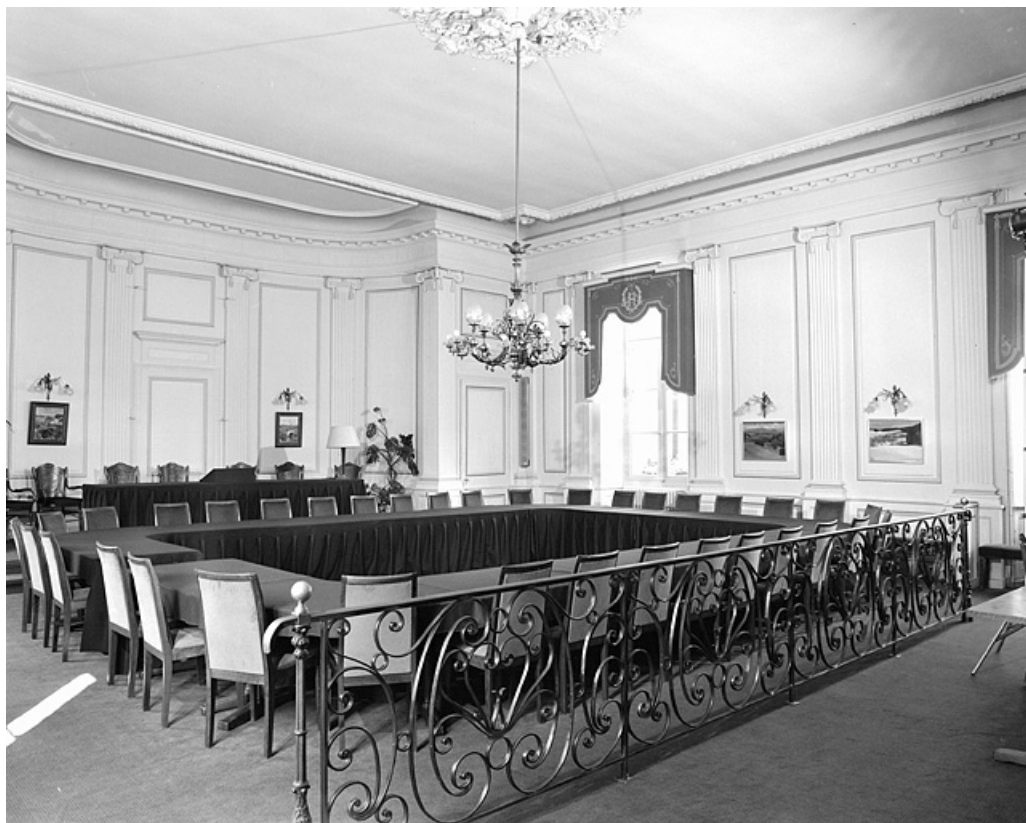
Salle du Conseil municipal : détail.

39, Lons-le-Saunier place de l' Hôtel de ville