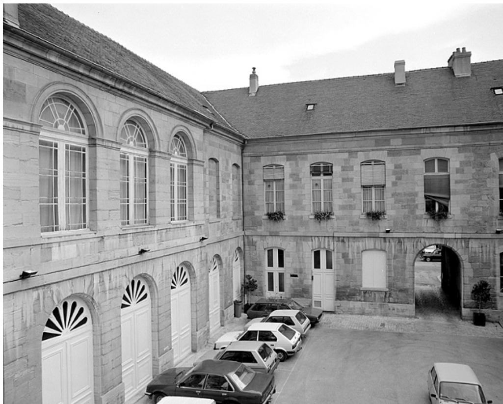
Cour intérieure : côtés nord et est.

39, Lons-le-Saunier place de l' Hôtel de ville