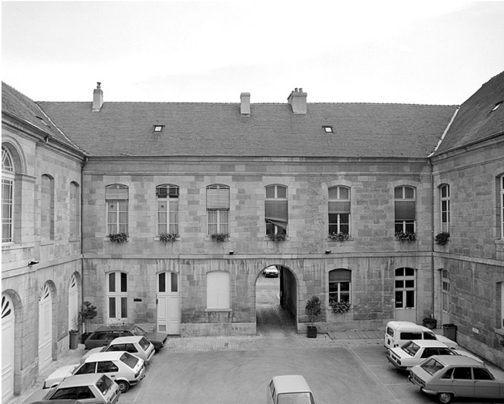
Cour intérieure, côté est.

39, Lons-le-Saunier place de l' Hôtel de ville