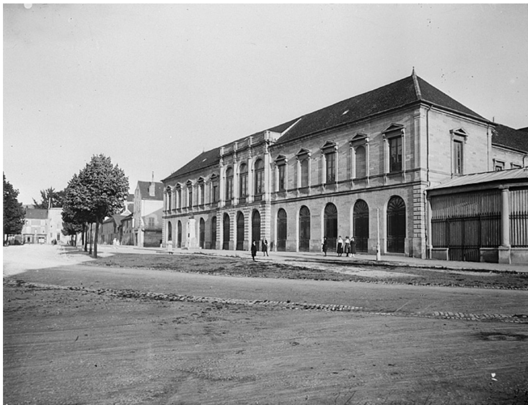
Façade nord montrant une partie de la halle.

39, Lons-le-Saunier place de l' Hôtel de ville