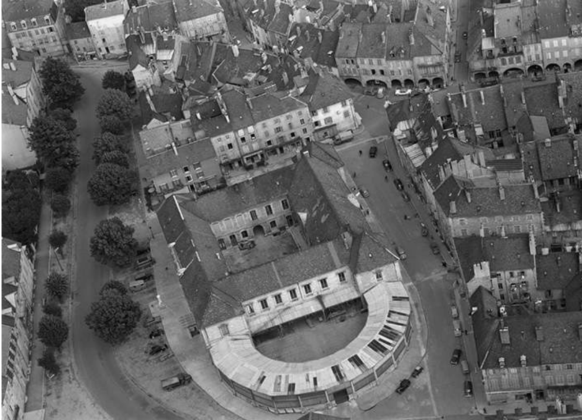
Vue aérienne en 1956, avec la halle. 39, Lons-le-Saunier place de l' Hôtel de ville