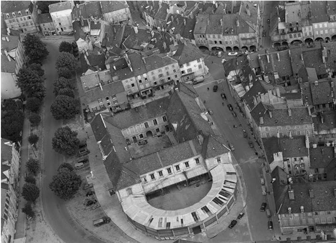
Vue aérienne en 1956, avec la halle. 39, Lons-le-Saunier place de l' Hôtel de ville