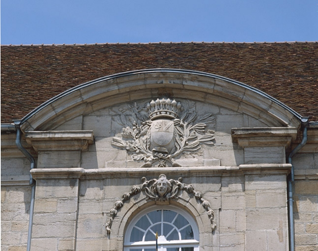
Détail du fronton de la façade sud.

39, Lons-le-Saunier place de l' Hôtel de ville