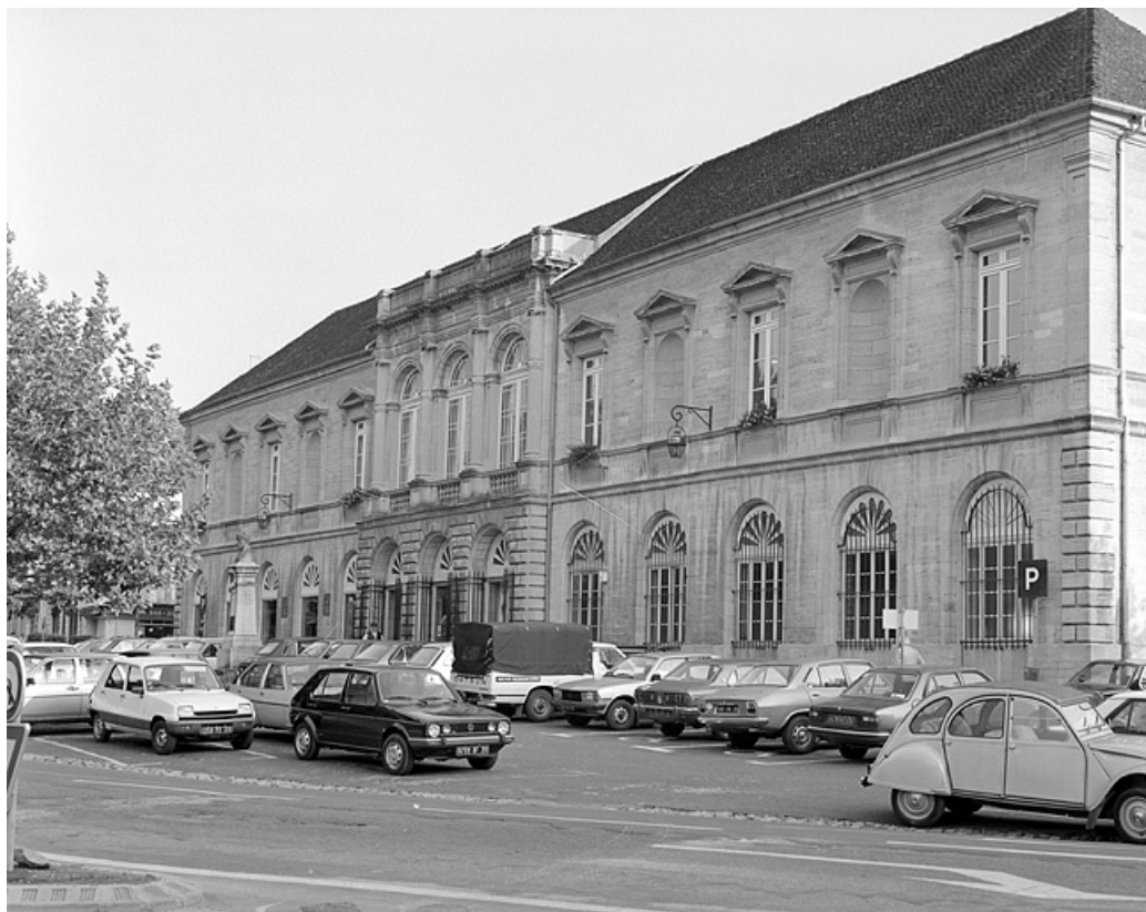
Façade nord vue de trois-quarts.

39, Lons-le-Saunier place de l' Hôtel de ville