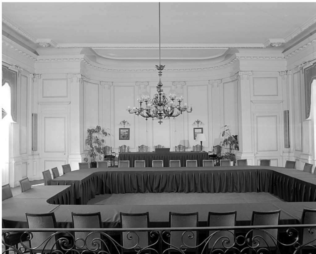
Salle du Conseil municipal : vue générale.

39, Lons-le-Saunier place de l' Hôtel de ville