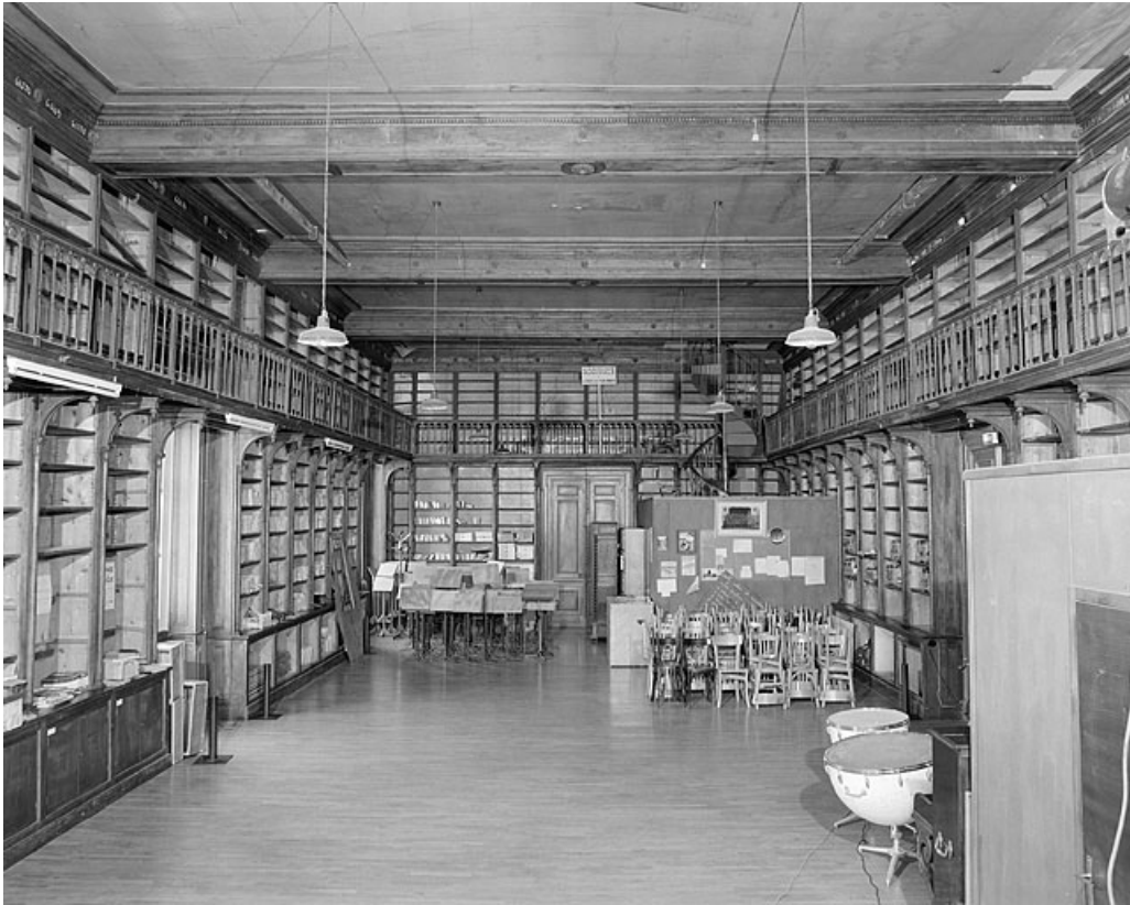
Ancienne salle de la Bibliothèque municipale, vue générale.

39, Lons-le-Saunier place de l' Hôtel de ville