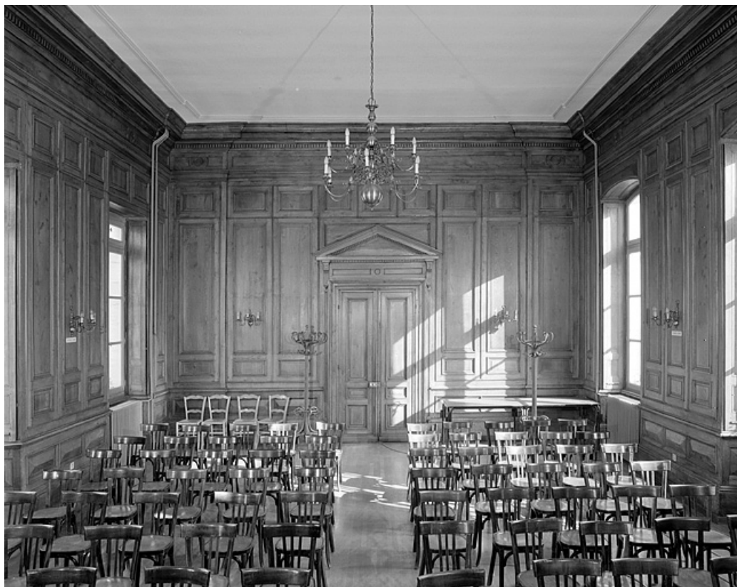
Ancienne salle du Tribunal, vue depuis l'abside.

39, Lons-le-Saunier place de l' Hôtel de ville