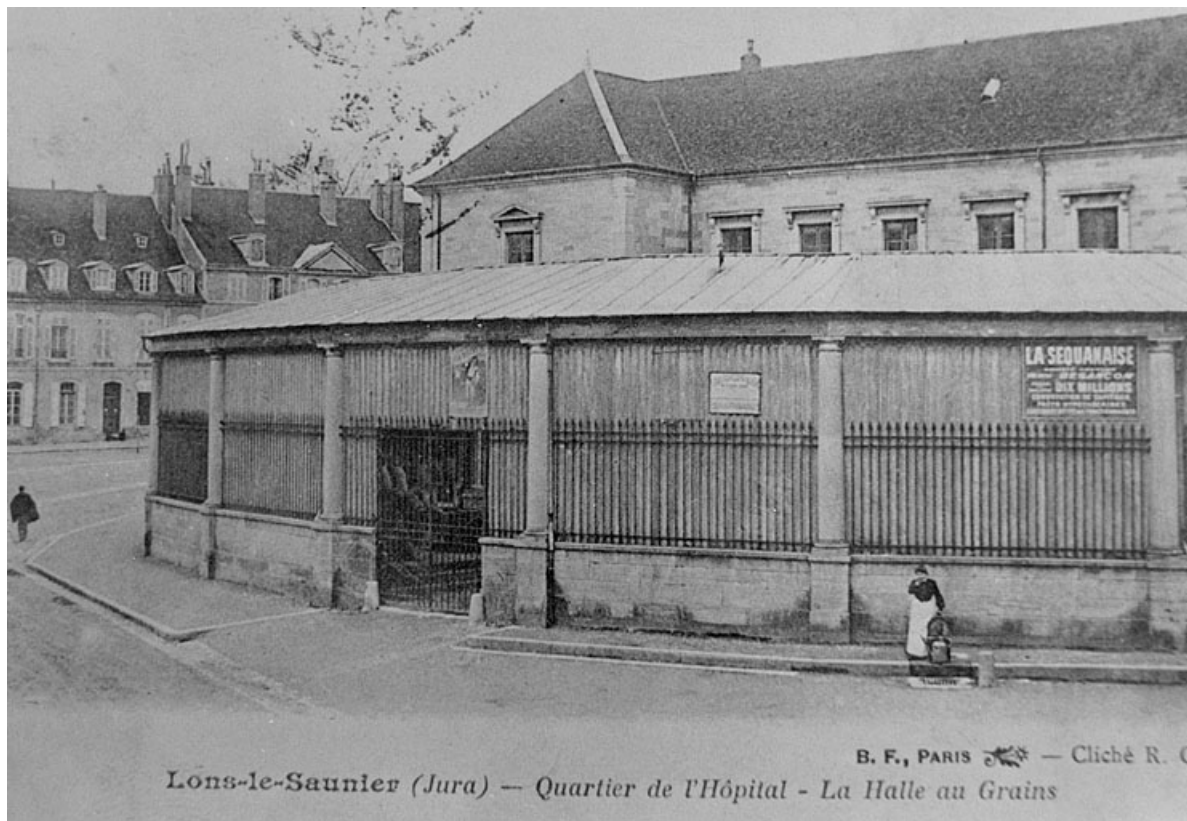
Vue de l'ancienne halle aujourd'hui détruite.

39, Lons-le-Saunier place de l' Hôtel de ville