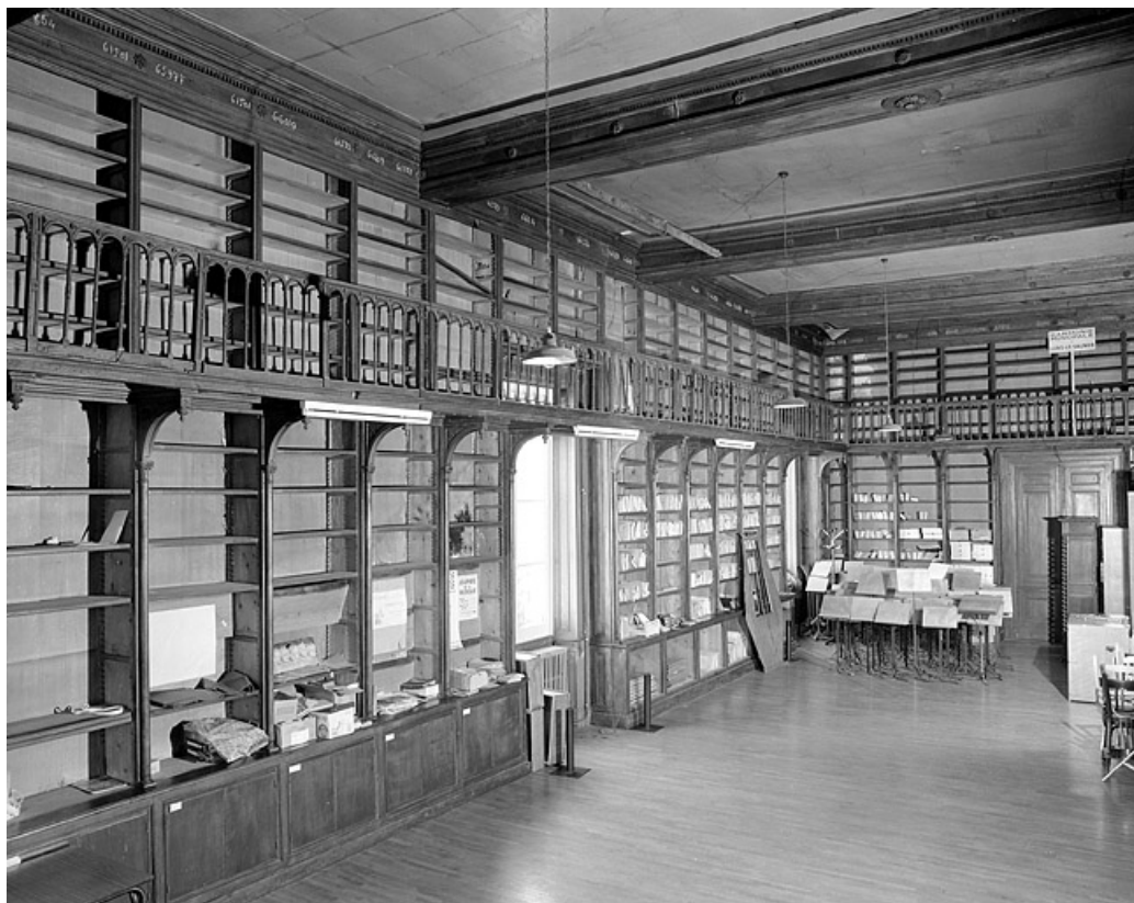
Ancienne salle de la Bibliothèque municipale, détail.

39, Lons-le-Saunier place de l' Hôtel de ville