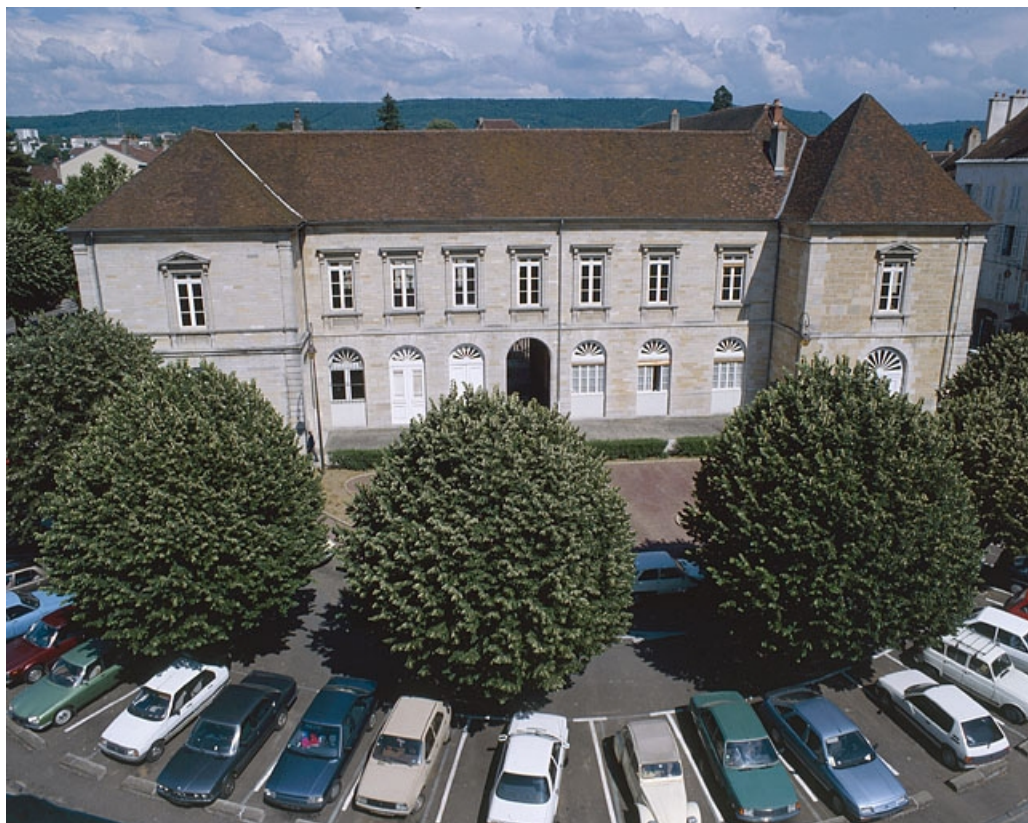
Façade ouest, vue d'ensemble.

39, Lons-le-Saunier place de l' Hôtel de ville