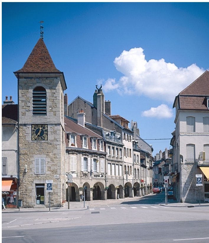
Le beffroi et la rue du Commerce.