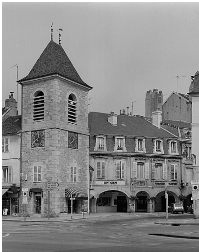
Vue d'ensemble. 39, Lons-le-Saunier