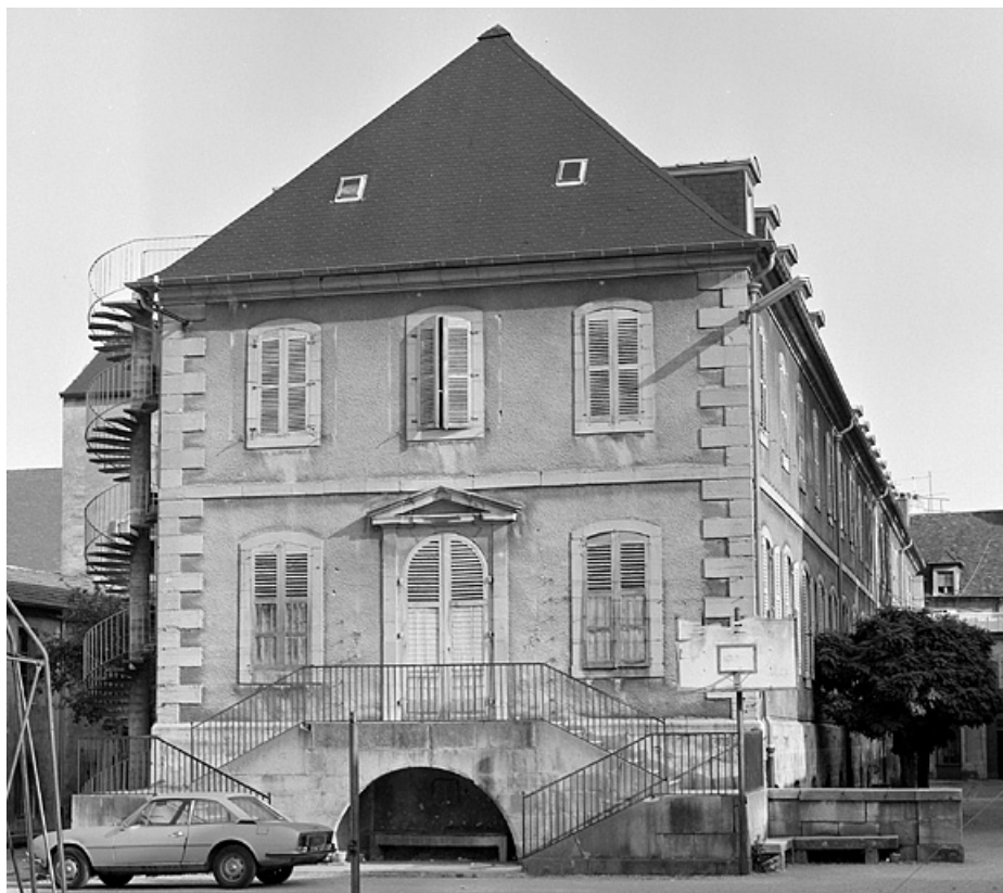
Bâtiment principal, façade sud.

39, Lons-le-Saunier, 15, 17, 19 rue de la Vallière