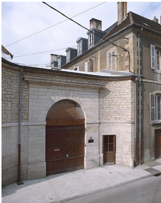
Le portail d'entrée. 39, Lons-le-Saunier