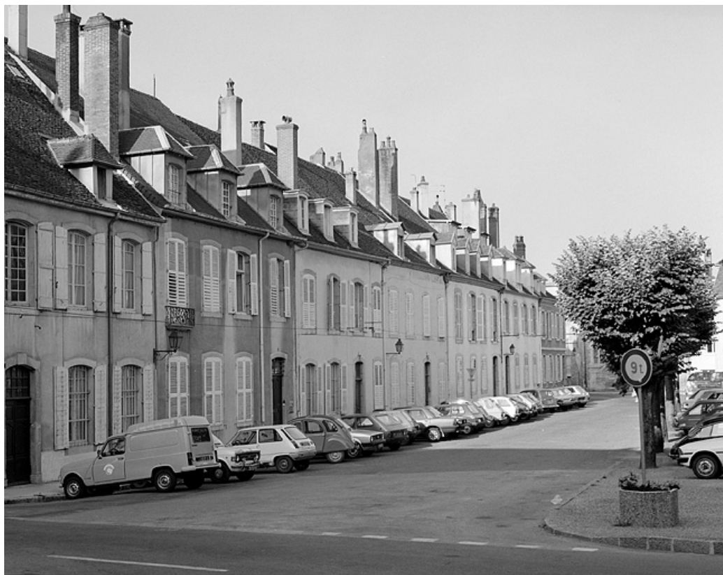
Maisons des chanoinesses. Vue d'ensemble : 1 à 13 place Bichat.