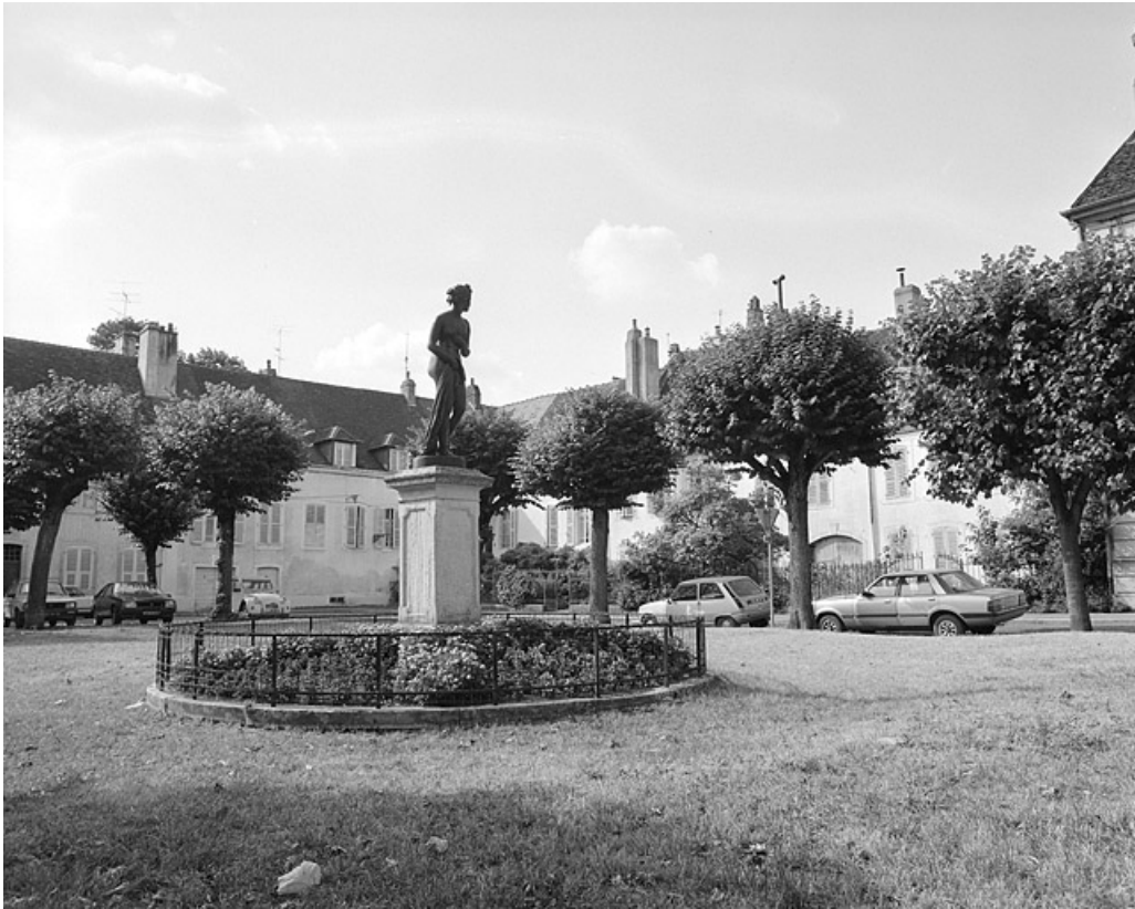
Espace libre sur l'emplacement de l'ancienne chapelle.