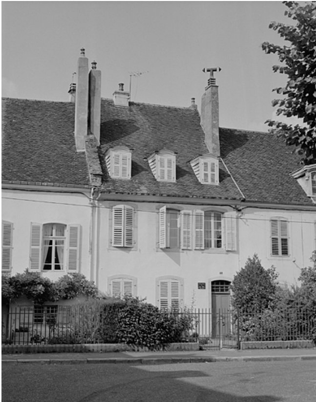
Maison de chanoinesse : 10 place Bichat.