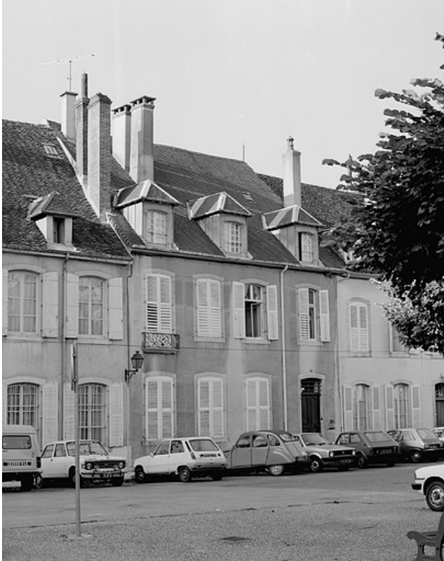
Maison de chanoinesse : 3 place Bichat.