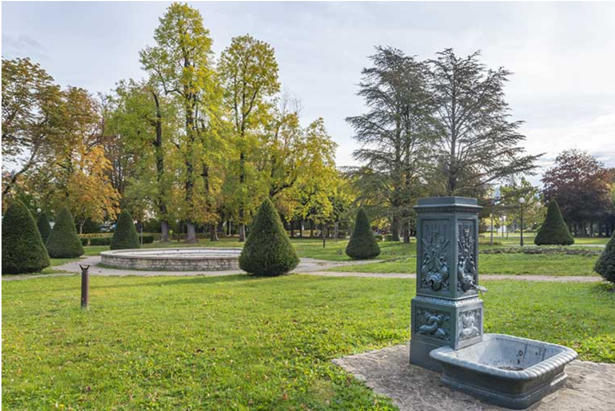
Bassin devant l'établissement thermal.

39, Lons-le-Saunier avenue Camille Prost