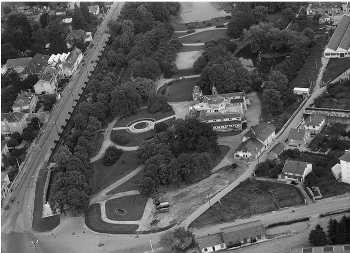
Vue aérienne en 1958.

39, Lons-le-Saunier avenue Camille Prost