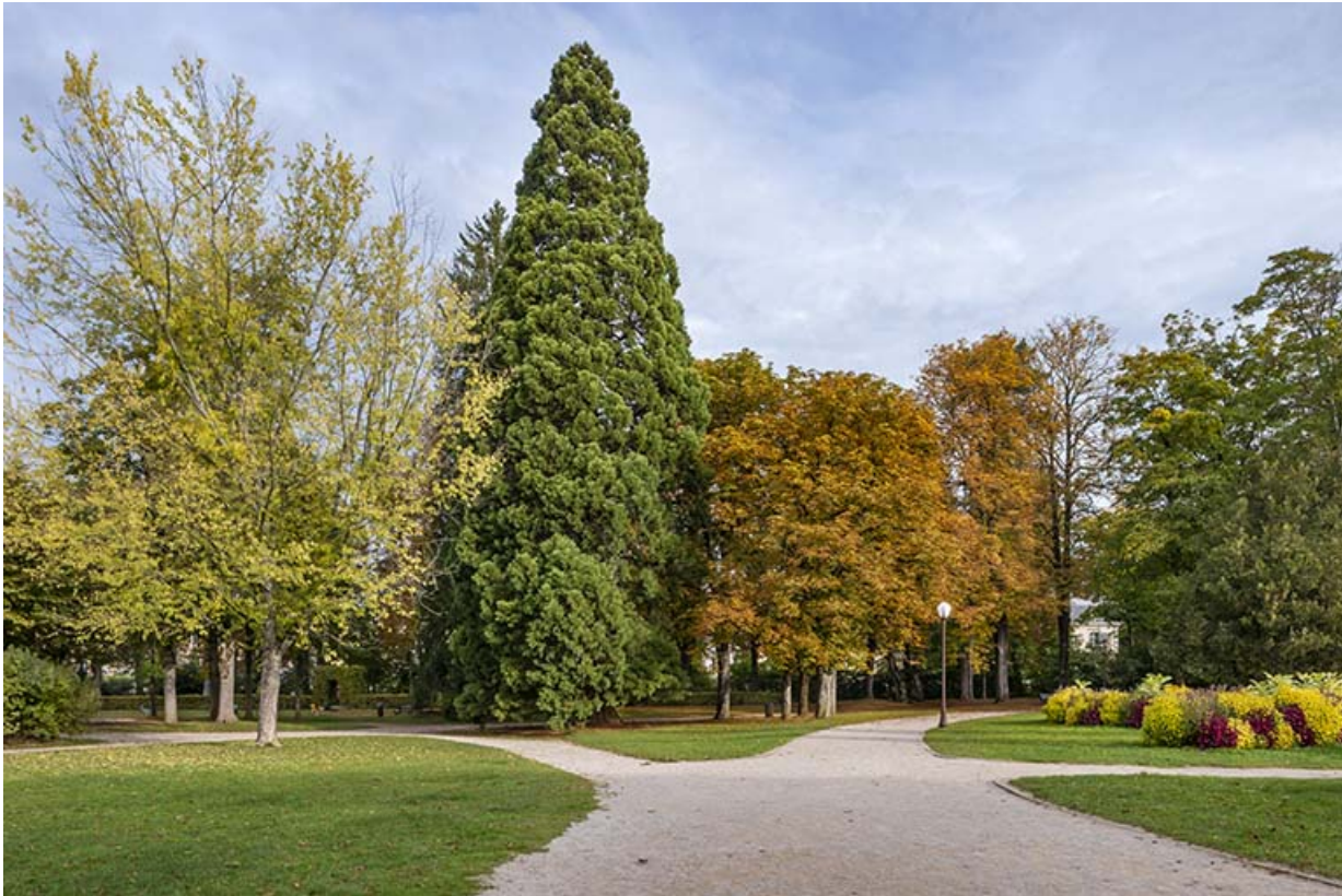
Allée ceinturant le lac.

39, Lons-le-Saunier avenue Camille Prost