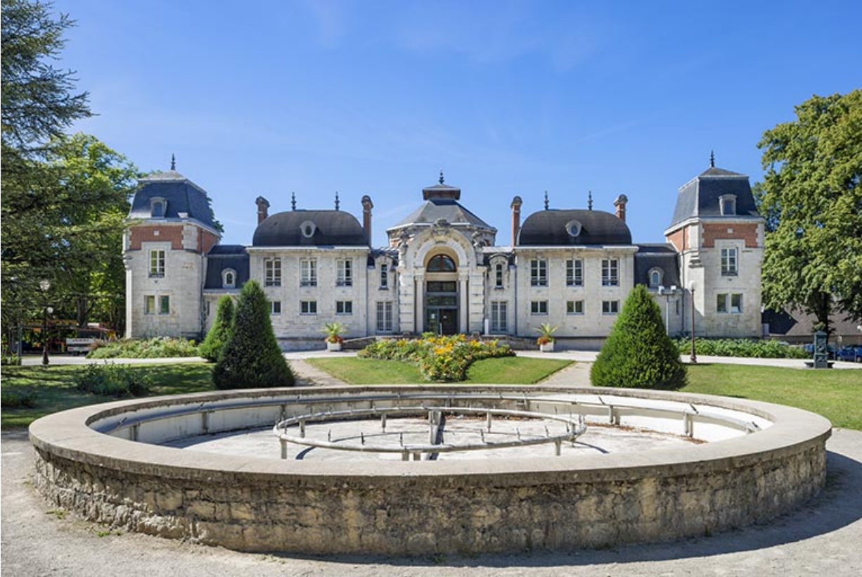
Bassin devant l'établissement thermal. 39, Lons-le-Saunier avenue Camille Prost