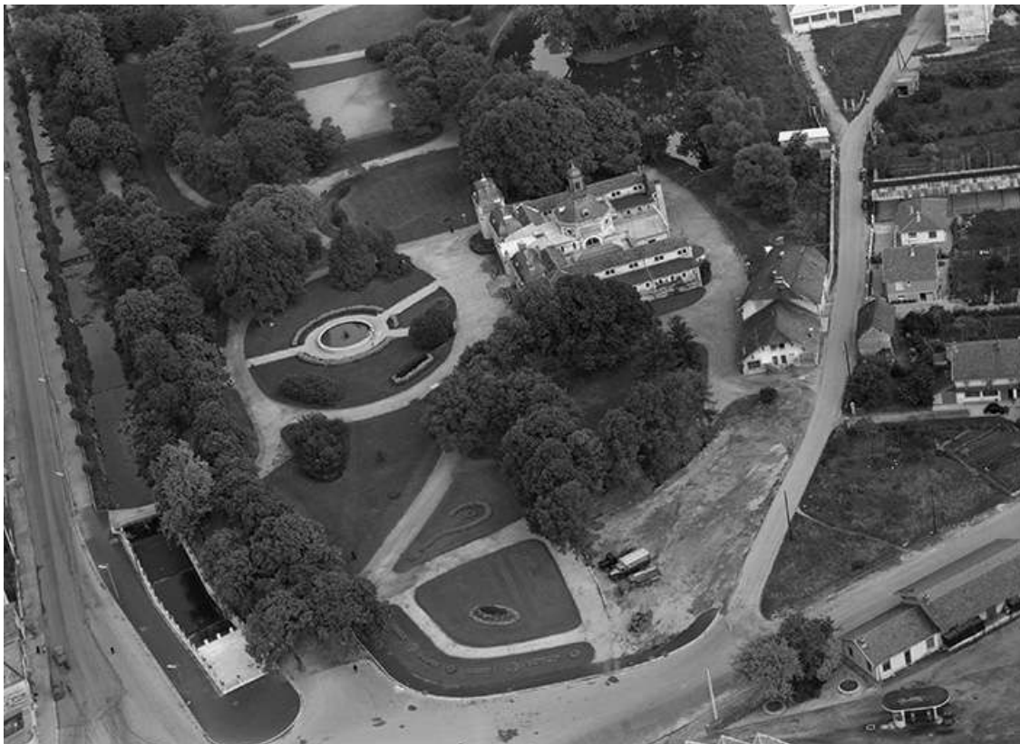
Vue aérienne en 1958.

39, Lons-le-Saunier avenue Camille Prost