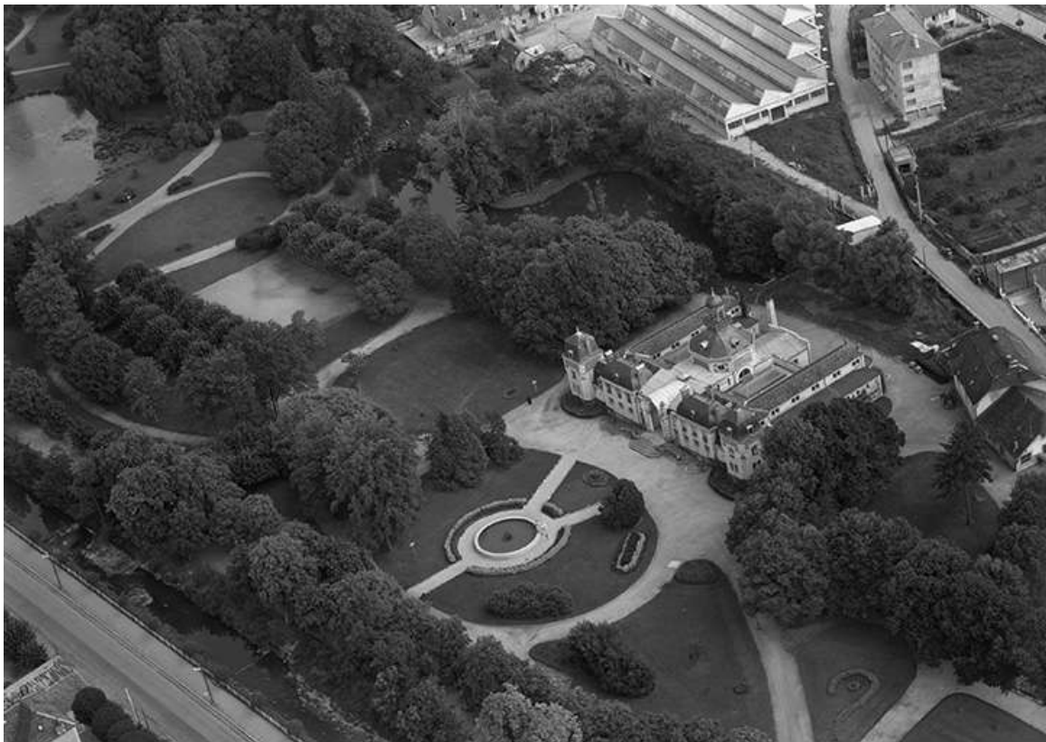
Vue aérienne en 1958.

39, Lons-le-Saunier avenue Camille Prost