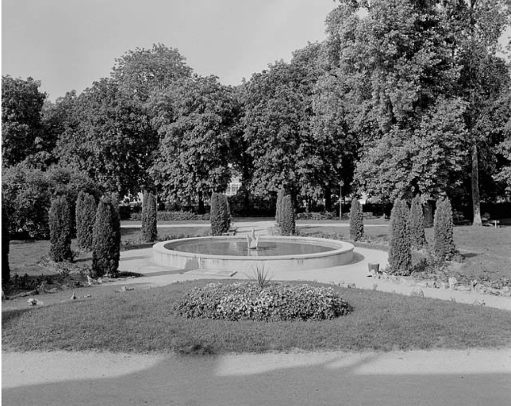
Bassin, devant l'Etablissement thermal.

39, Lons-le-Saunier avenue Camille Prost