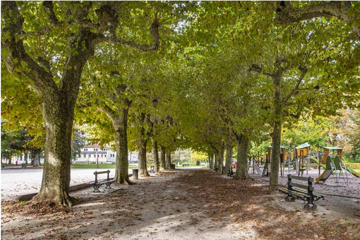
Allée bordant la zone gravillonnée (anciens terrains de tennis).

39, Lons-le-Saunier avenue Camille Prost