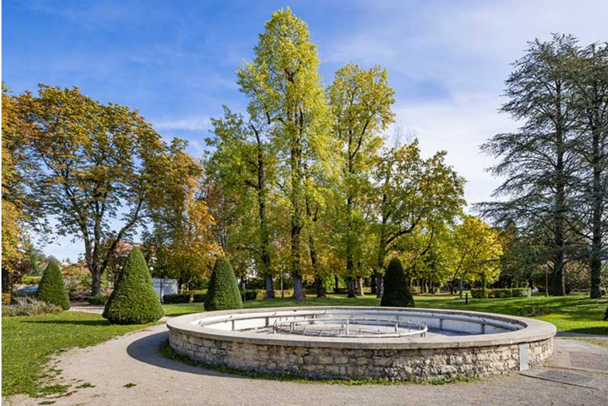
Bassin devant l'établissement thermal.

39, Lons-le-Saunier avenue Camille Prost