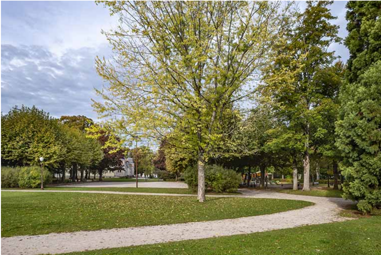
Allée entre le lac et la zone gravillonnée (anciens terrains de tennis).

39, Lons-le-Saunier avenue Camille Prost