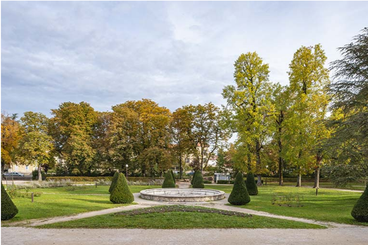
Bassin devant l'établissement thermal.

39, Lons-le-Saunier avenue Camille Prost