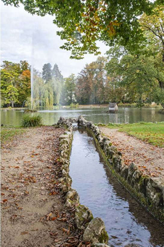
Rigole sud du lac.

39, Lons-le-Saunier avenue Camille Prost