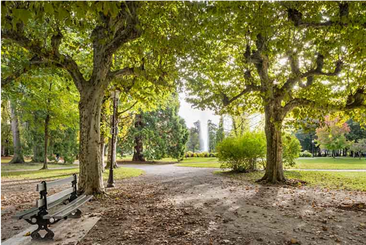
Allée bordant la zone gravillonnée (anciens terrains de tennis).

39, Lons-le-Saunier avenue Camille Prost