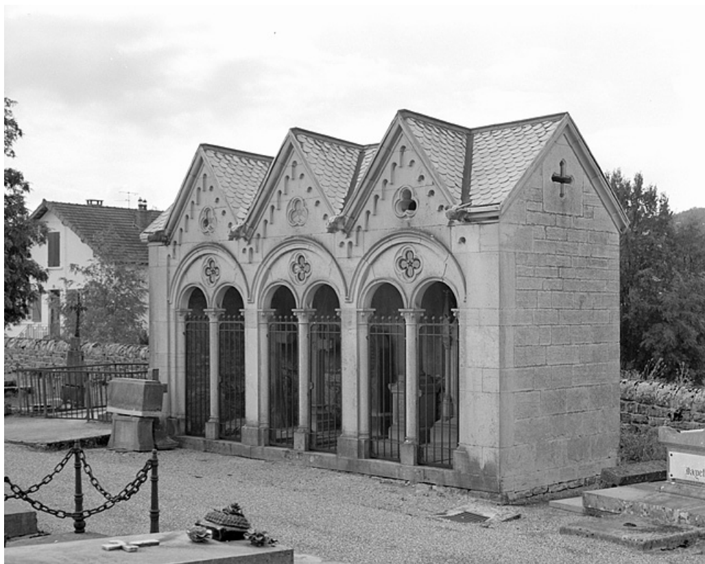
Tombe (vers 1860), signée Francoeur. Francoeur alias Mazoyer, sculpteur-marbrier à Lons-le-Saunier depuis 1848. 39, Lons-le-Saunier, 2 rue du Cimetière