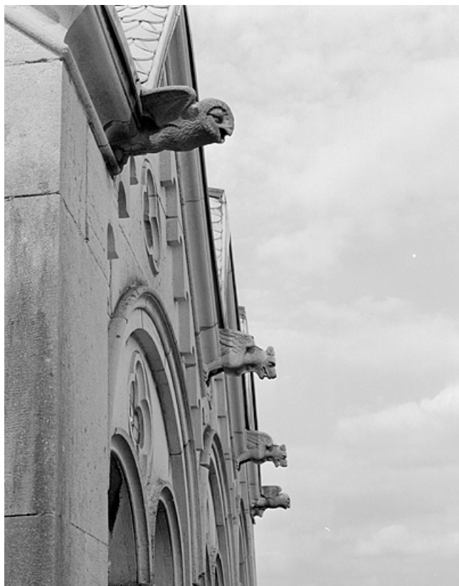
Tombe (vers 1860) : détail.