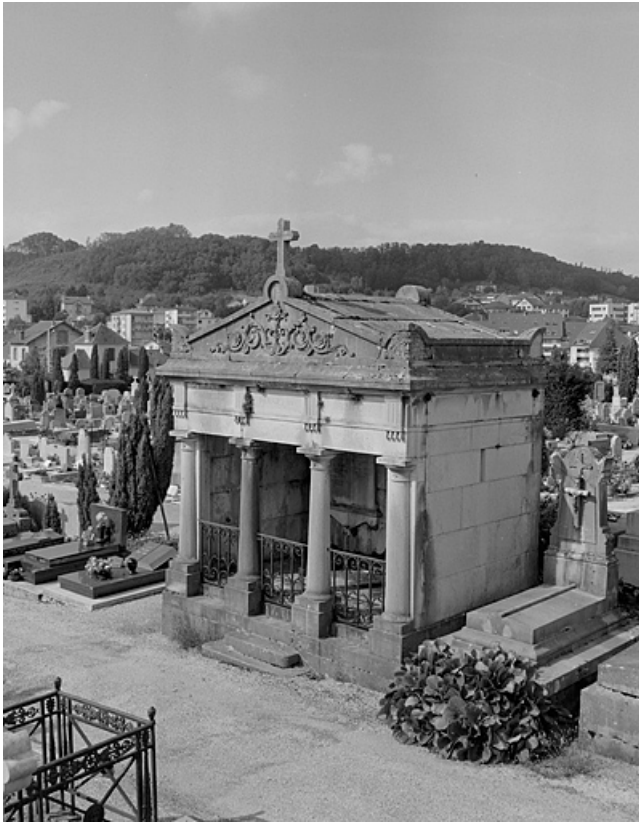
Tombe (vers 1895), signée Dumanèle. 39, Lons-le-Saunier, 2 rue du Cimetière