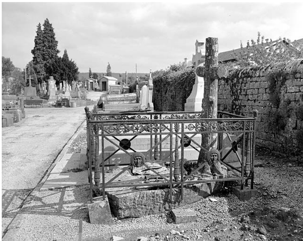
Tombe (vers 1848).