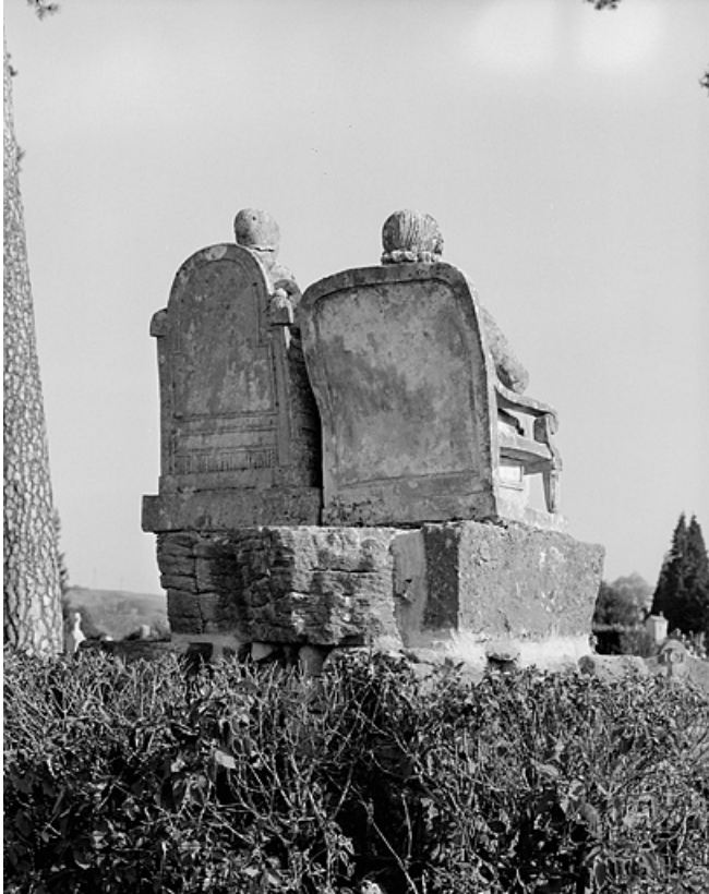
Tombe (vers 1844) : vue postérieure. 39, Lons-le-Saunier, 2 rue du Cimetière