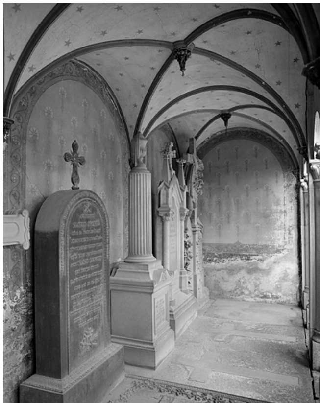
Tombe (vers 1860) : détail.