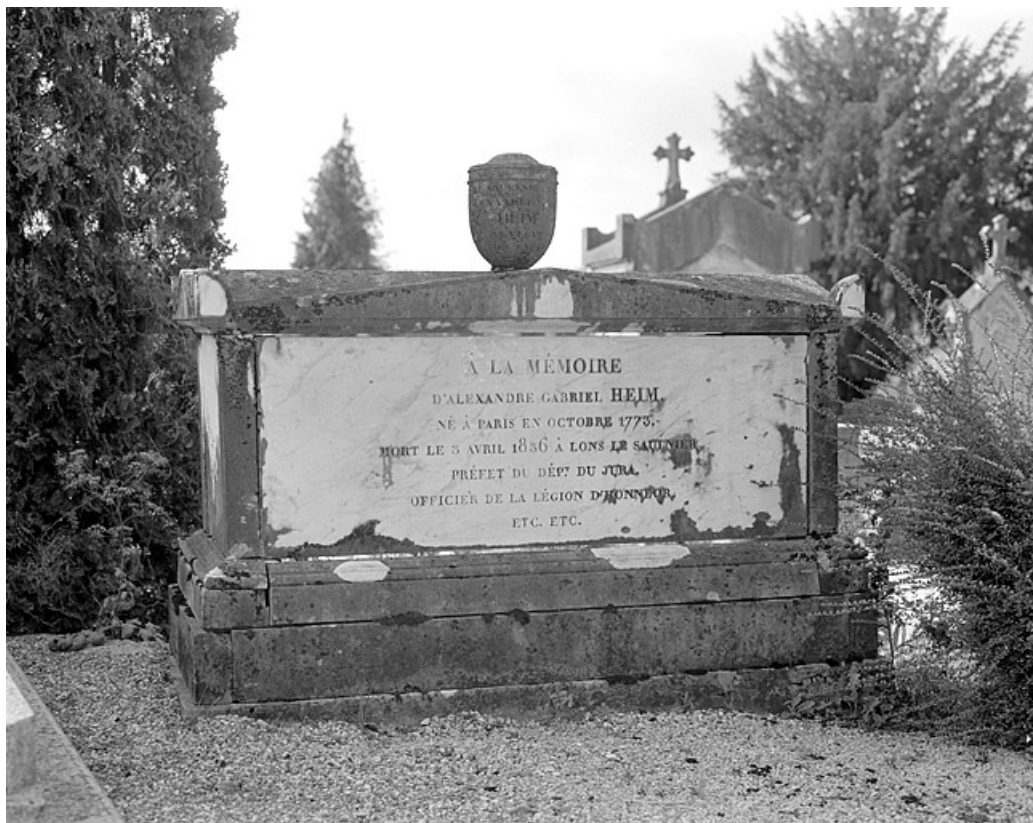
Tombe (vers 1836).