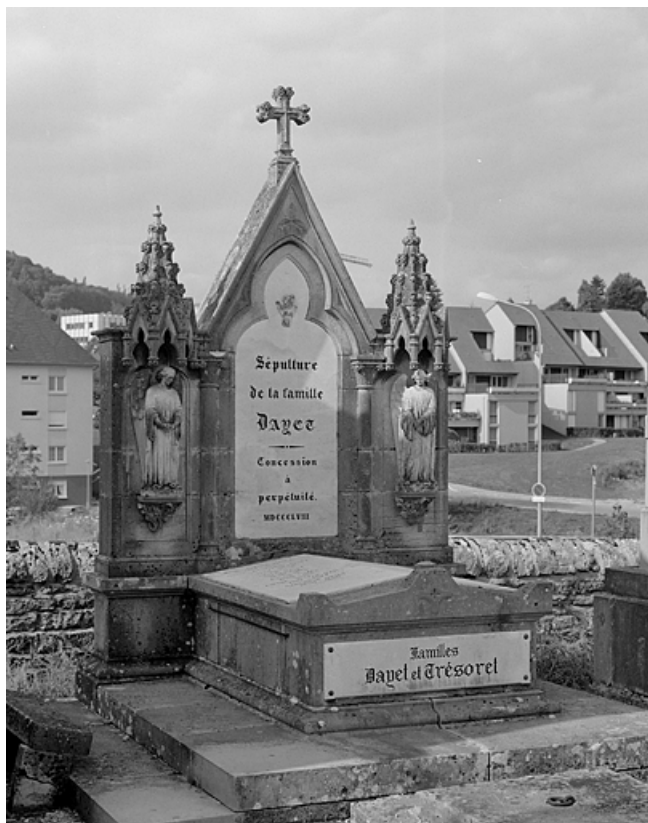
Tombe (vers 1858).