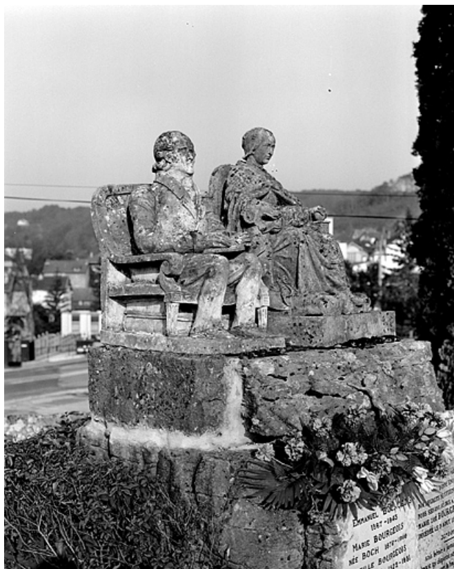
Tombe (vers 1844) : vue antérieure.