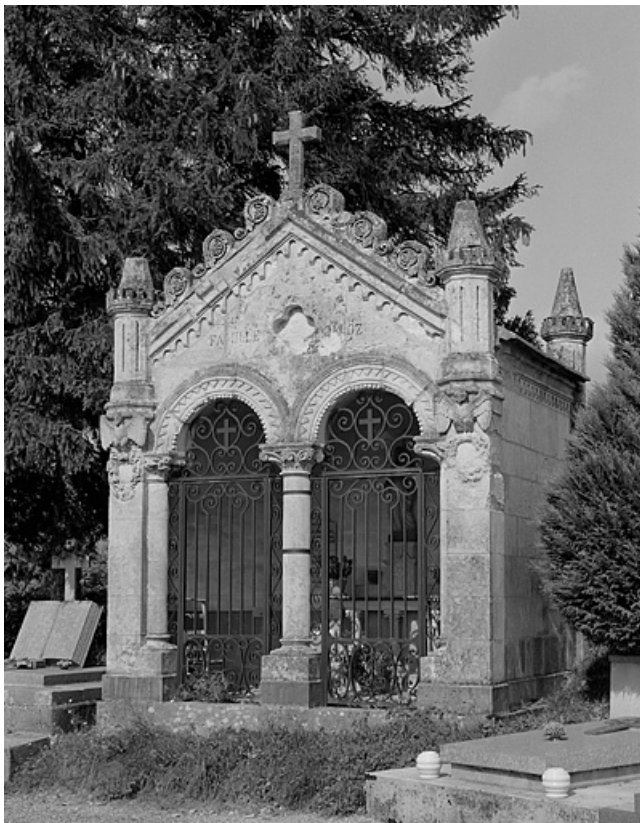
Tombe (vers 1850-1860 ?).