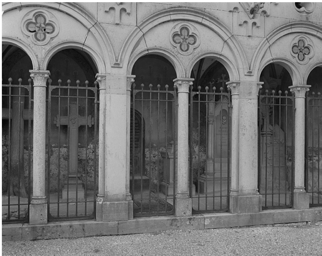
Tombe (vers 1860) : détail.