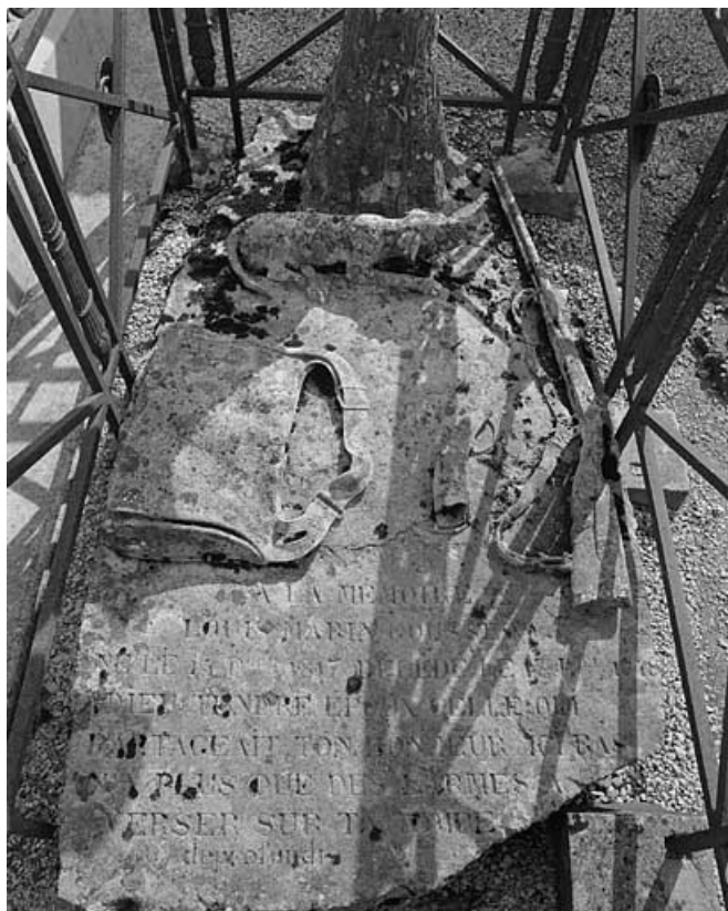
Tombe (vers 1848) : détail.