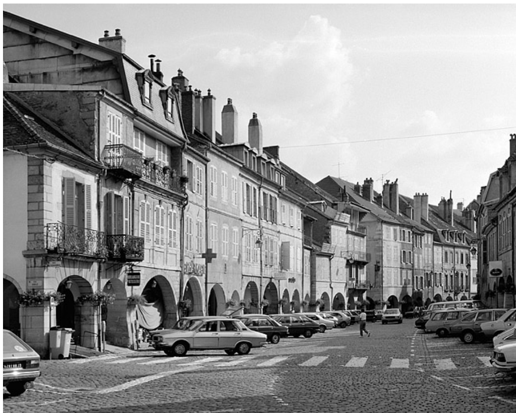
Côté impair entre la rue Sébile et la rue Traversière.