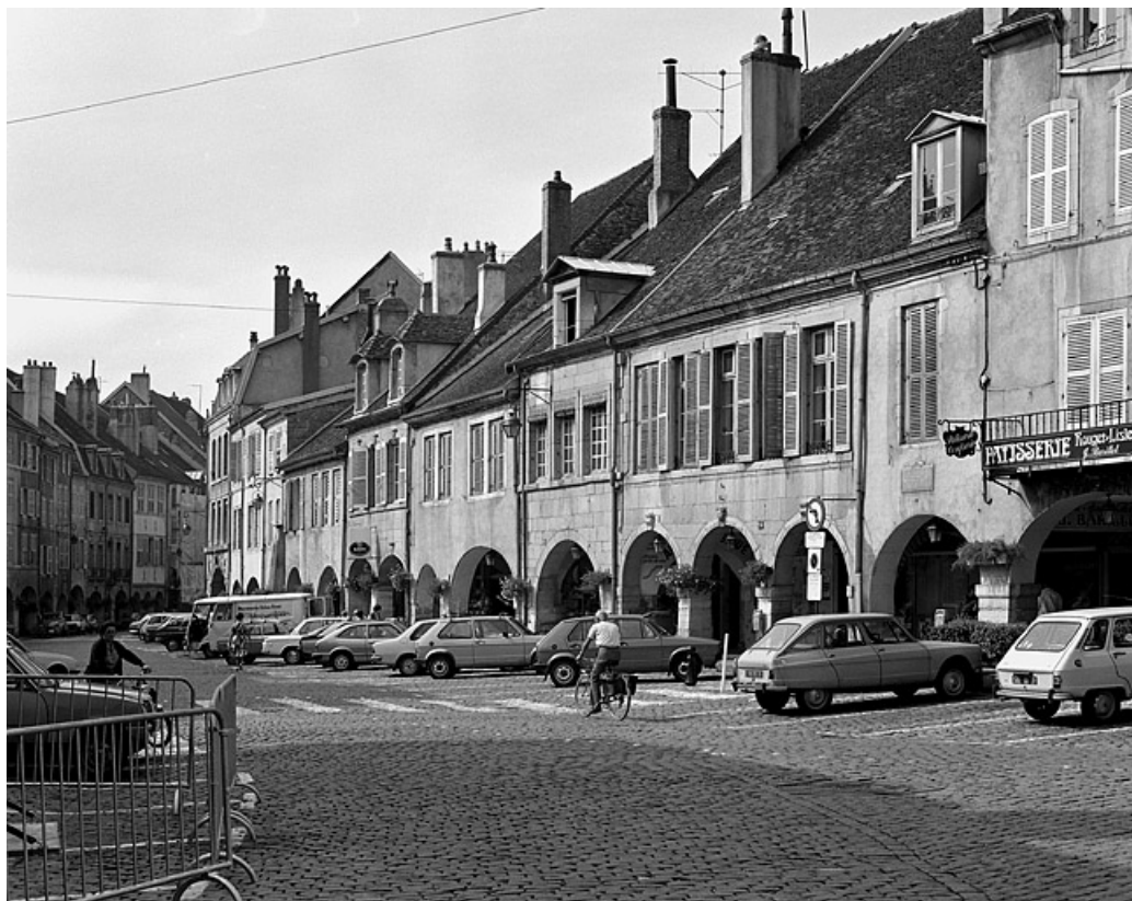
Côté pair vers la place de l'Hôtel de Ville.