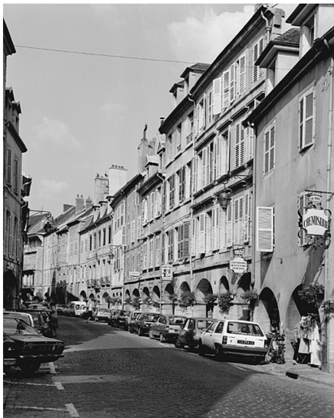
Côté impair entre la place de la Liberté et la rue Traversière. 39, Lons-le-Saunier rue du Commerce