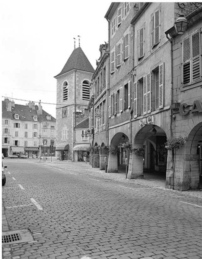
Côté pair près de la Tour de l'Horloge et de la place de la Liberté. 39, Lons-le-Saunier rue du Commerce