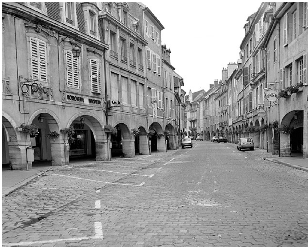
Vue générale depuis la place de la Liberté.