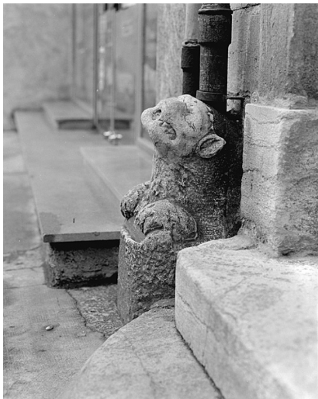
Gargouille saillante déposée contre le n° 14. 39, Lons-le-Saunier rue du Commerce