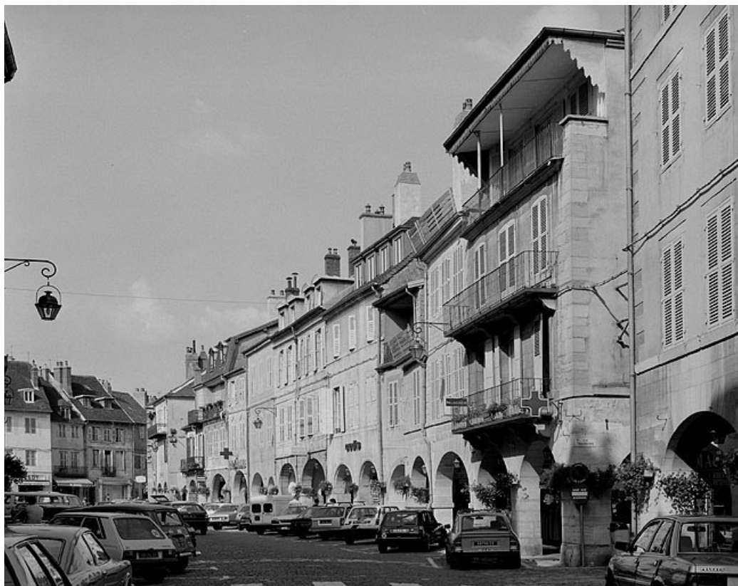
Côté impair entre la rue Traversière et la rue Sébile.