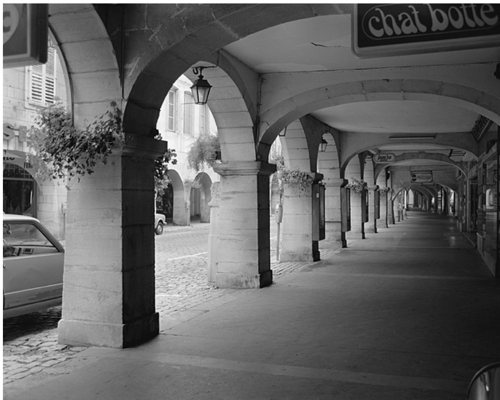
Vue de l'enfilade des galeries ouvertes en rez-de-chaussée formant passage (côté impair). 39, Lons-le-Saunier rue du Commerce