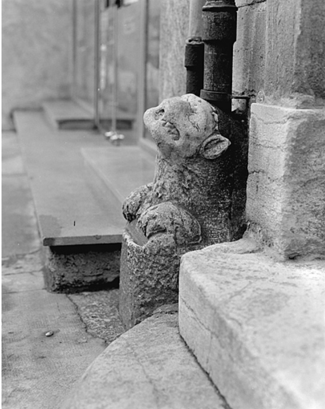
Gargouille saillante déposée contre le n° 14. 39, Lons-le-Saunier rue du Commerce