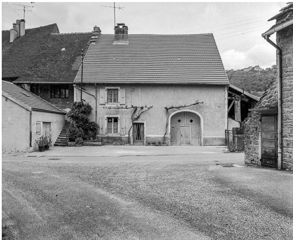
Ferme cadastrée 1961 AH 116, située rue du Chalet : façade sur rue. 39, Voiteur