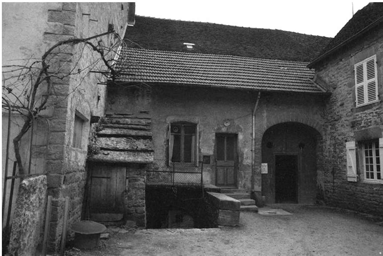
Maison de vigneron cadastrée 1961 AH 93, située rue du Presbytère : façade antérieure. 39, Voiteur