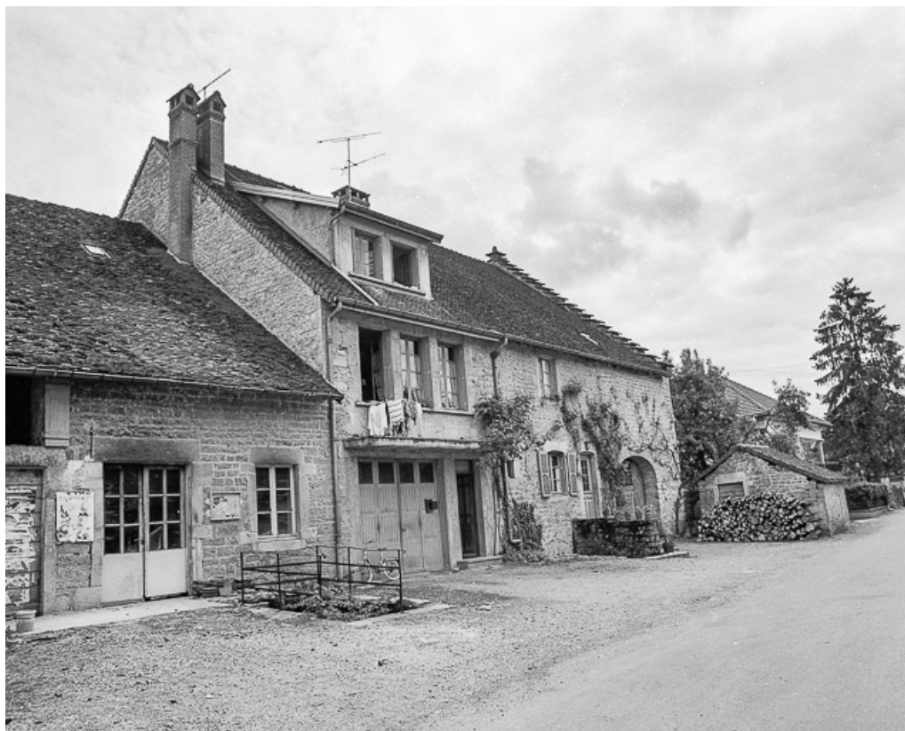
Ferme située rue du Presbytère : façade antérieure vue de trois quarts gauche. 39, Voiteur