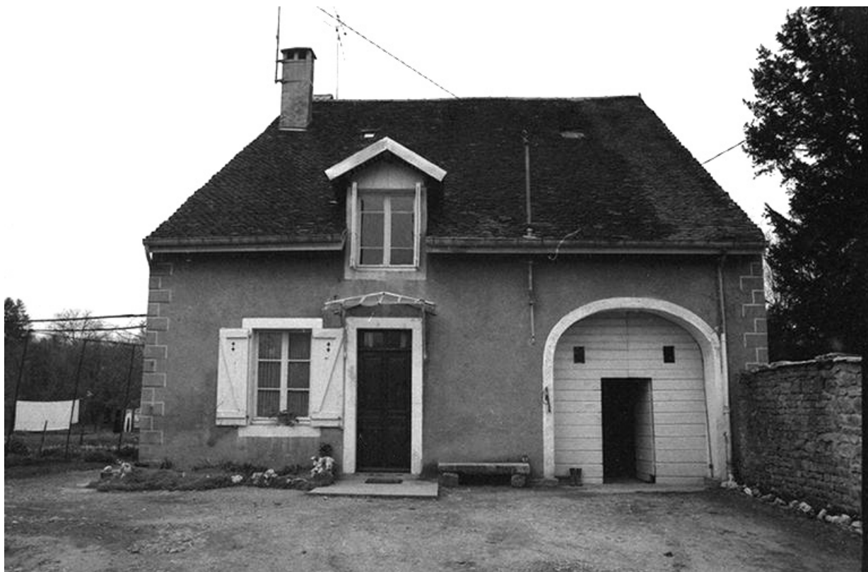
Maison cadastrée 1961 AH 56, située rue du Presbytère : façade antérieure. 39, Voiteur