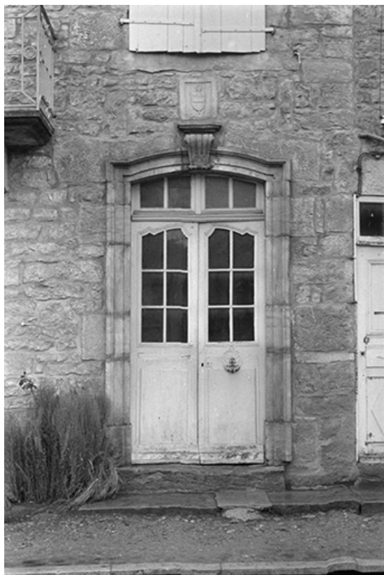
Porte de maison avec blason, 18ème siècle : vue de face 39, Voiteur