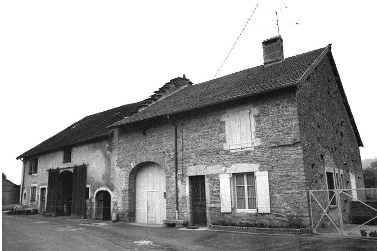
Ferme cadastrées 1961 AH 152-153, située rue des Guichard : façades antérieures. 39, Voiteur