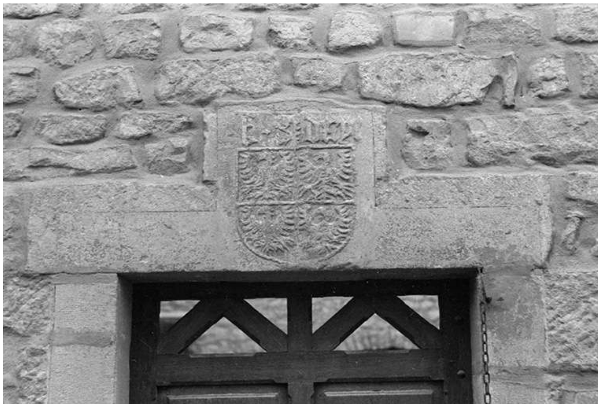
Porte de maison : blason, 16ème siècle.