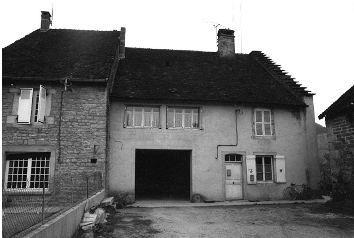
Ferme cadastrée 1961 AH 154, située rue des Guichard : façade antérieure. 39, Voiteur