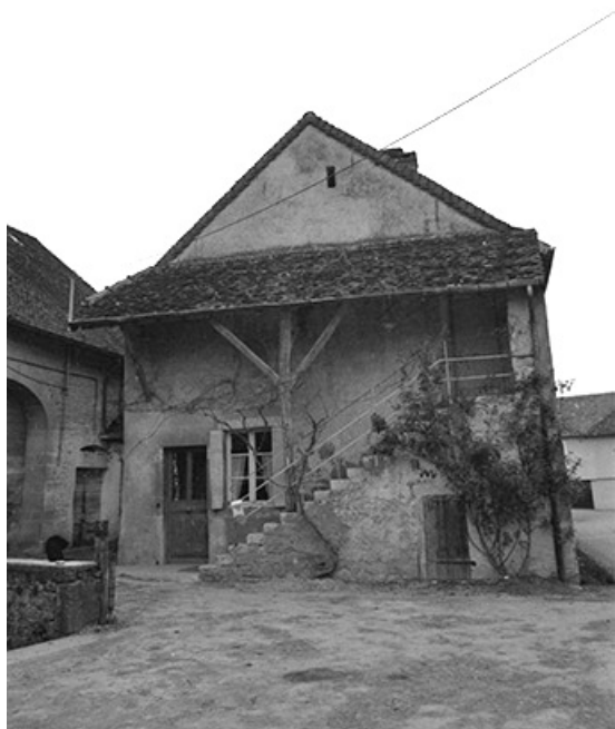
Ferme cadastrés 1961 AH 26, située rue des Guichard : façade antérieure. 39, Voiteur