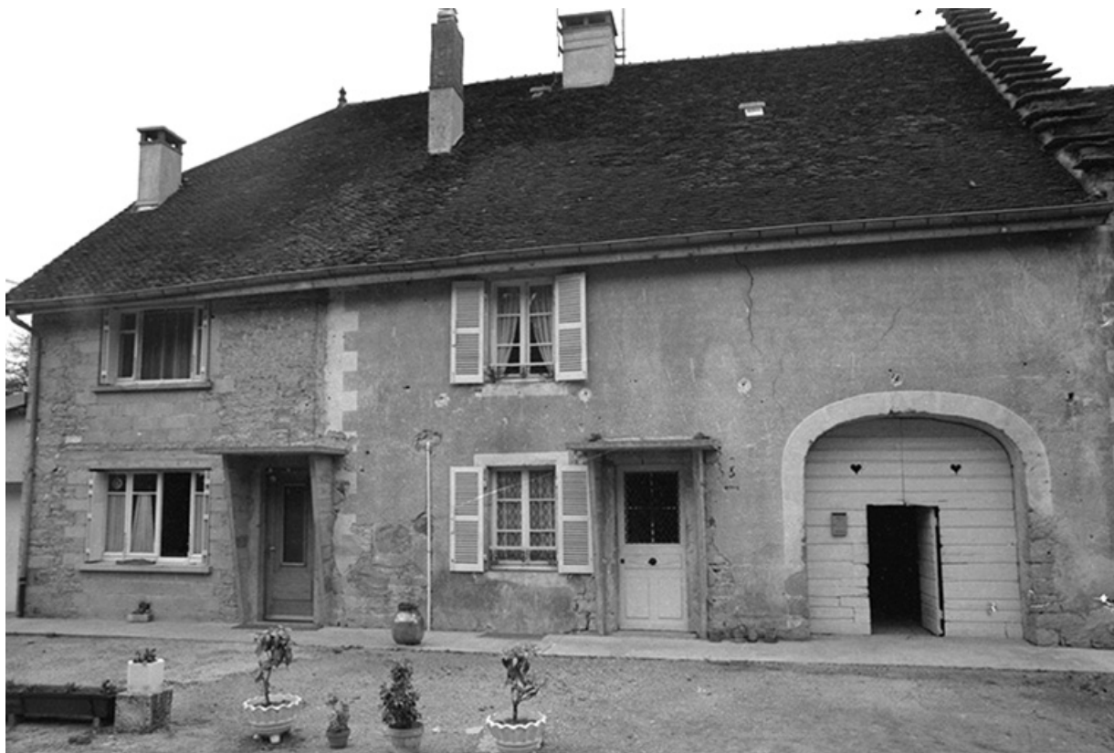
Maison cadastrée 1961 AH 199, située rue des Guichard : façade antérieure. 39, Voiteur