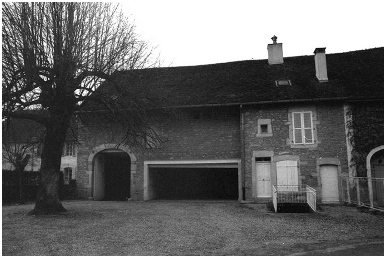
Maison de vigneron : façade antérieure.