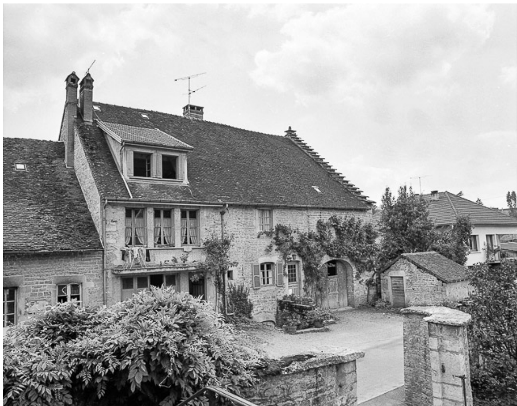
Ferme située rue du Presbytère : vue d'ensemble.