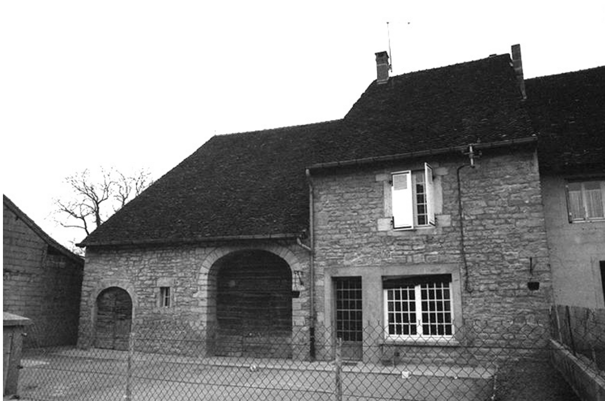
Ferme cadastrée 1961 AH 134, située rue des Guichard : façade antérieure. 39, Voiteur