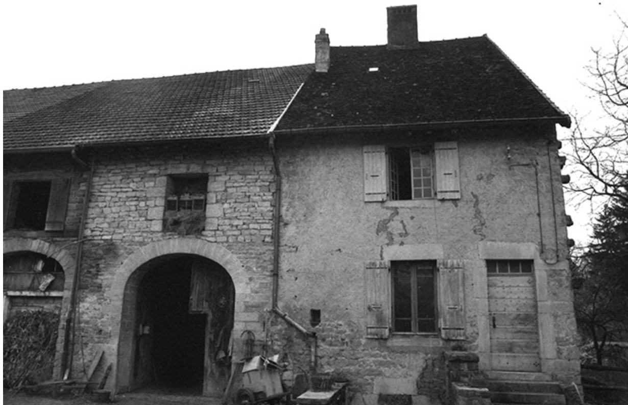
Ferme cadastrée 1961 AH 142, située rue des Guichard : façade antérieure. 39, Voiteur