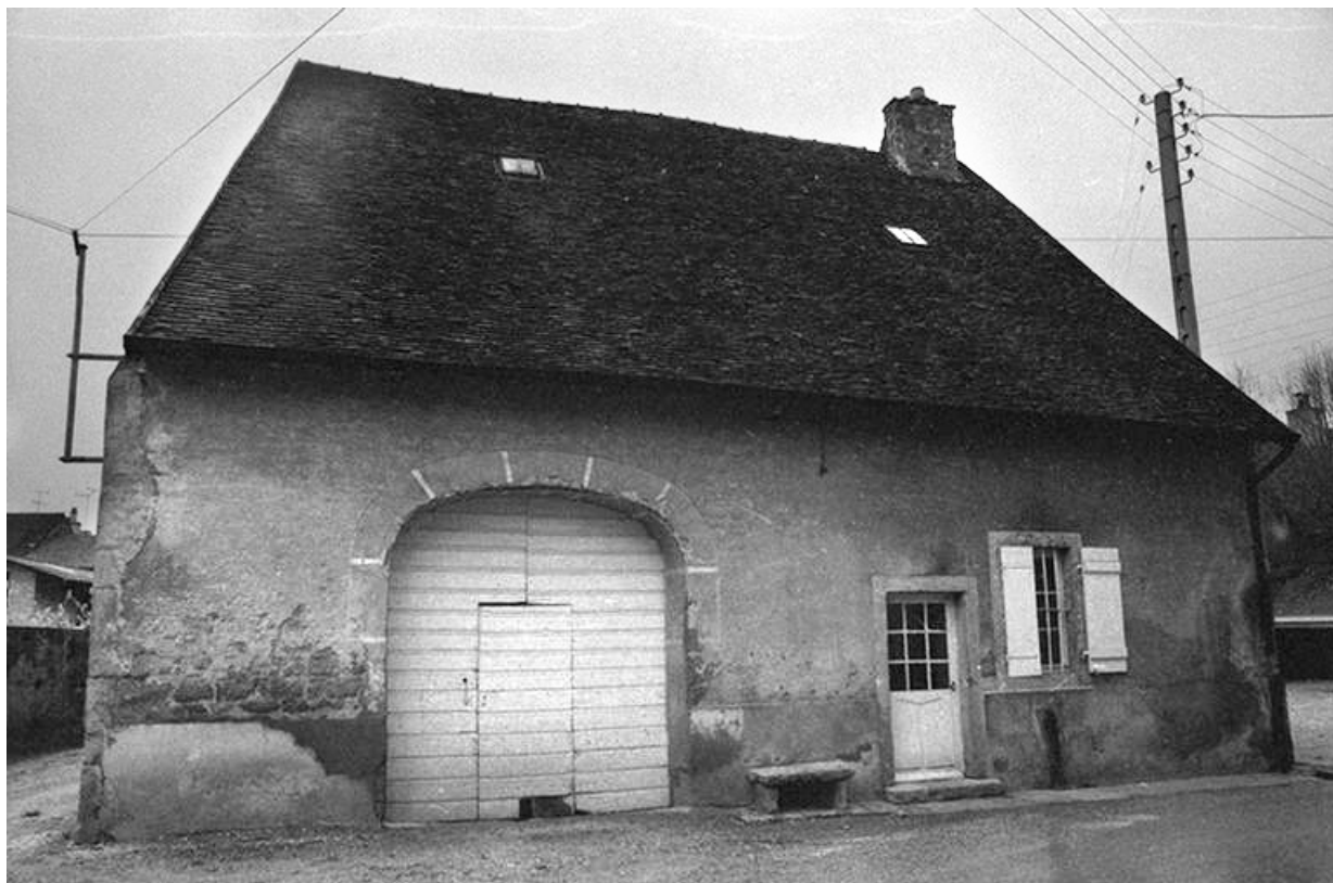
Ferme : façade antérieure.