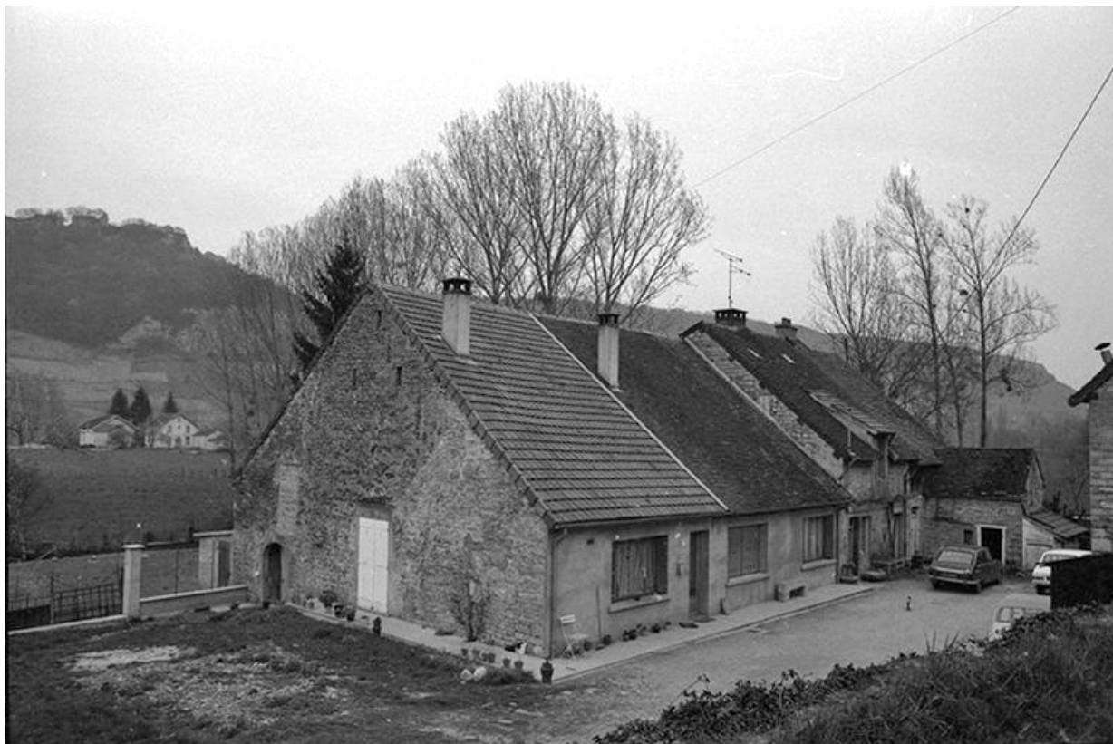
Maisons cadastrées 1961 AH 72, 73, 77, situées au lieudit Champ Louvent : façades antérieures 39, Voiteur