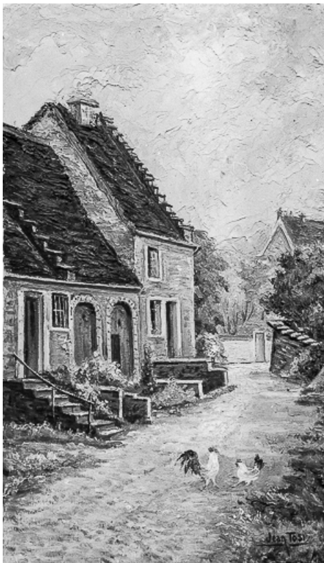
Ferme situées rue des Guichard : façades antérieures vue de trois quarts gauche. 39, Voiteur