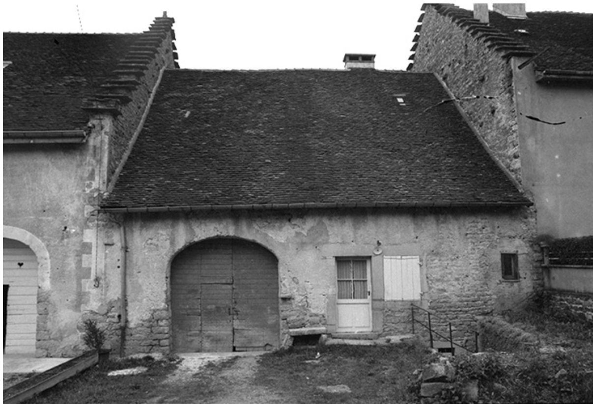
Ferme cadastrée 1961 AH 200, située rue des Guichard : façade antérieure. 39, Voiteur