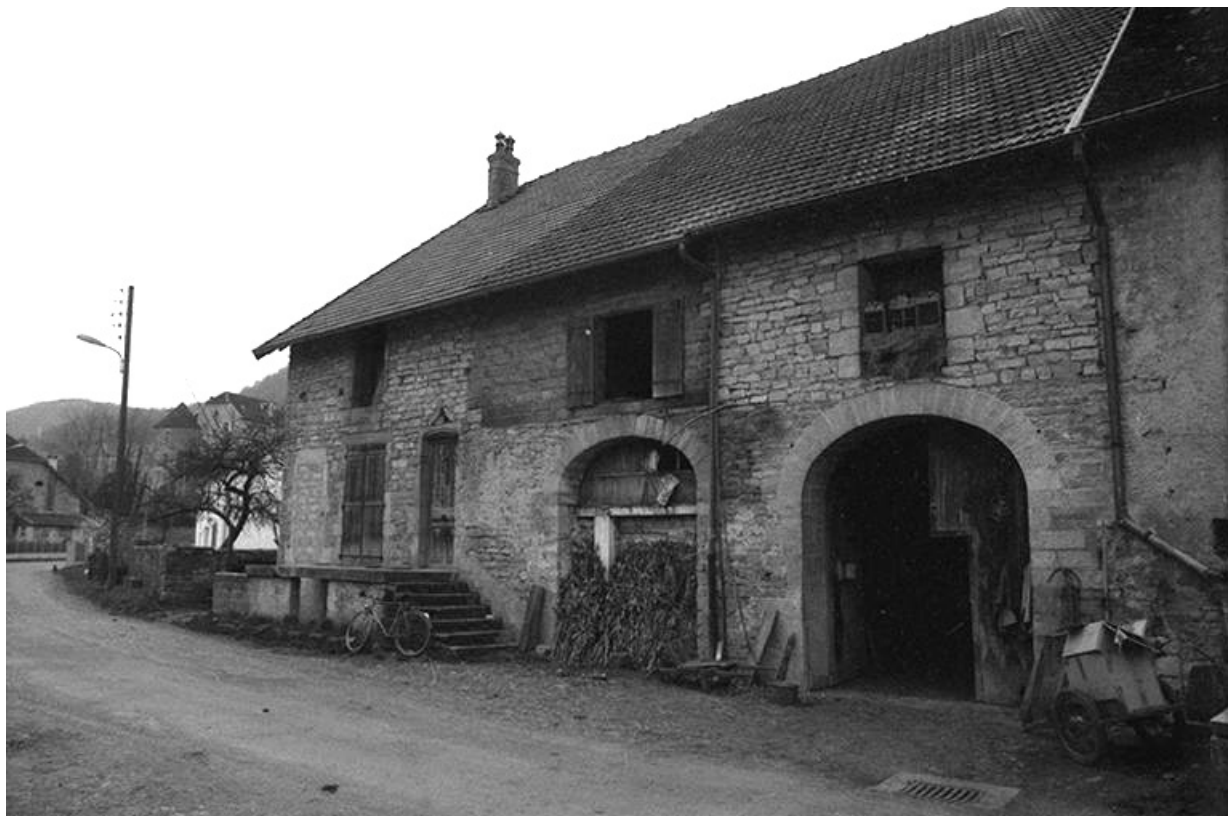
Ferme cadastrée 1961 AH 141, située rue des Guichard : façade antérieure. 39, Voiteur