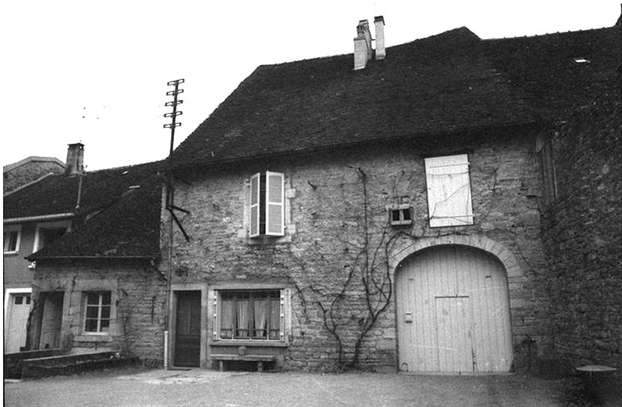
Ferme cadastrée 1961 AH 115, située rue du Presbytère : façade antérieure. 39, Voiteur