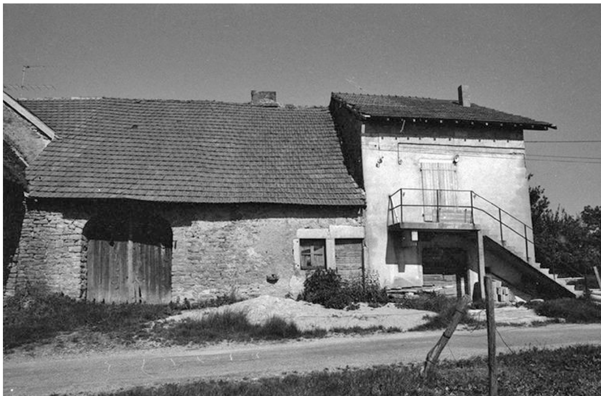
Ferme cadastrée 1951 A3 452-453, située le long du chemin vicinal n° 3 du Pin à Montain : façade antérieure. 39, Le Pin