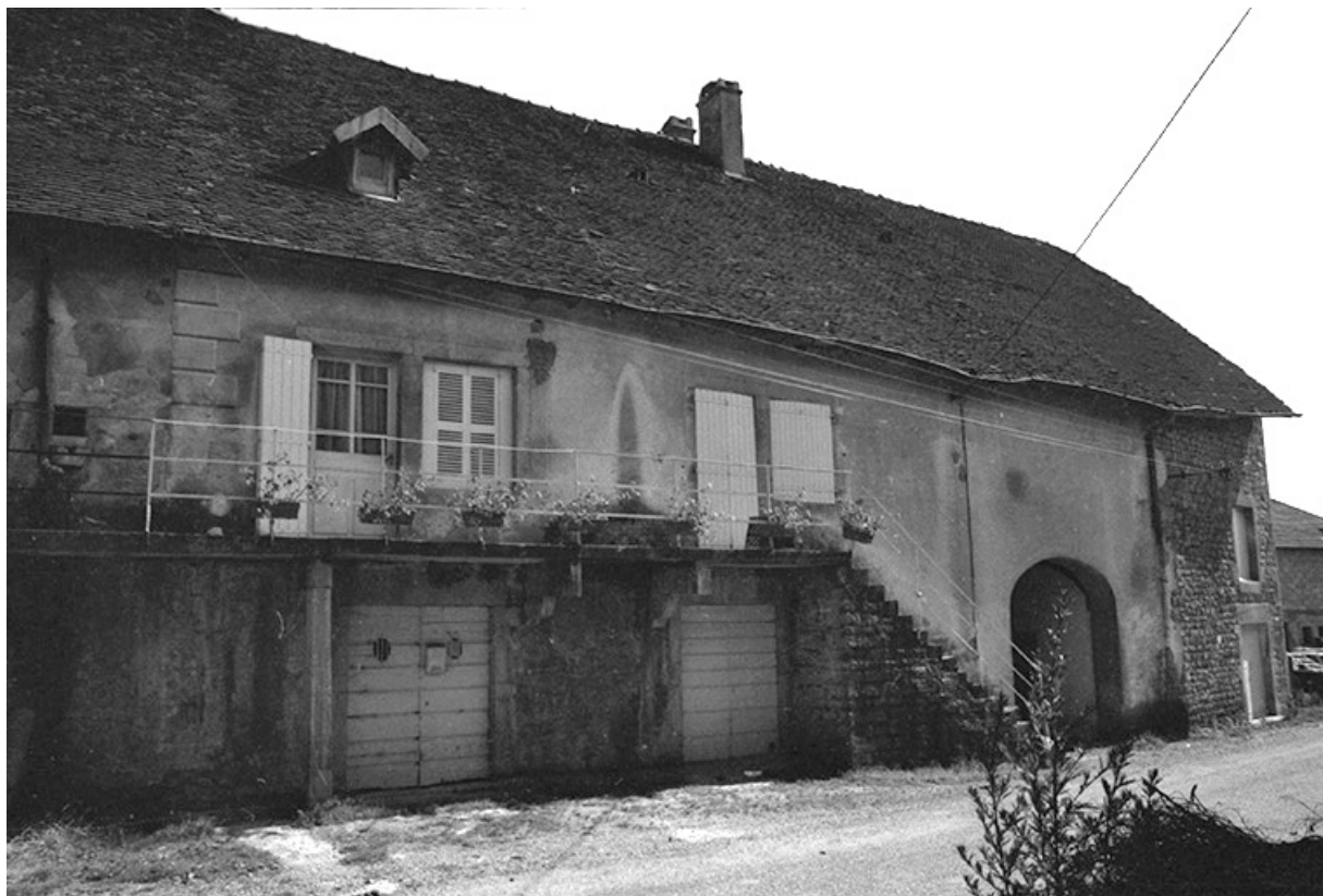
Ferme cadastrée 1951 A3 272, 275 situées le long du chemin départemental n° 208 du Pin à Lons-le-Saunier : façade antérieure. 39, Le Pin