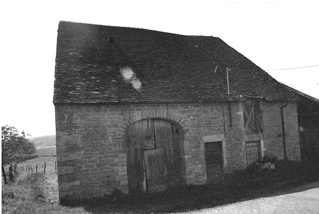
Ferme cadastrée 1951 A3 242, située le long du chemin vicinal n° 3 du Pin à Montain : façade antérieure. 39, Le Pin