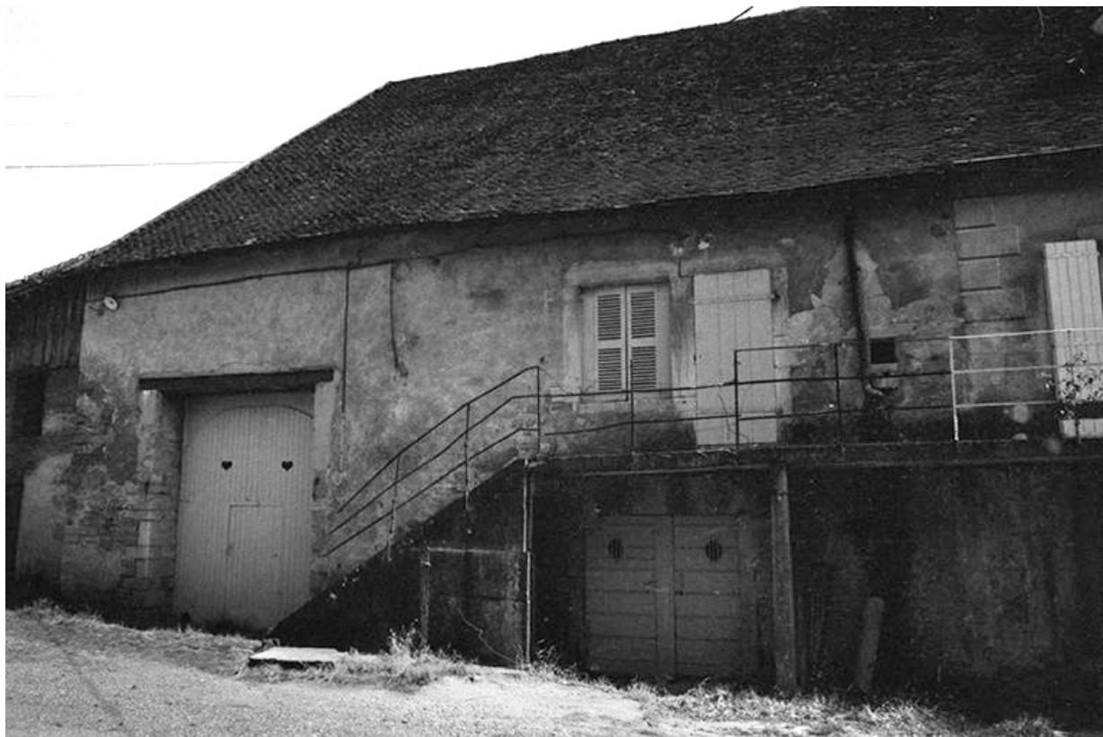
Ferme cadastrée 1951 A3 272, 275 située le long du chemin départemental n° 208 du Pin à Lons-le-Saunier : façade antérieure. 39, Le Pin