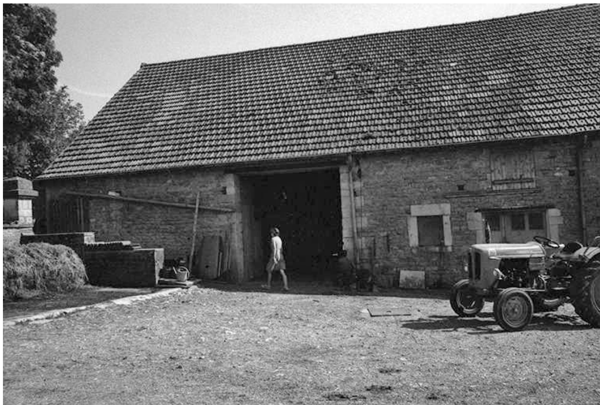
Ferme cadastrée 1951 A3 317 située le long du chemin départemental n° 208 du Pin à Lons-le-Saunier : partie gauche de la façade antérieure.