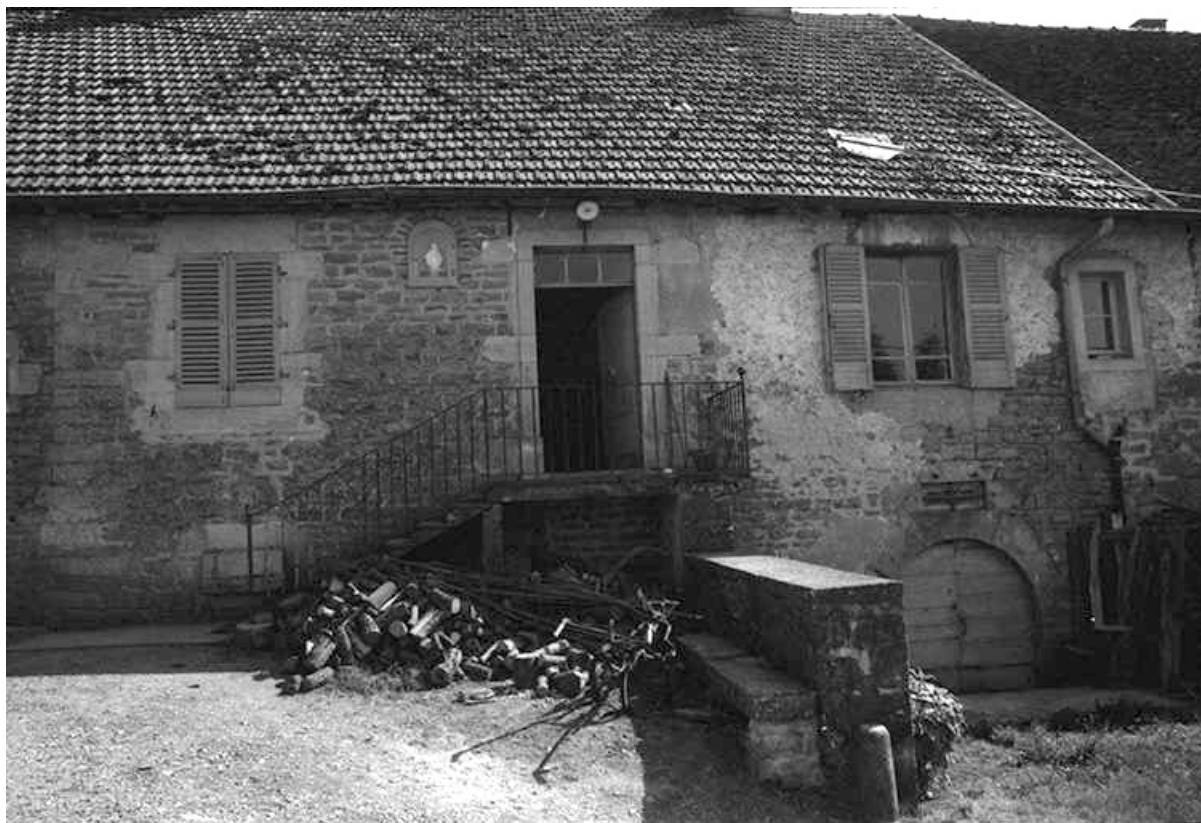
Ferme cadastrée 1951 A3 317 située le long du chemin départemental n° 208 du Pin à Lons-le-Saunier : partie droite de la façade antérieure.