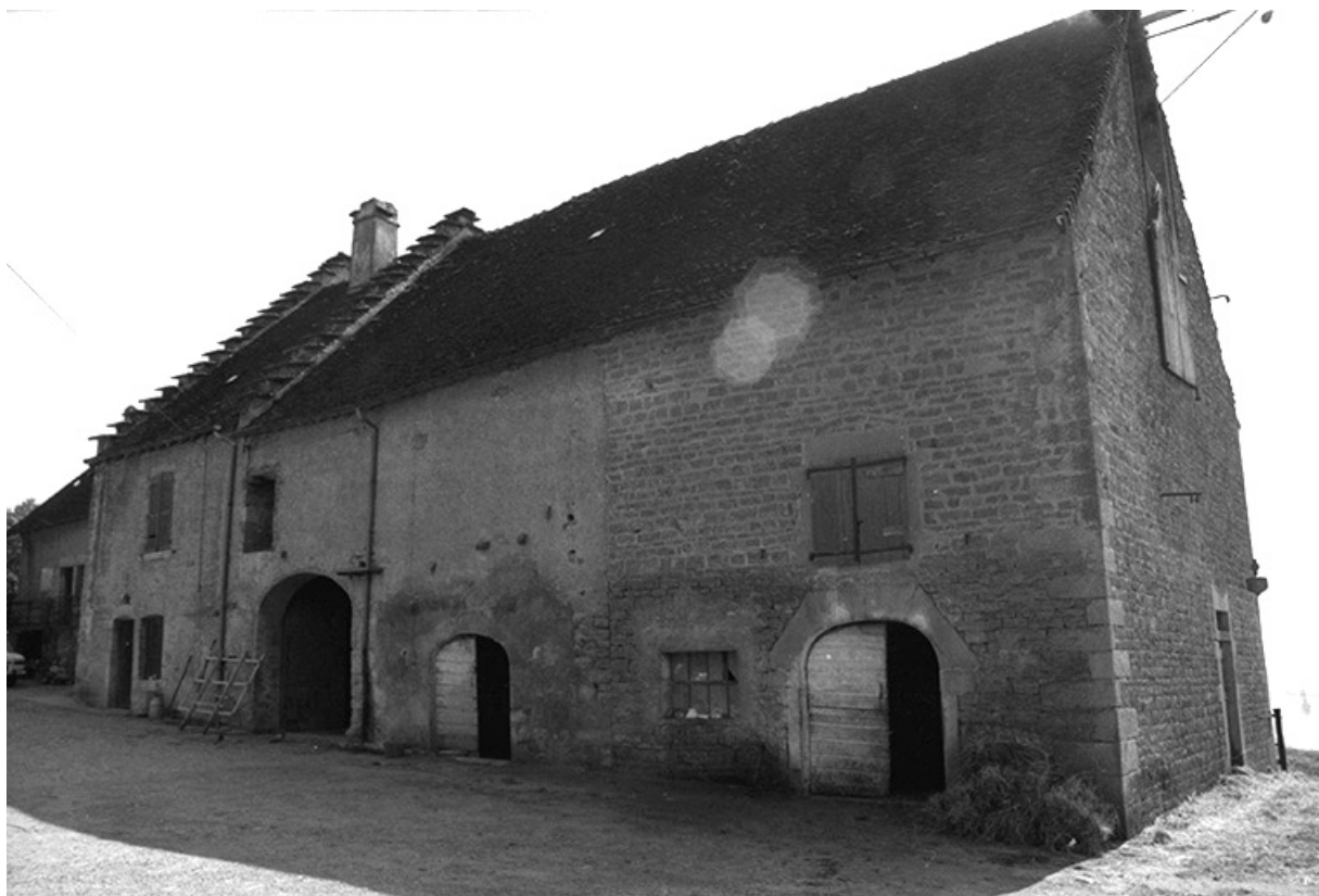
Ferme cadastrée 1951 B1 située le long du chemin départemental n° 208 du Pin à Lons-le-Saunier : façade antérieure. 39, Le Pin