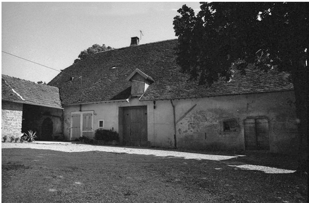
Ferme cadastrée 1951 A3 313 situées le long du chemin départemental n° 208 du Pin à Lons-le-Saunier : façade antérieure. 39, Le Pin