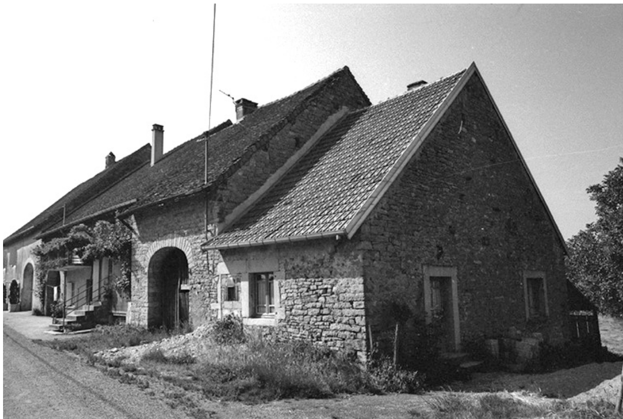
Ferme cadastrées 1951 A3 284, 285 et 288 situées le long du chemin départemental n° 208 du Pin à Lons-le-Saunier : façades antérieures vues de trois-quarts droit.