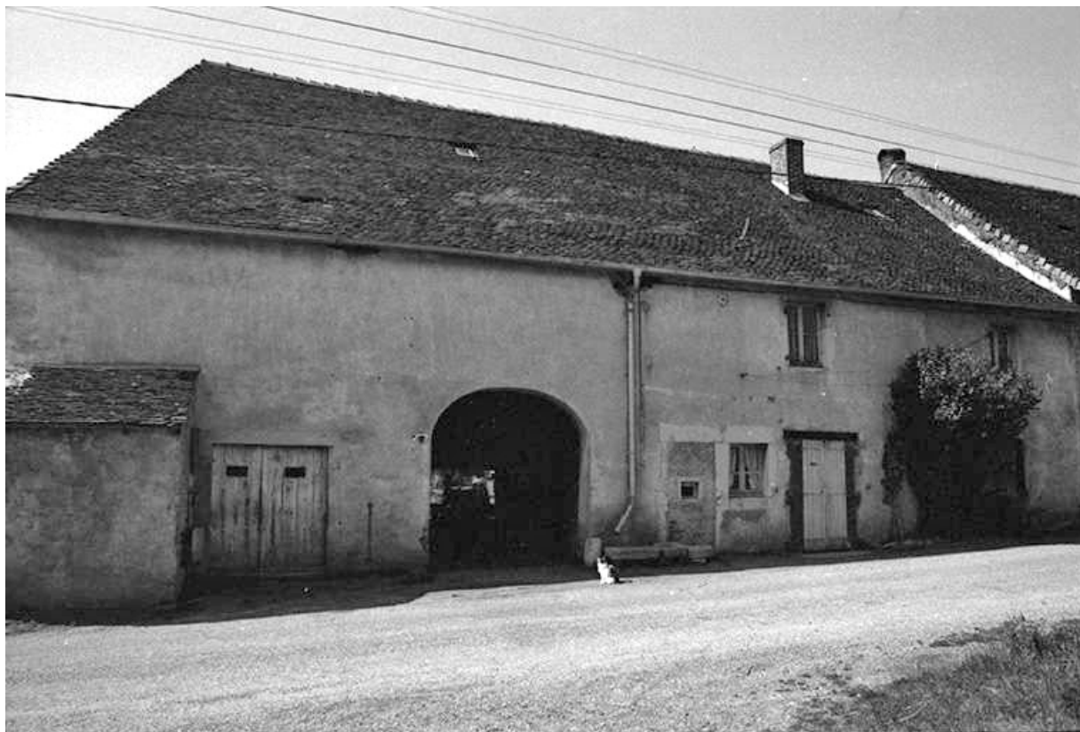
Ferme cadastrée 1951 A3 276, située le long du chemin départemental n° 208 du Pin à Lons-le-Saunier : façade antérieure. 39, Le Pin