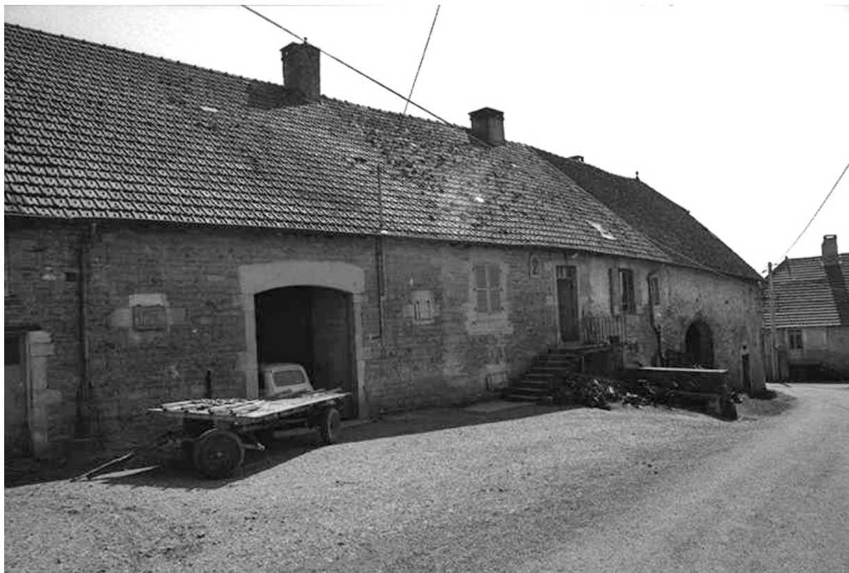
Ferme cadastrée 1951 A3 317 située le long du chemin départemental n° 208 du Pin à Lons-le-Saunier : façade antérieure vue de trois quarts gauche.