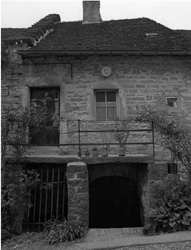
Façade antérieure : habitation.