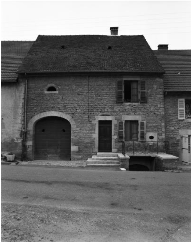
Façade antérieure en 1981.