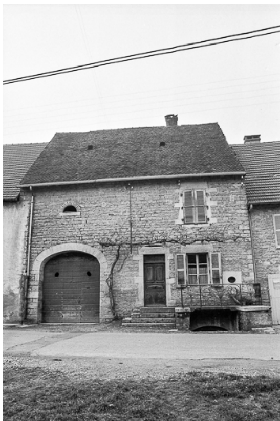
Façade antérieure en 1974.