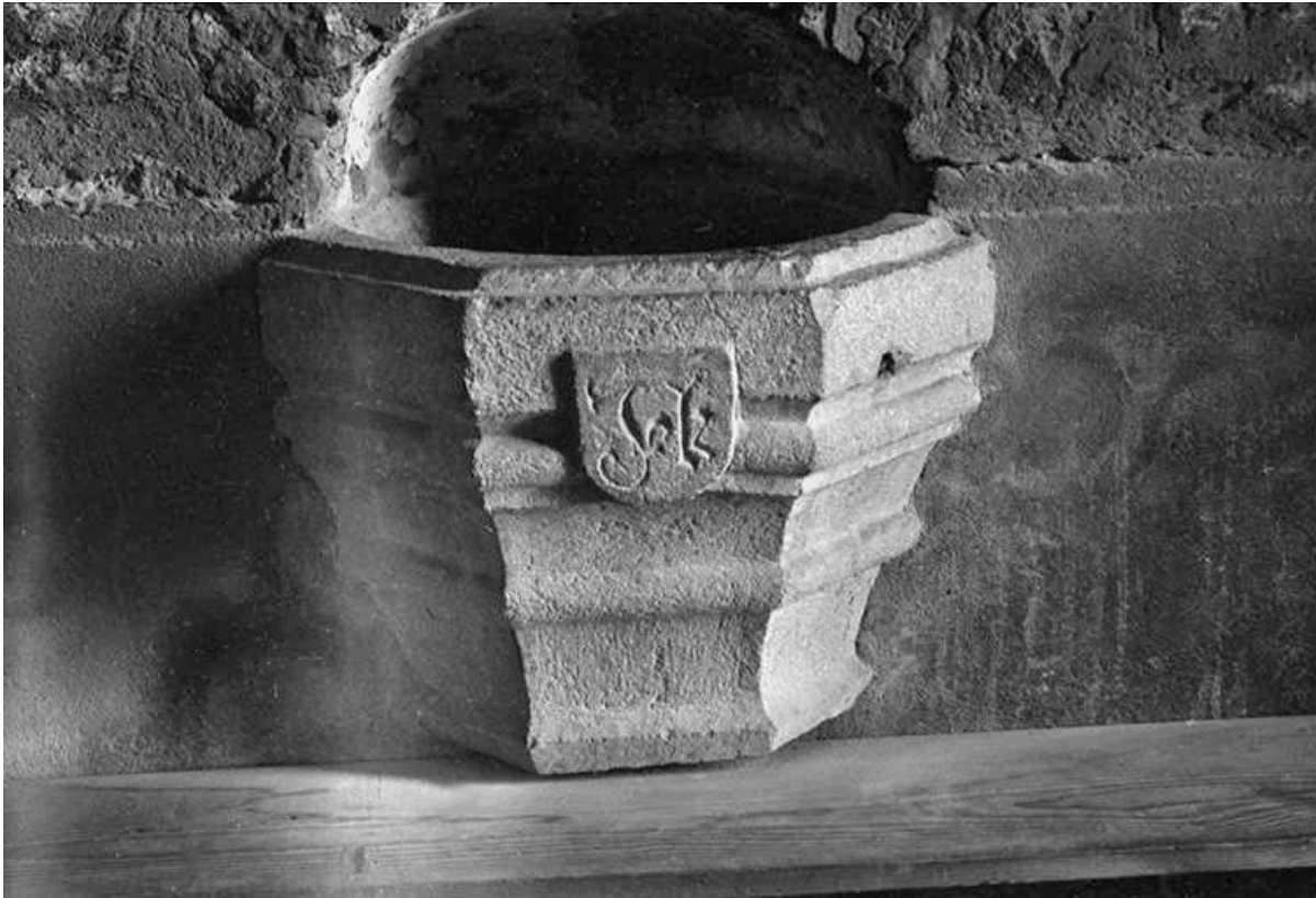
Bénitier encastré en calcaire, XVe ou XVIe siècle : vue de face

39, Menétru-le-Vignoble rue de l' Église