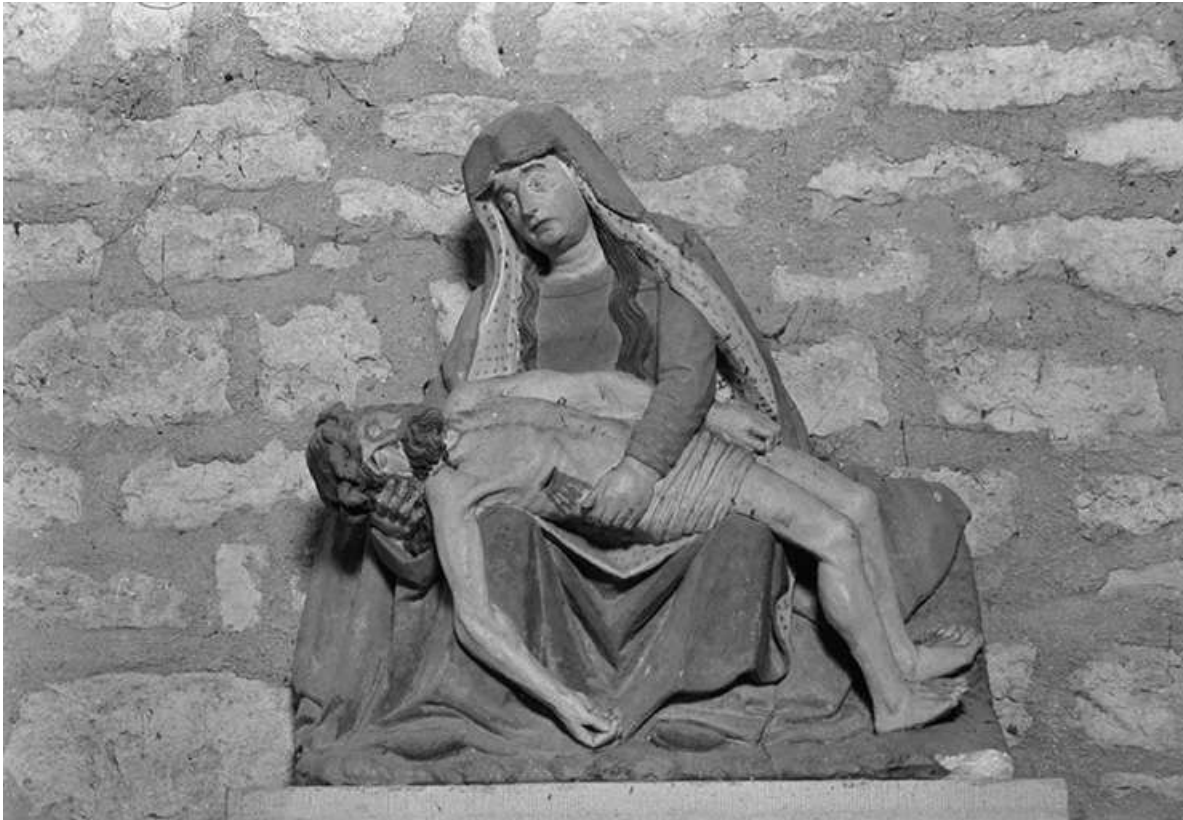
Statue de Vierge de Pitié en bois peint polychrome, XVIe siècle : vue de face 39, Menétru-le-Vignoble rue de l' Église