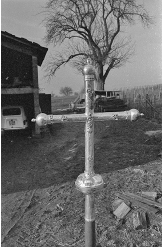
Croix de procession en cuivre argenté, XVI e siècle : face arrière 39, Menétru-le-Vignoble rue de l' Église