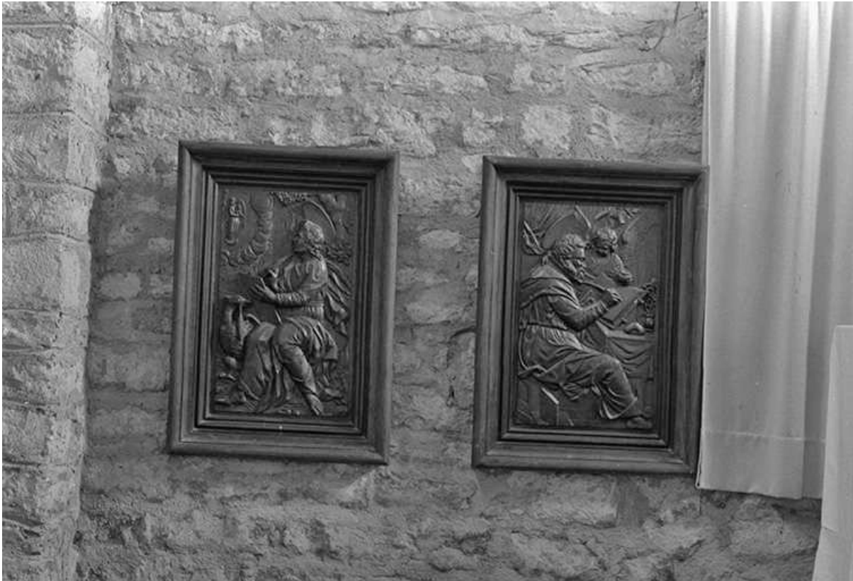
Bas-relief représentant saint Jean et saint Matthieu, XVIII e siècle : vue de face 39, Menétru-le-Vignoble rue de l' Église