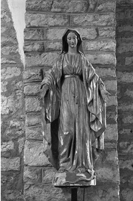
Statue de la Vierge : vue d'ensemble.

39, Menétru-le-Vignoble rue de l' Église