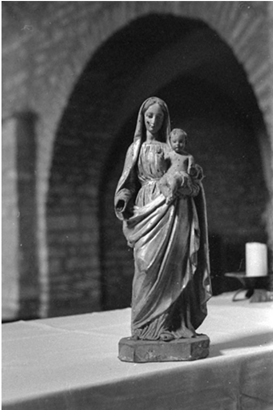
Statue de Vierge à l'Enfant en bois peint, XVIIIe siècle : vue de face 39, Menétru-le-Vignoble rue de l' Église