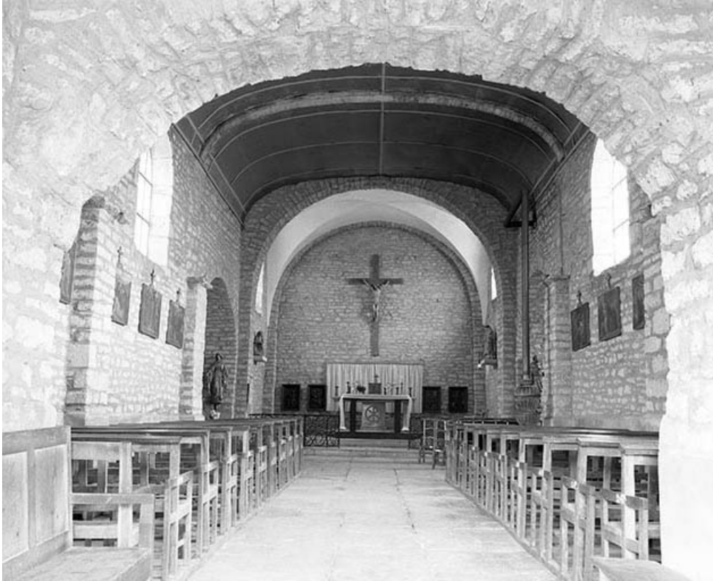
Nef et chœur vus depuis le vestibule.

39, Menétru-le-Vignoble rue de l' Église