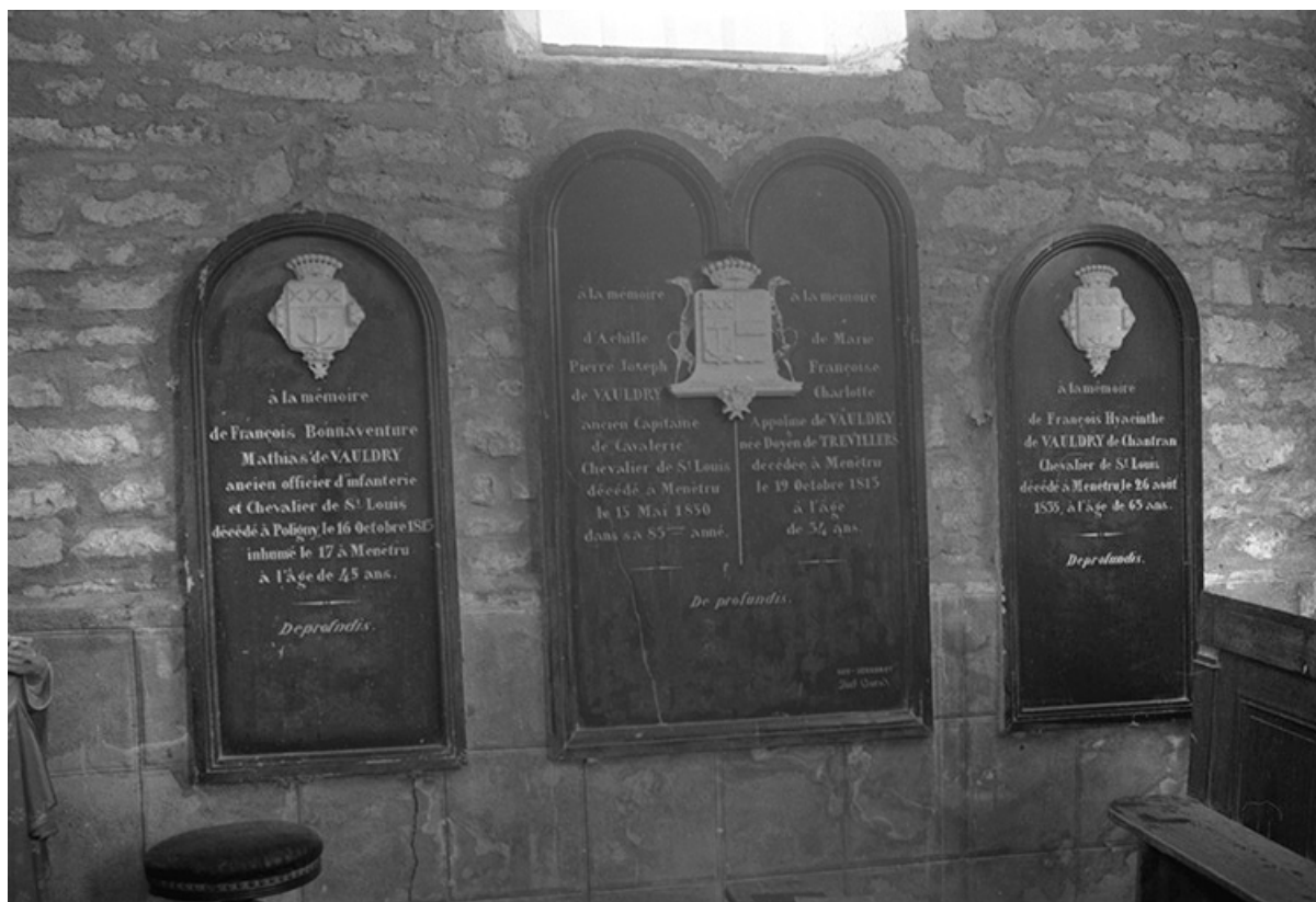
2 plaques commémoratives en marbre noir et blanc, XIXe siècle : vue de face

39, Menétru-le-Vignoble rue de l' Église