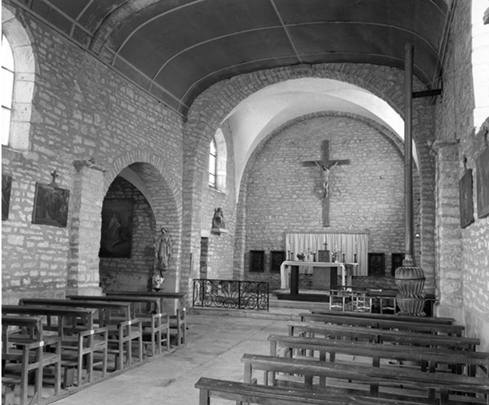
Nef et chœur, élévation gauche vue depuis l'entrée.

39, Menétru-le-Vignoble rue de l' Église