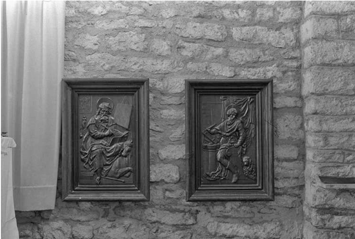
Bas-relief représentant saint Luc et saint Marc, XVIIIe siècle : vue de face

39, Menétru-le-Vignoble rue de l' Église