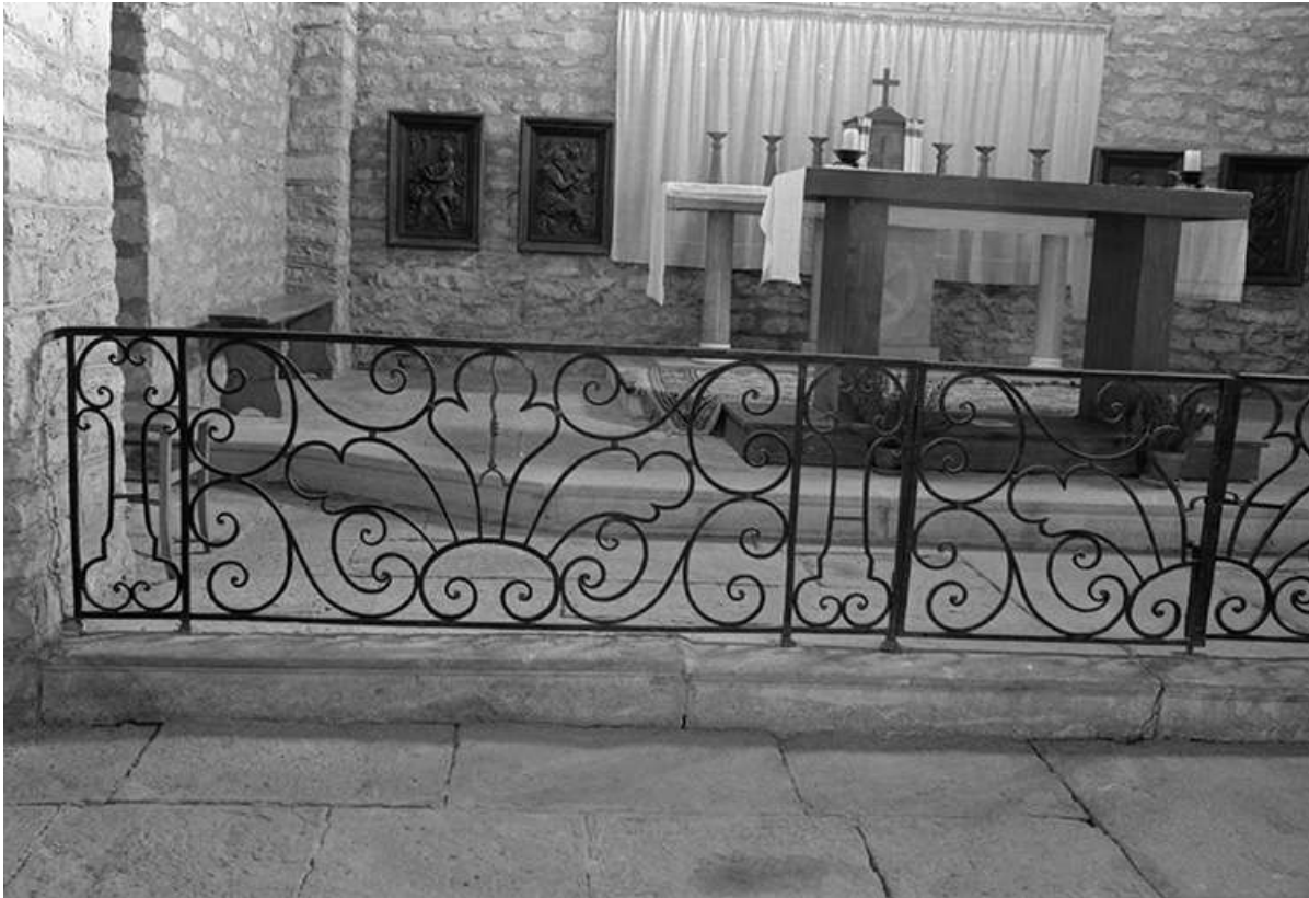
Clôture de chœur en fer forgé, XVIIIe siècle : vue de face