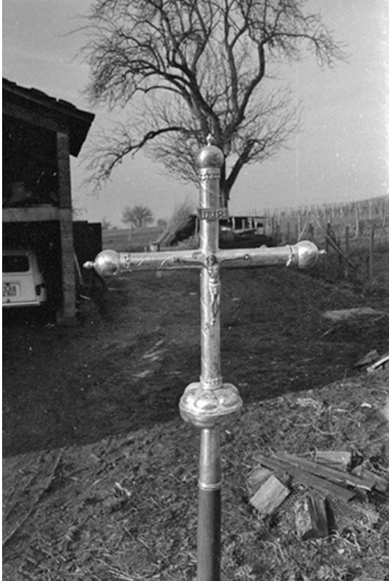
Croix de procession en cuivre argenté, XVI e siècle : face avant 39, Menétru-le-Vignoble rue de l' Église