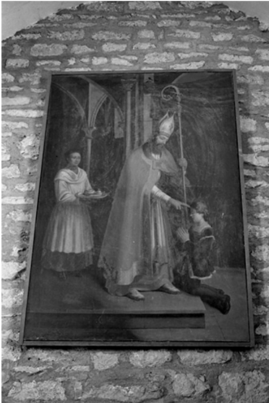
Tableau représentant saint Claude, XIXe siècle : vue de face

39, Menétru-le-Vignoble rue de l' Église