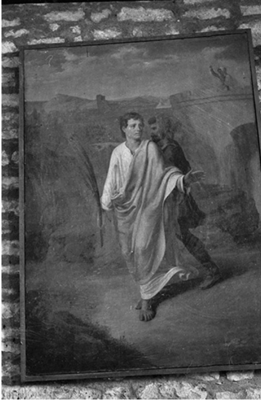
Tableau représentant saint Symphorien, XIXe siècle : vue de face 39, Menétru-le-Vignoble rue de l' Église