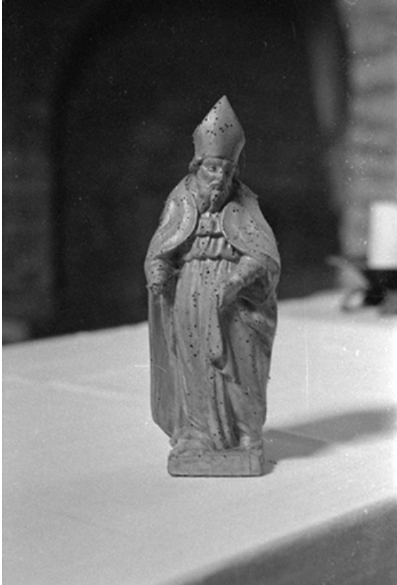
Statue de saint évêque en bois doré, XVIIIe siècle : vue de face

39, Menétru-le-Vignoble rue de l' Église