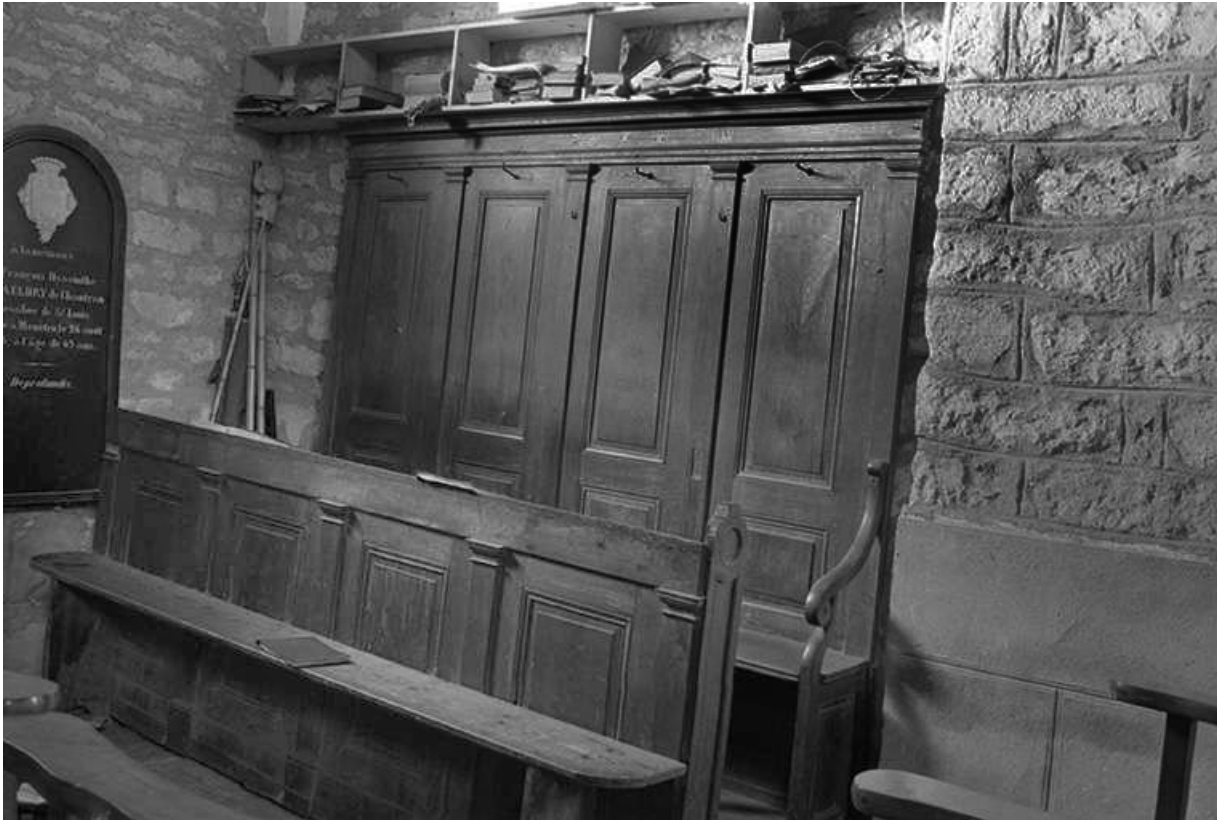
Stalles en bois, XIXe siècle : vue de trois quarts

39, Menétru-le-Vignoble rue de l' Église