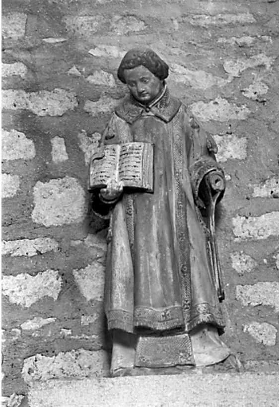
Statue de saint Vincent en calcaire polychrome, XVe siècle : vue de face 39, Menétru-le-Vignoble rue de l' Église