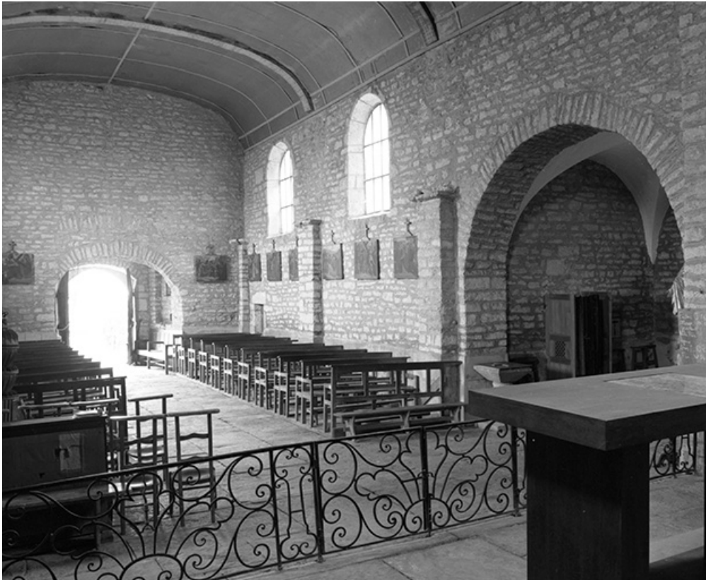
Nef, élévation gauche vue depuis le chœur.

39, Menétru-le-Vignoble rue de l' Église