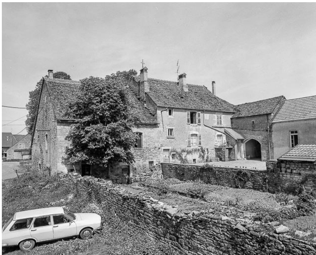
Ferme cadastrée 1957 A1 134 située place de l'Eglise : façades sur cour. 39, La Marre