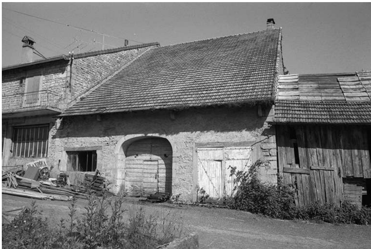
Ferme cadastrée 1957 A1 135-138 : façade postérieure. 39, La Marre