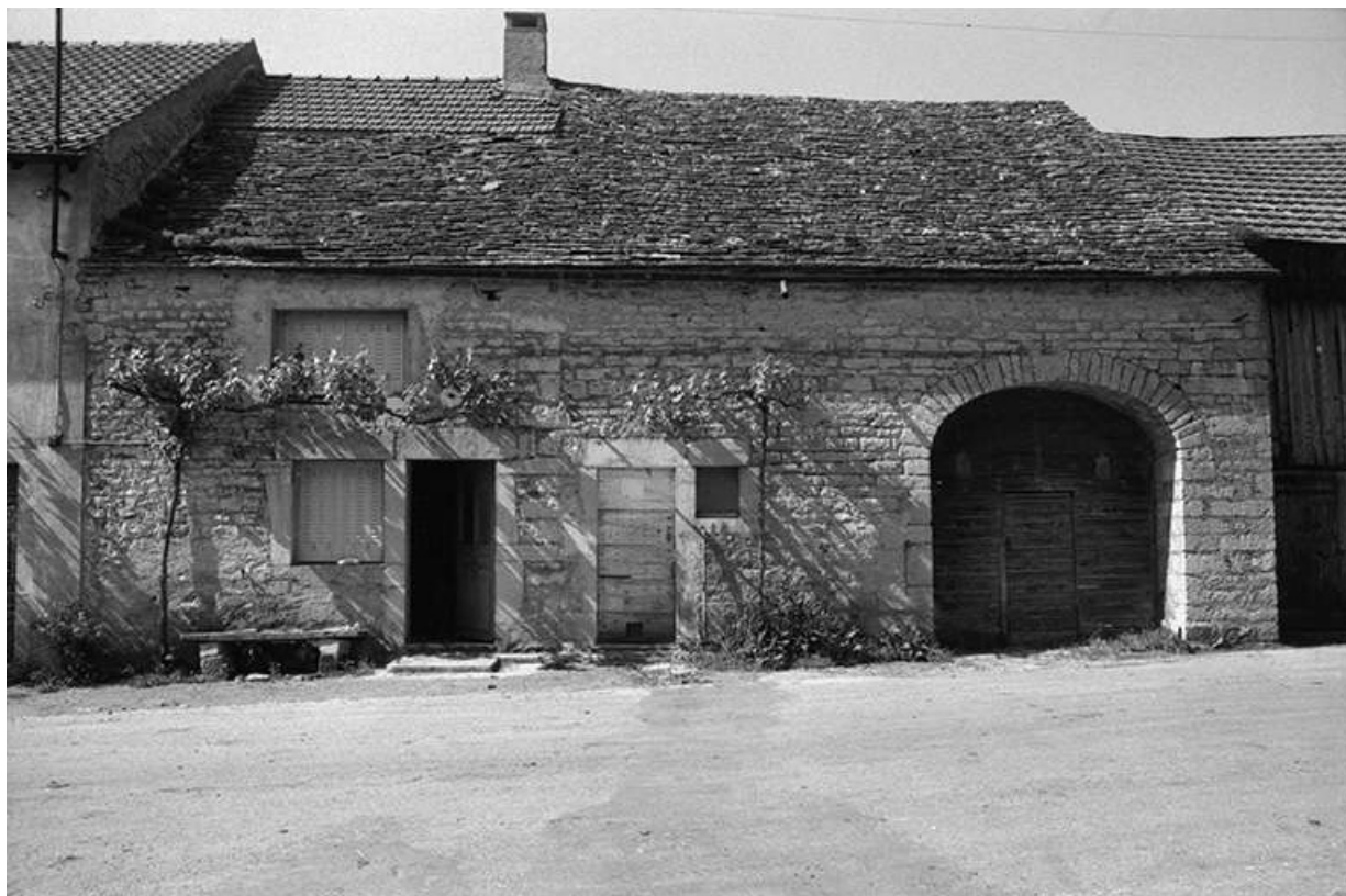
Ferme cadastrée 1957 A1 273, située le long chemin de grande communication n° 4 d'Orgelet à Arbois : façade antérieure. 39, La Marre