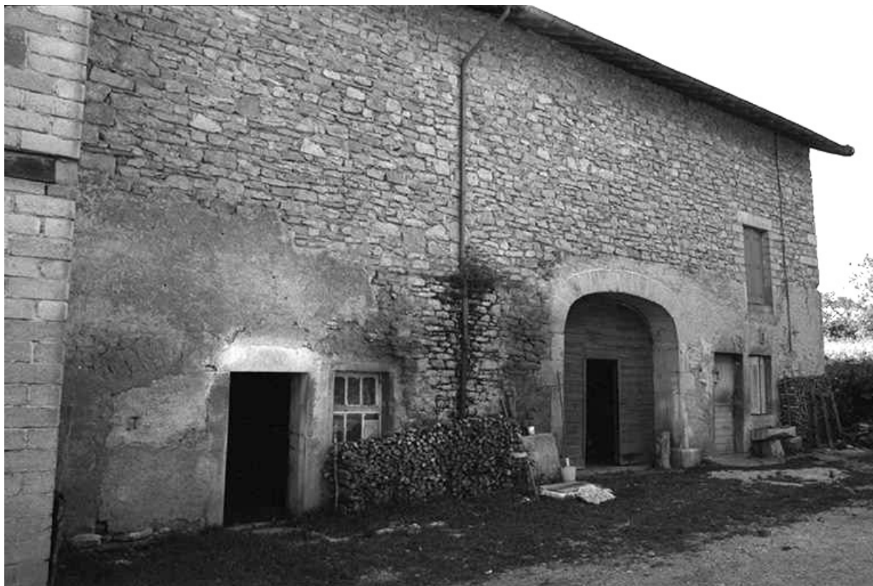
Ferme cadastrée 1957 A1 232 : façade antérieure. 39, La Marre