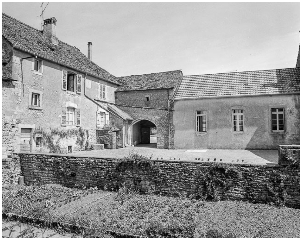
Ferme cadastrée 1957 A1 134 située place de l'Eglise : façades sur cour et façade postérieure de l'école. 39, La Marre