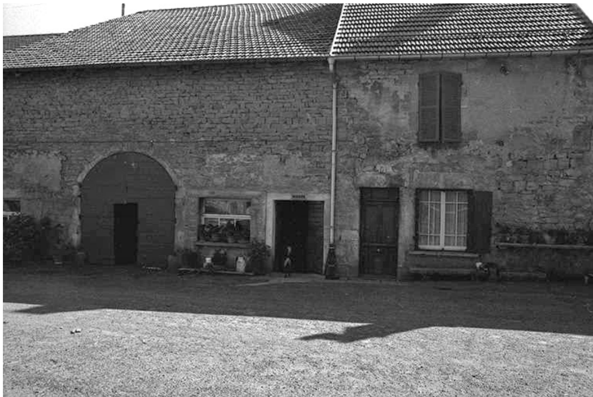
Ferme cadastrées 1957 A1 147, 148 et 151 : façades antérieures. 39, La Marre