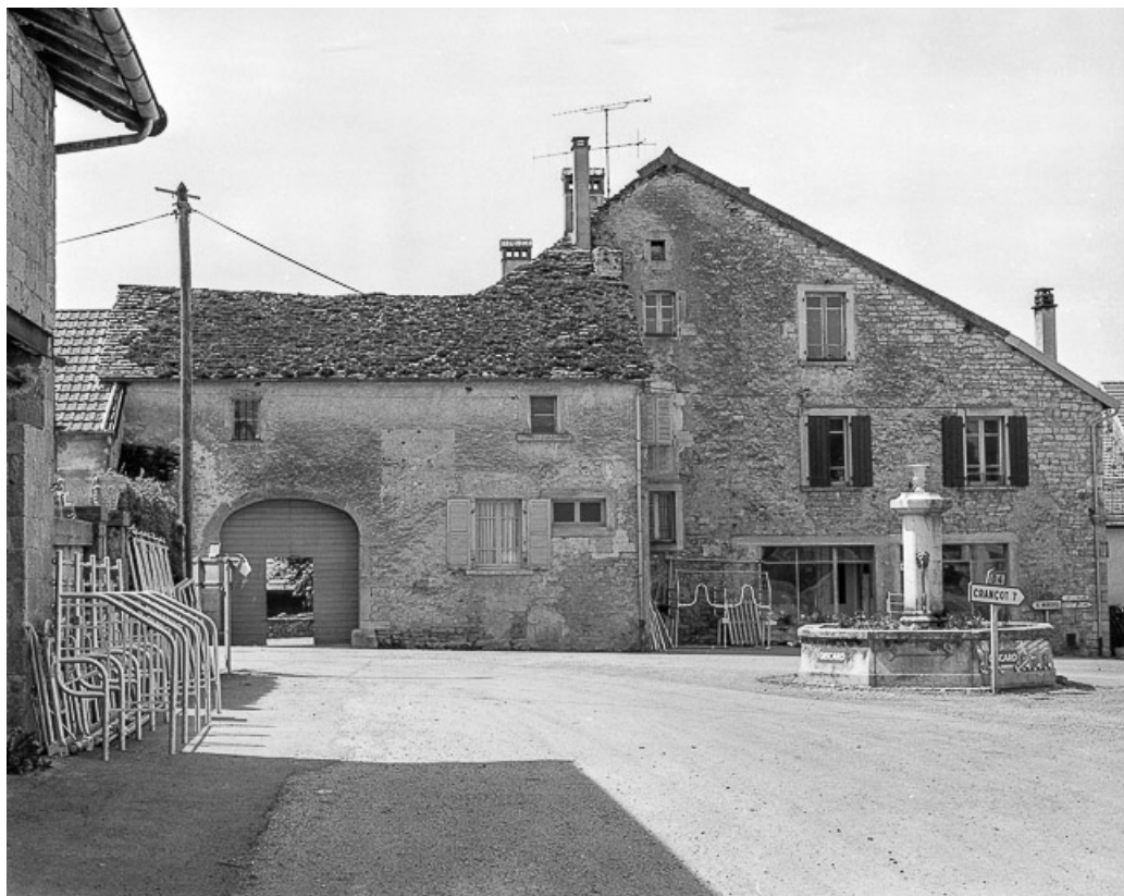
Ferme cadastrée 1957 A1 134 située place de l'Eglise : vue d'ensemble. 39, La Marre