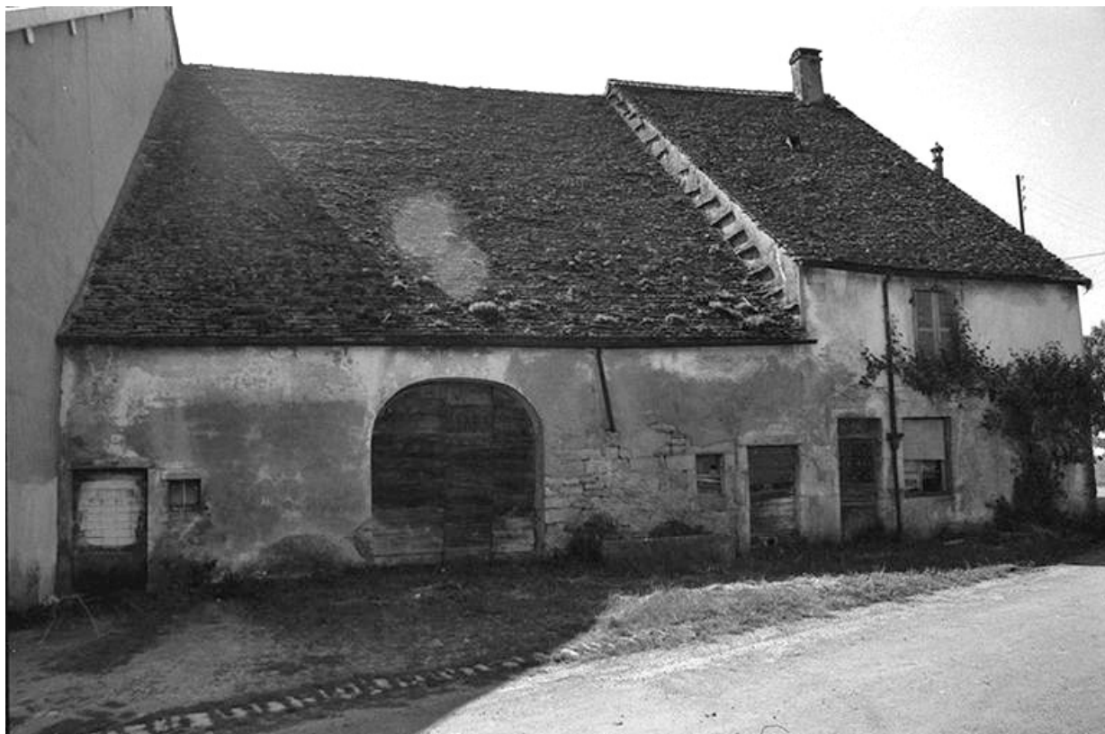
Ferme cadastrée 1957 A1 323 située le long du chemin vicinal n° 2 de La Marre à Poligny : façade antérieure. A noter le toit à "pas de moineaux".