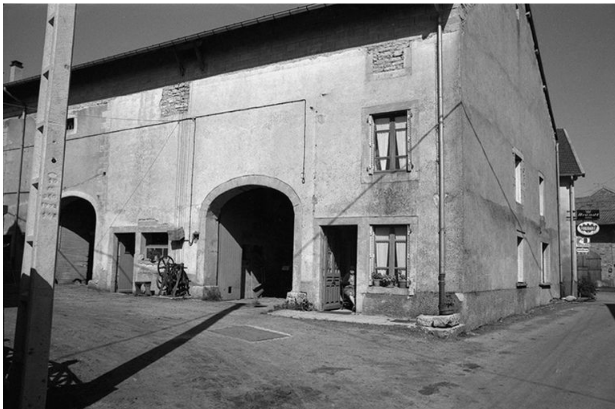
Ferme cadastrée 1957 A1 80, située le long du chemin de grande communication n° 96 de Plasne à Mirebel : façades antérieure et latérale droite.