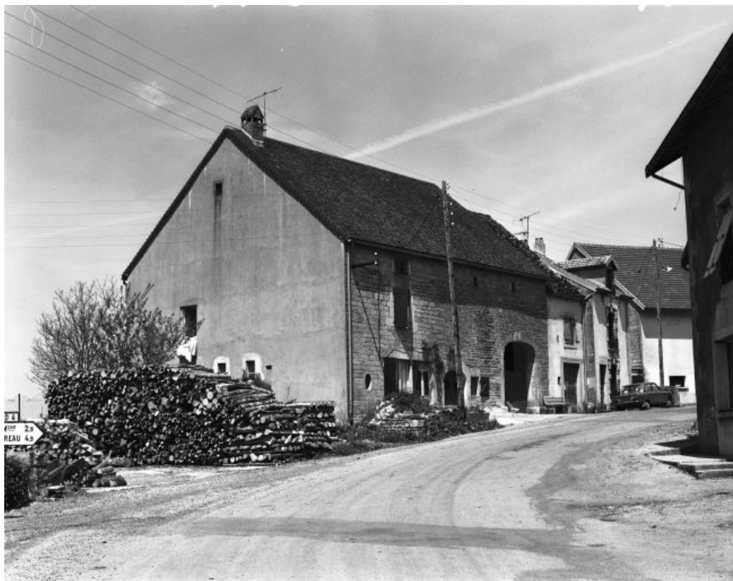
Façade antérieure vue de trois-quarts gauche en 1981.