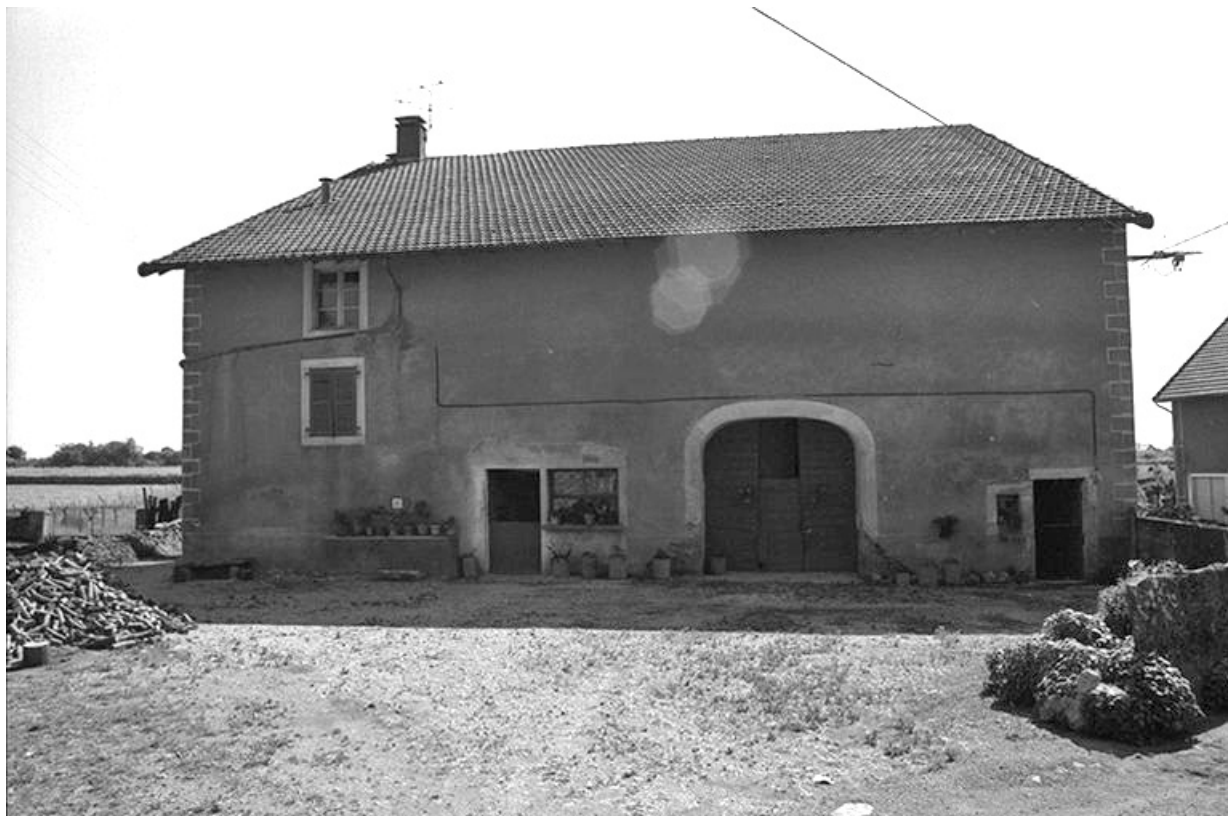
Ferme cadastrée 1957 A1 261, située le long du chemin de grande communication n° 9 de La Marre à Bonnefontaine : façade antérieure.