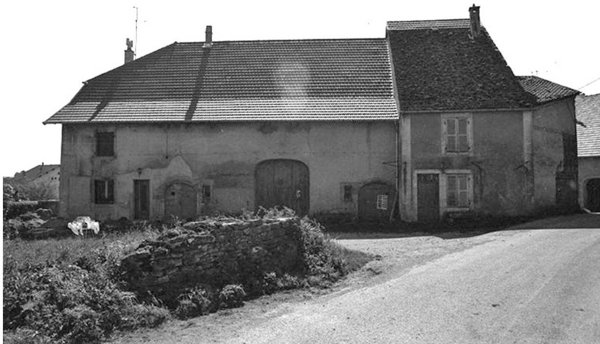
Ferme cadastrée 1957 A1 296, située le long du chemin de grande communication n° 96 de Plasne à Mirebel : façade antérieure. 39, La Marre