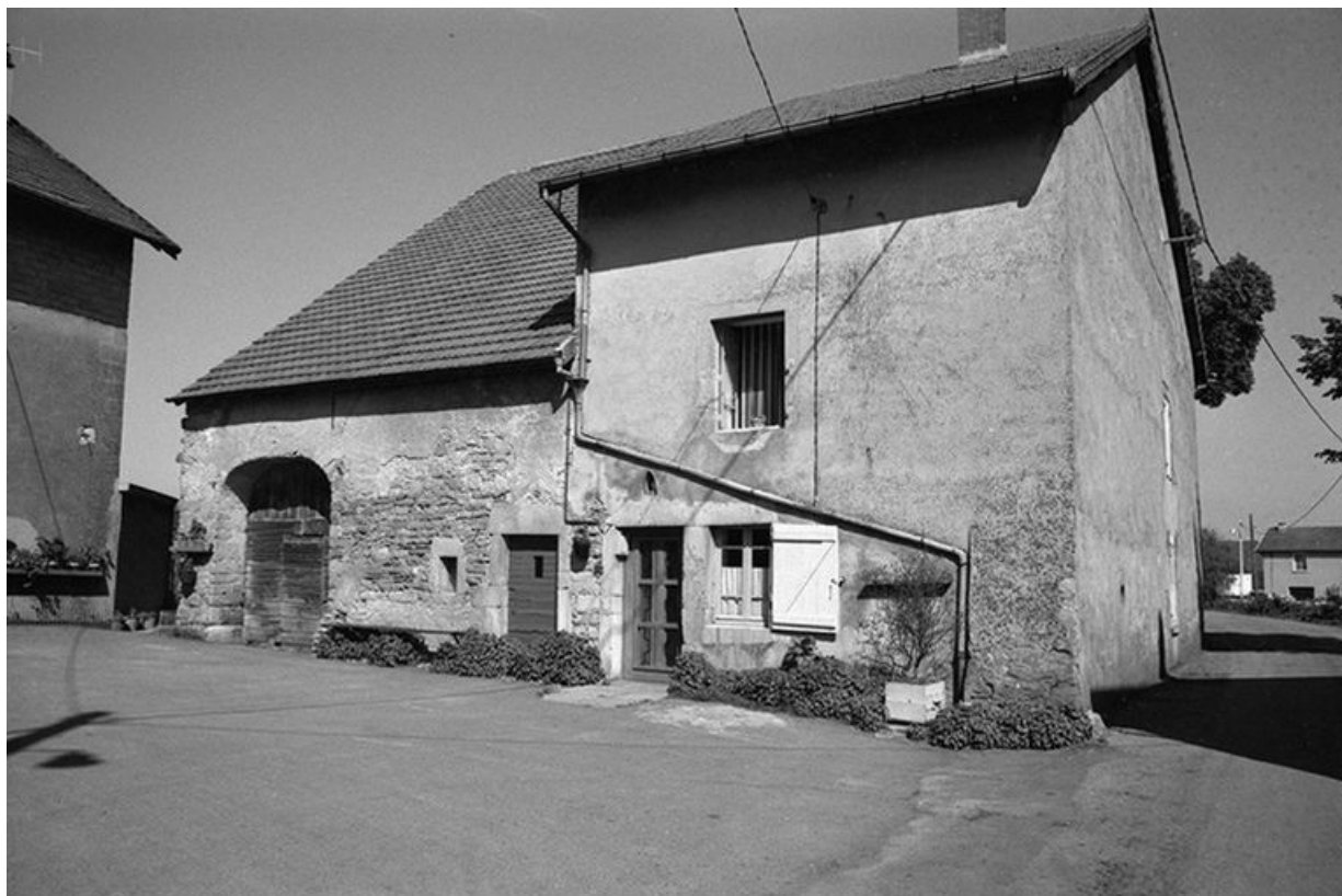
Ferme cadastrée 1957 A1 96, située le long du chemin de grande communication n° 96 de Plasne à Mirebel : façades antérieure et latérale gauche.