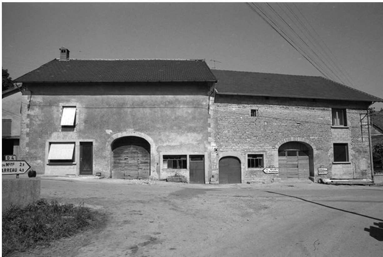
Fermes cadastrées 1957 A1 251 et 254, situées le long du chemin de grande communication n° 4 d'Orgelet à Arbois : façades antérieures.