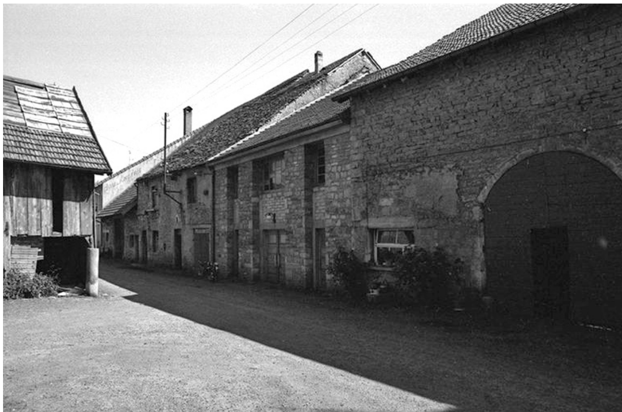
Ferme cadastrées 1957 A1 147, 148 et 151 : façades antérieures vues de trois-quarts droit. 39, La Marre