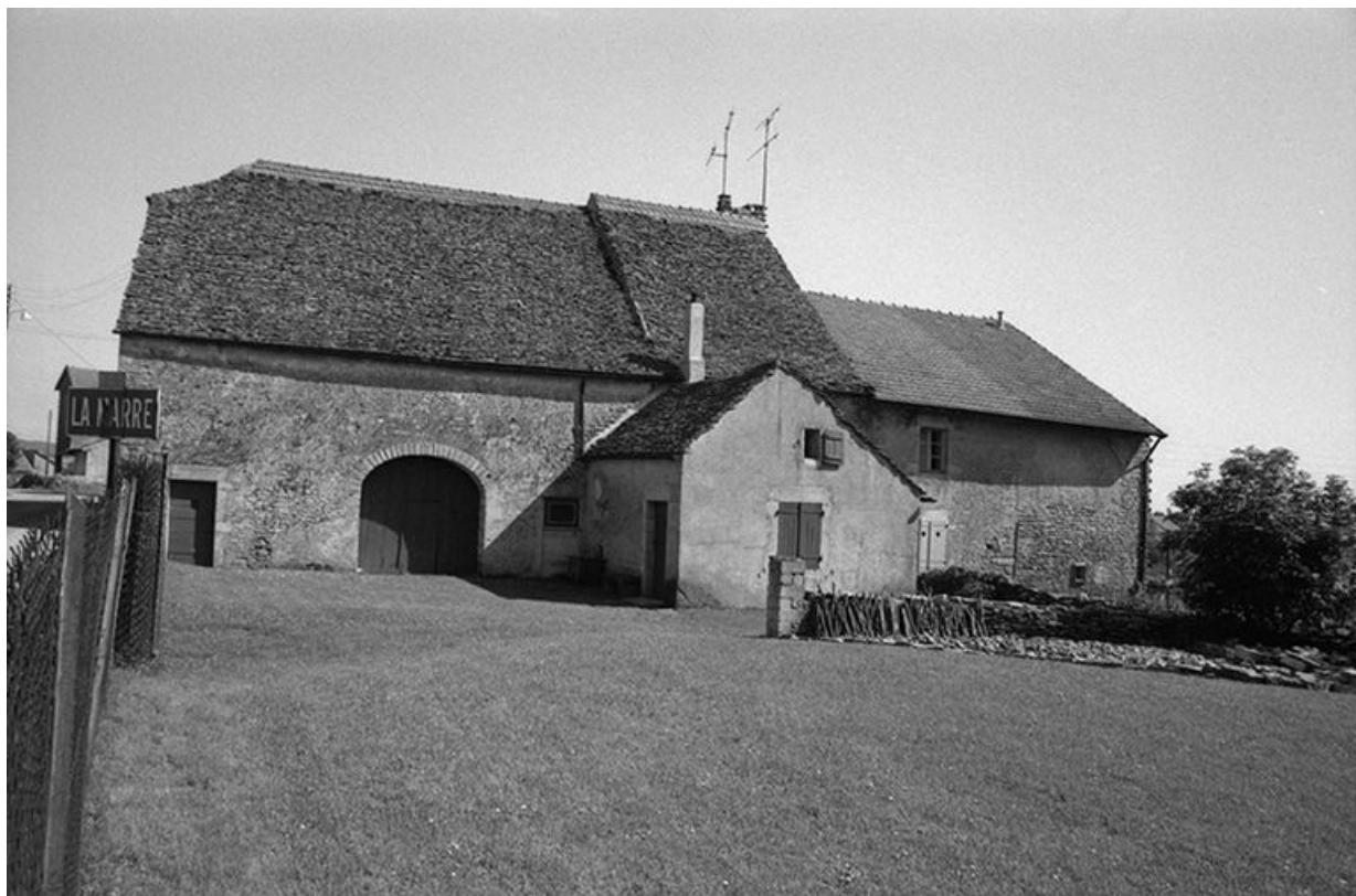
Ferme cadastrée 1957 A1 287 et 293 : vue d'ensemble.