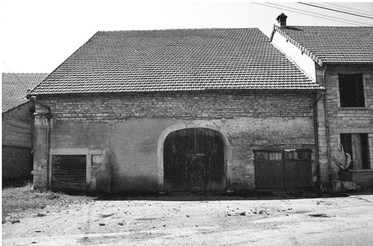
Ferme cadastrée 1957 A 208-209, située le long du chemin de grande communication n° 4 d'Orgelet à Arbois : parties agricoles. 39, La Marre