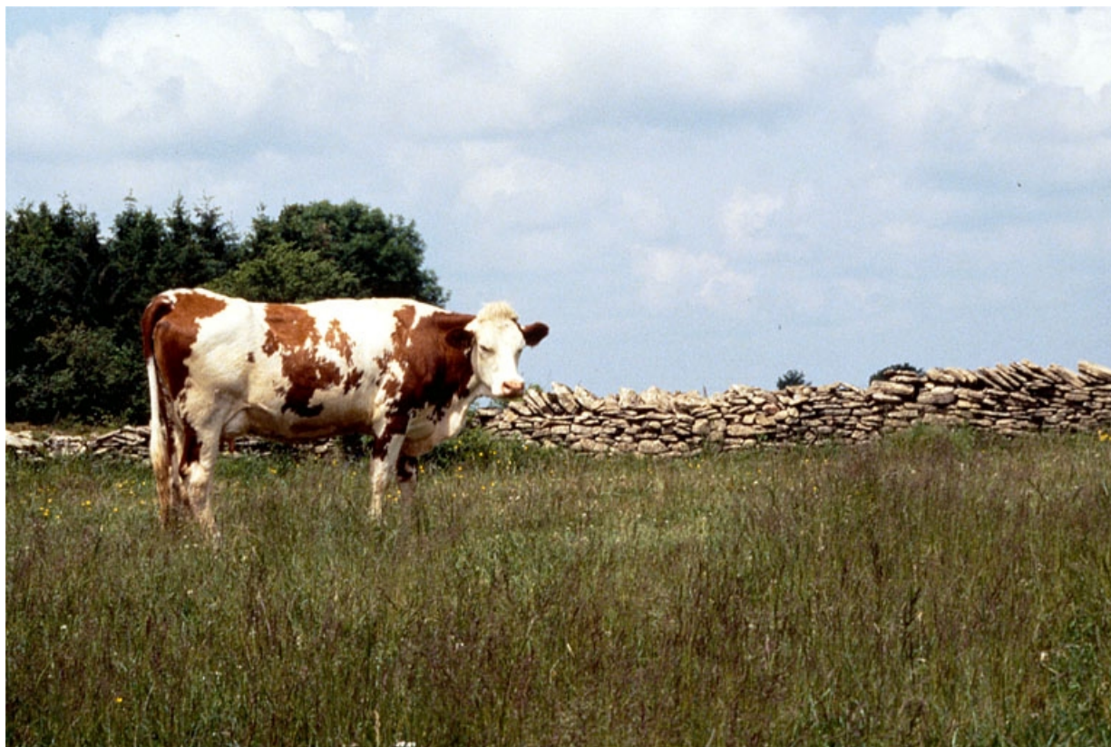
Vache montbéliarde devant un muret de pierres sèches.