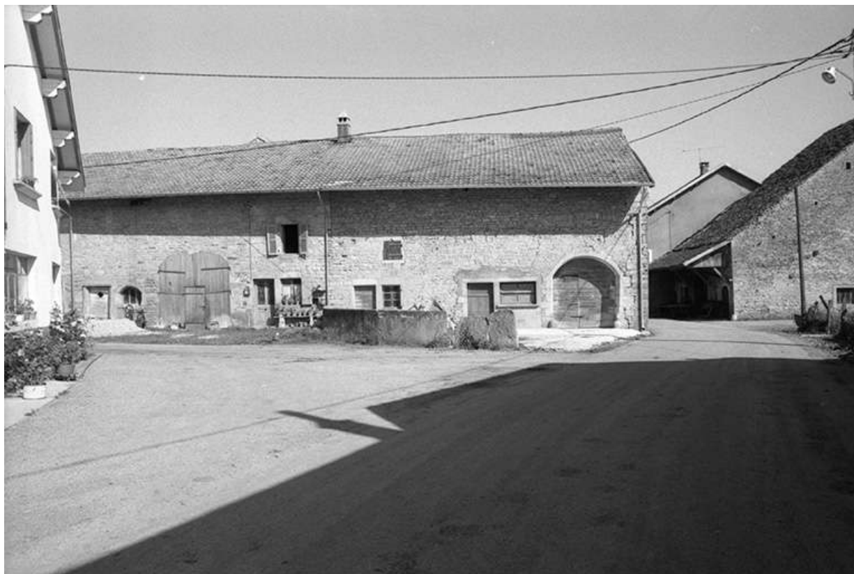
Ferme double cadastrée 1957 A1 89 et 92, située le long du chemin de grande communication n° 96 de Plasne à Mirebel : façade antérieure.