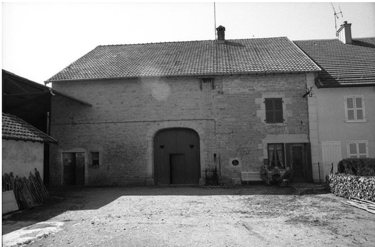
Ferme cadastrée 1957 A1 192, située le long du chemin de grande communication n° 4 d'Orgelet à Arbois : façade antérieure et cour.