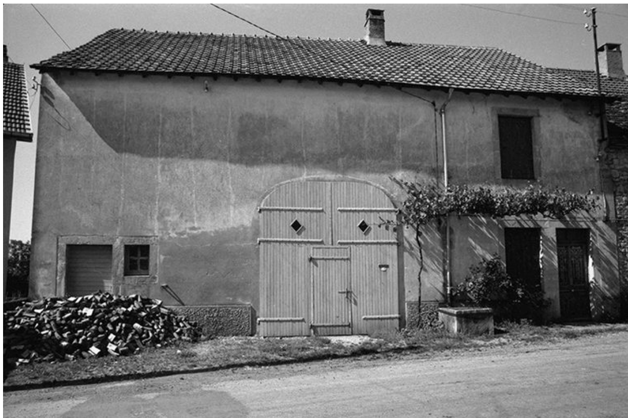
Ferme cadastrée 1957 A1 274, située le long du chemin de grande communication n° 4 d'Orgelet à Arbois : façade antérieure. 39, La Marre