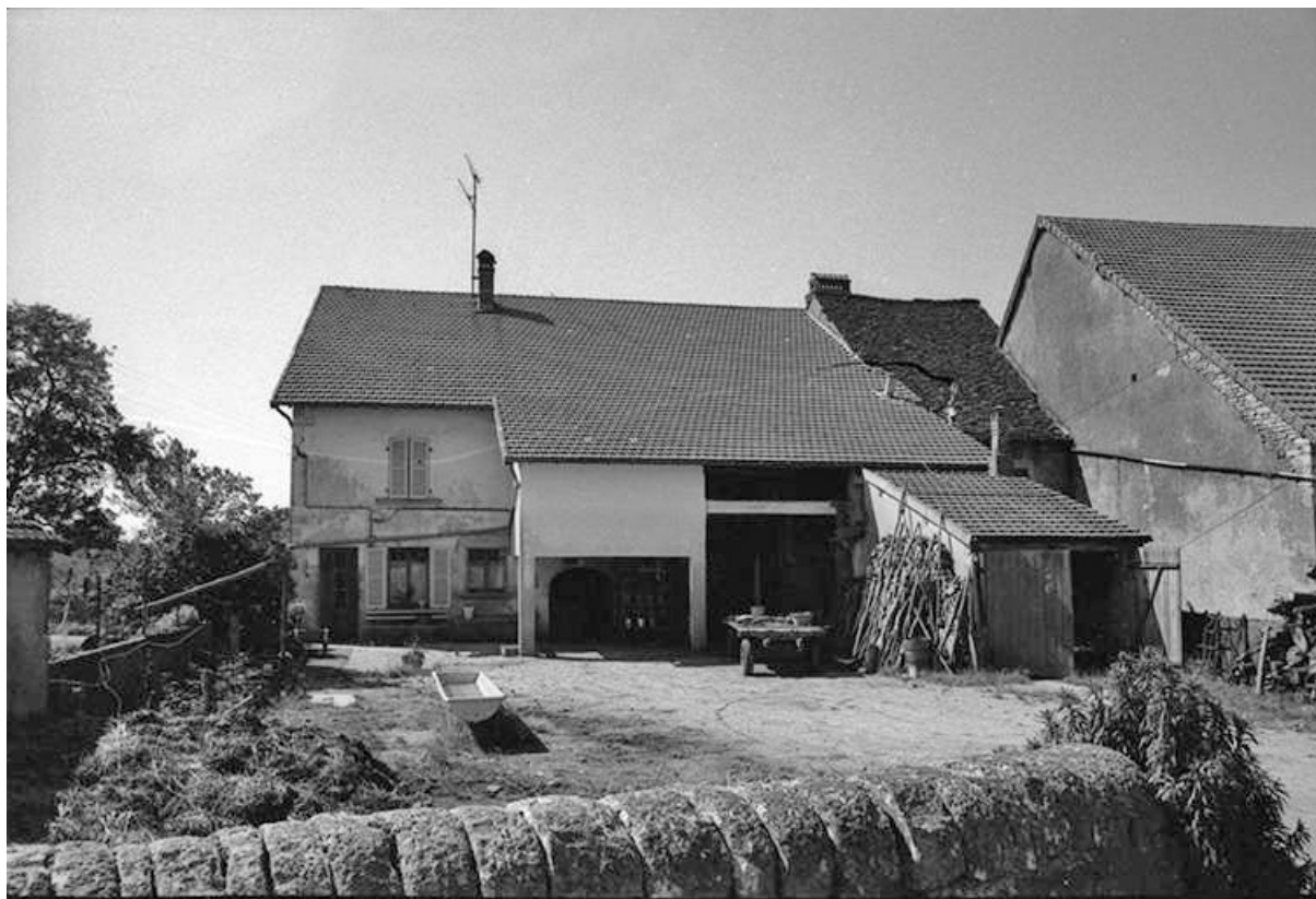
Ferme cadastrée 1957 A1 206, située le long du chemin de grande communication n° 4 d'Orgelet à Arbois : façade antérieure. 39, La Marre