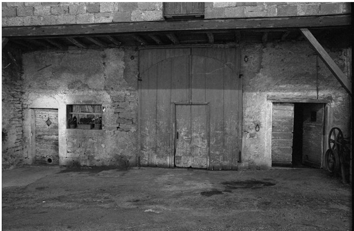
Ferme cadastrée 1957 A1 231 : portes des écuries de chaque côté de la grange. 39, La Marre