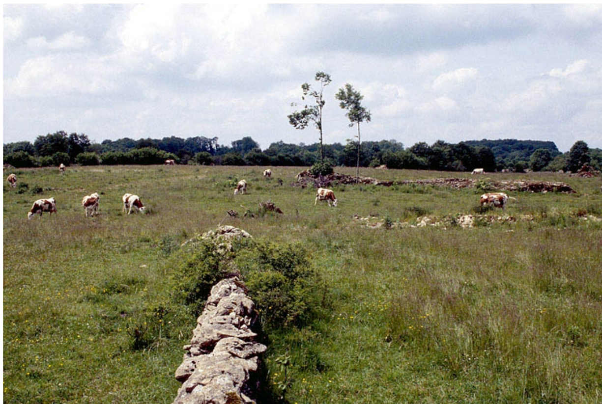
Prairie délimitée par des murets de pierres sèches et troupeau de vaches montbéliardes. 39, La Marre