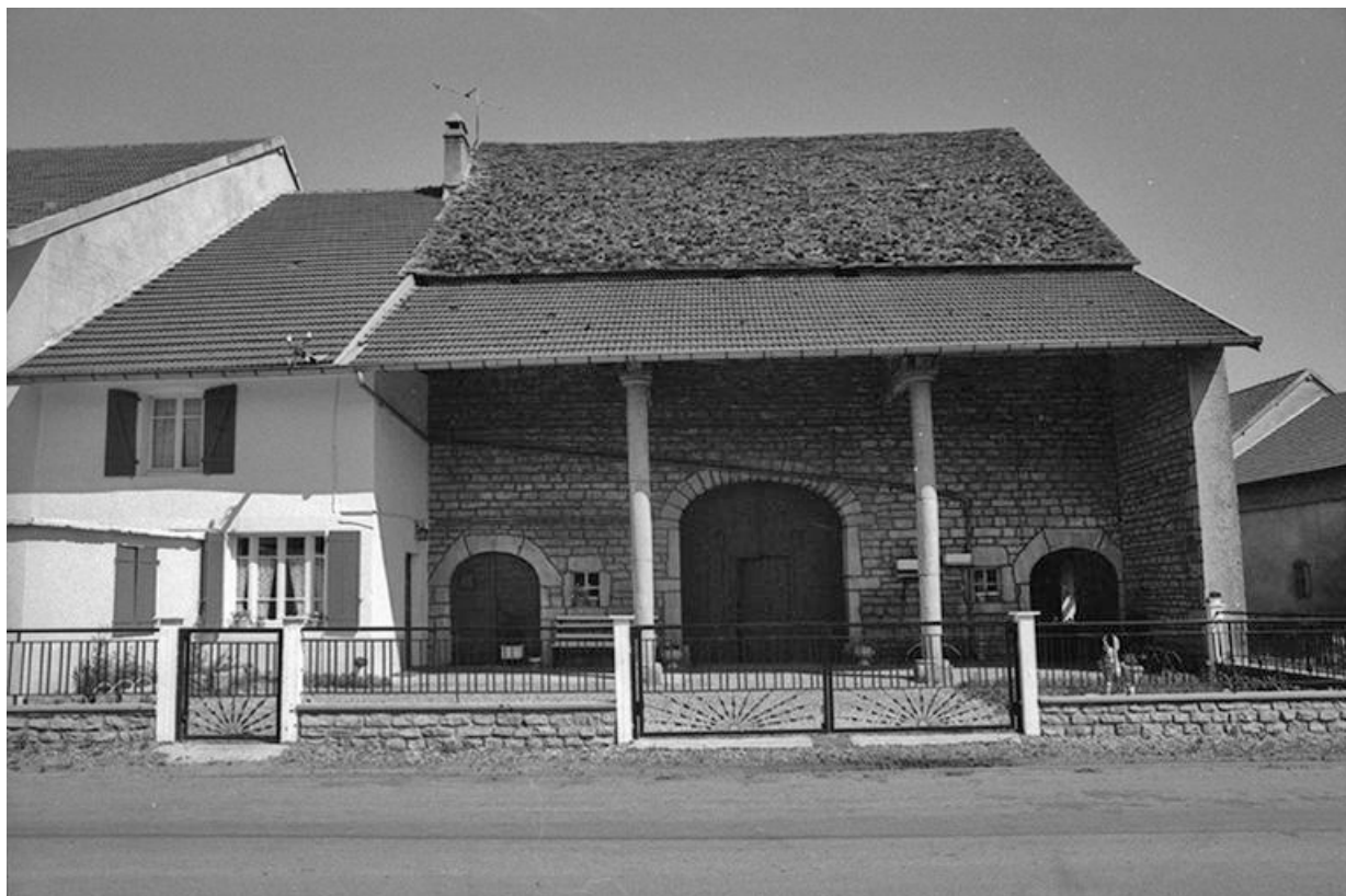
Ferme cadastrée 1957 A1 169 située le long du chemin de grande communication n° 4 d'Orgelet à Arbois : façade antérieure. 39, La Marre