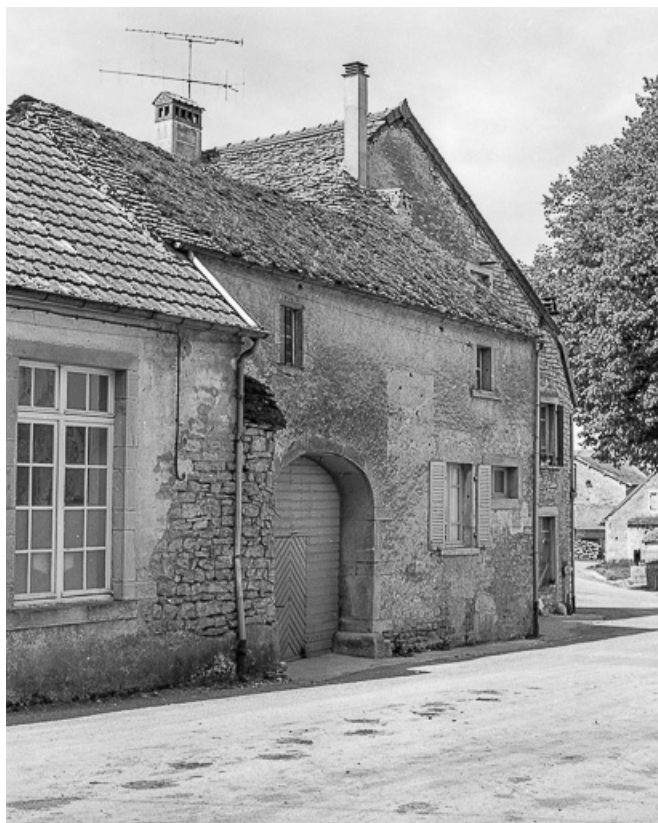
Ferme cadastrée 1957 A1 134 située place de l'Eglise : vue de trois quarts gauche. 39, La Marre