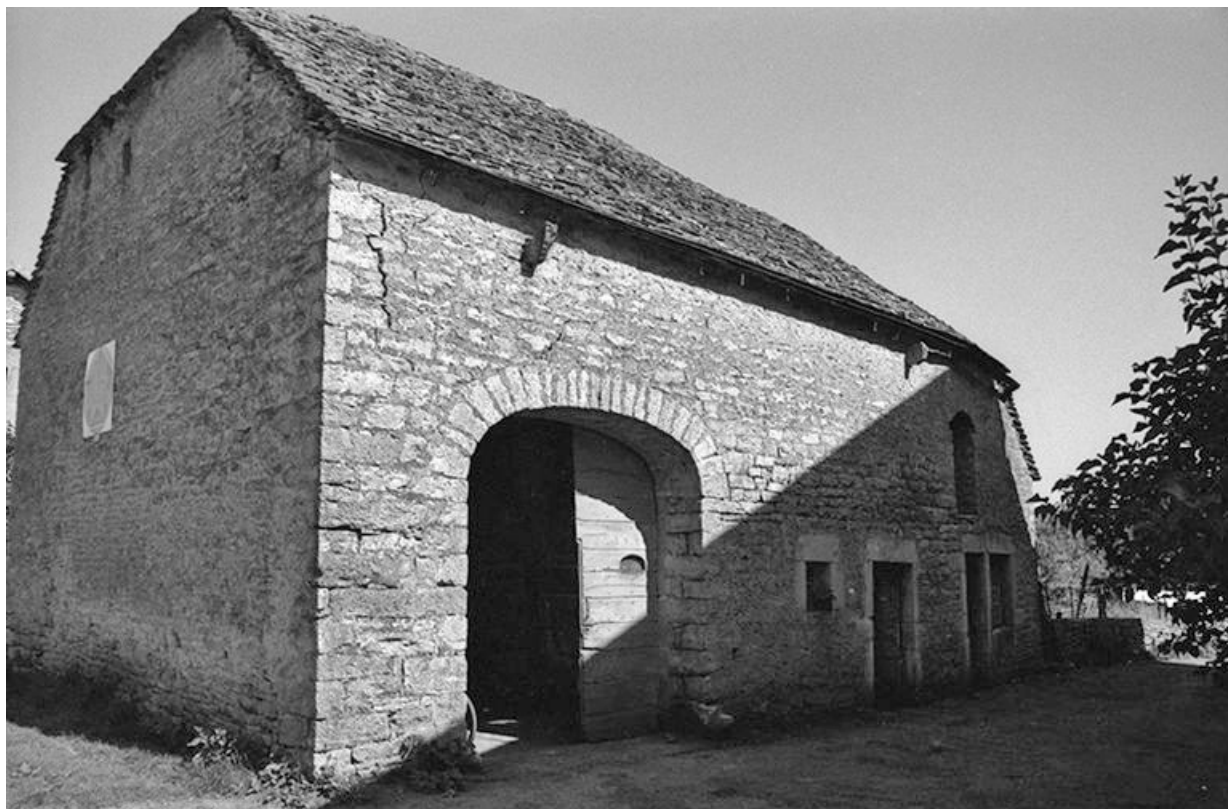
Ferme cadastrée 1957 A1 257, située le long du chemin de grande communication n° 4 d'Orgelet à Arbois : façade antérieure. 39, La Marre