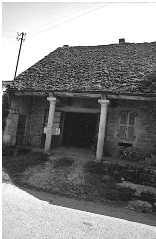
Ferme cadastrée 1957 A1 307, située le long du chemin de grande communication n° 96 de Plasne à Mirebel : façade antérieure 39, La Marre