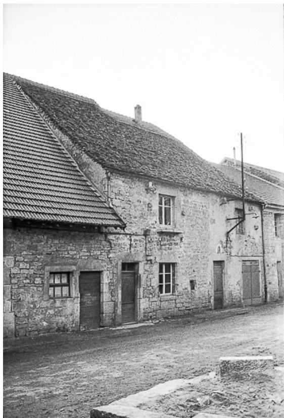
Ferme, XVe ou XVIe siècle : vue depuis la rue 39, La Marre