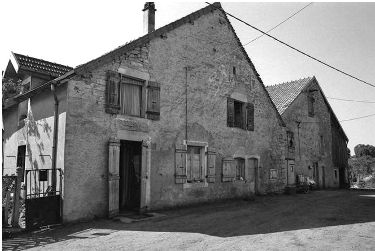
Maison cadastrée 1957 A1 73-74, située le long du chemin de grande communication n° 96 de Plasne à Mirebel : façade antérieure. 39, La Marre