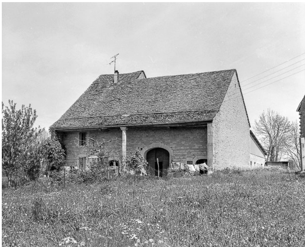
Ferme cadastrée 1957 A1 290, située route de Mirebel : vue de trois quarts droit. 39, La Marre