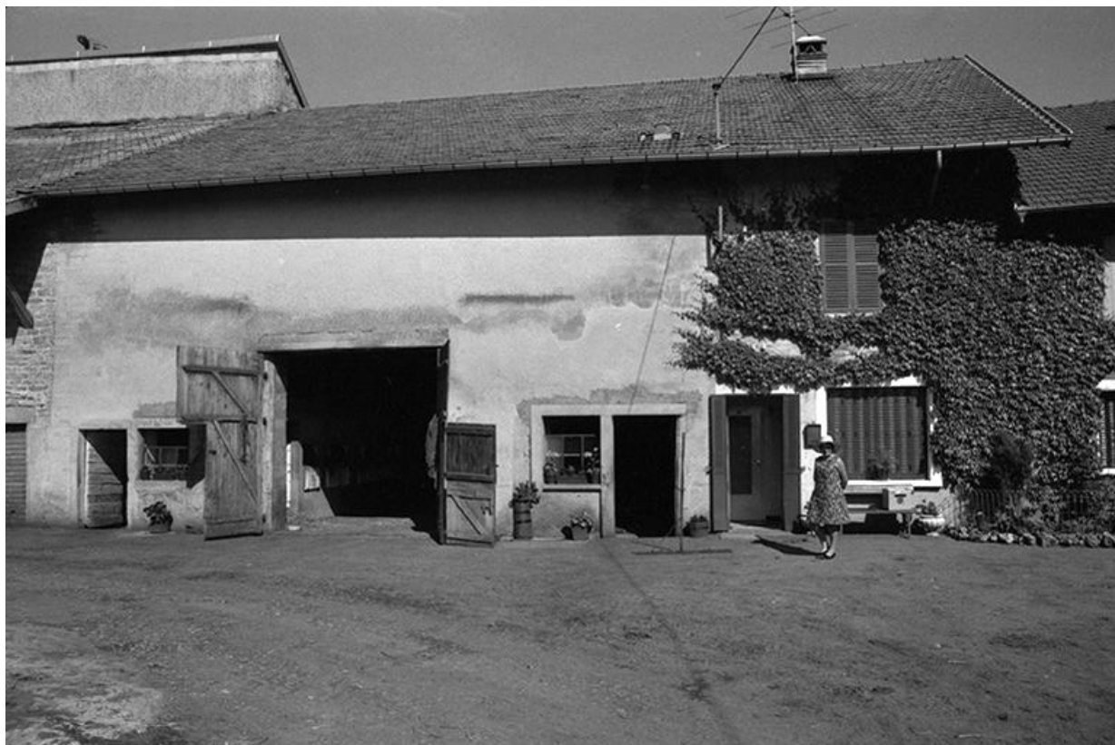
Ferme cadastrée 1957 A1 64 : façade antérieure. 39, La Marre