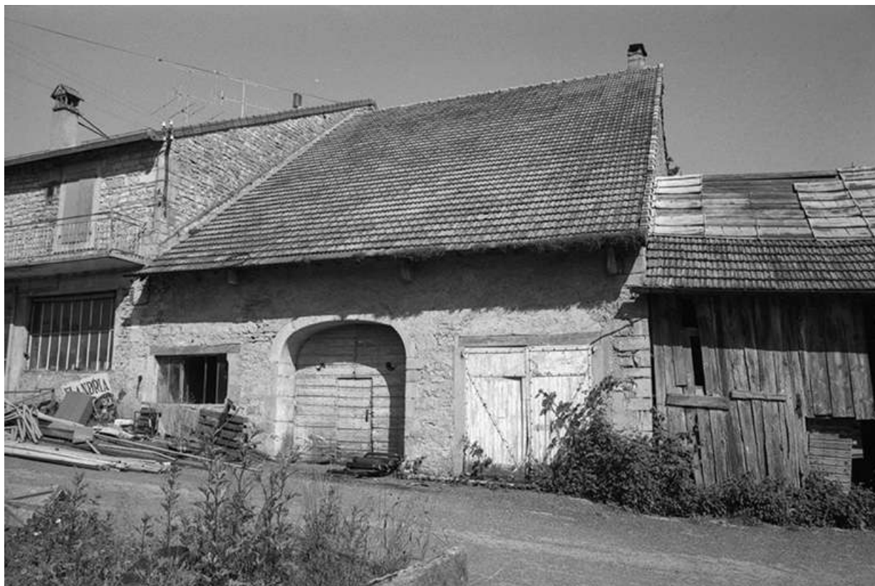
Ferme cadastrée 1957 A1 135-138 : façade postérieure. 39, La Marre