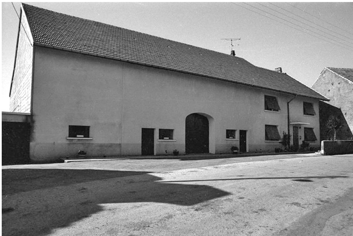
Ferme cadastrée 1957 A1 276, située le long du chemin de grande communication n° 4 d'Orgelet à Arbois : façade antérieure. 39, La Marre