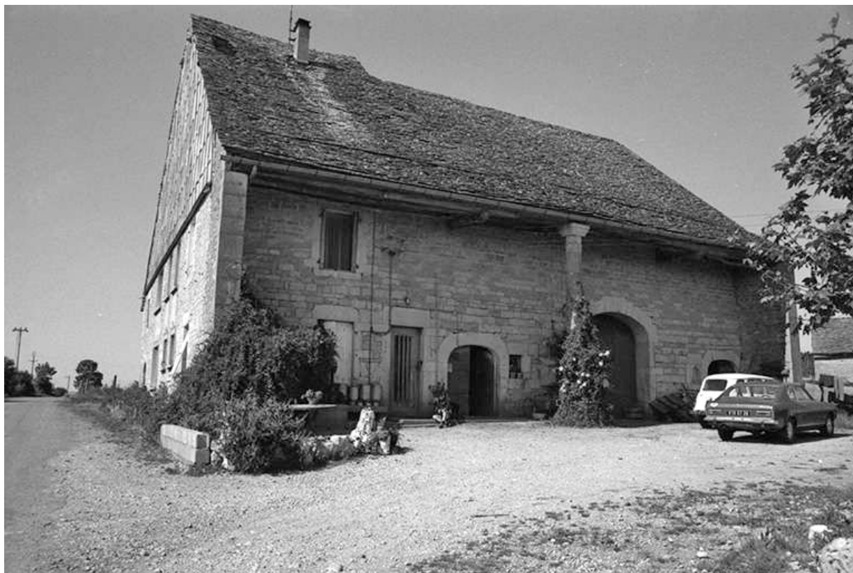
Ferme cadastrée 1957 A1 290, située chemin vicinal ordinaire de La Marre à Poligny : façades antérieure et latérale gauche. 39, La Marre