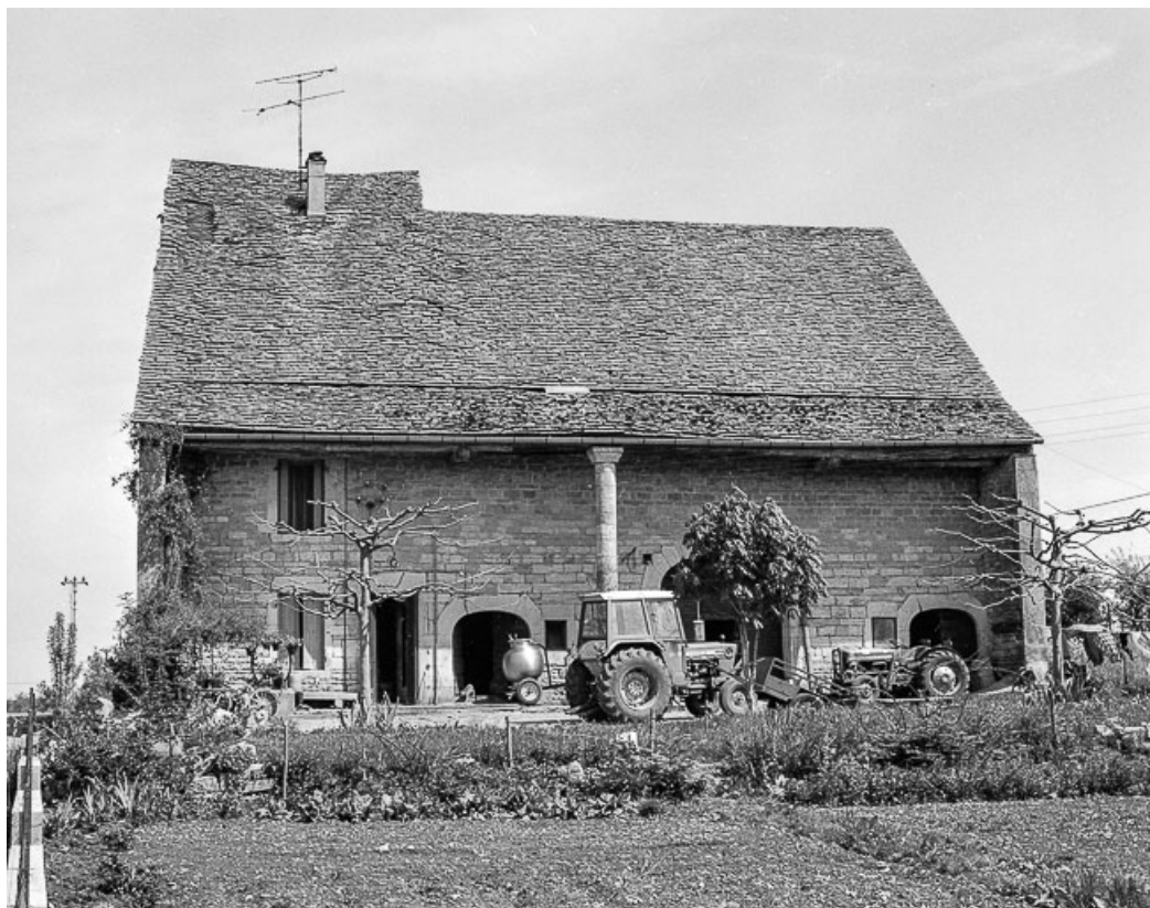
Ferme cadastrée 1957 A1 290 située route de Mirebel : vue d'ensemble. 39, La Marre