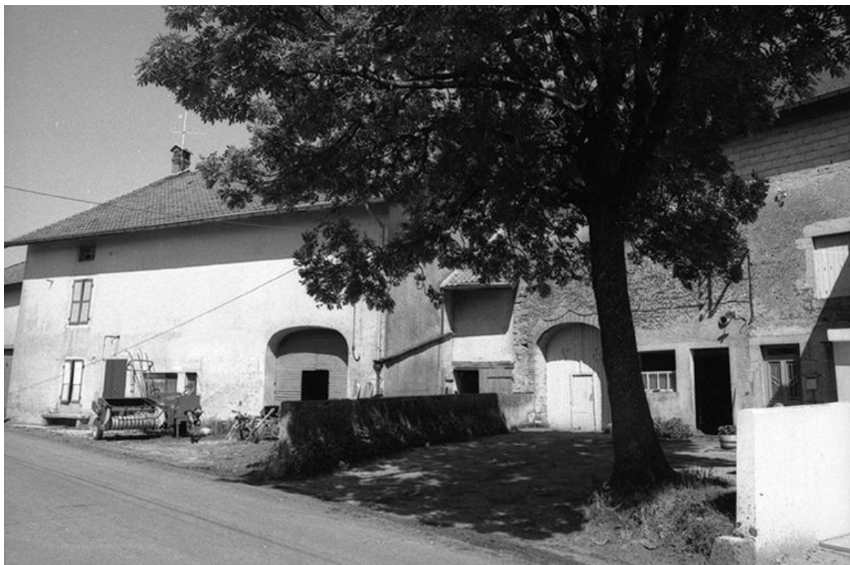
Ferme cadastrée 1957 A1 166, située le long du chemin de grande communication n° 4 d'Orgelet à Arbois : façade antérieure. 39, La Marre