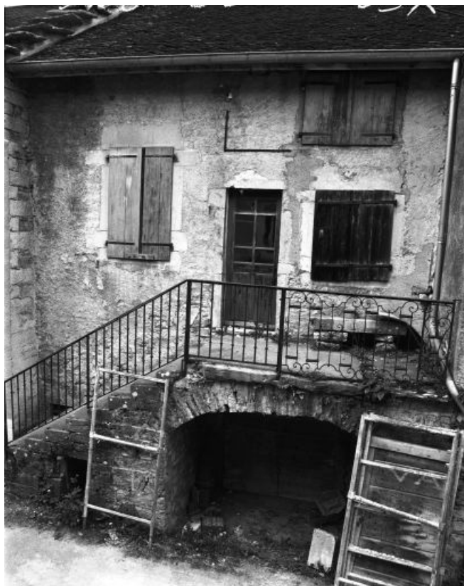
Façade antérieure vue de face en 1981.