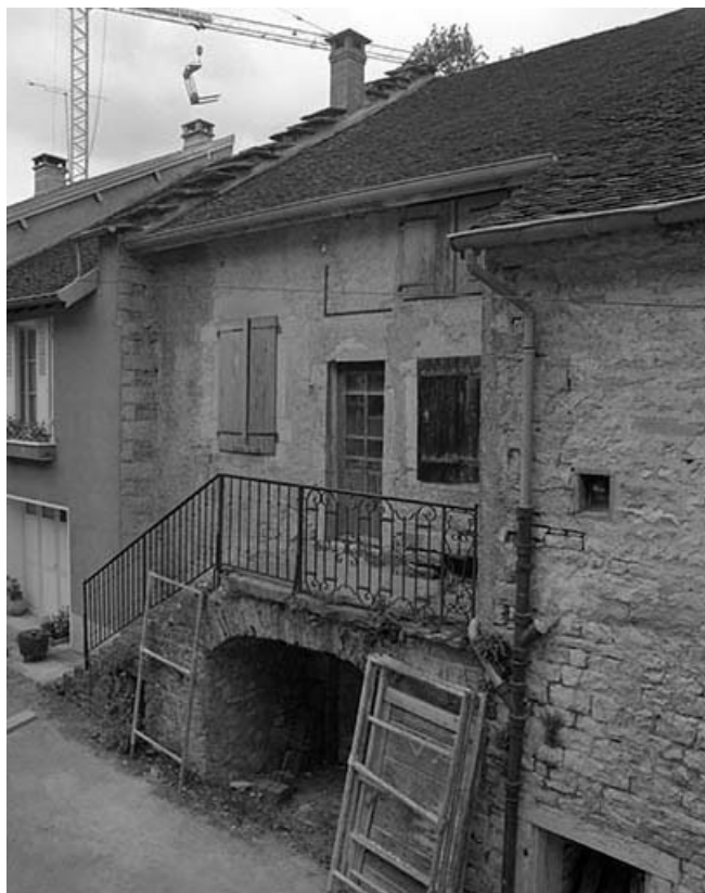
Façade antérieure vue de trois quarts en 1981.