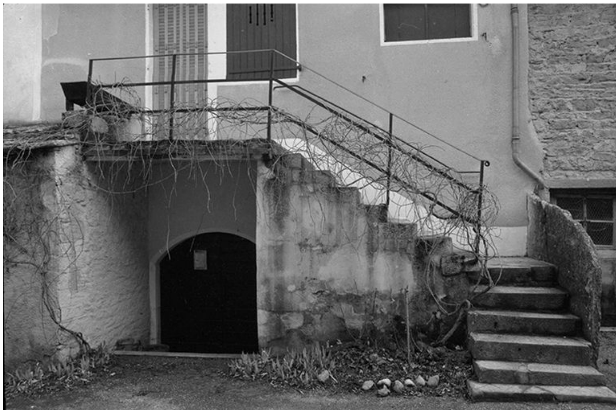
Maison cadastrée 1967 AH 154, située impasse du Quart d'Amont (1730 ?) : escalier extérieur, balcon et cave. 39, Lavigny