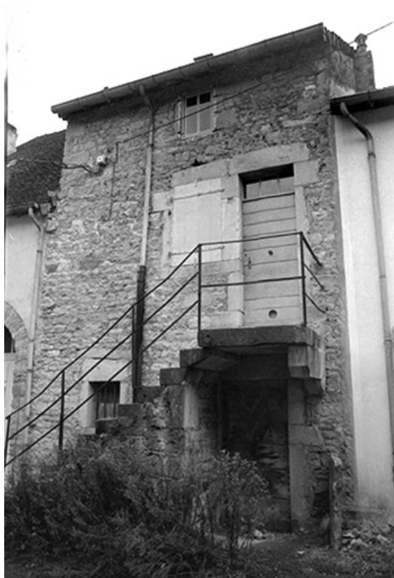
Maison cadastrée 1967 AH 152 (?), située impasse du Quart d'Amont : façade antérieure. 39, Lavigny