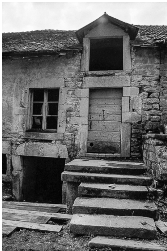
Maison cadastrée 1967 AH 242, située rue des Fontaines : façade antérieure. 39, Lavigny