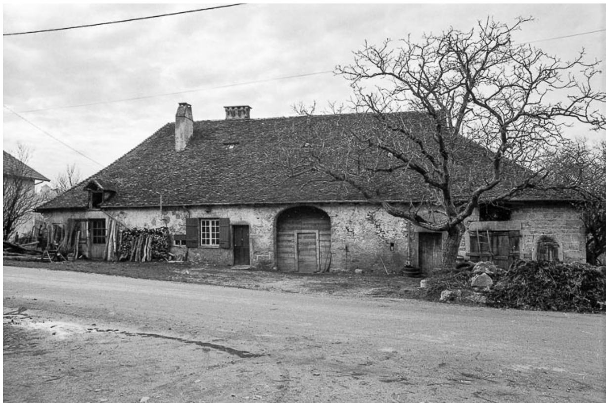
Maison cadastrée 1967 AH 220, située au lieu-dit Traverse de Lavigny : : façade antérieure. 39, Lavigny