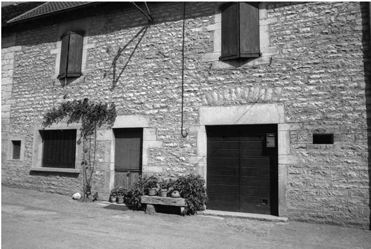
Maisons cadastrées 1967 AH 71-74, situées le long du chemin départemental n° 209 E : façades antérieures. 39, Lavigny