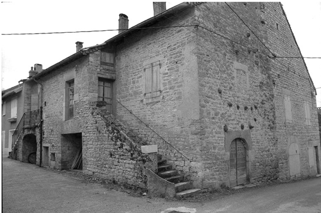
Maison cadastrée 1967 AH 149, située impasse du Quart d'Amont : façades antérieure et latérale droite. 39, Lavigny