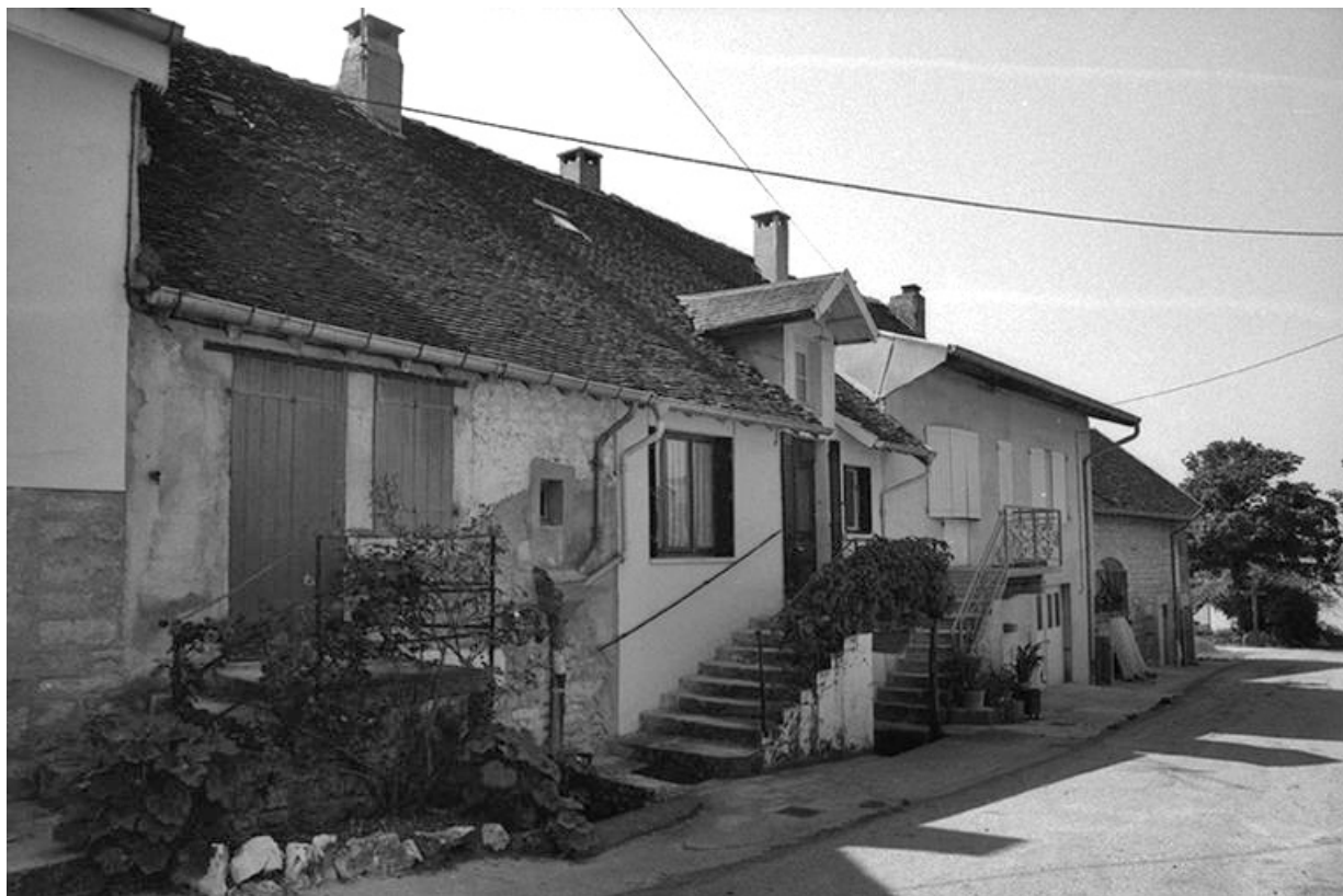
Maison cadastrée 1967 AH 95, 96 et 100, situées le long du chemin départemental n° 209 E : façades antérieures. 39, Lavigny