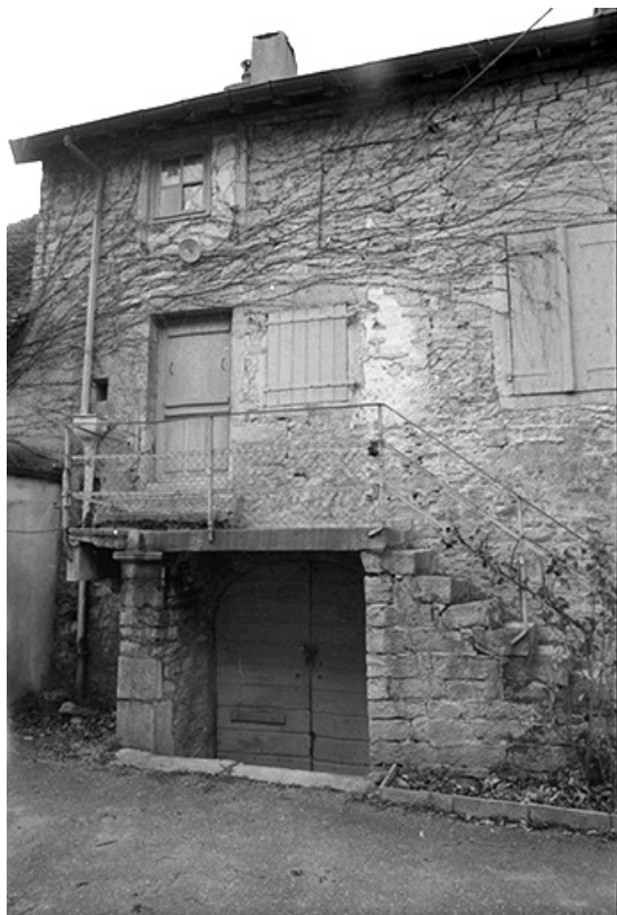
Maison cadastrée 1967 AH 146, située impasse du Quart d'Amont : façade antérieure. 39, Lavigny