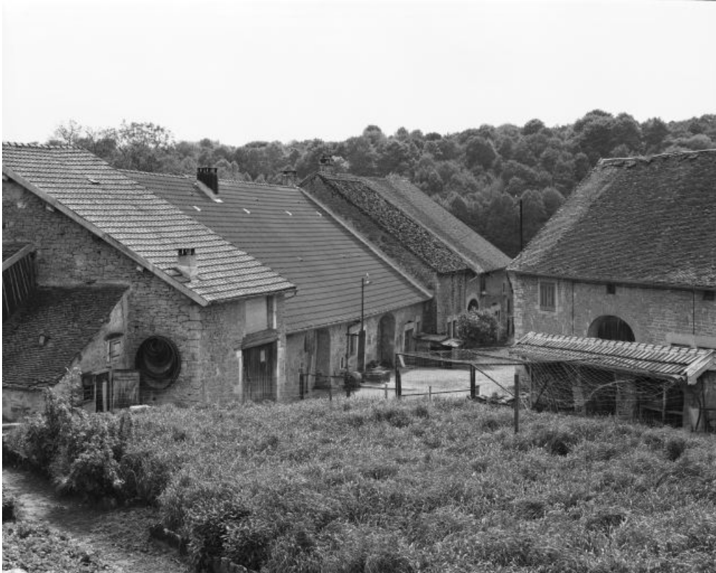
Vue générale du hameau.