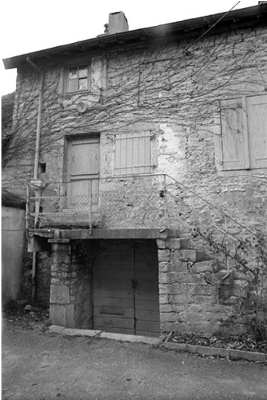
Maison cadastrée 1967 AH 146, située impasse du Quart d'Amont : façade antérieure. 39, Lavigny