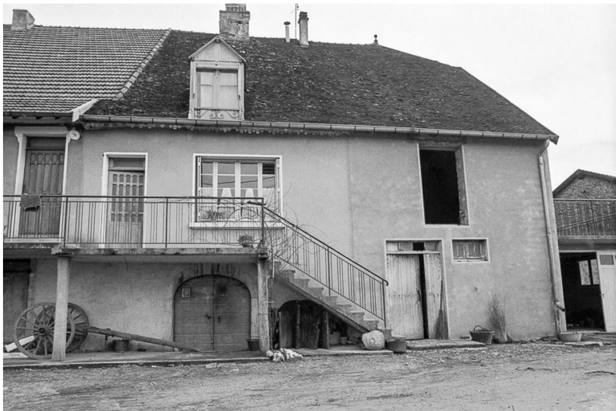
Maison cadastrée 1967 AH 124 : façade antérieure.