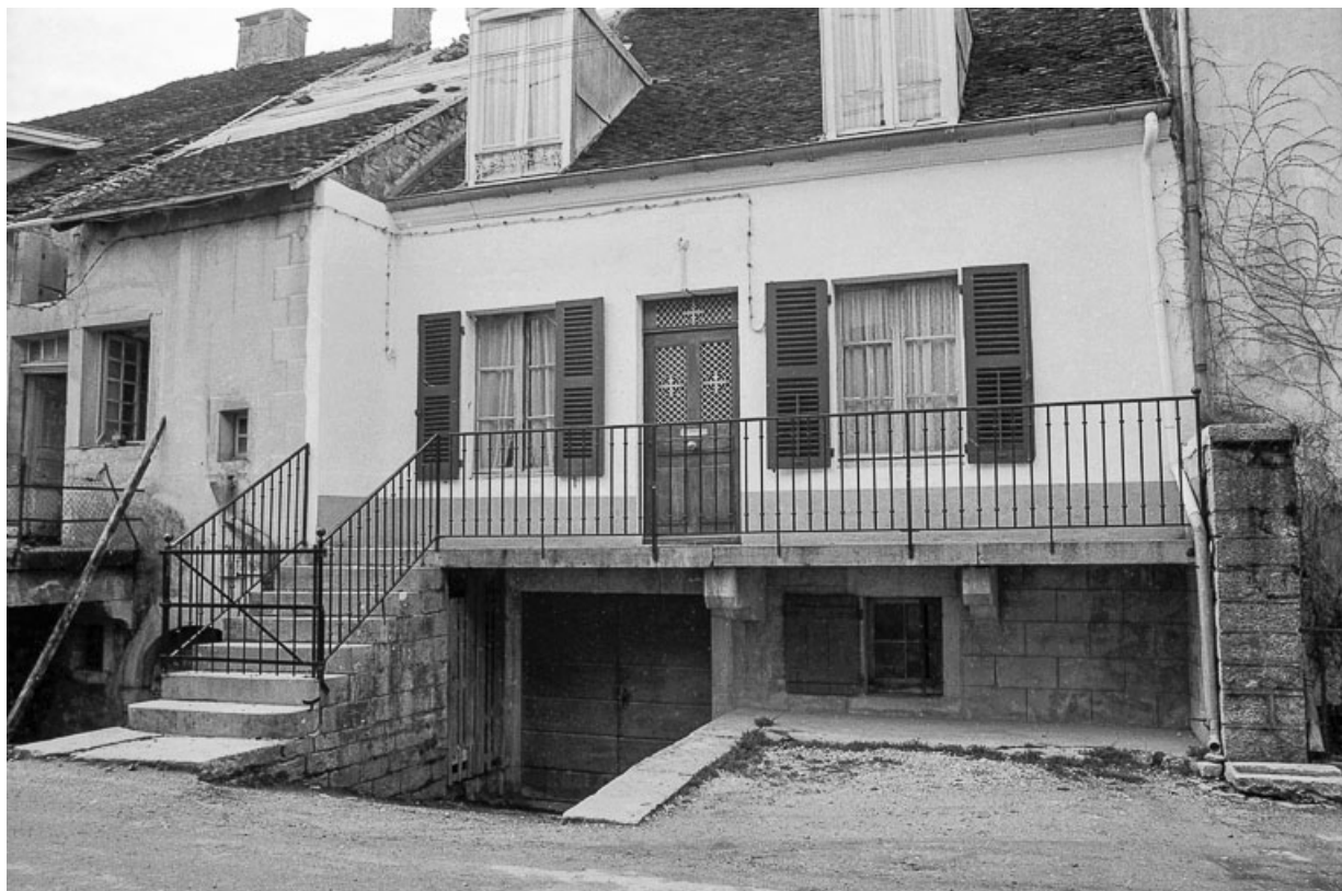
Maison cadastrée 1967 AH 199 : façade antérieure.