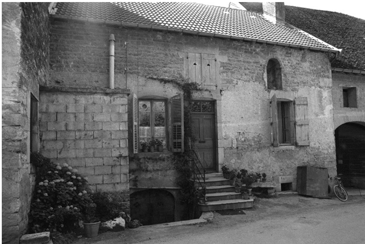
Maison cadastrée 1967 AH 121, située le long du chemin départemental n° 209 E : façade antérieure. 39, Lavigny