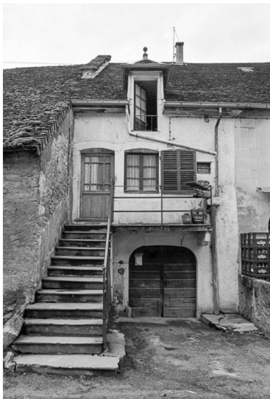
Maison cadastrée 1967 AH 203 : façade antérieure. 39, Lavigny