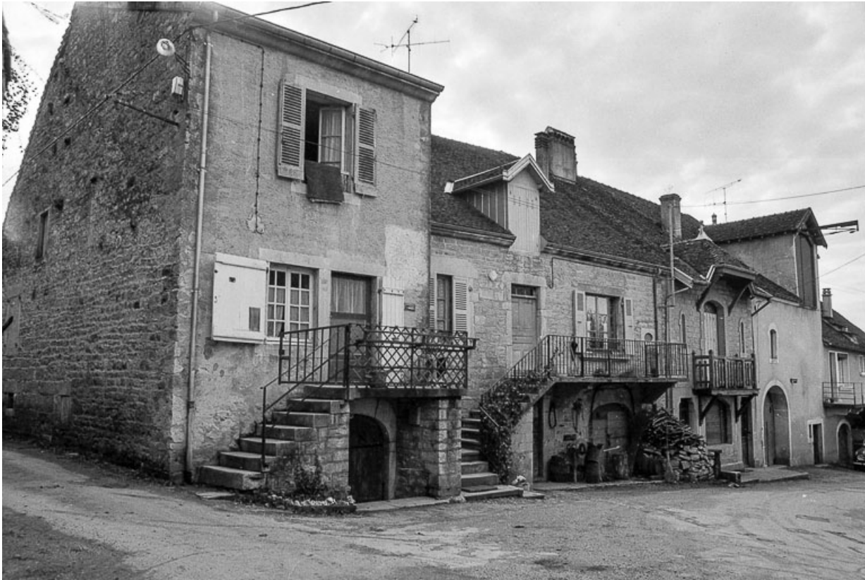
Maison cadastrée 1967 AH 244-246, située au lieu-dit Traverse de Lavigny : façades antérieures.