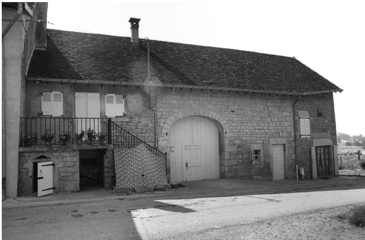
Maison cadastrée 1967 AH 101, située le long du chemin départemental n° 209 E : façade antérieure. 39, Lavigny