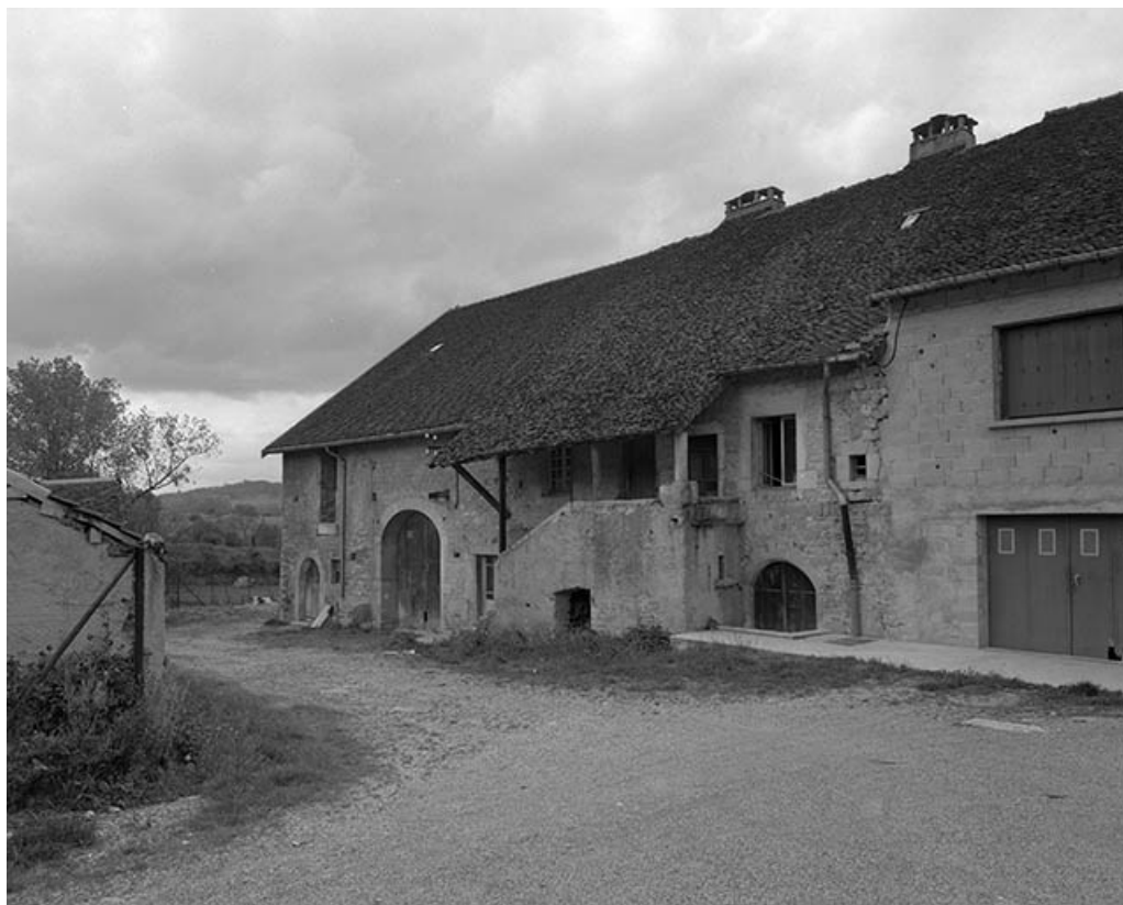
Façade antérieure, vue de trois quarts droit.