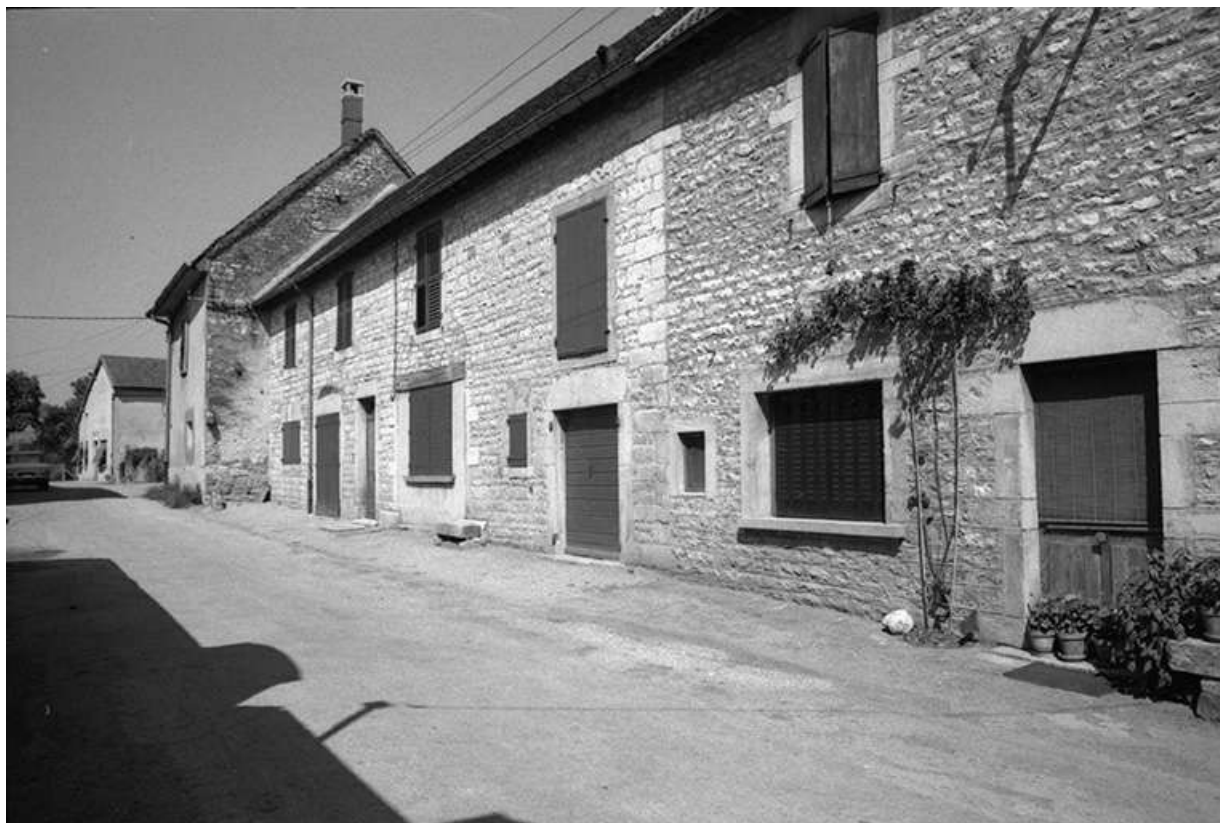
Maisons cadastrées 1967 AH 71-74, situées le long du chemin départemental n° 209 E : façades antérieures vues de trois-quarts droit.