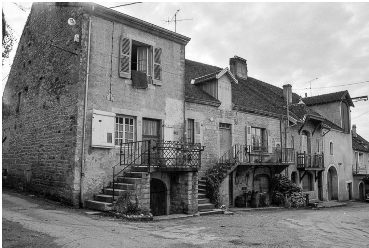
Maison cadastrée 1967 AH 244-246, située au lieu-dit Traverse de Lavigny : façades antérieures.