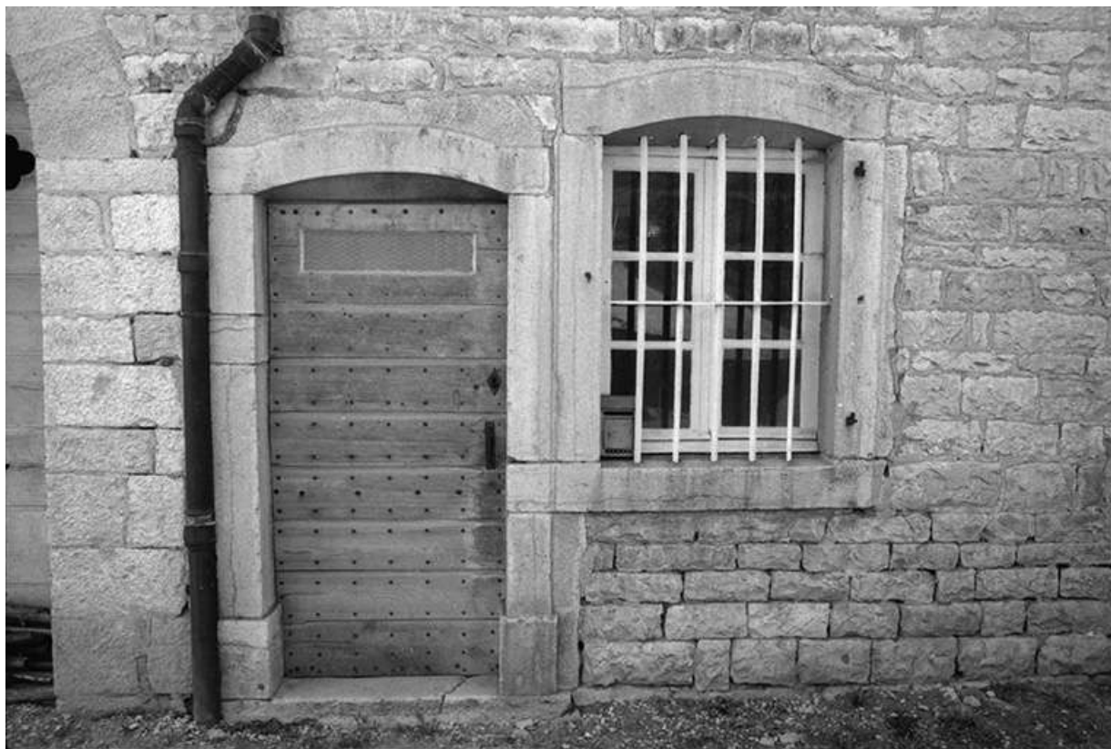
Ferme cadastrée 1967 AH 87, située le long du chemin départemental n° 209 E : porte d'entrée et fenêtre. 39, Lavigny