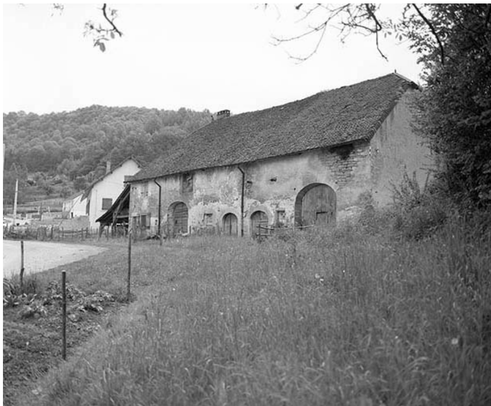
Façade antérieure : vue de trois quarts droit.