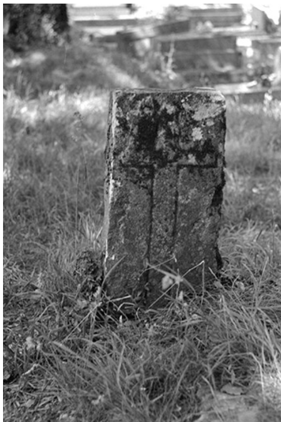
Borne de cimetière en calcaire, XVIIe siècle (?) : vue de face 39, Frontenay, lieudit : Château