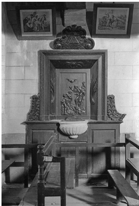
Fonts baptismaux et retable, XVIIIe et XIXe siècles en pierre et bois : vue d'ensemble. 39, Frontenay, lieudit : Château