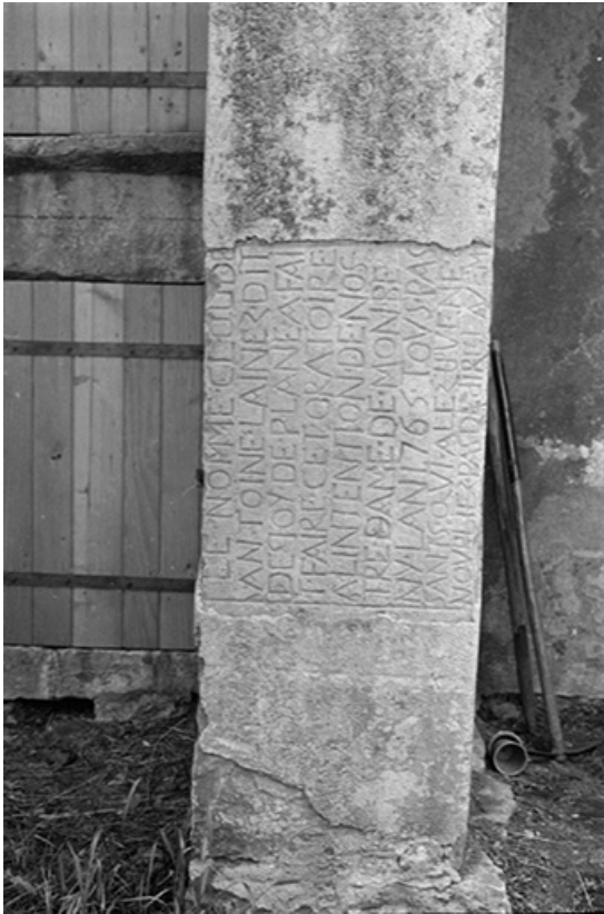
Fragment d'oratoire en calcaire, 1765 : vue de face 39, Frontenay, lieudit : Château