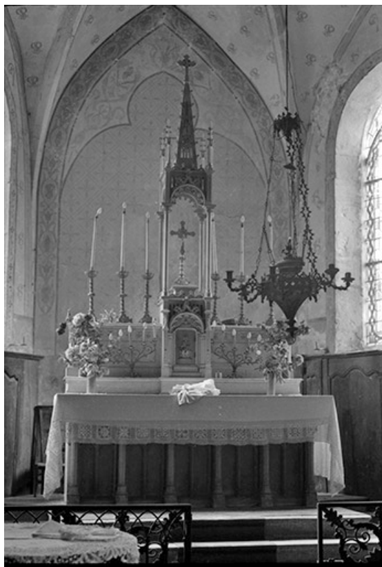
Maître-autel du XXe siècle en pierre : vue d'ensemble.