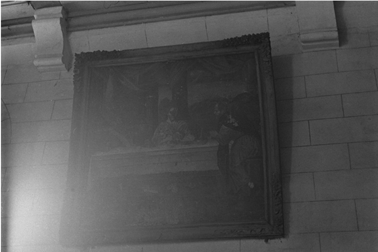
Tableau représentant les Pèlerins d'Emmaüs, XIXe siècles : vue de face