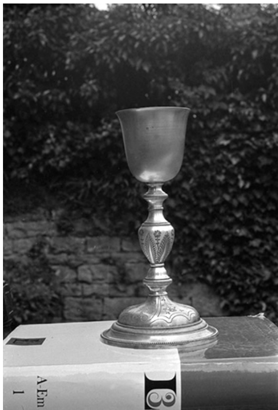
Calice en argent , XIXe siècle : vue d'ensemble