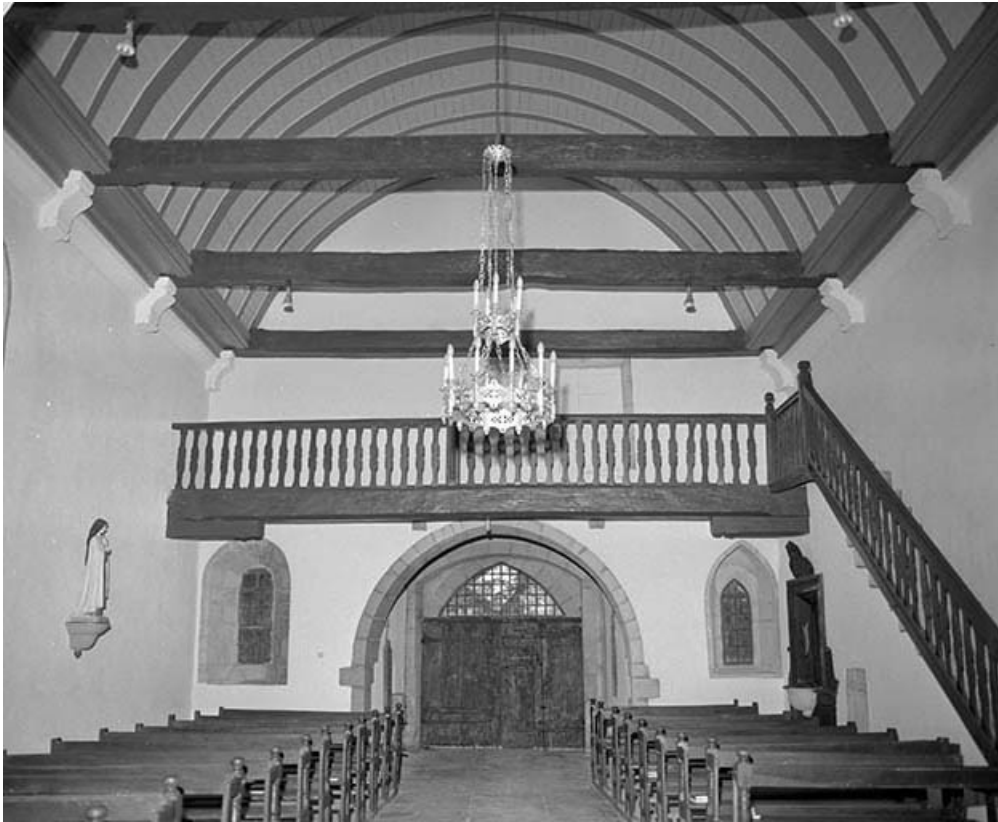
Nef vue depuis la chœur.