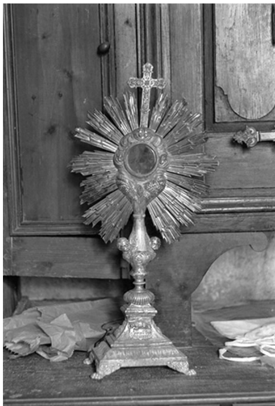
Ostensoir en cuivre repoussé argenté et doré, XIXe siècle : vue d'ensemble 39, Frontenay, lieudit : Château