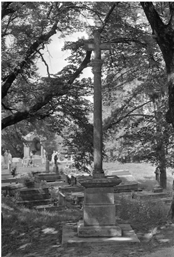
Croix de cimetière en calcaire, 1732 : vue d'ensemble 39, Frontenay, lieudit : Château