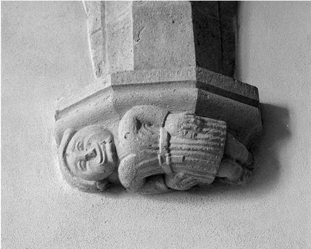
Choeur : culot en pierre.