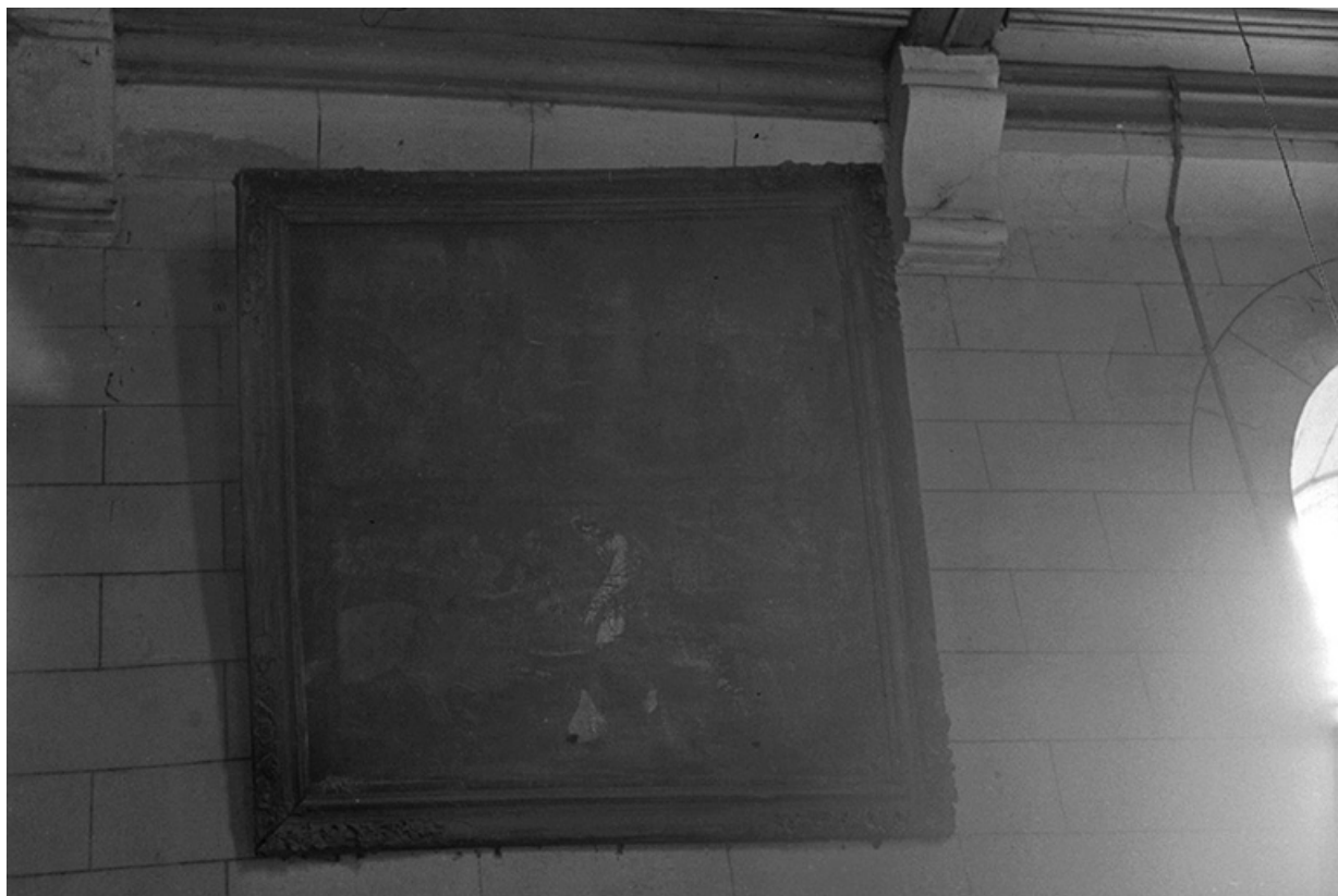
Tableau représentant le Lavement des pieds, XIXe siècles : vue de face