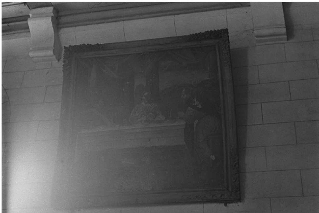
Tableau représentant les Pèlerins d'Emmaüs, XIXe siècles : vue de face 39, Frontenay, lieudit : Château