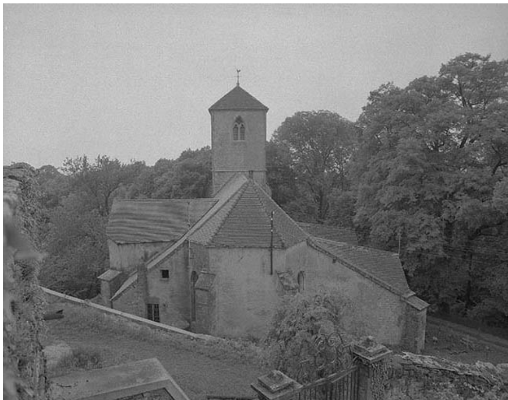
Vue générale depuis le château.