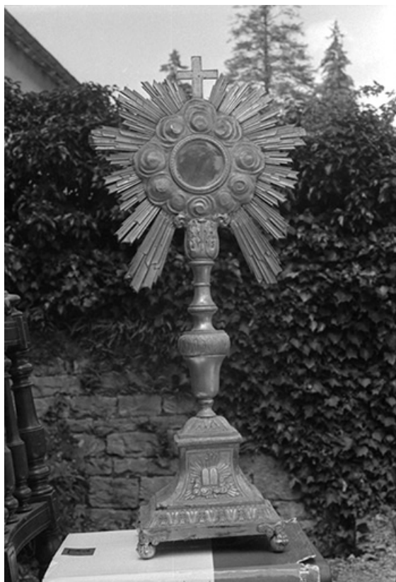
Ostensoir en cuivre repoussé doré, XIXe siècle : vue d'ensemble