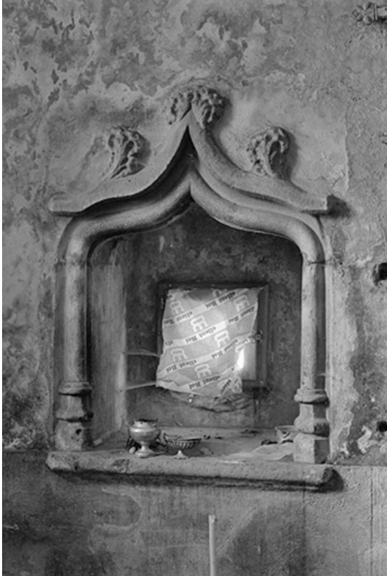
Fontaine de sacristie.