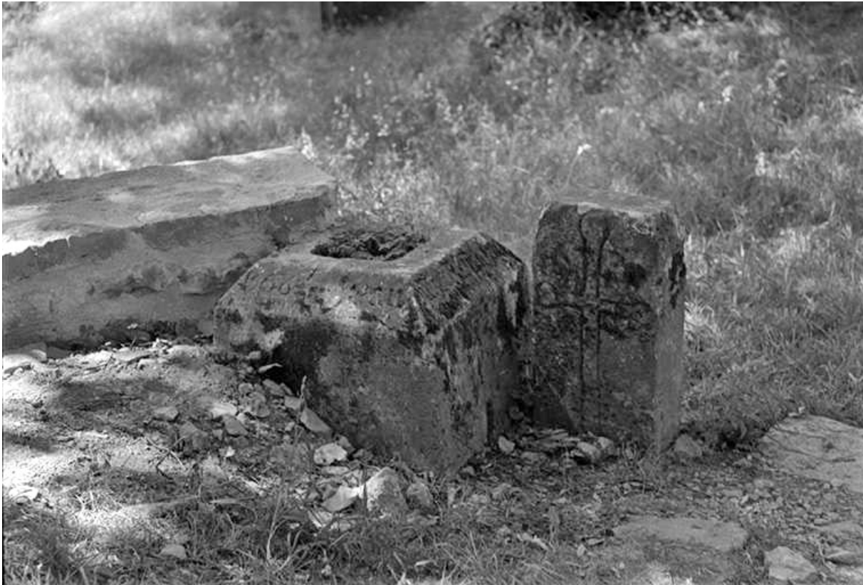
Socle d'une croix de cimetière en calcaire, 1568 : fragments