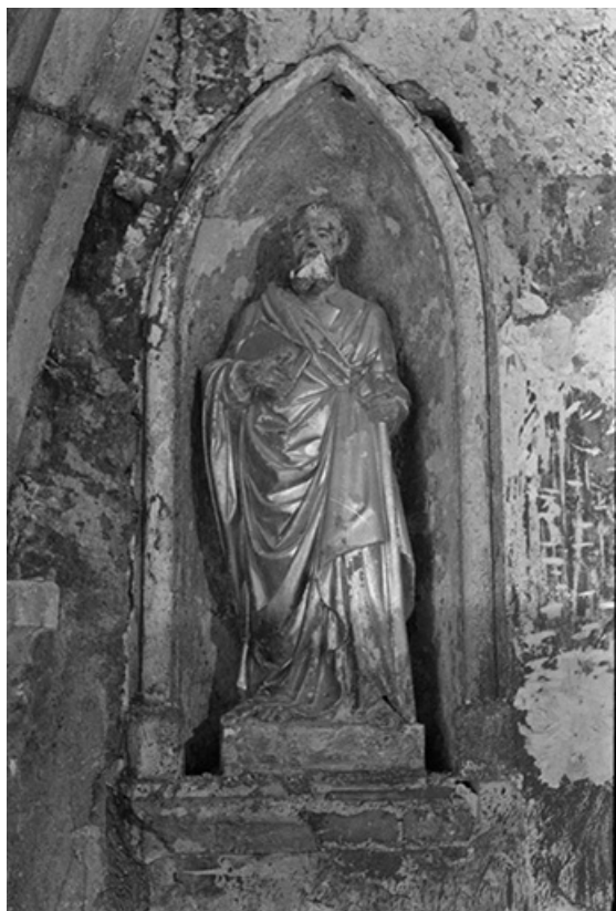
Statue de saint Paul en bois peint et doré, XIXe siècles : vue de face 39, Frontenay, lieudit : Château