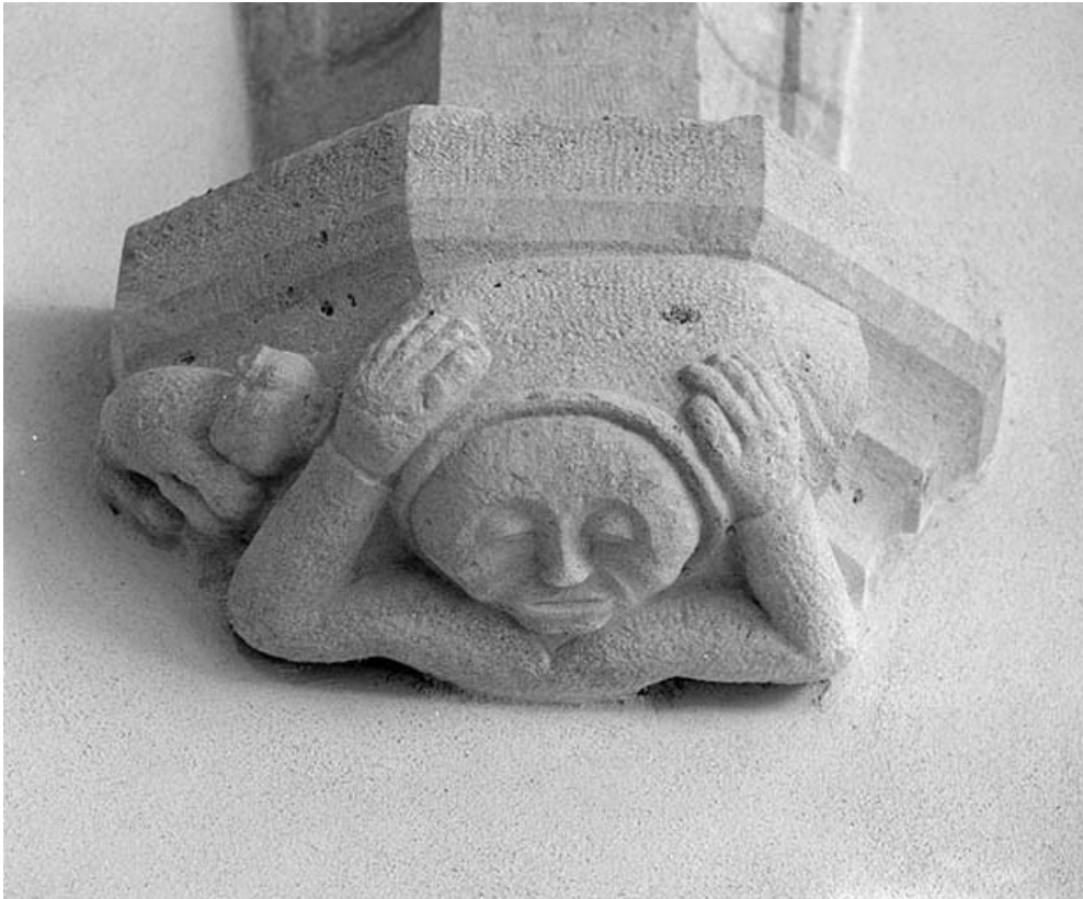
Choeur : culot en pierre.