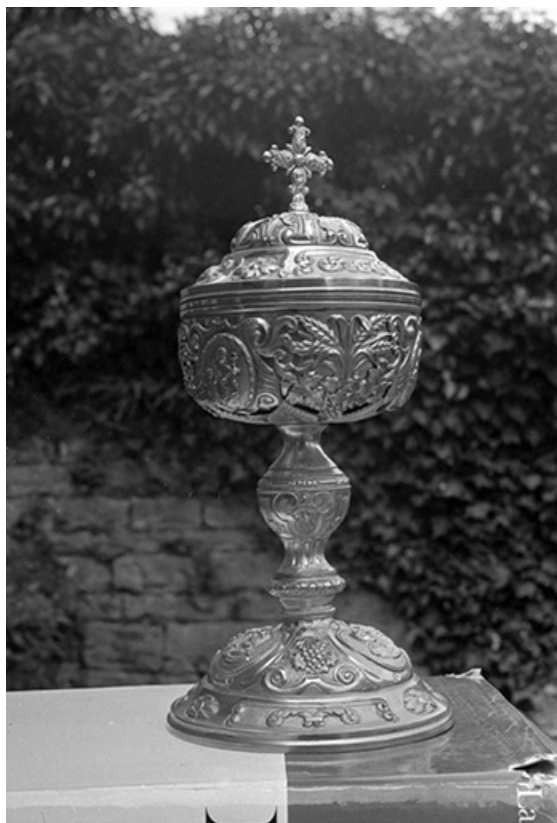
Ciboire en cuivre repoussé, XIXe siècle : vue d'ensemble 39, Frontenay, lieudit : Château