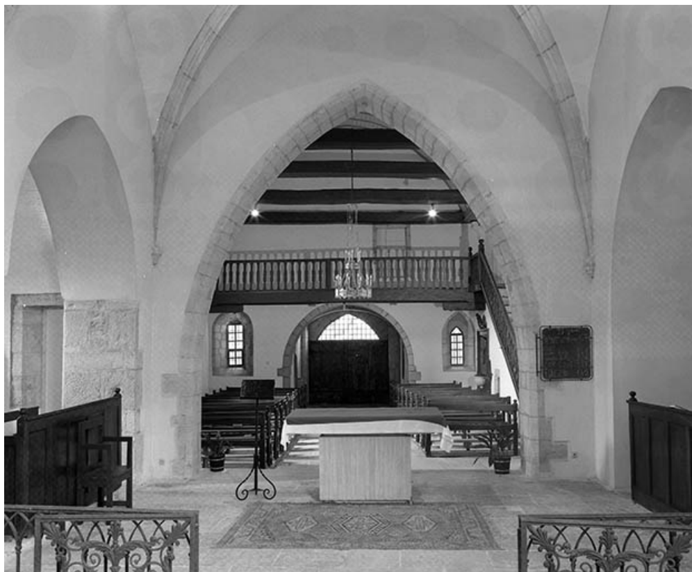
Nef vue depuis la choir.