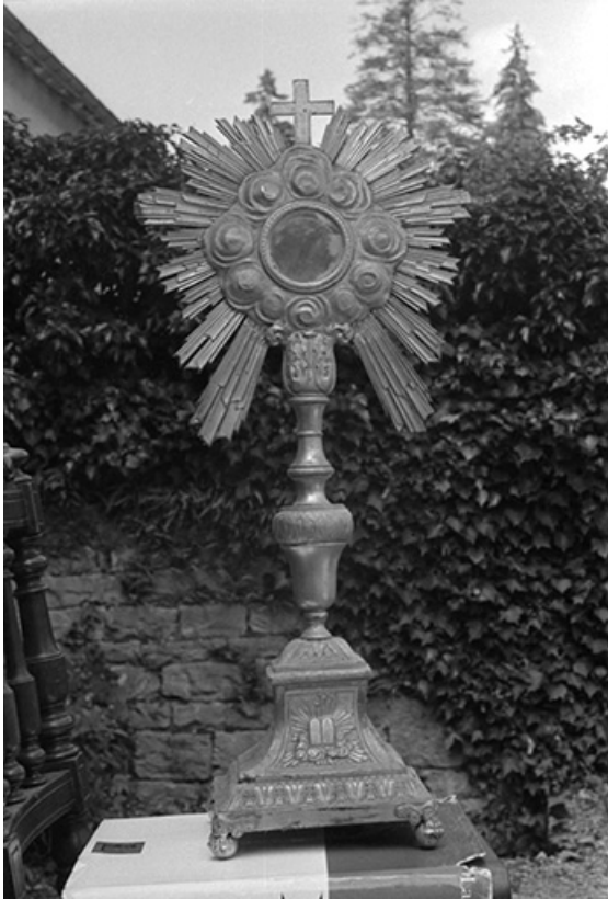
Ostensoir en cuivre repoussé doré, XIXe siècle : vue d'ensemble