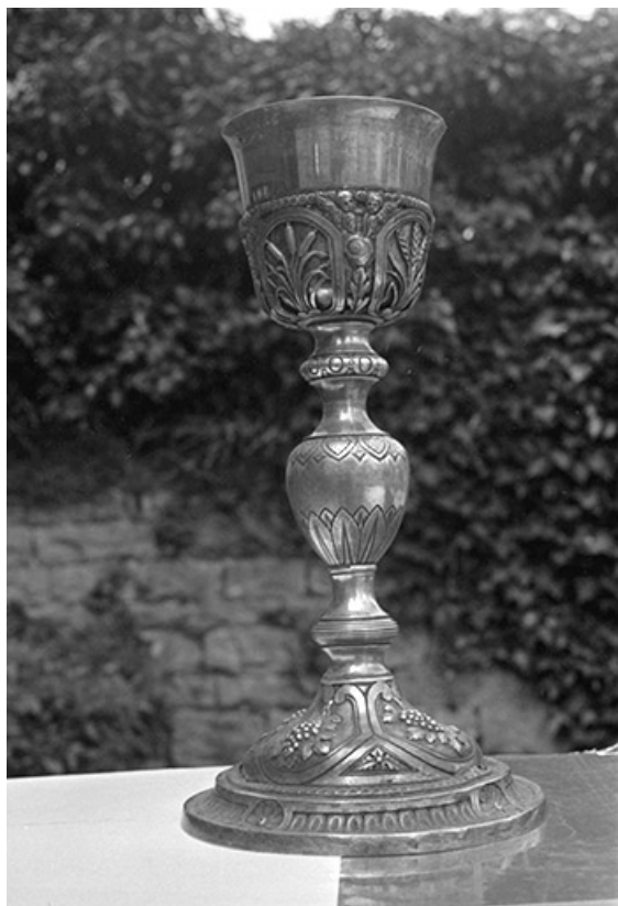
Calice en argent doré, XIXe siècles : vue d'ensemble