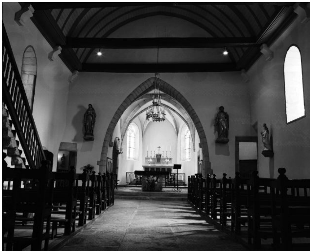
La nef et le chœur vus depuis l'entrée.