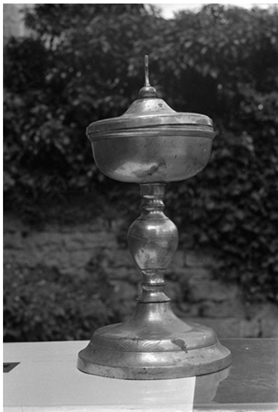
Ciboire en argent, XIXe siècle : vue d'ensemble