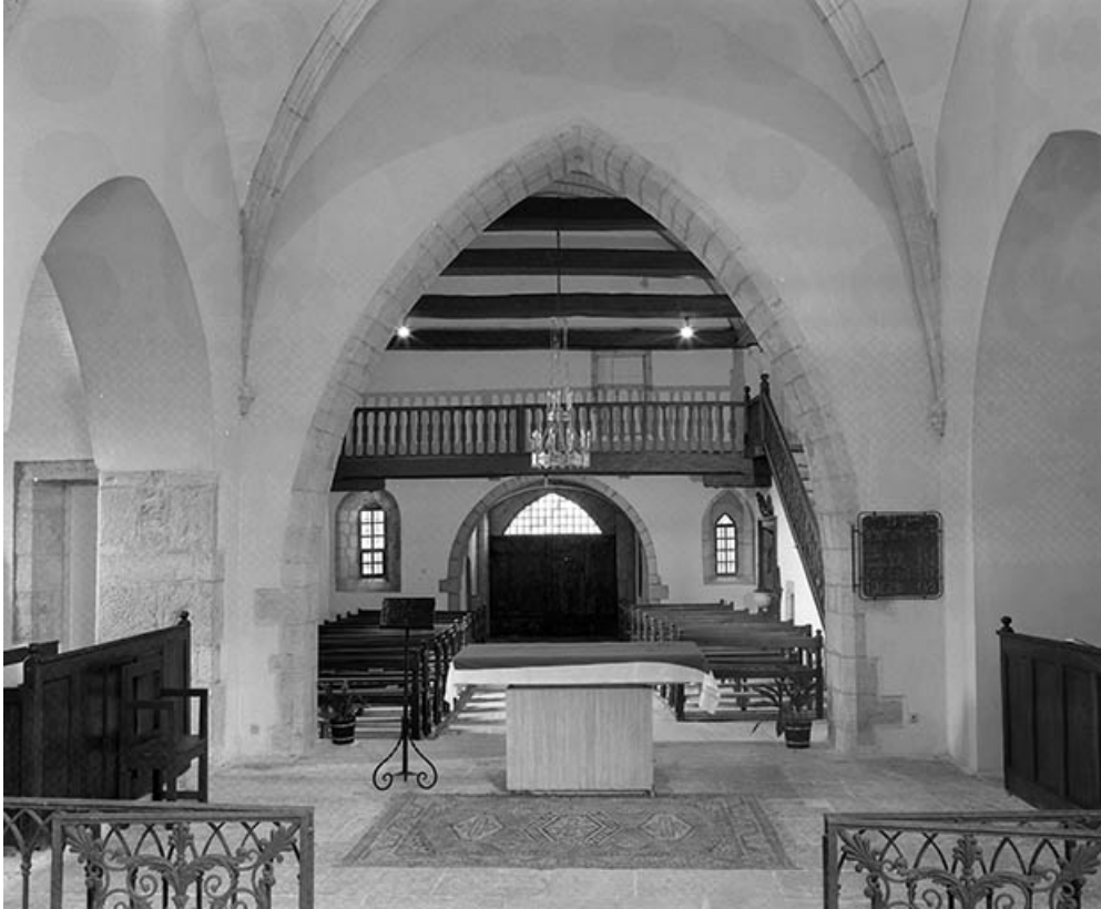
Nef vue depuis la chœur.