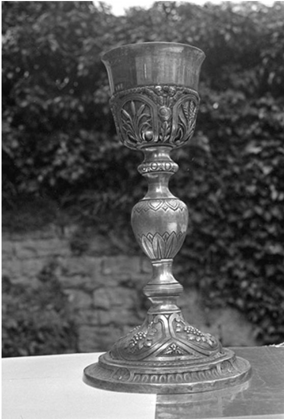
Calice en argent doré, XIXe siècles : vue d'ensemble