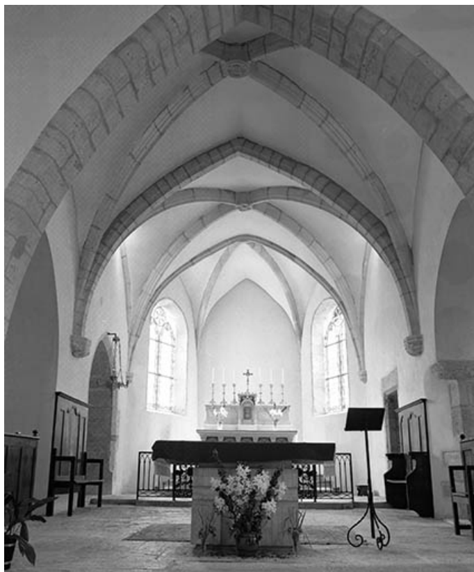
Choeur vu depuis la nef.