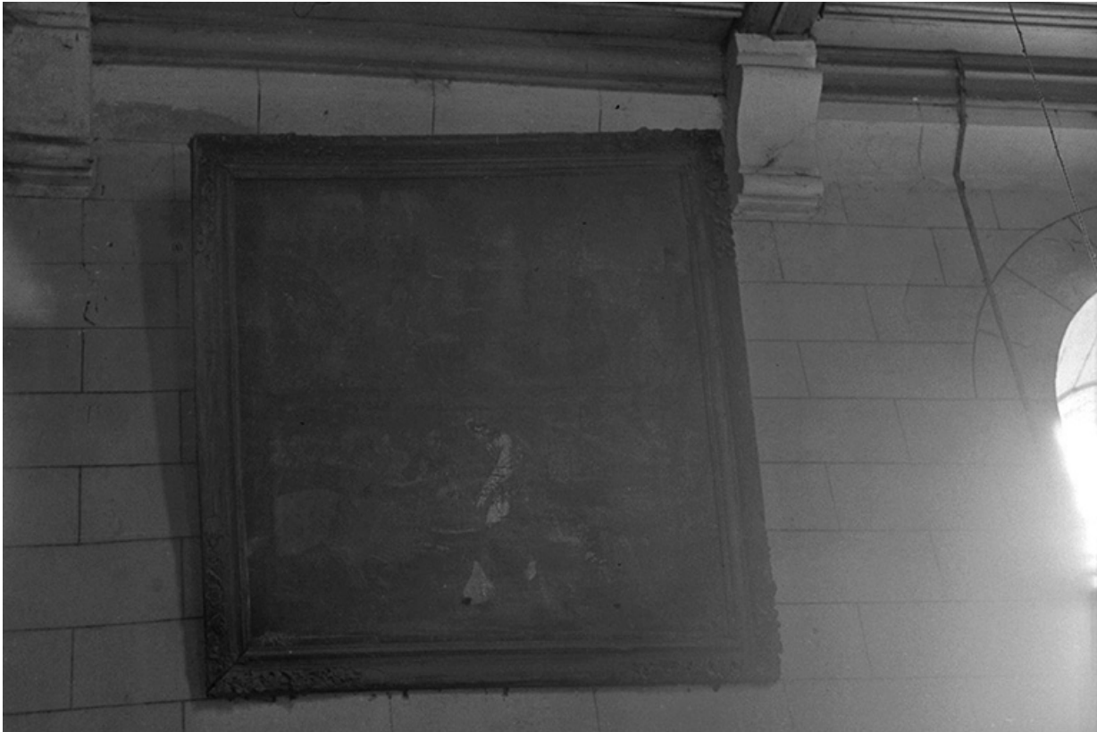
Tableau représentant le Lavement des pieds, XIXe siècles : vue de face