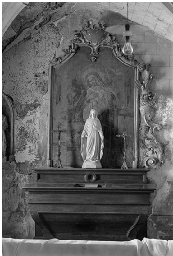
Autel latéral nord du XVIIIe siècle en pierre : vue d'ensemble.