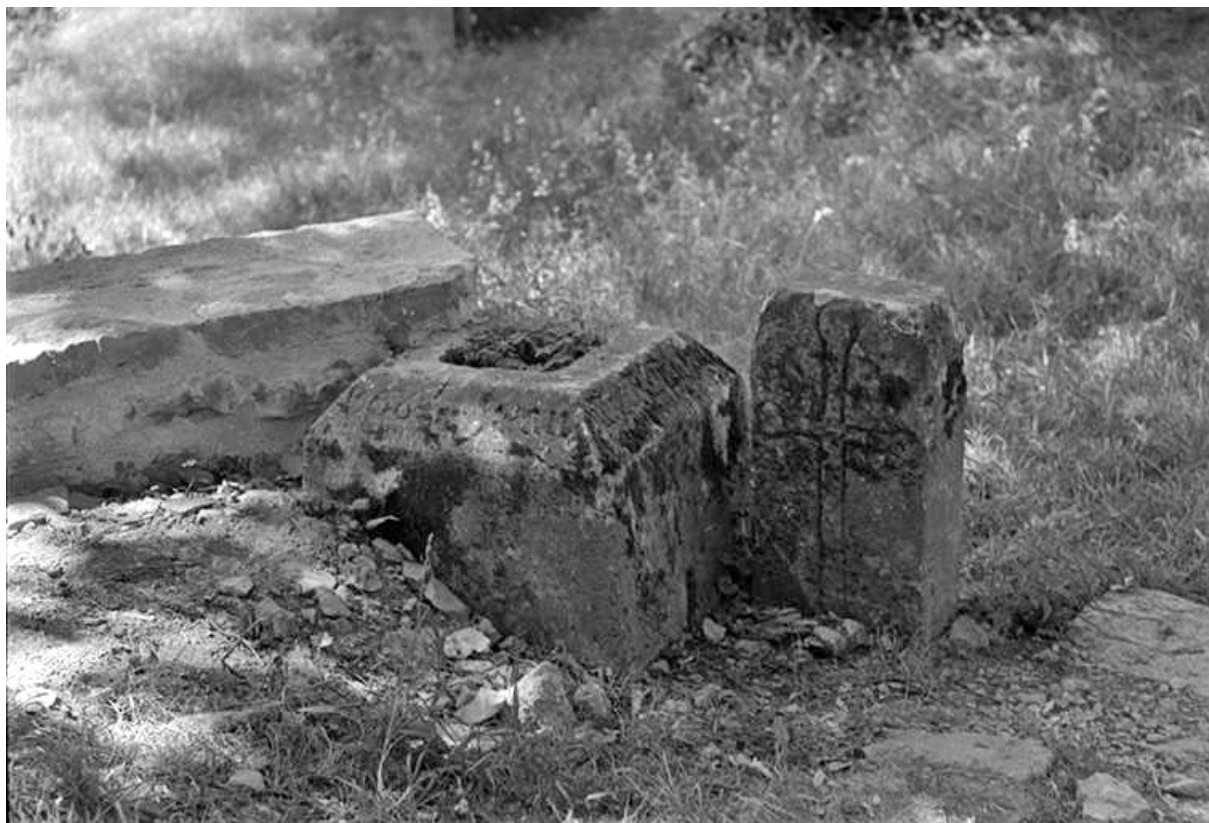
Socle d'une croix de cimetière en calcaire, 1568 : fragments