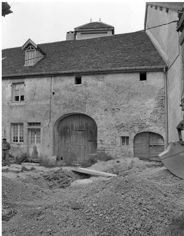
Façade antérieure, partie droite.