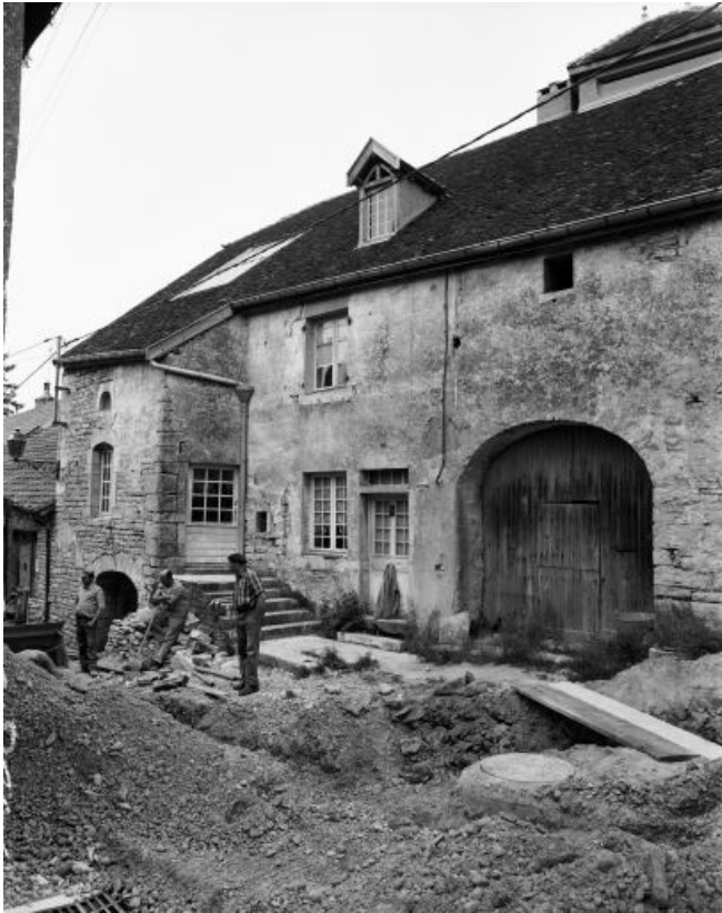
Façade antérieure, partie gauche.