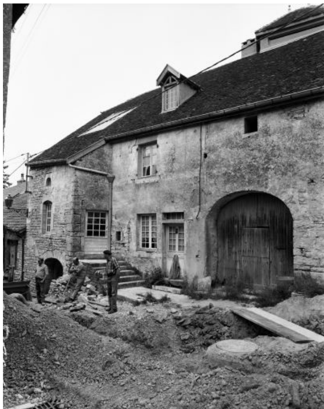
Façade antérieure, partie gauche.