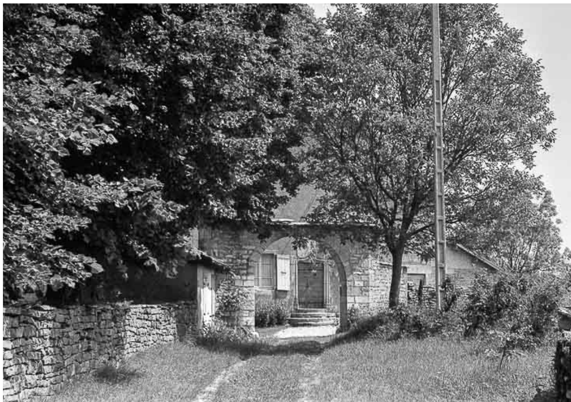
Porte surmontée d'un arc en accolade : vue depuis le porche d'entrée.