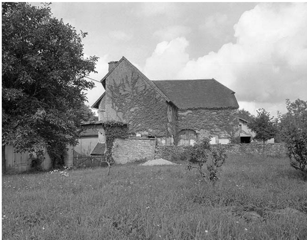
Vue générale depuis le sud.