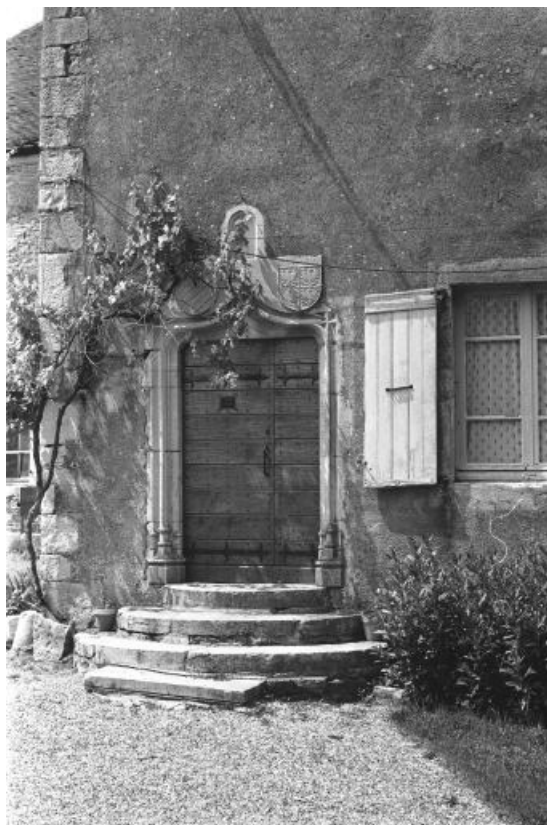
La porte d'entrée.