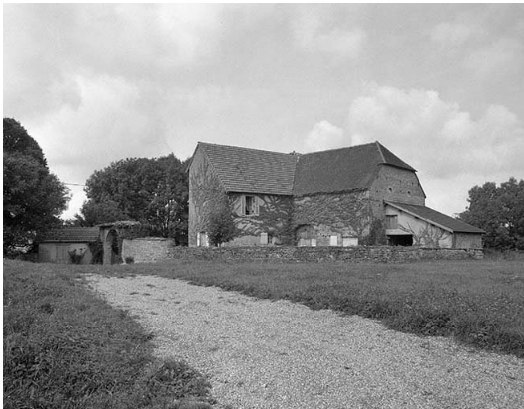
Vue générale depuis le sud-est.