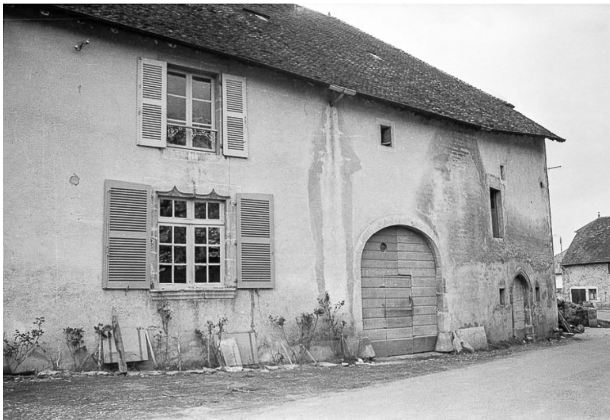
Fenêtre à double accolade.