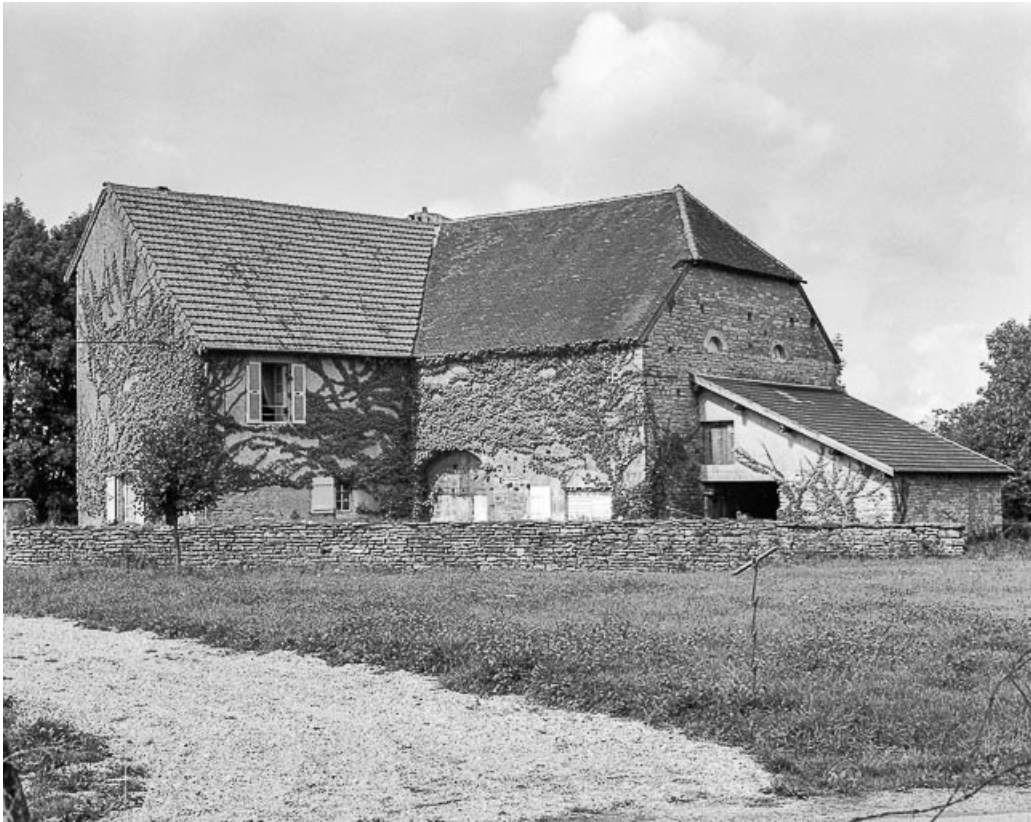
Vue rapprochée depuis le sud-est. 39, Château-Chalon