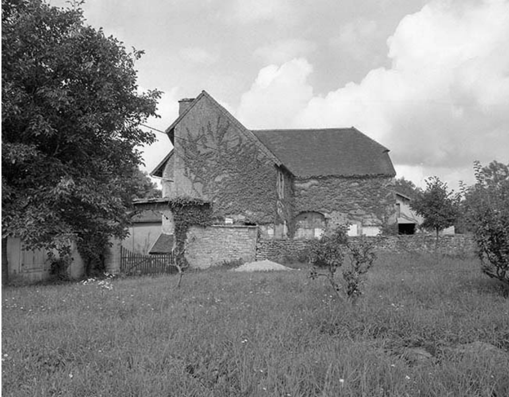
Vue générale depuis le sud.