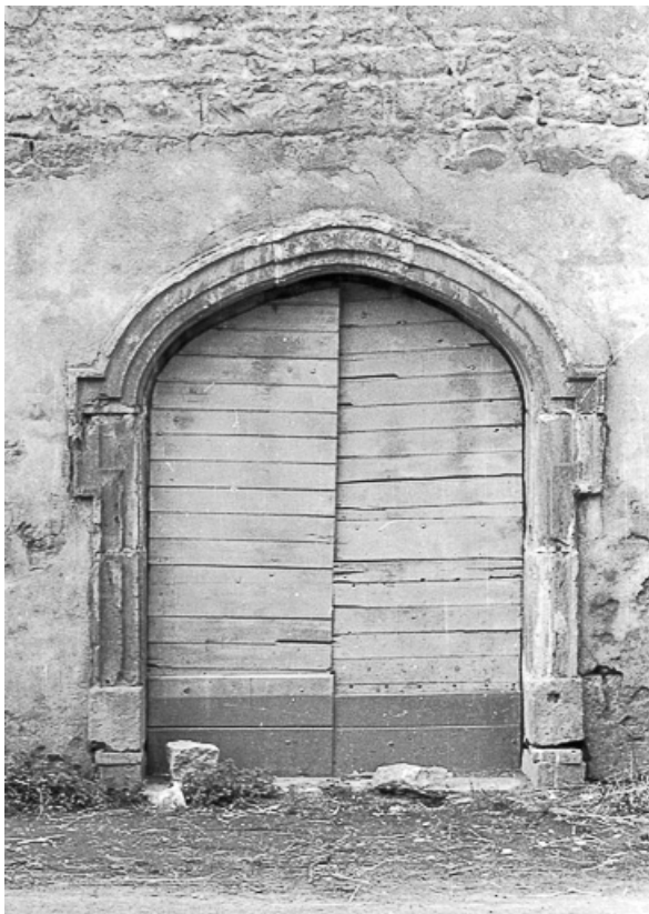
Détail d'un portail.