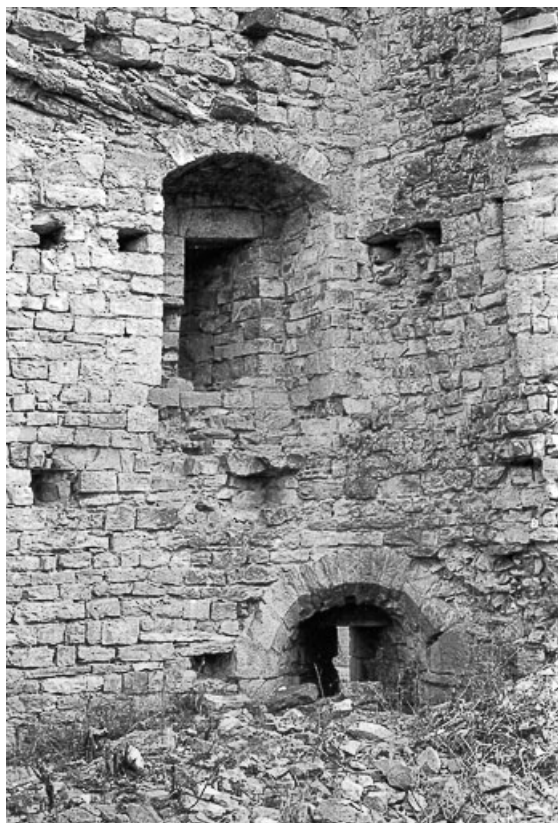
Le château-fort, vue de l'intérieur.