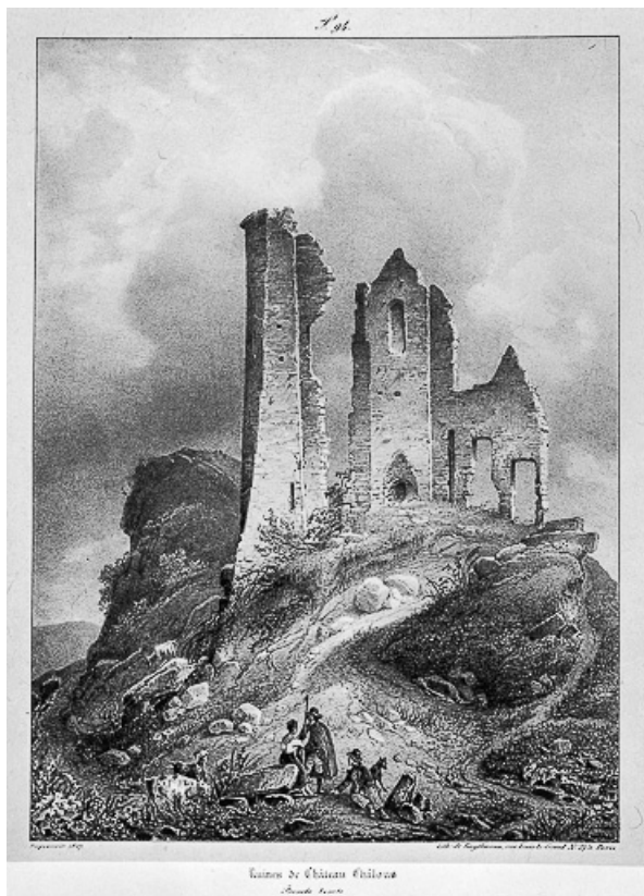
Le château-fort, reproduction de Nodier (J.C.E.), Taylor (L.) et cailleux (A.de).Voyages pittoresques...1825, pl. 94. 39, Château-Chalon