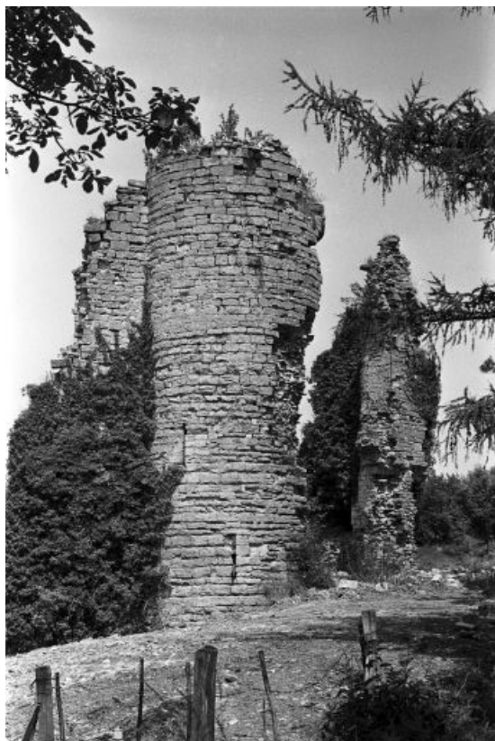
Le château-fort, vu depuis l'est.