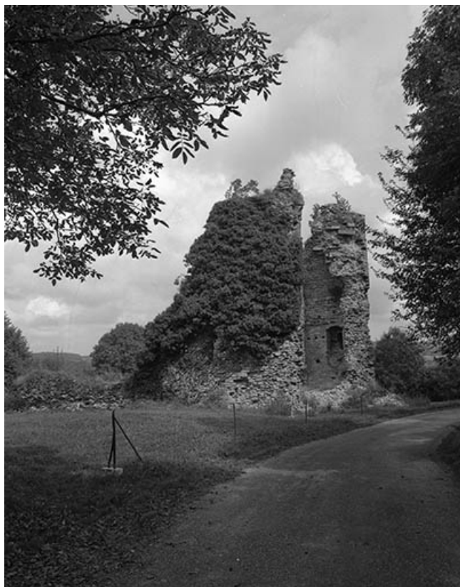
Le château-fort, vu depuis le sud.