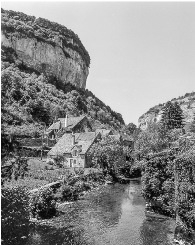
Fermes situées rue Moretin : façades sur la Seille.

39, Baume-les-Messieurs, lieudit : Fravoz