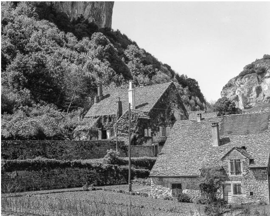
Vue d'ensemble de la demeure et de la ferme située en face.

39, Baume-les-Messieurs, lieudit : Fravoz