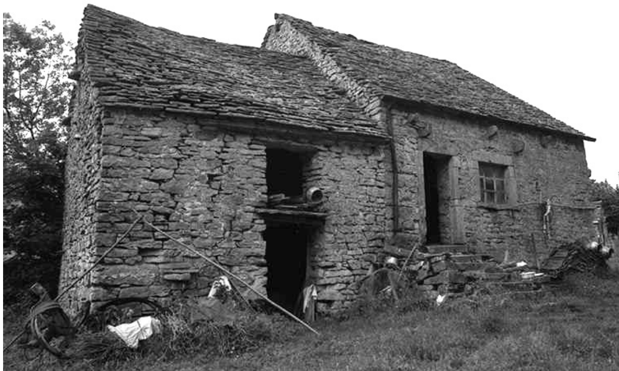
Ferme cadastrée 1960 B 108, située au lieudit La Peyrouse, datée de 1690 : façade antérieure. A noter le toit en lave et les murs pignon en pierre sèche.