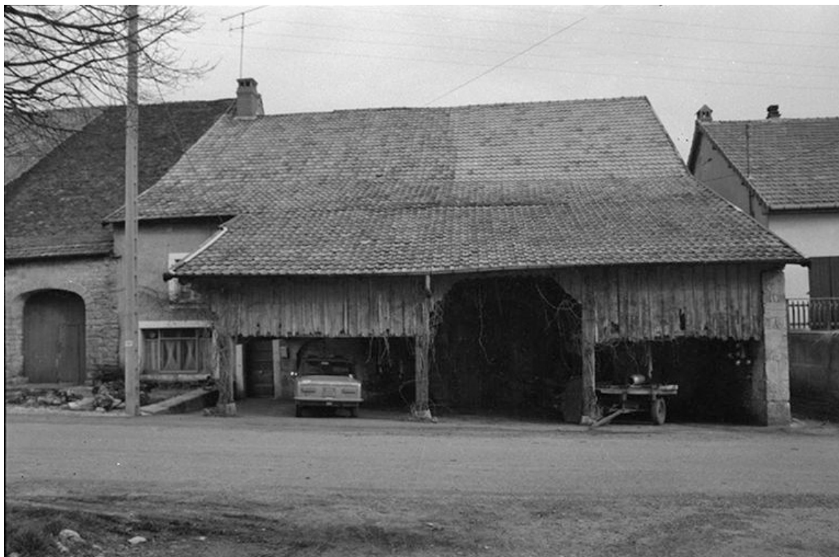
Vue de l' "avant-couvert" en 1974.