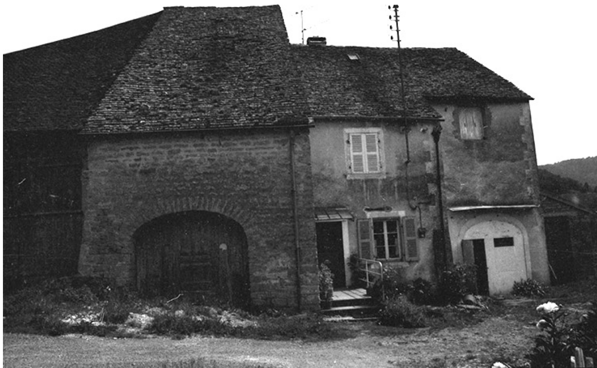
Ferme cadastrée 1960 B 109, située au lieudit La Peyrouse : façade antérieure. 39, Baume-les-Messieurs