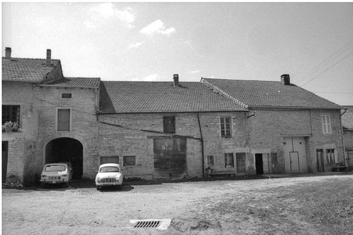
Fermes cadastrées 1965 AB 79-82 situées le long du chemin départemental n° 210 de Crançot à La Marre : façades antérieures.