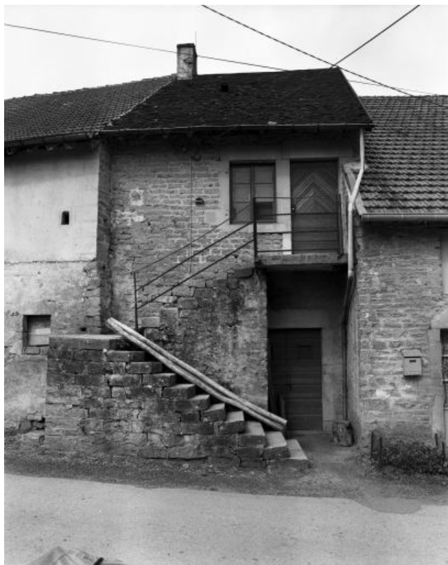
Façade antérieure de face.