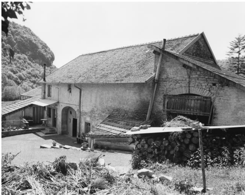
Façade antérieure, vue de trois quarts droit.