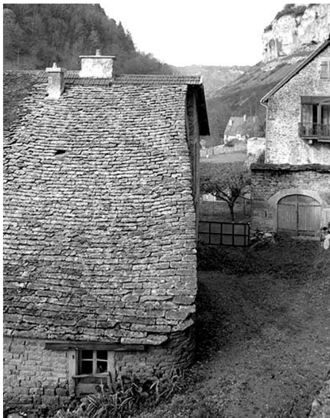
Détail d'une toiture en laves.