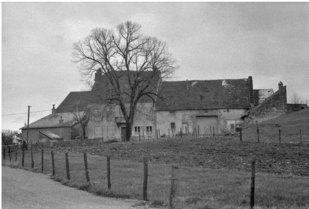
Ferme, fin 18e siècle : vue depuis le chemin 39, Le Louverot