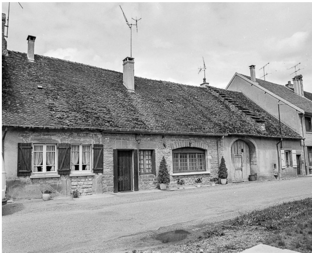
Maison et ferme situées rue de Bréry.