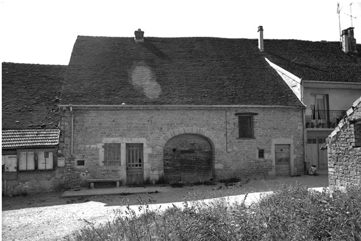
Ferme cadastrée 1951 A3 266 situées le long du chemin départemental n° 208 du Pin à Lons-le-Saunier : façade antérieure.