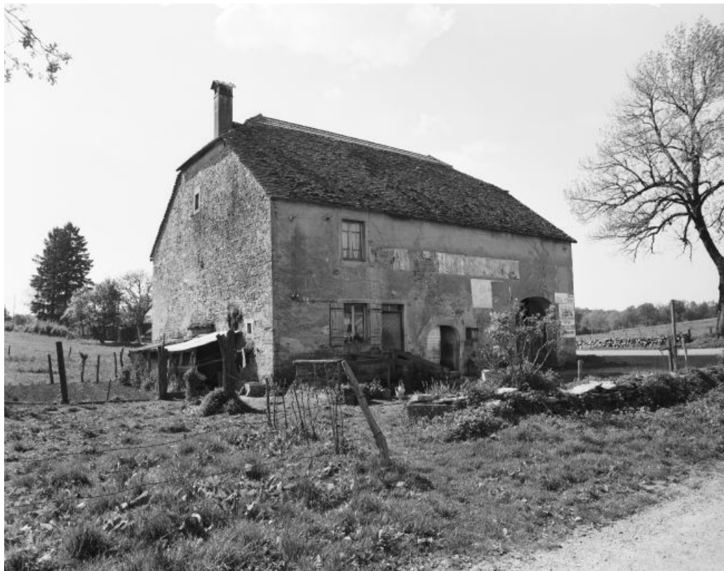
Façade antérieure, vue de trois quarts.