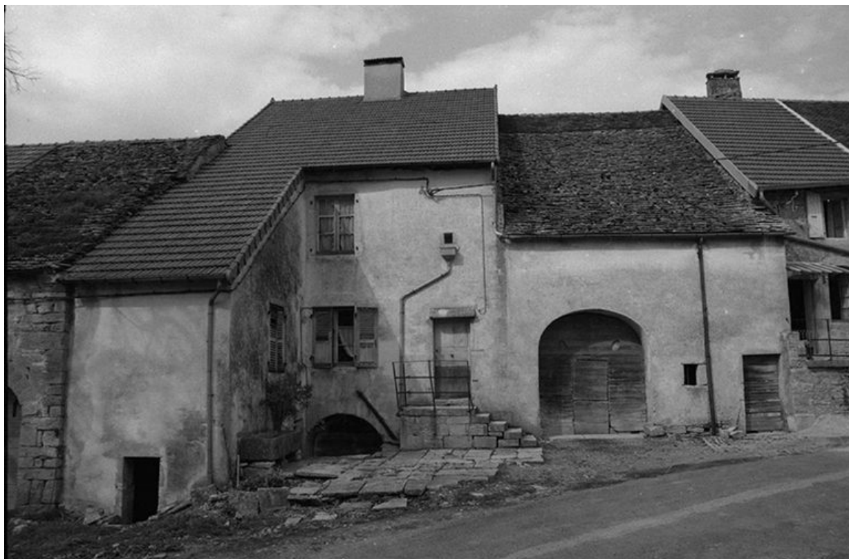
Façade antérieure en 1974.