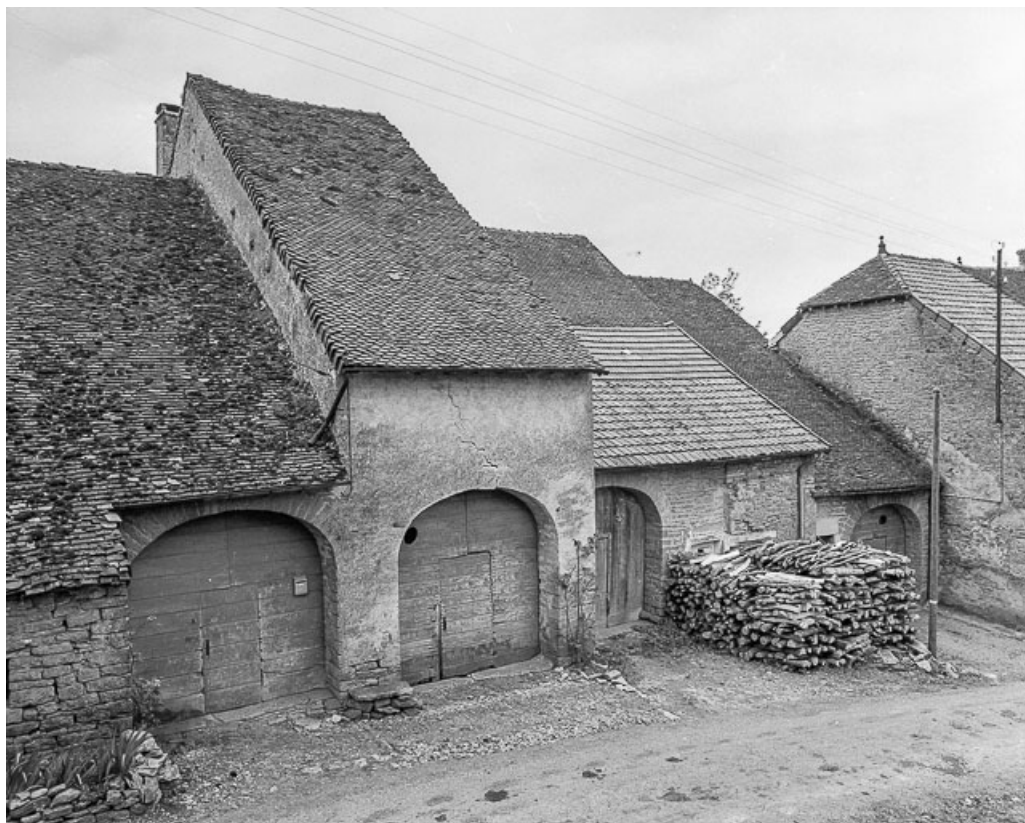
Vue de la façade sur le chemin des Vignes.