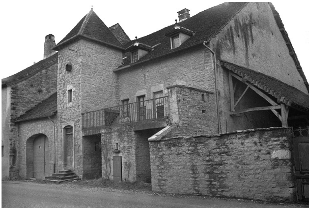
Maison, XVIIe ou XVIIIe siècle : vue depuis la rue. 39, Plainoiseau