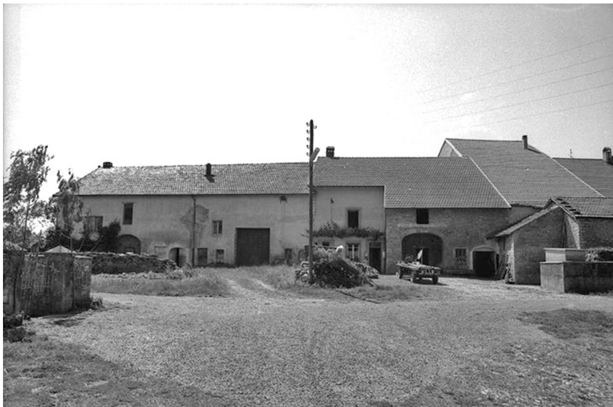
Fermes cadastrées 1965 AB 55 à 58 situées le long du chemin départemental n° 210 de Crançot à La Marre : façades antérieures.