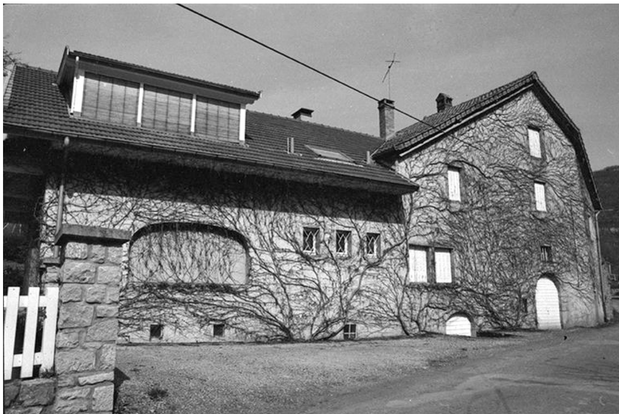
Maison cadastrée 1964 AB 13 : façade antérieure. 39, Blois-sur-Seille