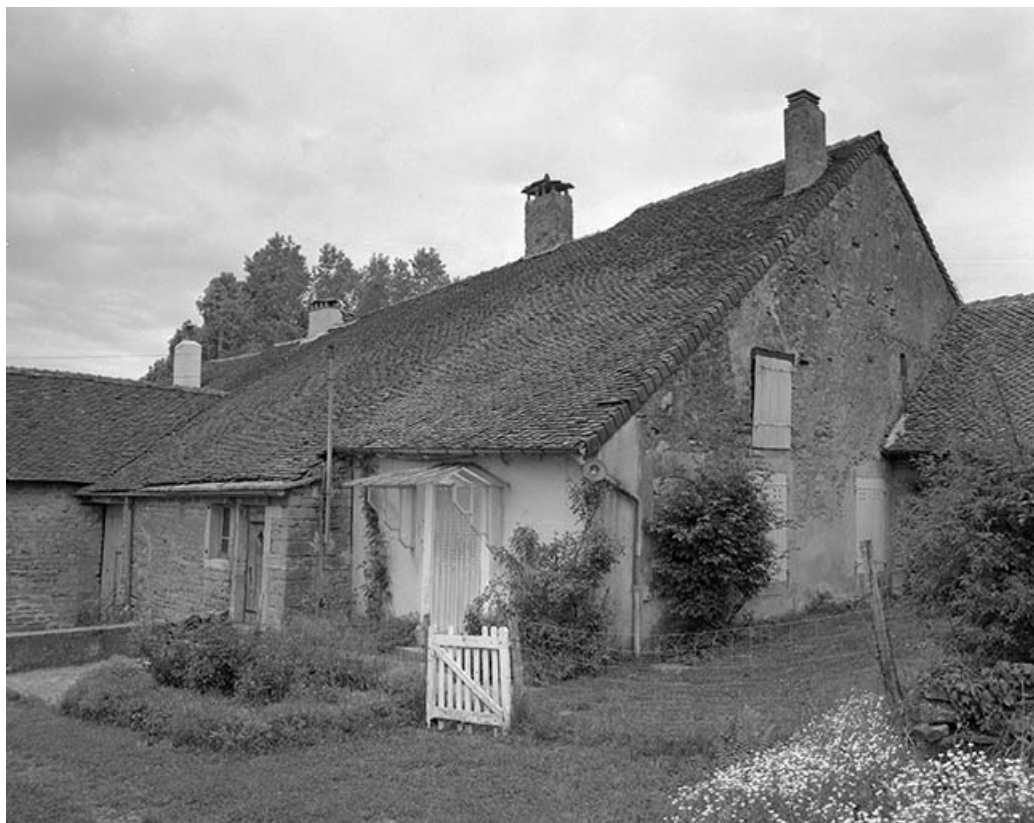
Façade antérieure, vue de trois quarts avec la ferme située à sa gauche.