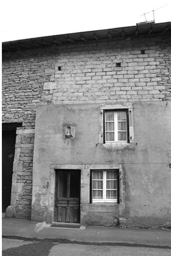
Maison cadastrée 1940 B4 située au lieudit Coin du Dessus, datée de 1728 (?) : façade antérieure. 39, Le Fied