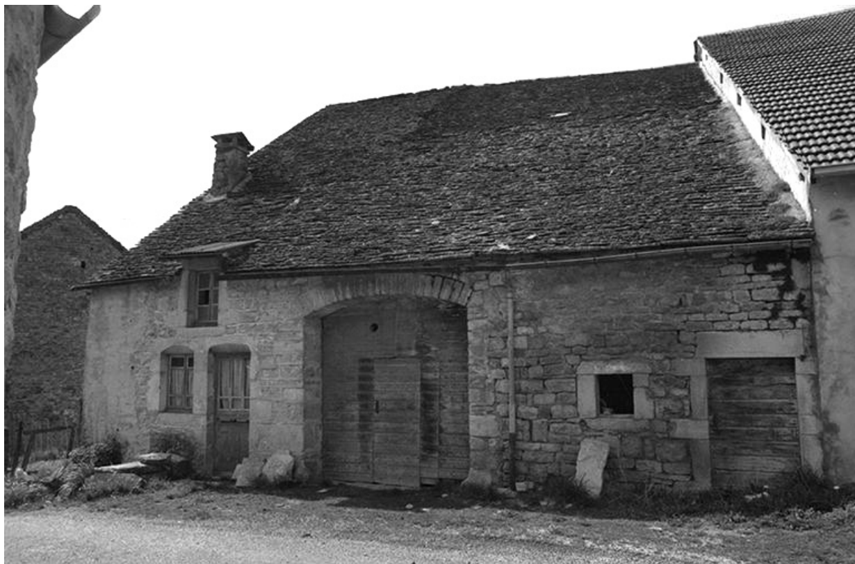
Ferme cadastrée 1964 AB 86 : façade est.