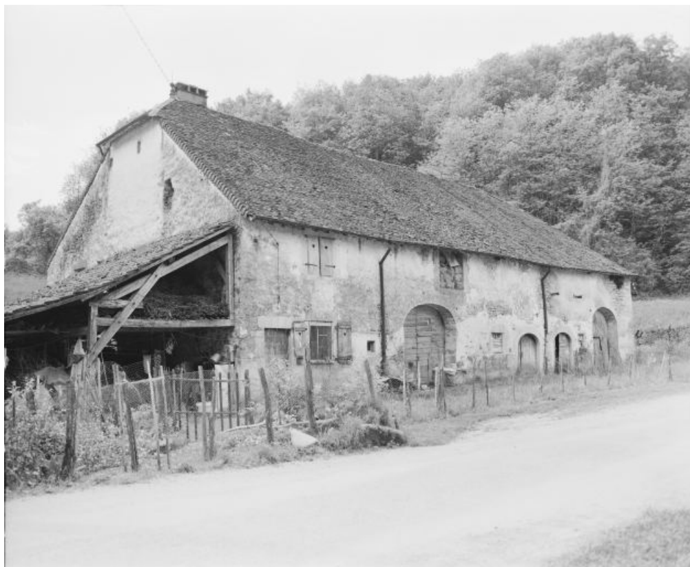
Façade antérieure, vue de trois quarts gauche.