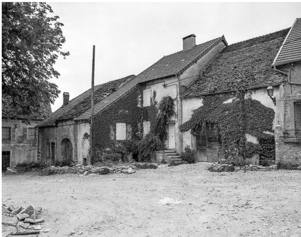
Vue de situation en 1981.