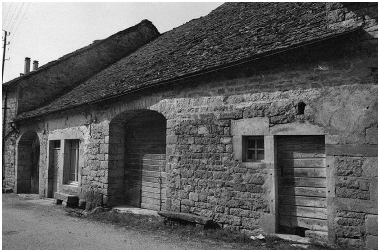
Ferme cadastrée 1964 AB 52 et 53 : façade antérieure vue de trois-quarts droit, toit de laves.