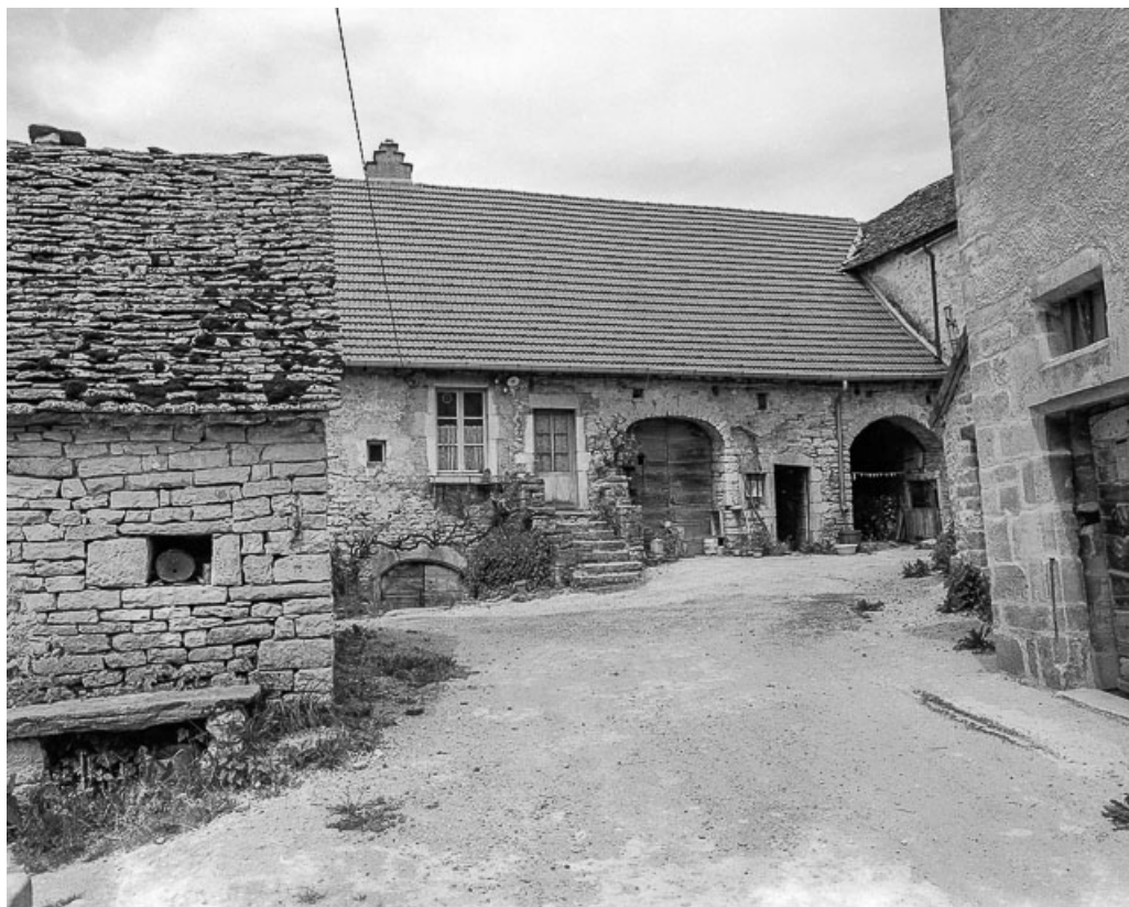
Façade antérieure vue depuis la rue. 39, Baume-les-Messieurs