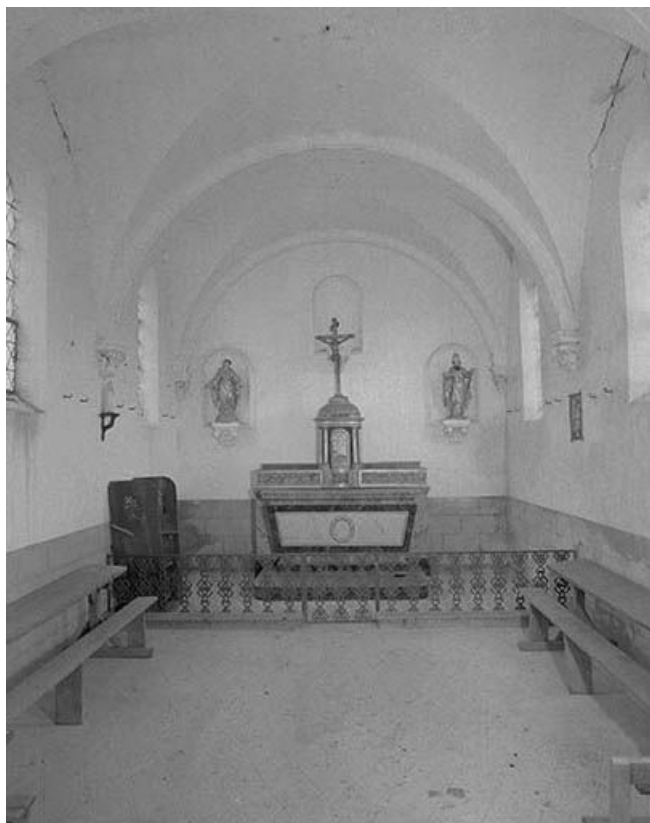
Intérieur : chœur vu de la nef.