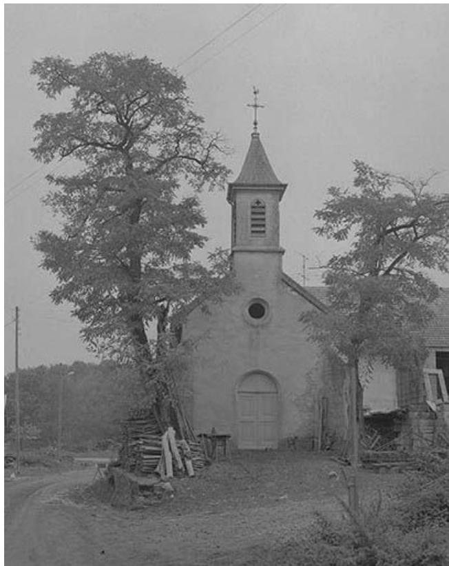
Extérieur : façade antérieure.